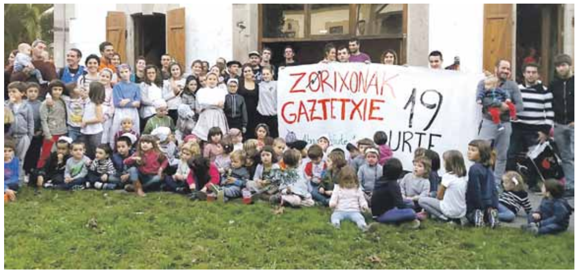
Familia argazkia egin zuten, astelehenean, Gaztetxeak 19 urte bete zituen egunean.