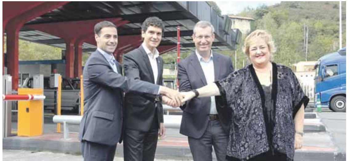
A-8ko bidesariaren aurka protesta ugari egin izan dituzte Durangaldean.

dute, Interbiaken bulegoetan edo webgunean. Dagoeneko Bizkaiko sisteman alta emanda egonez gero, bertan jarraitzeko nahia berretsi behar da soilik. Gidariak OBE edo VIA-T gailua instalatuta eduki behar dute au-