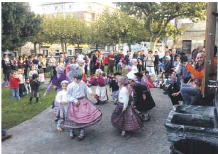
Dantzariak emanaldia eskaini zuten Gaztetxe aurrean.

Azken urteetan bezala, bizikleta martxa egingo dute, bihar, Gaztetxearen urtebetetzea ospatzeko