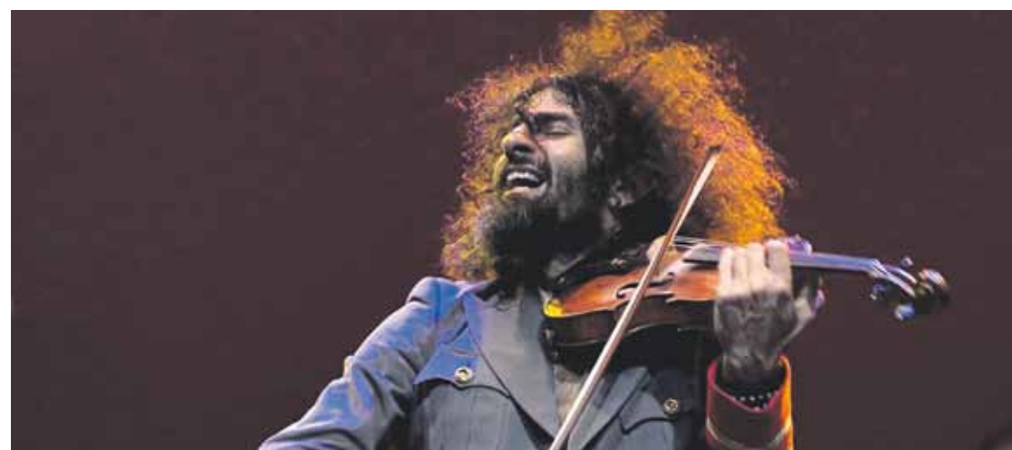
Hirugarren aldiz joko du Ara Malikian musikari armeniarrek Durangon.

Urriaren 31n, Durangoko Hamabostaldiaren barruan joko du Malikianek