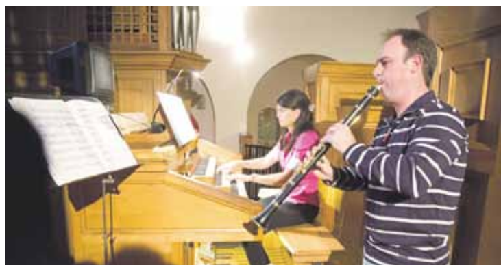
Solasaldia eta emanaldia eskainiko dituzte Cepedak eta Requejok.

Andra Marian izango da emanaldia gaur, 20:15ean