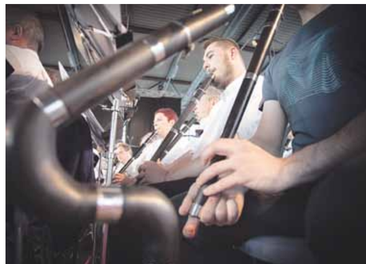
Euskal Herriko hainbat txokotako txistulariek joko dute.

Hainbat musikari eta dantzari gonbidatu dituzte