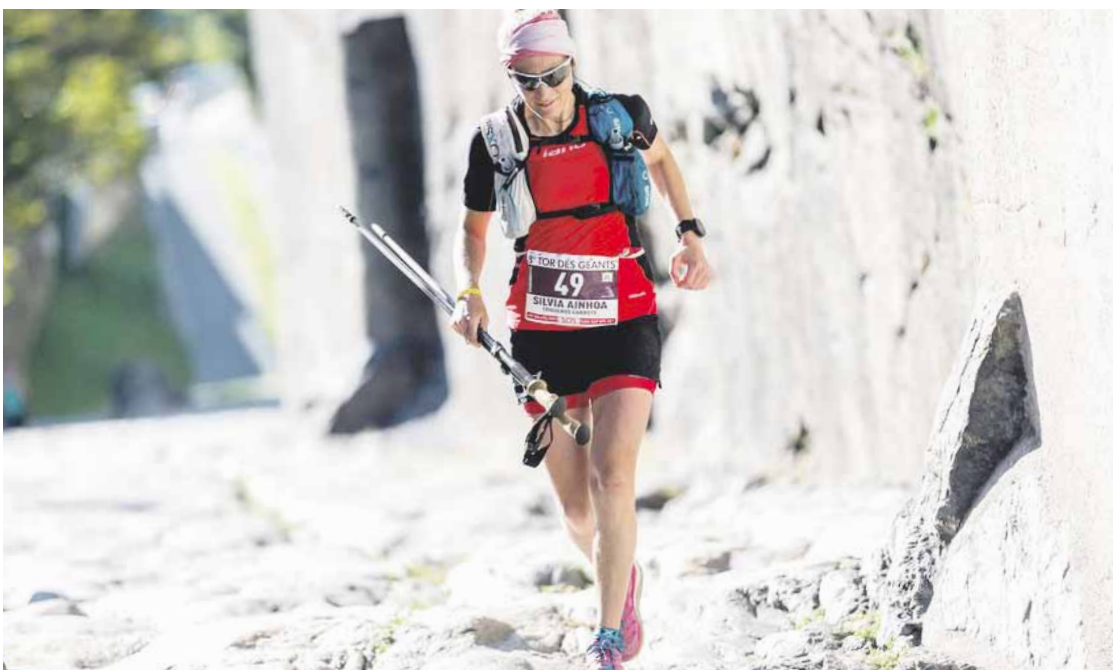
330 kilometro eta 24.000 metroko desnibela ditu Tor de Geants lasterketak.

Hasi nintzenean ez nien horrelako kontuei erreparatzen, baina, azken aldia, apurtxo bat maniatikoa bihurtzen nabil, batez ere, galtzerdiekin. Ehunmilak batean arazoak izan nituen oin-zolan eta harrezkero... Aurten Euskal Herri erdi zeharkatu dut gura nituen galtzerdiak erosteko. Marka konkretu baten bila nenbilen. Ezin nuen aurkitu eta desesperatzen hasita nengoan.