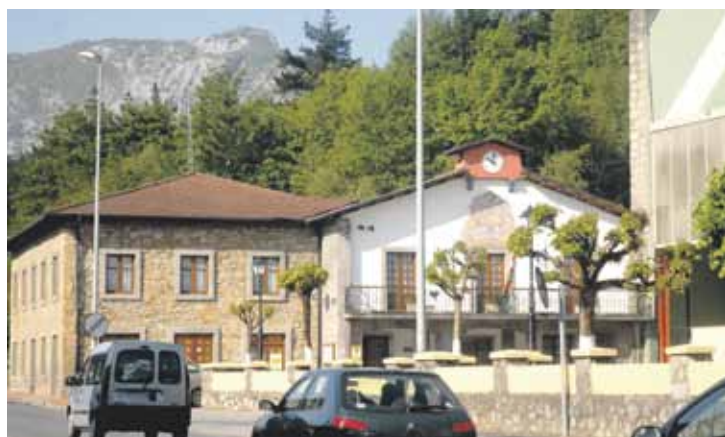
Aurkezpenaren ostean, herritik ibilbidea egingo dute herri ingurua aztertzeko.

Aurkezpen saioa zapatuan izango da, 11:00etan, herriguneko frontoian