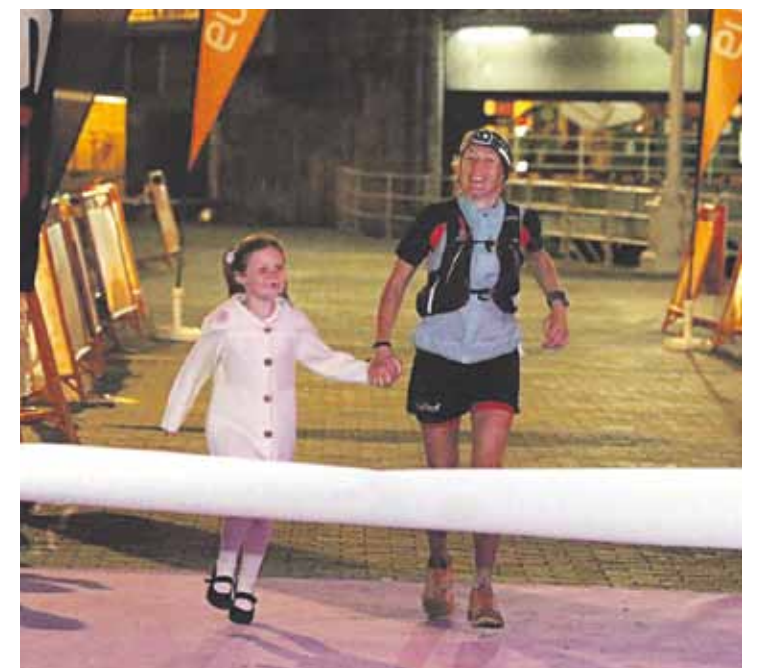
Basque Ultra Trailen helmugaratzen, bere lobari eskutik helduta.