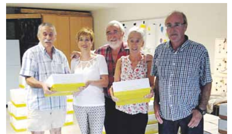
Errigorak hainbat boluntario ditu herririk herri.

Orburuak, pastak, piperrak, olioia eta aran-marmelada egongo dira, besteak beste