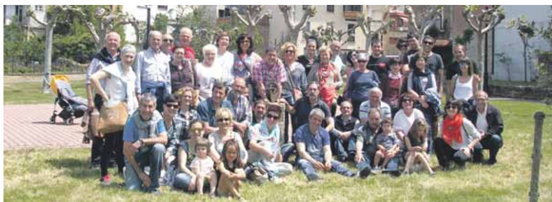
Iaz garaitarrak joan ziren Lantziegora bisitan.

Garai eta Lantziegoko herriak ofizialki senide dira 2013az geroztik