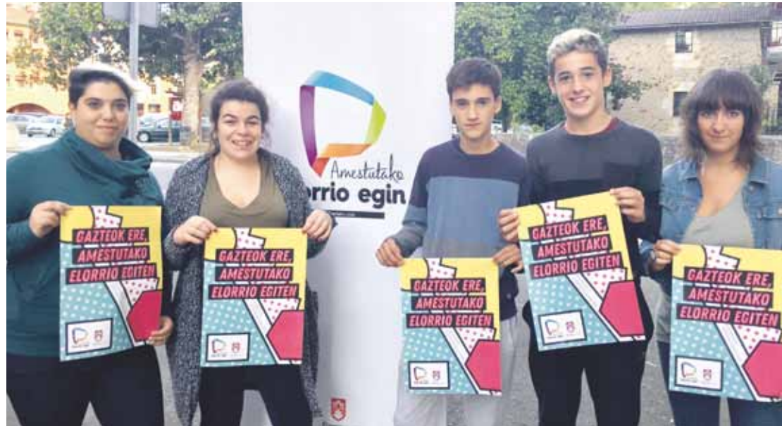
Gazteria Diagnostikoa egin dute Elorrioren, lehen aldiz.

Elorrioko gazteek Ekintza Planeko proiektuen artean aukeratu ahalko dute