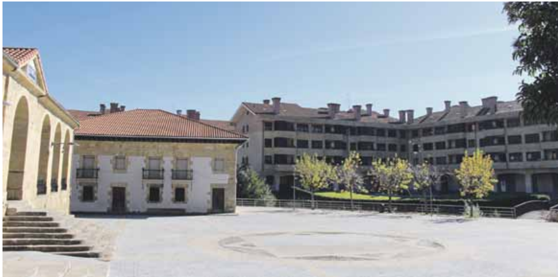
Aita San Migel plaza inguru horretan jendea egotea du helburu egitasmoak, udal aduradunek azaldu dutenez.

Elixalde auzoan dagoen lokalak 140 metro karratuko azalera du