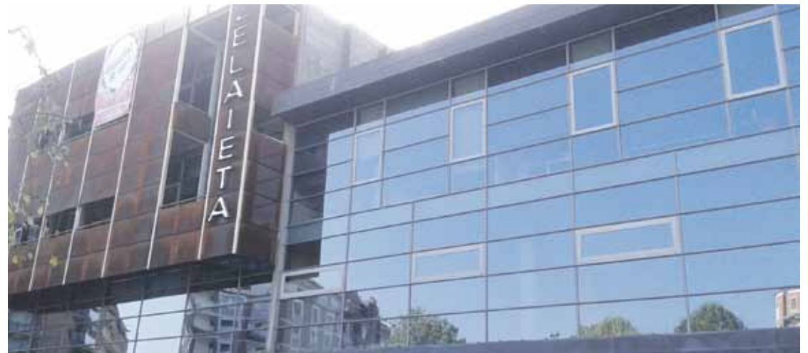
Ametx erakundeak eskaintzen dituen ikastaroak Zelaieta zentroan izaten dira.

Udalak euskarazko eskaintza bermatzeko neurriak hartuko dituela dio