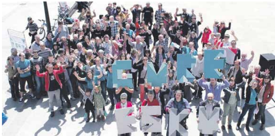
Otxandion talde argazkia atera zuten dinamikaren sustatzaileak.

Euskal Herriko 13 herritan egingo dituzte galdeketak azaroaren 5ean