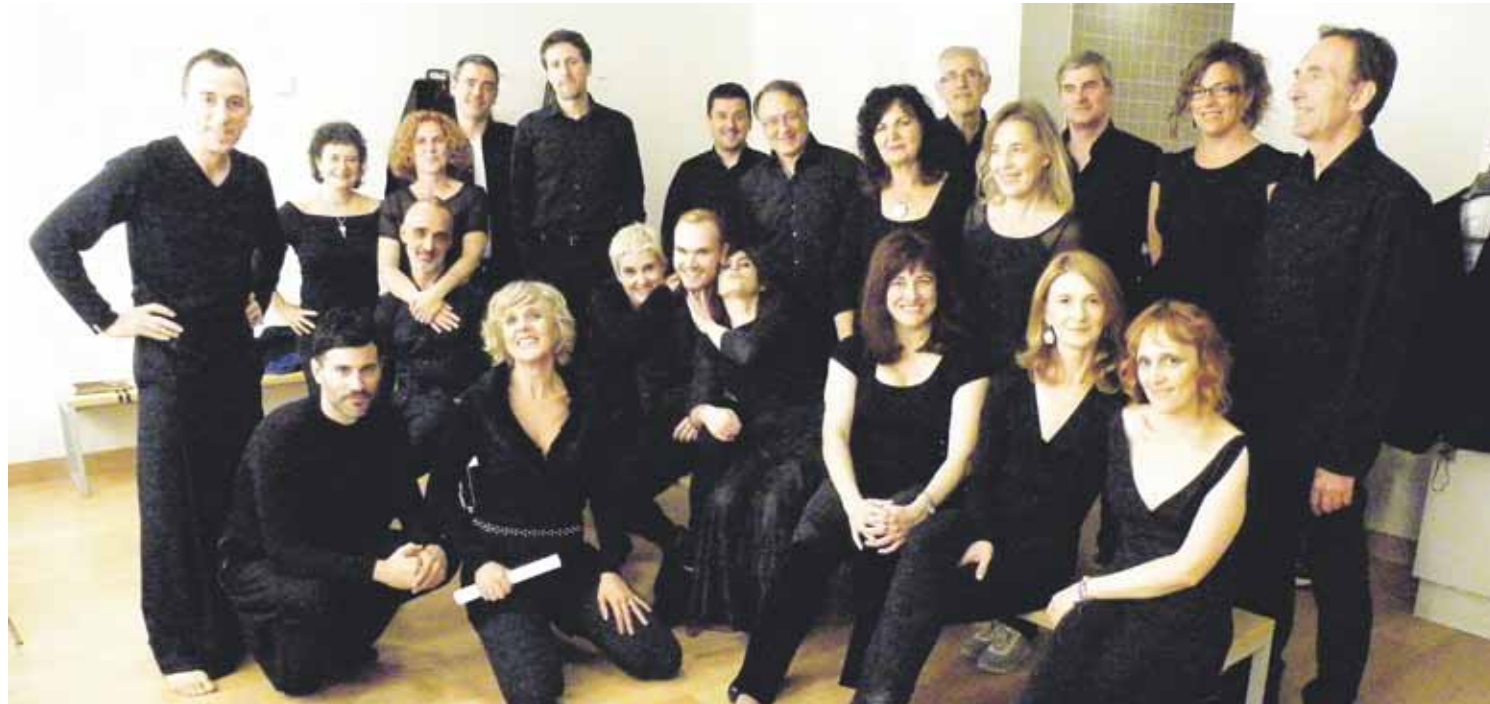
Bogoroditsie taldeko 20 abeslarik baino gehiagok, musikariek, dantzariak eta aktoreek parte hartzen dute ikuskizunean.

Bogoroditsie abesbatzak 'Herejía' estreinatzeko bi emanaldi eskainiko ditu Kurutzesantu Museoan, bihar