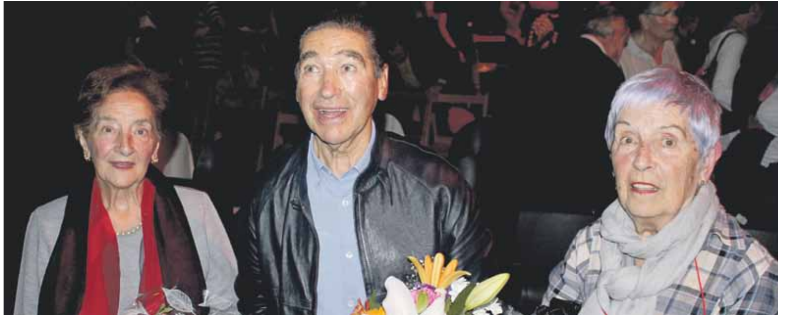
Iazko 'Agurrik gabeak' ekitaldiko irudia.

Durangaldeko bi familiak memoria historikoaren transmisioa zelan bizi izan duten kontatuko dute