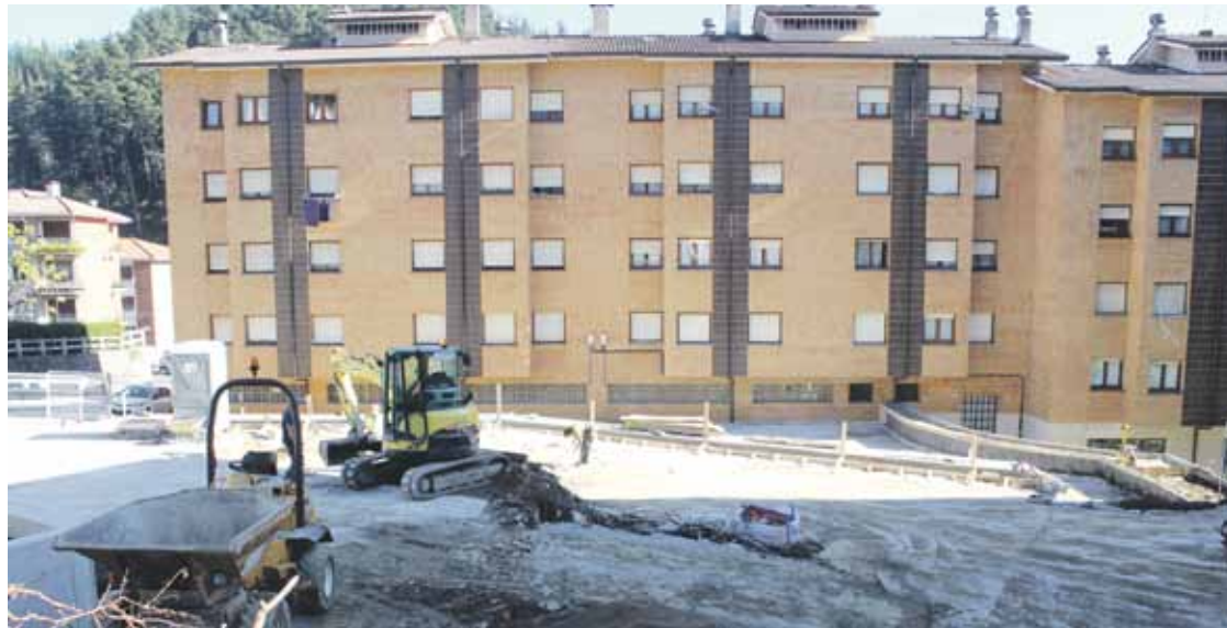
Iturritza kaleko berrurbanizazioaren bigarren fasea egiten dabilta.

Urte amaierarako bukatuko dituzte Iturritzako berrurbanizazio lanak