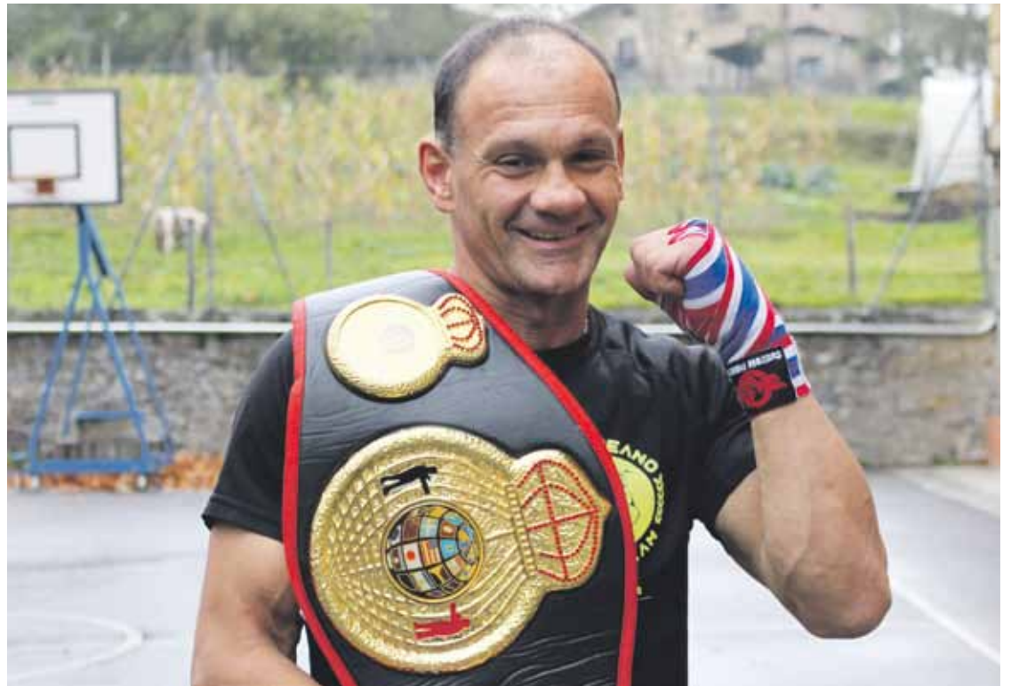
Berrizen 30 urte baino gehiago daramatza karatea irakasten.

Ez du ibilbide erraza izan. Arantzak ere izan ditu bidean, baina bizitzako “irakasbide” moduan hartu ditu. Eta ibilbide luze horren amaieran, “bere buruagaz bakean” erretiratzeko aukera eskaini dio hainbeste eman dion kirolak. Kickboxingean Espainiako Txapelketa lehiatzeko aukera eskaini diote aurten. “Baietz erantzun nuen. Merezitako moduan erretiratu gura nuen. Hainbeste urteko