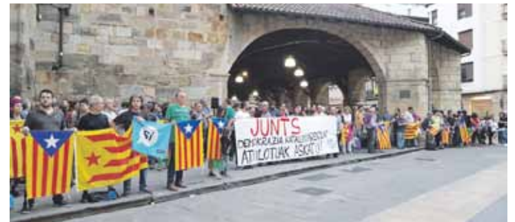
Durangon jendetza elkartu zen mobilizazioan.

Horrez gainera, Durango-ko Udalak kartzelaratzeari horren aurkako udal adierazpena onartu du, EAJ, EH Bildu eta Herriaren Eskubidearen botokin. Atxilotuei babesa erakutsi, eta haiek askatzeko exijitu du.