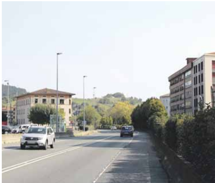
Herrigunea eta plazaren ingurua batuago egotea du helburu proiektuak

Errepidearen tarte hori berrantolatzekeo, 1,5 milioi euro inbertituko dira. Hori azaldu du Aldundiak, Bidesarea 2015-2019 planaren barruan herrialdeko errepideetan egingo dituzten obren berri ematean. Iurretak ere egin beharko dio aurre inbertsio horri, zati batean. Urtea