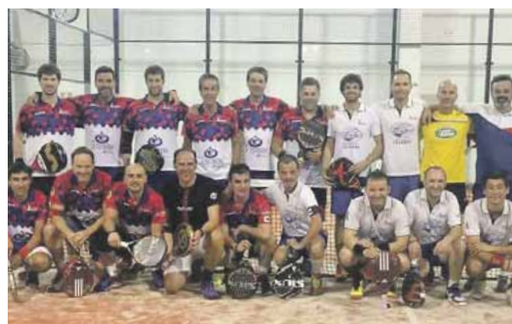
Padelzaleak taldeko kide batzuk.