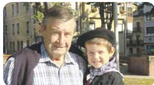
> Durangoko Angelek eta bere iloba Liherrak urteak betetzen dituzte urrian. Zorionak eta musu handi bat familia guztiaren partez. Ondo pasa!