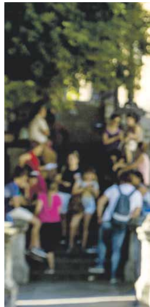
Sarrionandia, Habanan, 2016ko azaroan argitaratutako