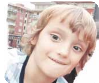
> Zorionak, potxolo! Oso ondo pasa eguna. Jarraitu beti bezain alai! Muxu asko familia guztiaren partez.