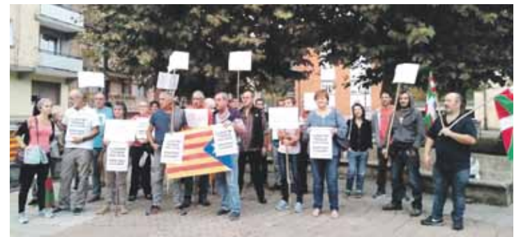
Berrizen kartelak eta banderak eskutan egin zuten protesta.