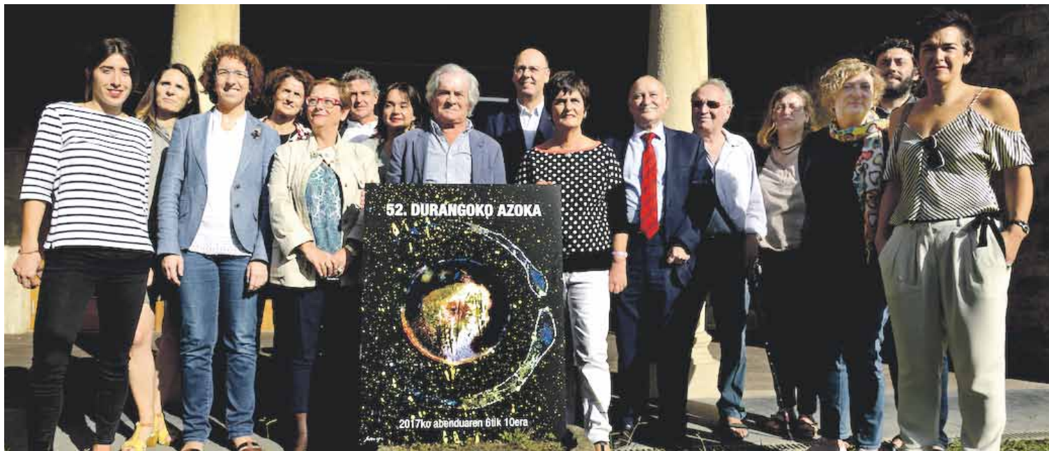
Gerediaga Elkarteko eta Azokako guneetako kideak eta azoka babesten duten erakunde publikoetako ordezkariak batu ziren prentsaurrekoan. Txelu Angoitia

Abenduaren 6tik 10era egingo den 52. Durangoko Azokaren kartela aurkezteko agerraldia egin dute, asteon