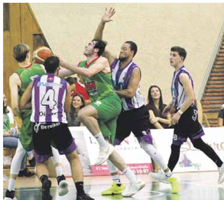
Asteburuan Valle de Egües taldearen kontra jokatuko dute.