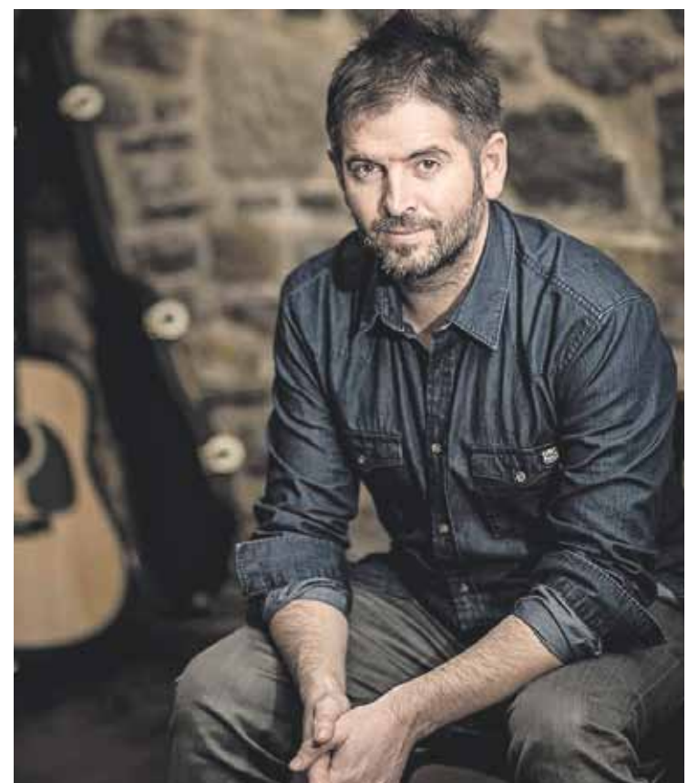
Azaroan hiru kontzertu eskainiko ditu, bakarka, Argentinan.

Datorren hilean, hiru kontzertu eskainiko ditu Argentinan; Buenos Airesen, La Platan eta San Nicolasen joko du. San Nicolasen, hango Arte Eskolako musikariek arituko da. Margolaria ko kantak ikasten ari dira musikari argentinarrak saio horretarako. Argentinatik bueltan, Durangoko Plateruenean arituko da, azaroaren 25ean.