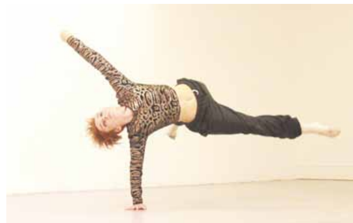
Gestalt terapiako teknikak baliatuz sortu dituzte ‘Funtzak’ obrako koreografiak.

Obra kalean egiteko moldatzeko ere prest geundeko, gainera.