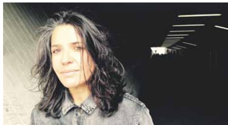
Lau musikarik lagunduta jardungo da Anari.

Ostera zikloaren lehenengo hitzordua izango da Berrizko Kultur Etxeko biharkoa. Epilogo