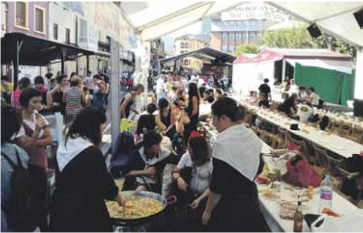
Txosnaguneko paella lehiaketan 800 bat lagun batu ziren.