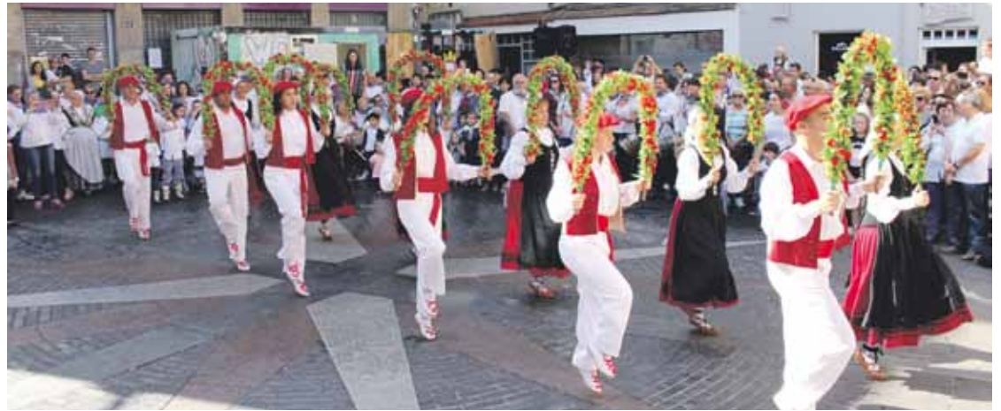
San Fausto eguna eguzkitsua izan zen. Irudian, Kriskitineoak, artopilen banaketa ostean.