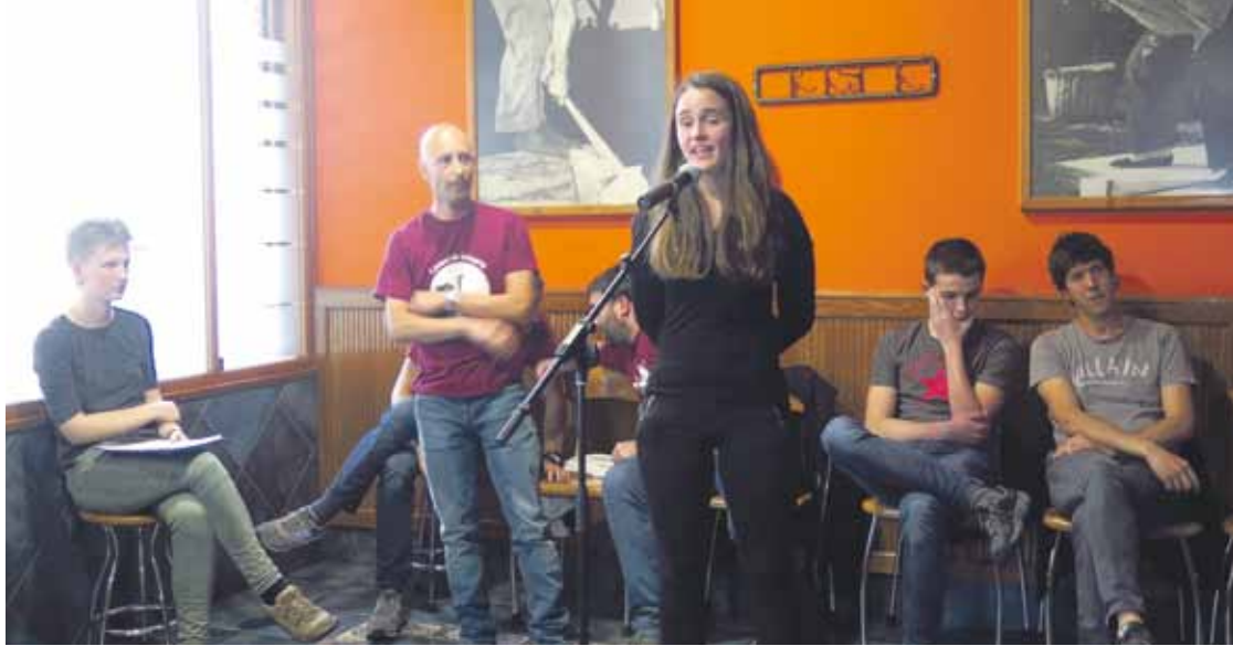
Durangaldeko bertso eskolen ikasturte hasierako jaia Zaldibarren ospatuko dute, urriaren 27an.

Bertsolaritzari buruzko hiru hilabeteko ikastaroa antolatu du udalak