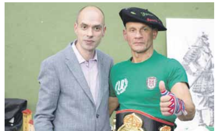
Berrizen, Orlan Isoird alkateagaz batera. Laureano Fight Club