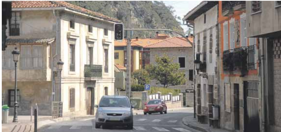
Azken urteetan jaiotza kopuru handia egon da Mañarian, baina datorren hamarkadan kontrako joera nagusitu daiteke.

30 eta 44 urteko 128 herritarrek biztanleria osoaren %24,7 dira. Portzentaia hori "Hego Euskal Herriko udalerririk askorena baino garrantzitsuagoa da", azterketak jasotzen duenez. Horren ondorio da azken