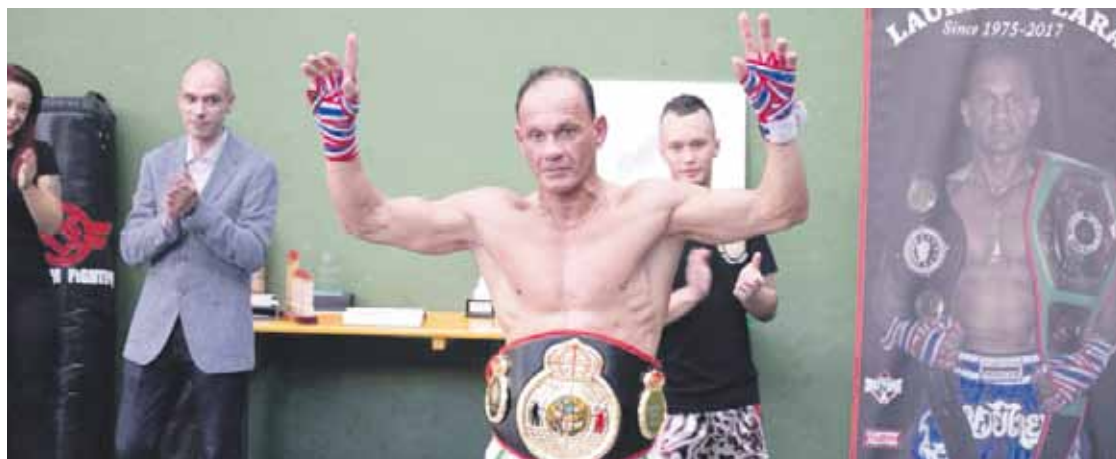
Berrizko omenaldian erakustaldia eskaini zuen bere lagun eta zaleen aurrean. Laureano Fight Club

gustatzen zait. Kolpeak irakastea baino gehiago da. Ikasleak ezagutu behar dituzu, zer arazo duten eta zelan lagundu ahal zaien. Psikologo lana ere eskatzen du. Heziketa prozesu bat ere bada, azken batean. Nik horrela ulertzen dut eta modu horretara jokatzeko ahalegintzen naiz”, adierazi du berriztarrek.