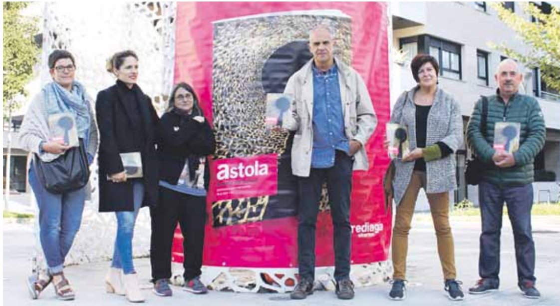
Astolaren 11. zenbakiko azalean agertzen den eskulturaren alboan egin zuten argitalpena aurkezteko prentsaurrekoa.

Durangaldeko historia, ondarea eta gaurkotasuna, Gerediagaren eskutik