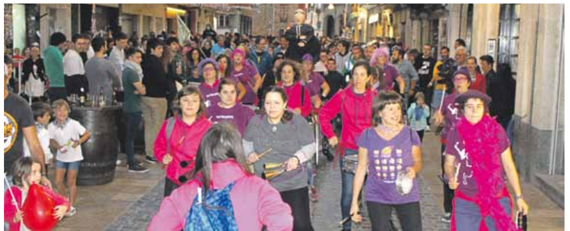
Txosnaguneko egitarauari kalejira batez eman zioten hasiera.

Eztabaidaren ostean, jaia Txosnetan eguaztenean ekin zioten egitarauari, dispersioaren aurkako taldearen pregoiagaz. 30 urte dira presoen saka-