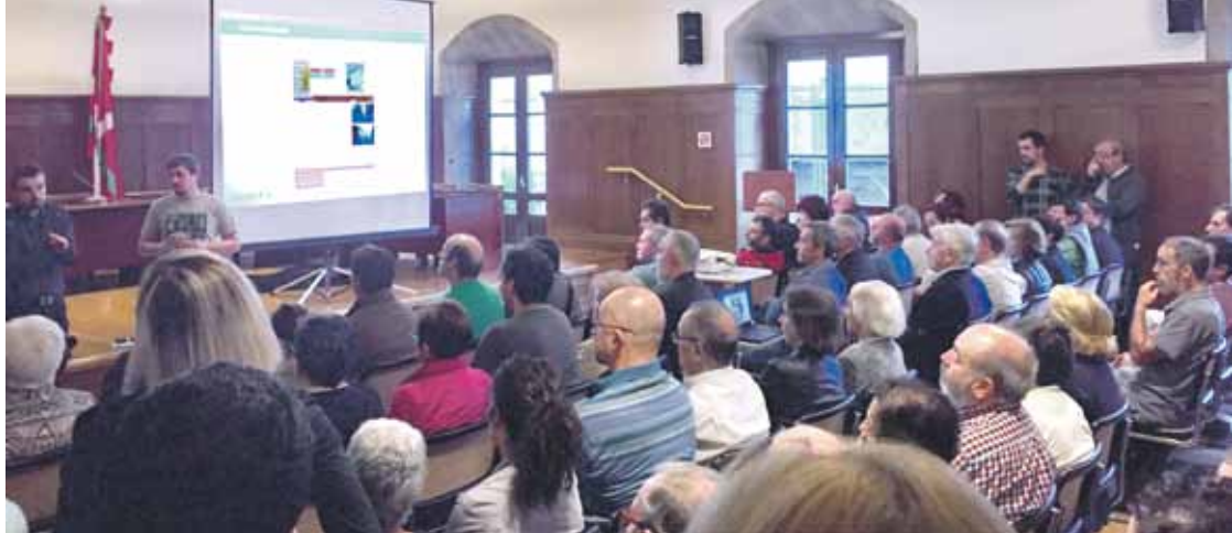
Egoeraren berri emateko Alde Zaharreko bizilagunekin batzartu zen udala.

2018an azterketa bat egingo dute, termitek duten eragina ikusteko