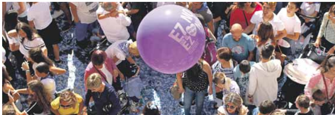
Txupinazoaren momentuak eraso sexisten kontrako aldarria zabaldu zuten.

‘Erastop’ izeneko App-a jaien ostean ere martxan egongo dela iragarri dute