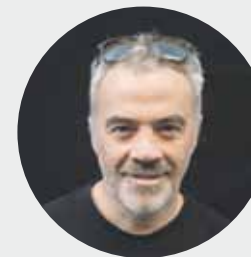
Diego Martin Attrezzista Durango 1976

Astelehenetik Vitoria 3 de marzo filmean lanean dabil Gariza Films. “Kontatu beharra zegoen istorio bat, zine soziala”, kasu honetan.