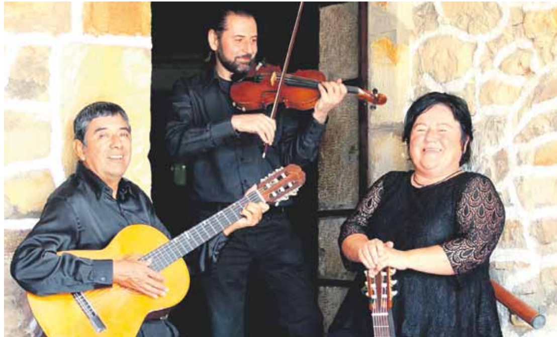
Elorrioko Ilargi dendan eta emanaldietan eskuratu ahaliko da disko berria.

Arriolan aurkeztuko dute 'Todo Cambia', datorren barikuan, 20:30ean