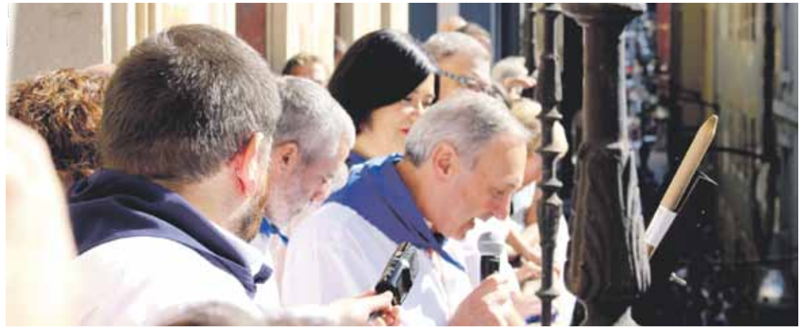
Udaletxeko plaza jendez bete zen atzo, txupinazo ofizialean. Irudian, odol-emaileen elkartekoak pregoia irakurtzen.