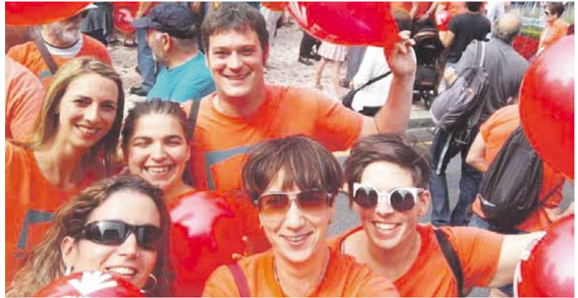
Irailaren 19an galderaren aurkezpena egingo dute.

Herri galdeketa egingo dute azaroaren 5ean, Atxondon eta Otxandion