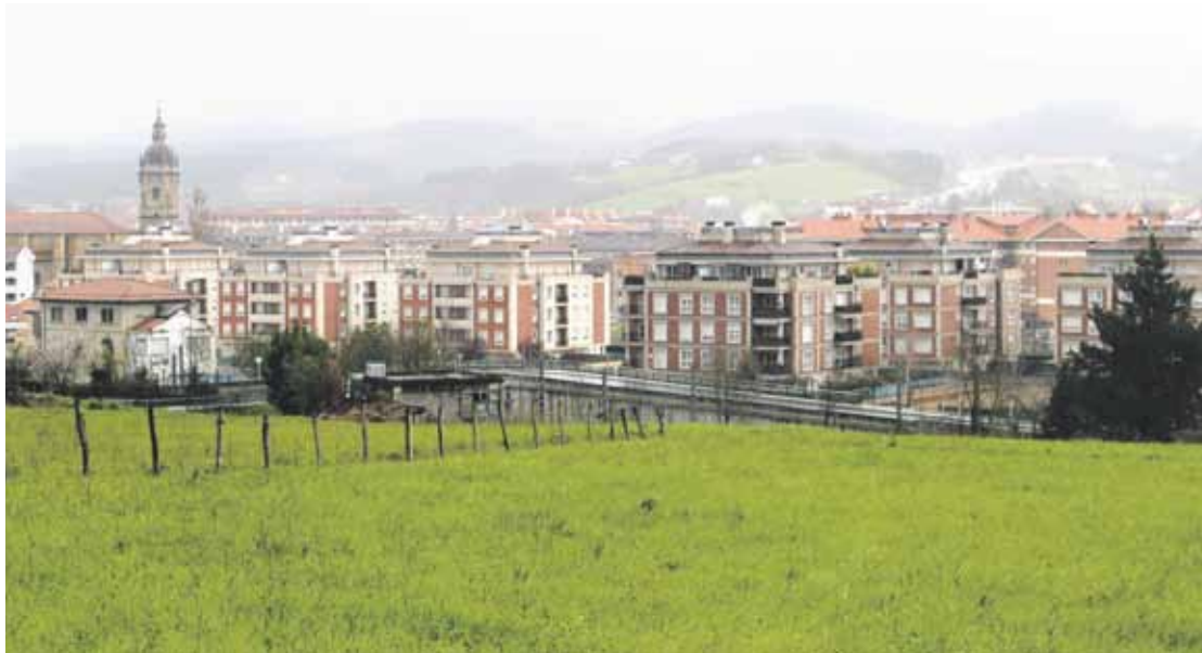
2010etik hona iraun du lehenengo planak; aurten onartu dutena 2025ean iraungiko da.