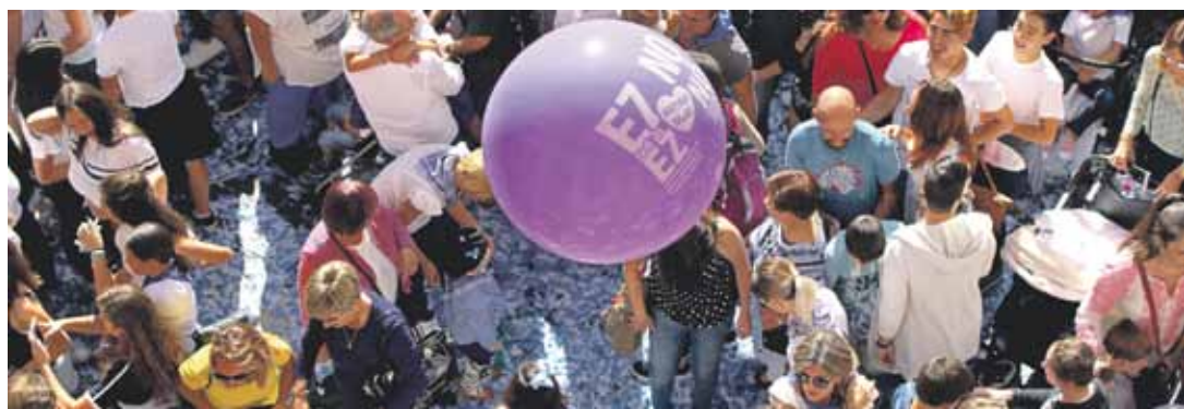
Txupinazoaren momentuak eraso sexisten kontrako aldarria zabaldu zuten.

‘Erastop’ izeneko App-a jaien ostean ere martxan egongo dela iragarri dute