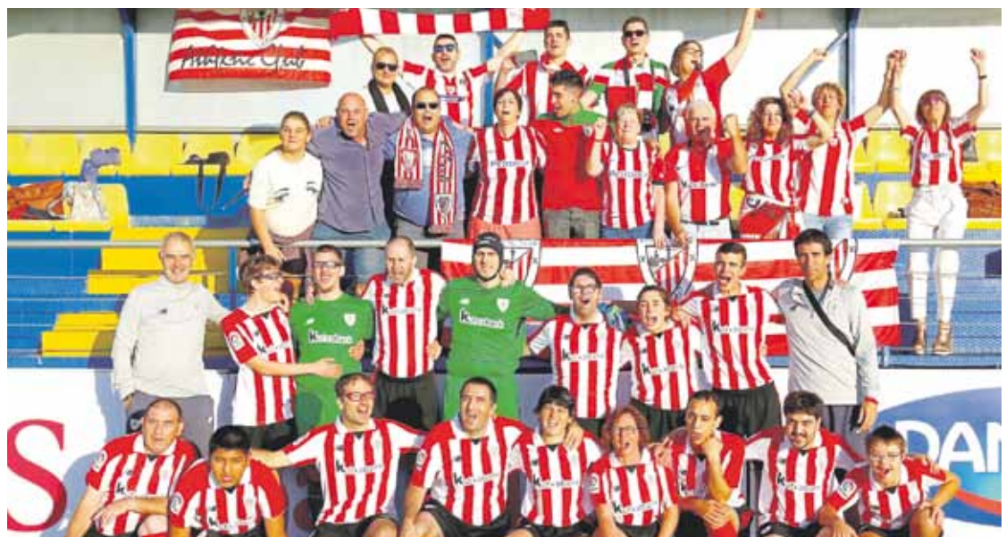
Athletic taldearen eta bertaratutako zaleen familia argazkia. La Liga