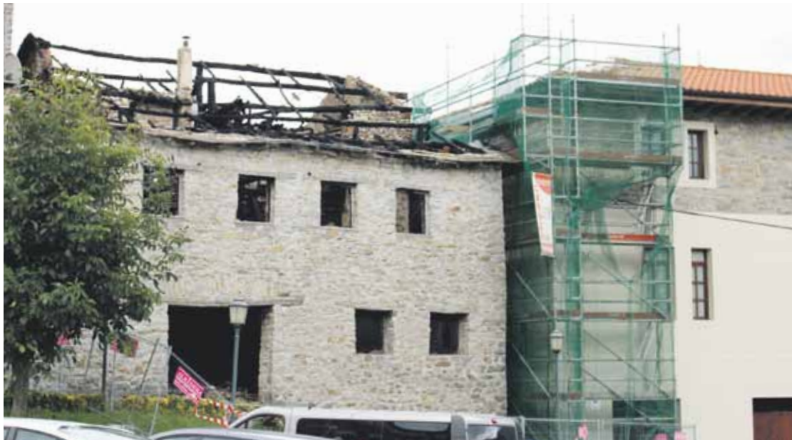
Mallabiko kultur etxearen ondo-ondoan dago suteak erre zuen etxebizitza.