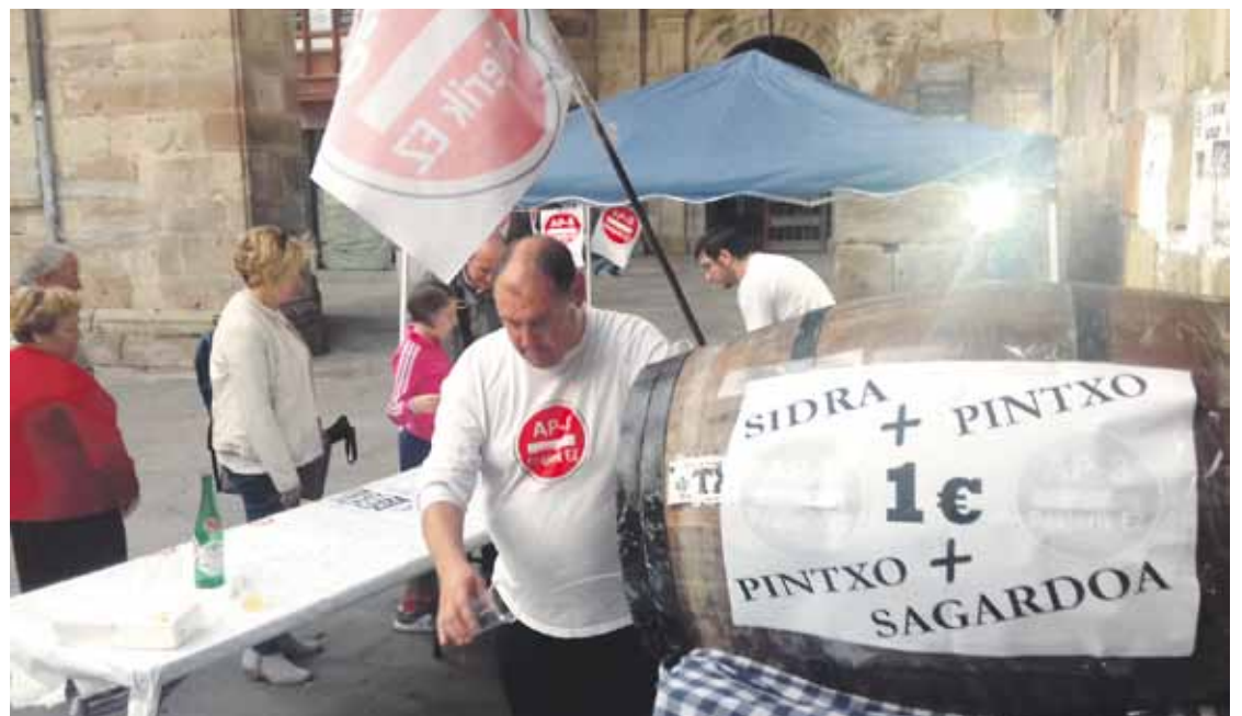
Plataformako kide bat sagardoa kupeletik hartzen, herritarrei banatzeko.

Iaz hasitako protesta jendetsuen ostean, eztabaida handia sortu zen bidesariaren inguruan. 20.000 sinadura batu zituzten, adibidez. Gero, Aldundiak 30 euroko urteko bonua atera zuen, erabiltzaileei begira. Baina, plataformakoak ez daude ados, eta autobidea doakoa izan behar dela uste dute.