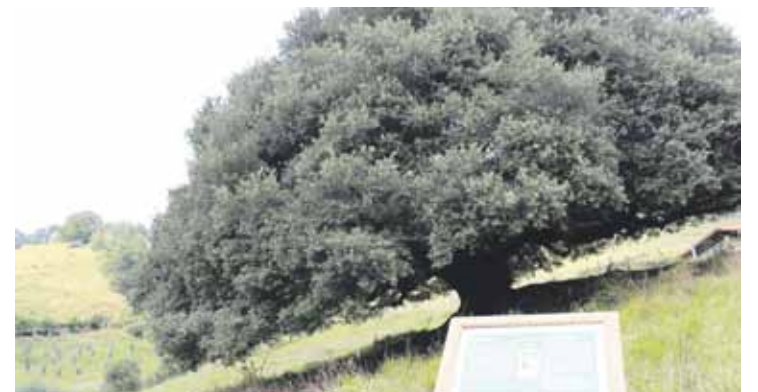
Artearen parean kokatu dute plaka.

Joan zen asteburuan, hainbat lagunek bisitatu ahal izan zuten artea, Gerediagak eta udalak antolatutako Ondare Jardunaldiaren baitan.