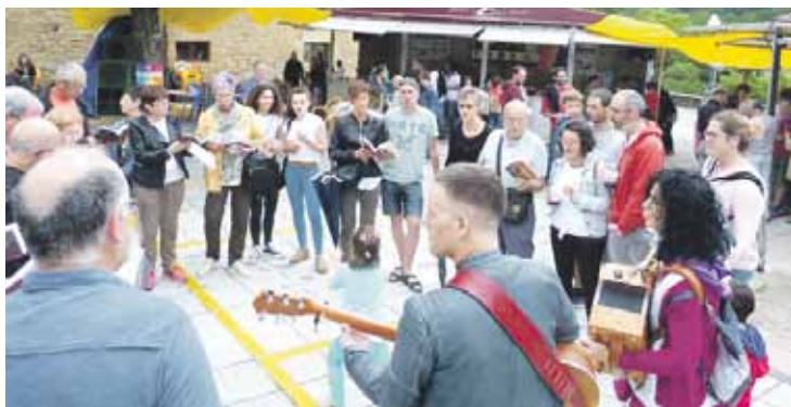
Berrizko jaietan kantuan ibili ziren.