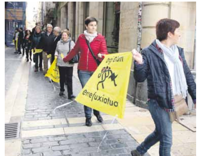
Durangon makina bat mobilizazio egin dira errefuxiatuen alde.

Herritarrei dei egin diete biharko ekimenean parte hartuz, eta errefuxiatuen aldeko kamisetak, zapiak, banderolak eta motxilak eramatera gonbidatu dituzte.