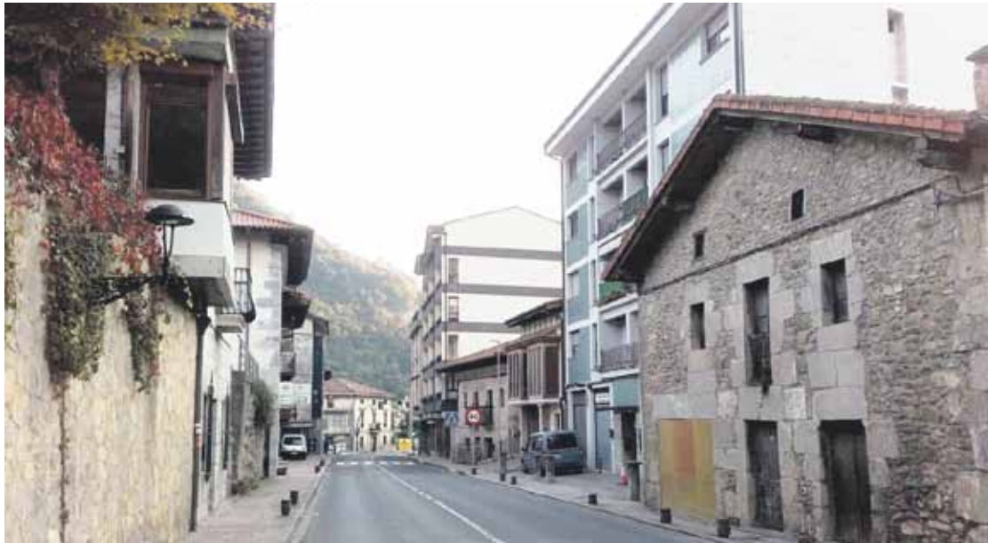
Hutsik egon daitezkeen bizilekuek 69 landa eremuan daude, eta gainerako 77ak herrigunean.