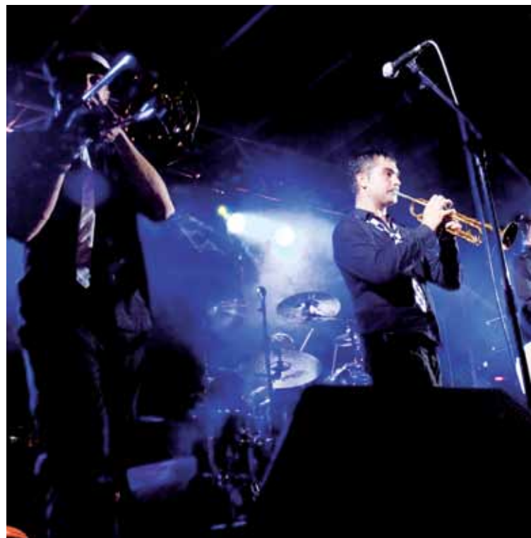
Nafarroako Vendetta taldearen doinuek girotuko dituzte sanprudentzioak.