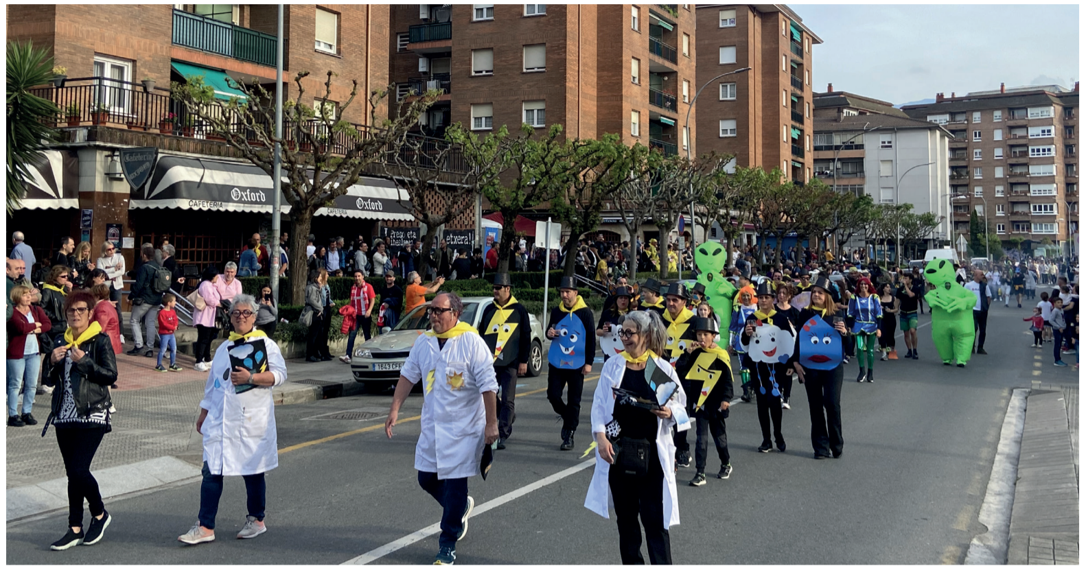
Iazko Mozorro Eguneko argazkia. Klima aldaketa izan zen gaia.

Gazte Eguna sanprudentzioetako ekitaldirik jendetsuenetarikoa izaten da. Urtero 200 bat gazte batzen dira. Jaietako lehenengo do-