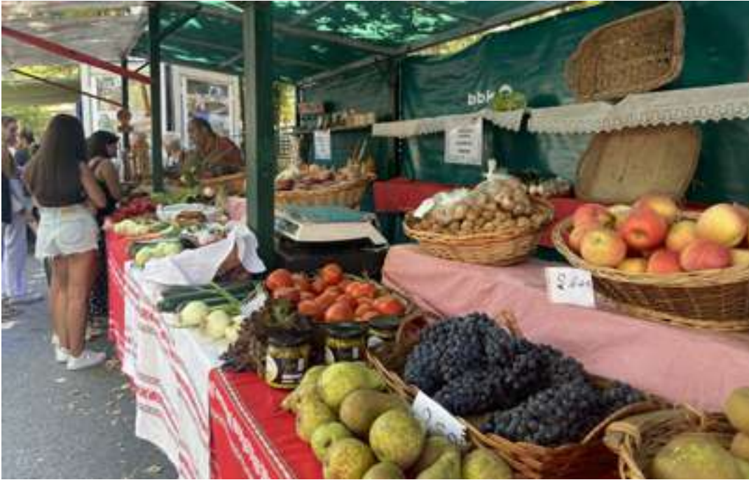
Aurreko edizio bateko Feriako nekazarien postua.