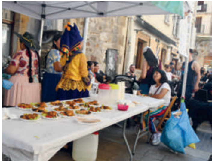
Mundu zabaleko mokaduak jatzko Ferixa Nausikoetan.