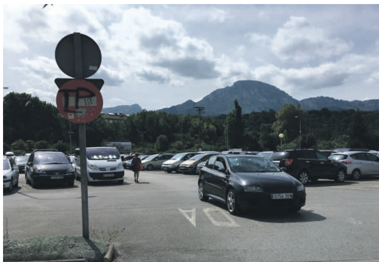
Paduretako aparkalekuaren heren bat erabiliko dute barrakak ipintzeko.

Kultur etxearen alboko lursailan, errepide nagusiko obretarako etxolak eta eraikuntza materiala daude une honetan, eta Maspe barraketarako leku egokiagoa delakoan, hara eramango dituzte.