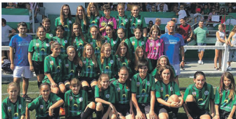
Domekan aurtengo taldeen aurkezpena egingo dute Zaldibarko futbol zelaian.

Haur kategoriako zortzi talde batuko dituen torneo batean izango du estreinaldia