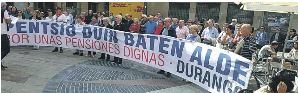
Durangoko pentsiodunak udaletxeko plazan batu ziren astelehenean.

Irailaren 30ean, eskualde osoko pentsiodunak Durangon batuko dira manifestazio bat egiteko. Bestalde, azaro aldean grebarako deialdiak egongo dituztela iragarri dute