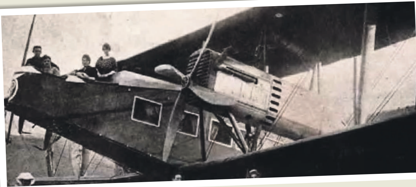
GEREDIAGA ELKARTEA. ASTOLA