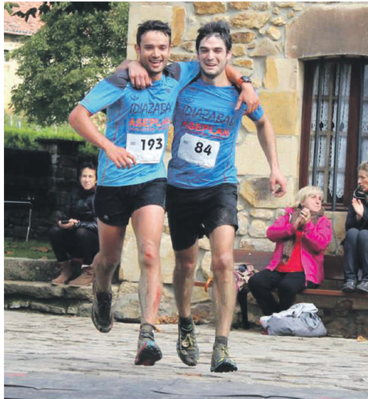
Aurten lehenengoz bete da izena emateko zerrenda.

Ibilbidean Anboto gaina sartu zutenetik, interesak gora egin du. Izen-ematea orain aste bi bete zen eta hainbat korrikalari zain egon dira itxarote-zerrendan