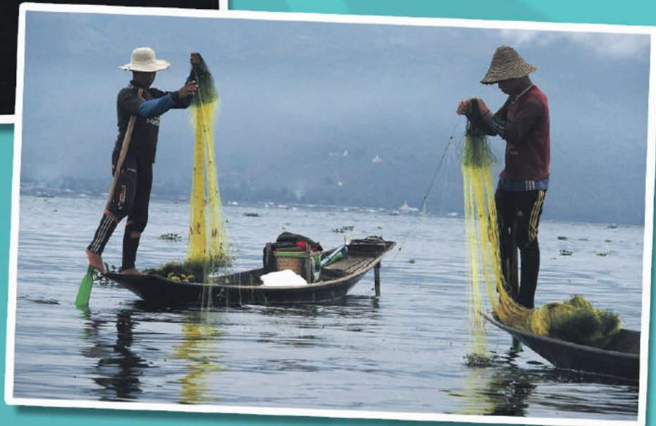
Durangaldetik kanpoko 2018ko argazkia IRABAZLEA

2 KATEGORIA SARITUKO DIRA -ESKUALDEKO ARGAZKIRIK ONENA -DURANGALDETIK KANPOKO ARGAZKIRIK ONENA