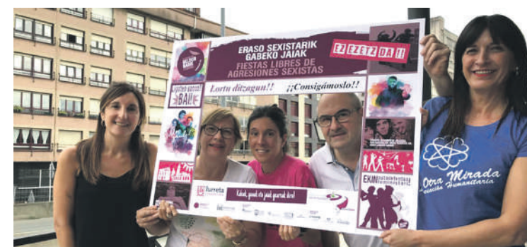
Antolatzaileek korrika egitera animatu dituzte iurretarrak.

Dortsalaren trukean euro bat ordainduko da, eta diru hori La Otra Miradarentzat izango da. Pintxo eta errifa solidarioak, eta Bel-dur Barik gunea ere egingo dira.