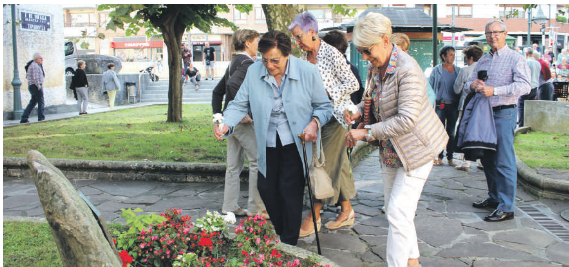
Urtero lege, lore eskaintza egin zuten Berrizen.