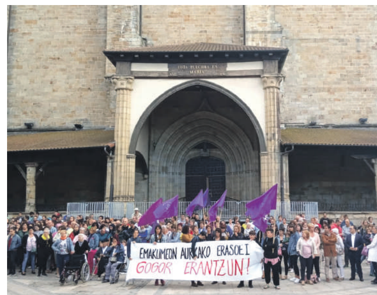
Joan zen eguenean egindako elkarretaratze argazkia.