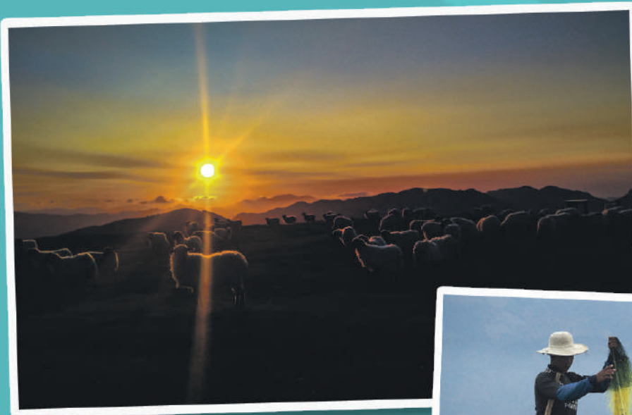
Durangaldeko 2018ko argazkia IRABAZLEA