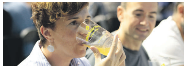
Txapelketak izaera herrikoa du eta sagardoa gustuko duen edonorentzat dago zabalik.

doa gustatzea", esan dute. Afari baten bueltan, hainbat sagardo dastatu eta puntuatuko dituzte. Edur Mendi elkartearen jokatu da kanporaketa, 20:00etan. Sarrerak Uxarte sagardotegian, Tomasa tabernan eta www.sagardoa.eus atarian erosi daitezke.