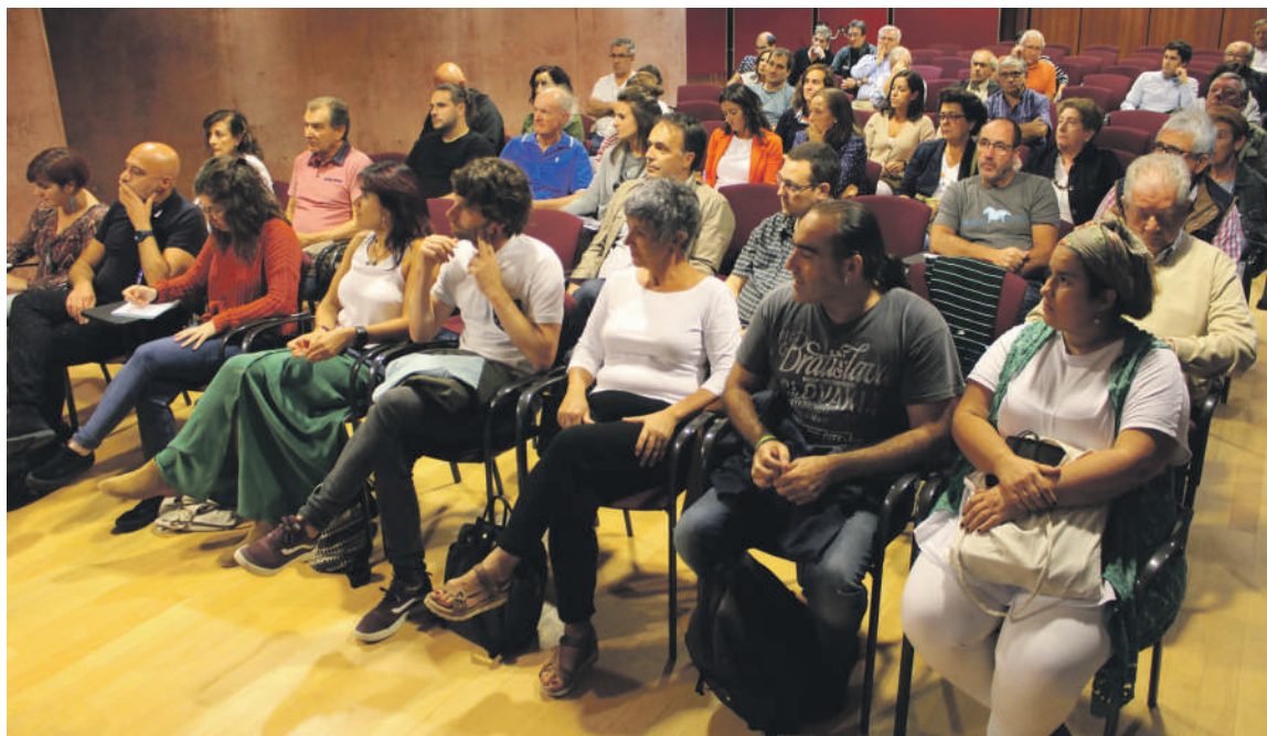
Eguazten arratsaldean Durangoko Elkartegian egindako herri batzarreko irudia.

Beste kexa batzuk Alde Zaharreko bizilagunen aldetik heldu ziren, Kanpatorrosteta eta Komentukale inguruko bizilagunen partetik, hain zuzen ere. Udalak proiektu bat du Alde Zaharreko edukiontzien kudeaketa sistema moldatzeko eta gaur egungo egoera hobetzeko. Birziklapen gune konpletoak sortuko dituzte. Hau da, egitura bakar