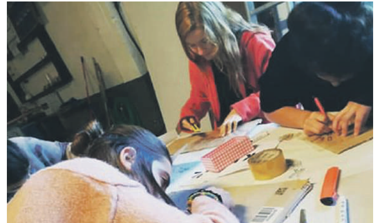
Iazko edizioaren ekintzetako batzuk Sorginola gaztetxean garatu zituzten.

tako erronka eta ekintza sorta prestatu dute aurten ere, euskararen erabileran eta motibazioan eragiteko. Batxilergoa eskaintzen duten Durangaldeko bost ikastetxetan garatuko dute proiektua 2019-2020 ikasturtean zehar.