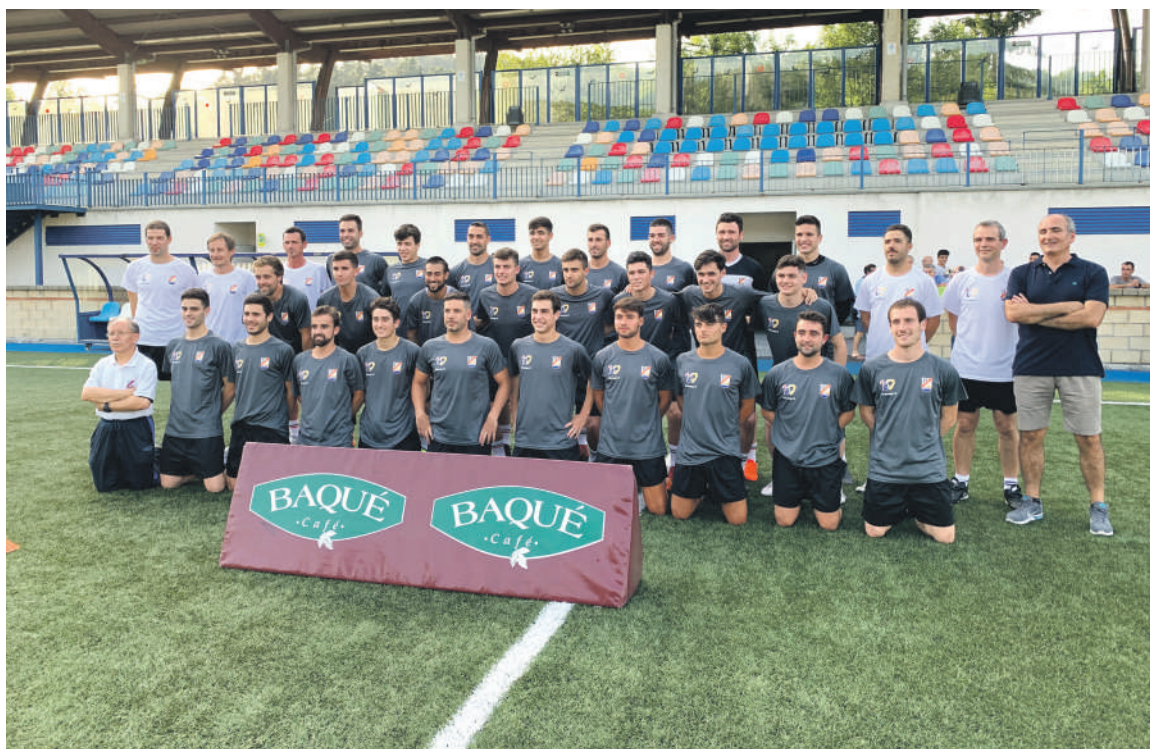
Denboraldi hasieran Tabirako futbol zelaian ateratako argazkia.

Zornotzarrek etxean, Urritzeko futbol zelaian, jokatu dute asteburuan. Atletico Osasuna B taldea izango dute aurkari. Nafarrak laugarren postuan daude sailkapen nagusian.