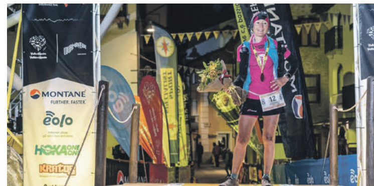
Triguerosen eguen goizaldean zeharkatu zuen helmuga. TOR DES GEANTS

Europako probarik gogorrenetarikoa —330 km eta 24.000 metroko desnibel positiboa— amaitzeko. Bera izan da aurreneko emakumea helmuga zeharkatzen, eta sailkapen orokorrean 6. tokian amaitu du.