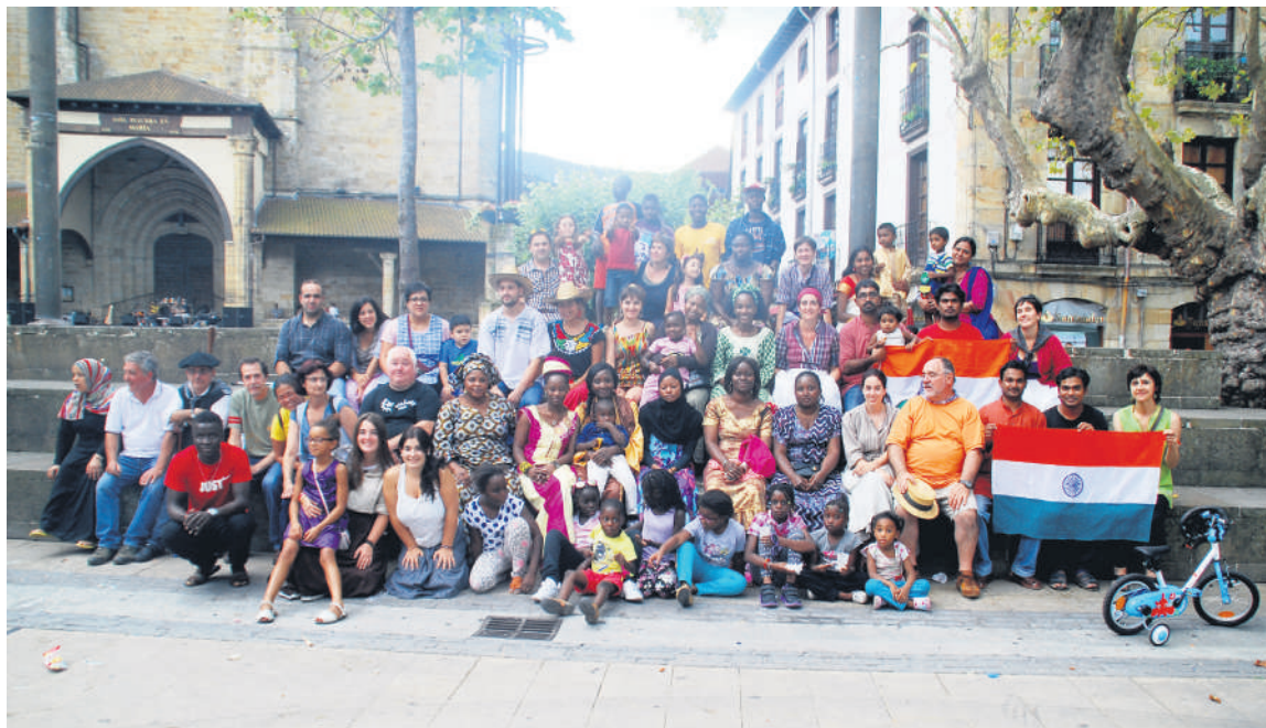
Kainaberako kideen talde argazkia.

Elorriko gobernuz kanpoko erakundeak berbaldi zikloa antolatu du. Egun, hamabi bat lagun dabilta erakundean lanean