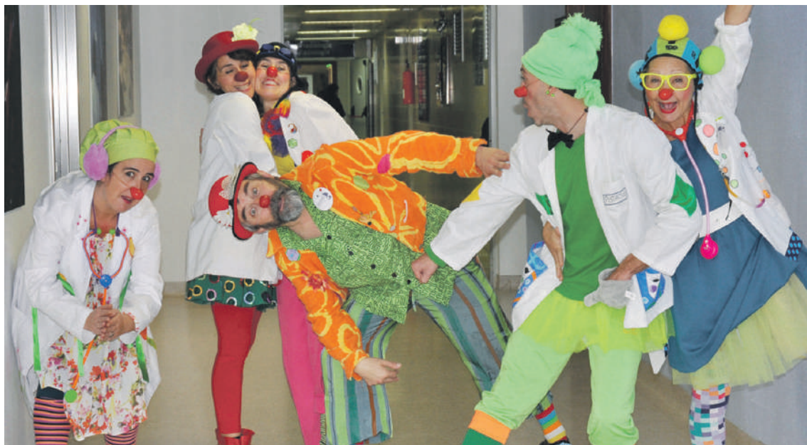
Umorearen bidez, gaixorik dauden umeen emozioak askatzea da Algaraklown pailazo elkartearen helburua.