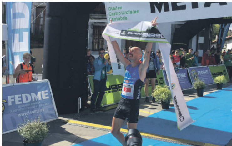
Ariznabarreta Otañeseko helmugara sartu berrian.

Urtea hasi denetik beste bost lasterketa ere irabazi ditu eta eurtako hirutan (Aian, Senperen eta Kanpezun) probako errekor berria ezarri du.