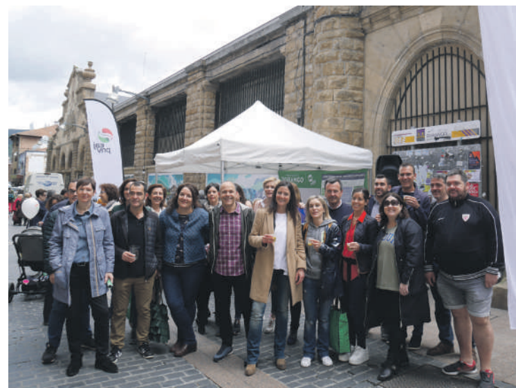
Merkatu plazaren bueltan eman zuten jeltzaleek euren ideien berri.