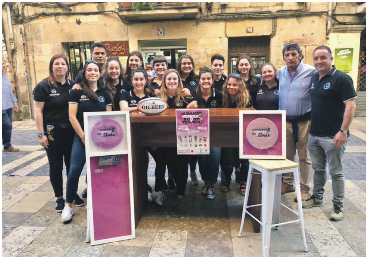
DRTko ordezkariak eta talde nagusiko jokalariek martitzeneko aurkezpenean.

Sei taldeak multzo bitan banatuko dira. Ligaxkako partiduak goizean jokatu dituzte, 10:30ean hasita. Arratsaldeko jardunaldia 16:00etan hasiko da eta talde biek 18:00etan jokatu dute finala. Horren ostean, partaide denek Landako Gunean afalduko dute.