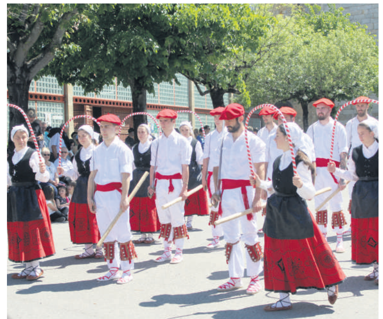
Talde Batuakeko dantzariak San Trokaz egunean

Astebururako ere hainbat ekitaldi antolatu dituzte. Gaur Pelax eta Izaki Gardenak taldeen kontzertuak egongo dira, eta bihar Esne Beltza, Not Scientist eta State Alertarenak. Horrez gain, lau urterik behin egiten duten euskal ezkontza ospatuko dute, bihar.