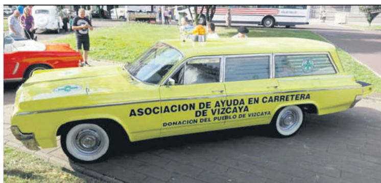
Anbulantzia Dodge 3700 markakoa da.

auto eta 7 motor batu zituzten. Antolatzaileen esanetan, aurtun 70eko hamarkadako anbulantzia bat egongo da ikusgai, Bizkaiko Dyak utzita. Dodge 3700 markakoa da.