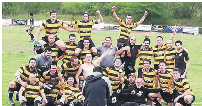
Elorrio Rugby-Parra Tabernako jokalariek Lehen Mailara igo ostean.