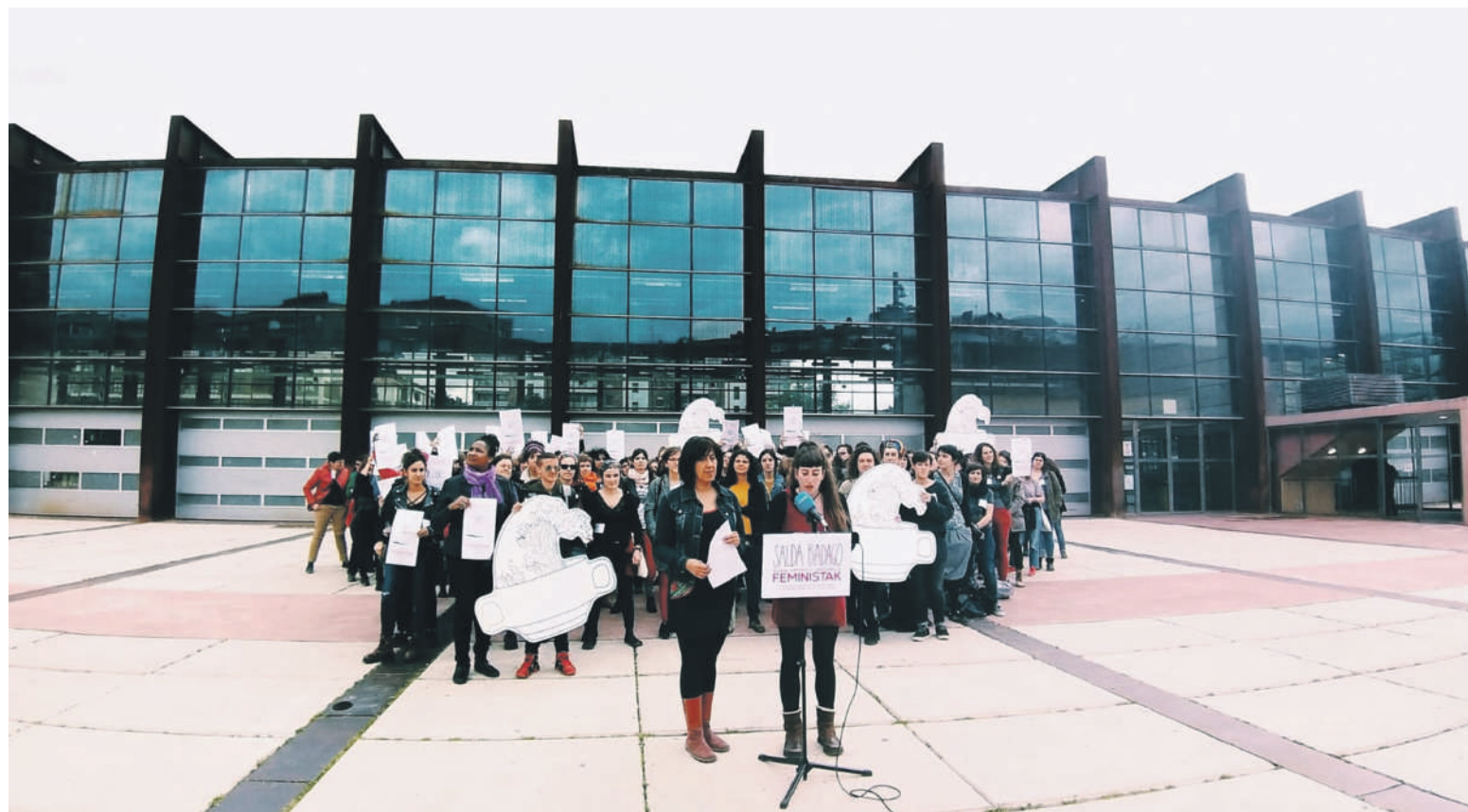
Landako Gunearen kanpoaldean eman zuten jardunaldiak iragartzeko prentsurrekoa, zapatuan.

Azaroaren 1etik 3ra bitartean gauzatuko dute feministen topaketa, eta uste dute "historikoa" izango dela