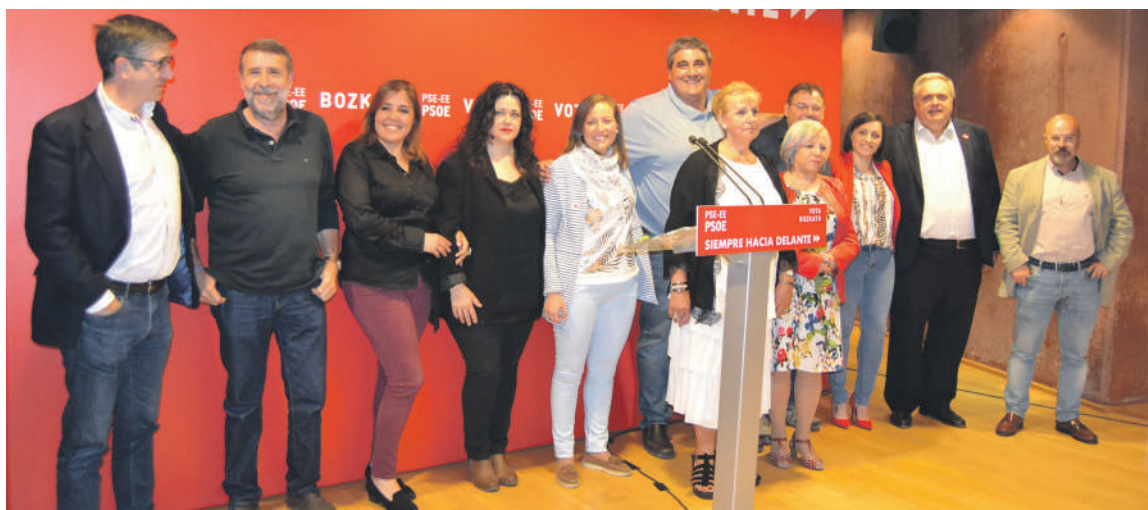
Besteak beste, sozialistek Espainiako Barne ministro izandako Alfredo Perez Rubalcaba izan zuten gogoan ekitaldian.

Era berean, mugikortasun plan bat landu gura du PSE-EEK, "kerik eta trafikorik bako Durango" lortzea helburu dutela. Horregaz lotuta, "ezinbesteko" ikusten du Urki-Hegoalde errepidea amaitzea eta disuasio-aparkalekuak