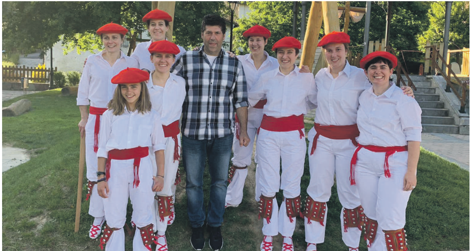
Joan zen zapatuan ezpatadantzari taldeak ateratako argazkia.

Orain urte bi sortutako taldean parte-hartzaile berriak sartu dira eta indarberrituta irten dira herriko plazara