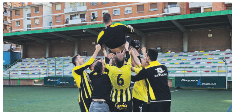
Elorrio B futbol taldekoak igoera ospatzen.