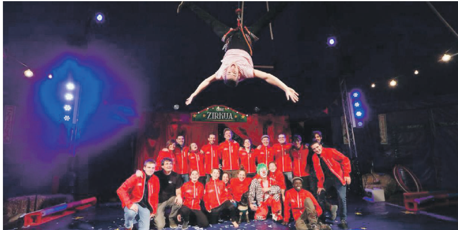
Gure Zirkuaren emanaldi bateko argazkia.

Galartzak txikitatik eduki du afiziotzat zirkua. Hainbat urtez izan du proiektua buruan, eta iaz