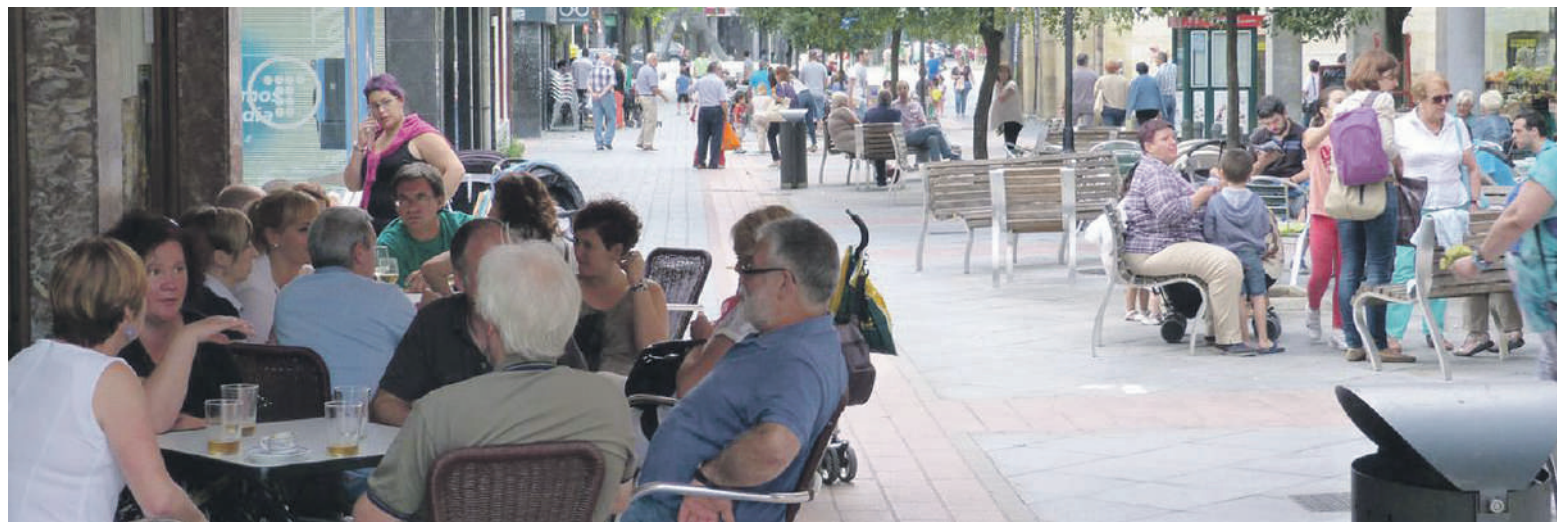
Lau egunean dastatu ahalko dira pintxoak, goizean zein arratsaldean.