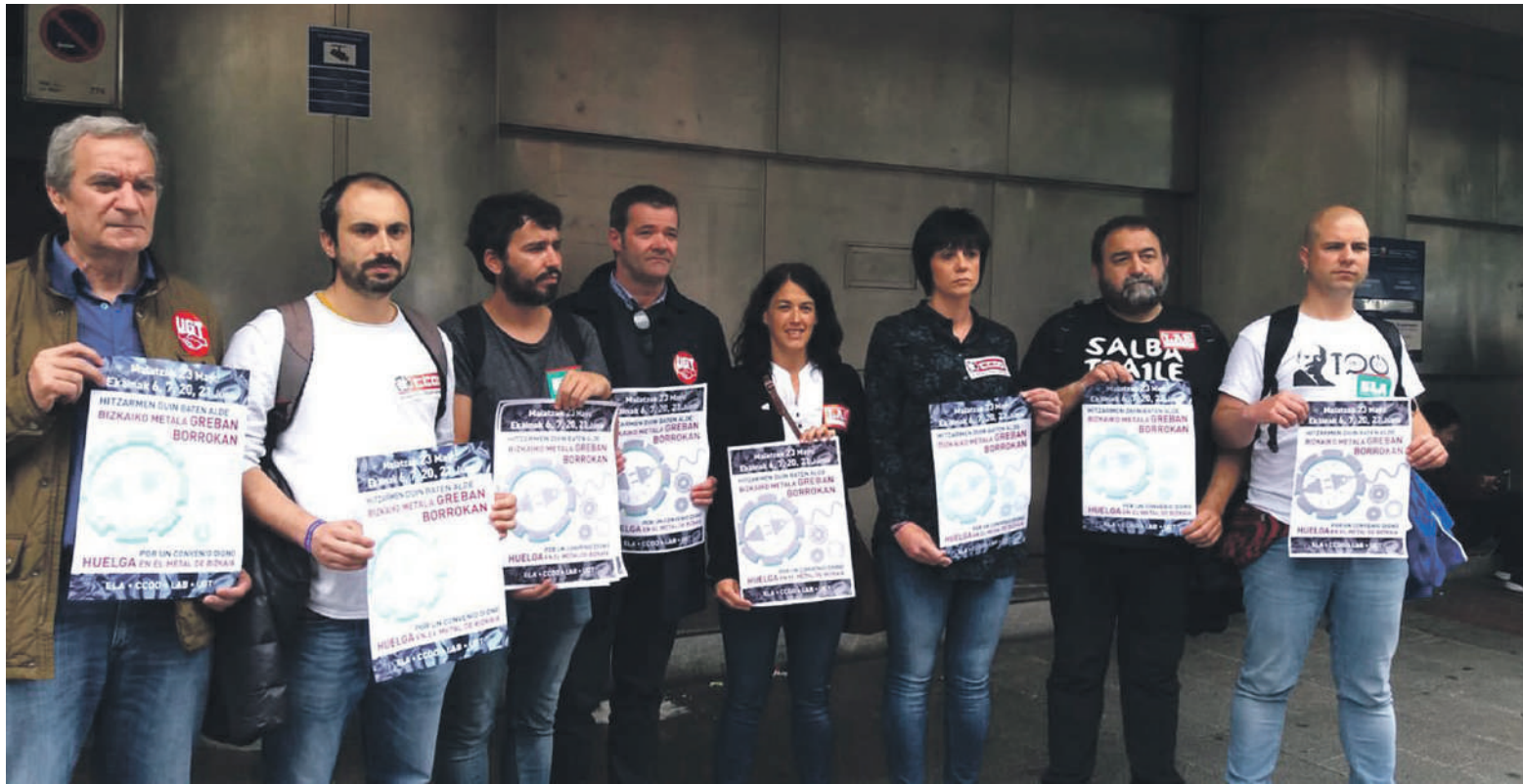
ELA, CCOO, LAB eta UGT sindikatuek Bizkaiko Metaleko Hitzarmenerako plataforma bateratua erregistratu dute Lan Harremanen Kontseiluan. LAB

Maiatzaren 23an eta ekainaren 6an, 7an, 20an eta 21ean deitu dituzte metaleko langileak kalera irtetera