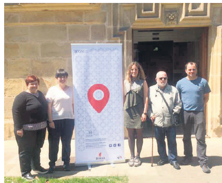
Maiatzaren 18an izango da bertso saio "esperimental".

Bestalde, Mañariko Hontza Museoan bisita gidatua berezia antolatu dute maiatzaren 18rako. Laborategia eta biltegia erakutsiko dituen bisita gidatua prestatu dute. 13:00etan izango da.