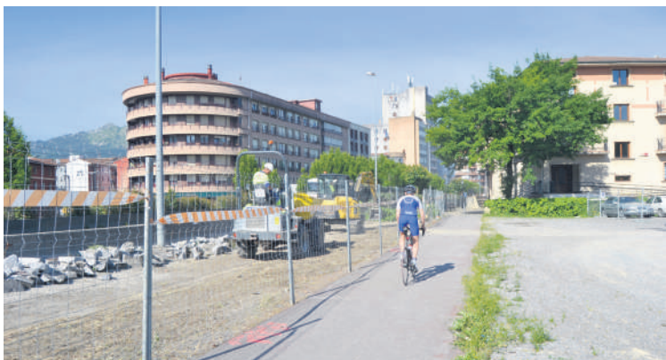
Ibarretxe kultur etxearen alboan hasi dira lanean langileak.

Berrantolaketa lanok 1.557.000 euroko aurrekontua dute eta zortzi hilabete iraungo dute