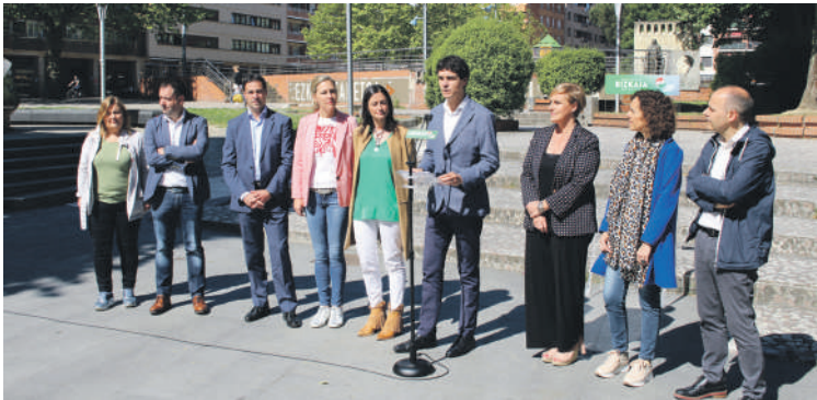
Rementeria alkategaiekin, Durangon. Behean, Zornotzako eta Atxondoko irudiak.

Durangotik Zornotzarako bidegorria egingo dutela esan du EAJren Aldundiko hautagaiak