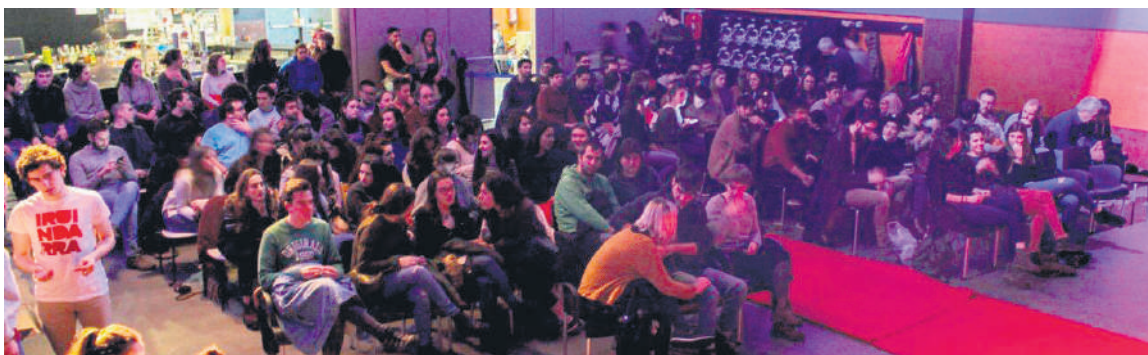
Zap'ing lehiaketaren iazko edizioa Plateruenean.

Maiatzaren 17tik 19ra izango da, Plateruenean, eta domekan aurkeztuko dituzte film laburrak