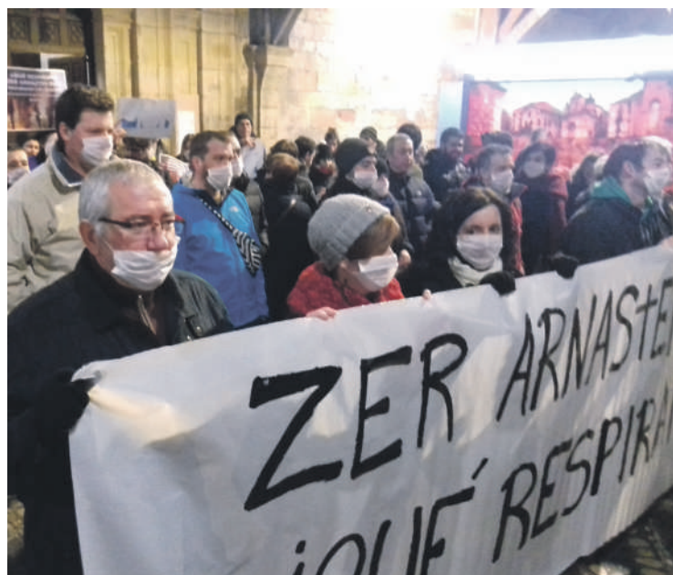
Durangaireak deituta, hainbat elkarretaratze egin dituzte Durangon.

Herritarrak informatzeko eta euren iritzia ezagutzeko bideak zabaltea ere eskatu du plataformak.