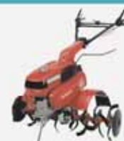
GASOLINAZKO MOTORDUN AITZURRA