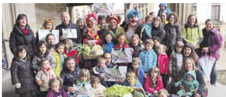
Pirritx, Porrotx eta Marimotots, Elorrioren, zenbait guraso eta umerekin.

guraso elkarte, eta Pirritx eta Porrotxen babesak jaso dute. Gainera, Berrizko Learreta Markinakoak ere batu dira.