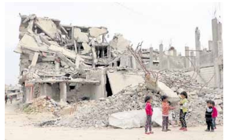
Kobanen hartutako irudia. Umeak etxe hondakinen ondoan jolasten.