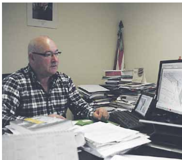
Hainbat herritarrek bidali dute, azken asteotan, curriculumak udaletxera.

Su detektagailuak ipini ditu udalak 80 urtetik gorakoak bizi diren 47 etxebizitzatan. Bestalde, nagusien bizi-baldintzen eta harreman sarearen berri ere jaso du udalak, ekimen honi lotuta. Besteak beste, honako emaitzak eman ditu gizarte laguntzailearen azterketak: 80 urtetik gorakoak %74k dauka senide edo lagun baten bisita egunero, eta %70 gai da laguntzarik barik ibiltzeko.