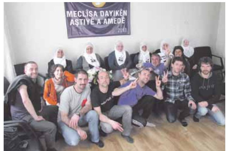
Durangaldeko lau lagunak, besteak beste, hildakoen amekin.

“Blokeo informatiboa” apurtu gura dutela dio Traperok: “Kurduak ere, gertatzen ari den genozidioa munduan zehar kontatzea gura dute”. Hilaren 23an, Durangoko Sapuetxen kontaktuko dute esperientzia, 17:00etan. Etzi berbaldia egongo da, leku berean, 18:30ean, emakume kurduen inguruan. 22an, 18:30ean, bideo-emanaldia egingo dute.