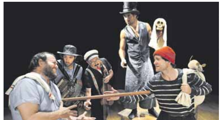
Sei urtetik aurrerako umeentzako antzezlanaren da Gorakadarena.

Orfeoiak eta Doinuzahar eta Bogoroditsie abesbatzek eskainiko dute lehenengo emanaldia, 11:00etan, Plateruen plazan. Musika eskolako soka taldea arituko da, Ezkurdin; Eirband taldea, Andra Marian; Musika Eskolako flauta eta saxo taldeak, Txiki Otaegin; eta L'Atelier dantza taldea, Santa Ana plazan. Ibilaldiko koreografia dantzatzuz emango dute jai amaitutzat, Santa Anan. Herritar guztiak gonbidatu dituzte dantza saio horretan ere parte hartzera.