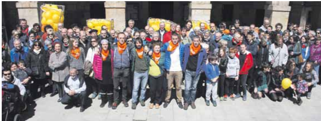
Domekako agerraldian ateratako argazkia.

Agerraldian sei otxandiarren kontrako prozesu judizialak salatzen hasiera eman zioten