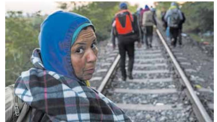
Errefuxiatuen egoera aztertuko dute, hilaren 20an, Plateruenean.

zornotzarrak eta Itsaso Egia CEAR elkartereko kideak berba egingo dute.