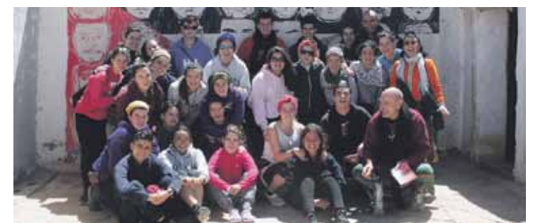
Bidaiari joandako elorriarrek, kanpamentuetan ateratako talde argazkian.

Uholdeek eragindako kalteak konpontzen lagundu dute, eta eskola materiala zein jolasak banatu dituzte Amgala herriko hiru ikastetxetan.