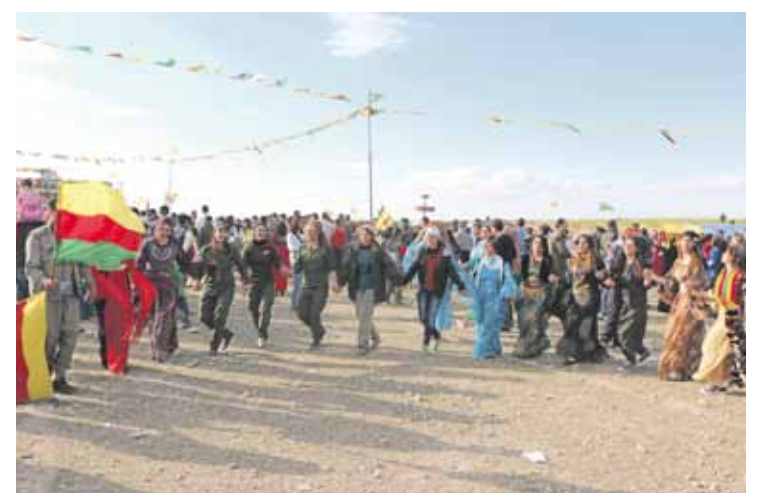
‘Newroz’ ospakizunean hartu zuten parte gazteek.