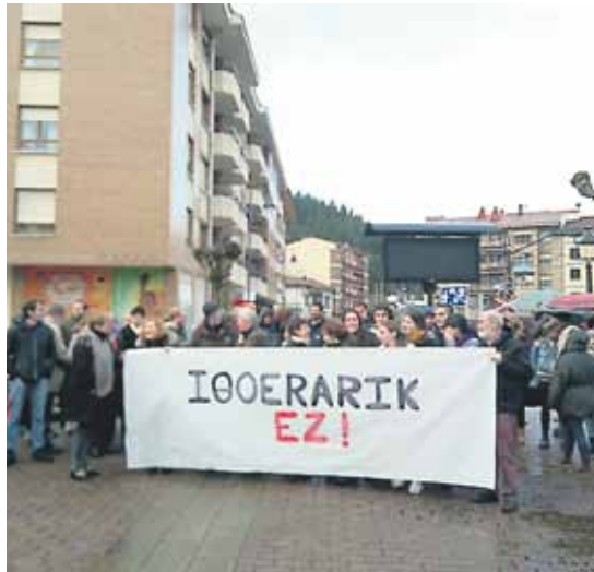
Joan zen barikuan Zaldibarko eta Berrizko kontzentrazioetan ateratako argazkiak.