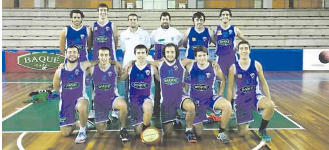
Erregional bereziko aurtengo taldea. Tabirako Baqué

Hamar partidu segidan irabazita, bigarren taldeak segurtaturik du igoera fasea