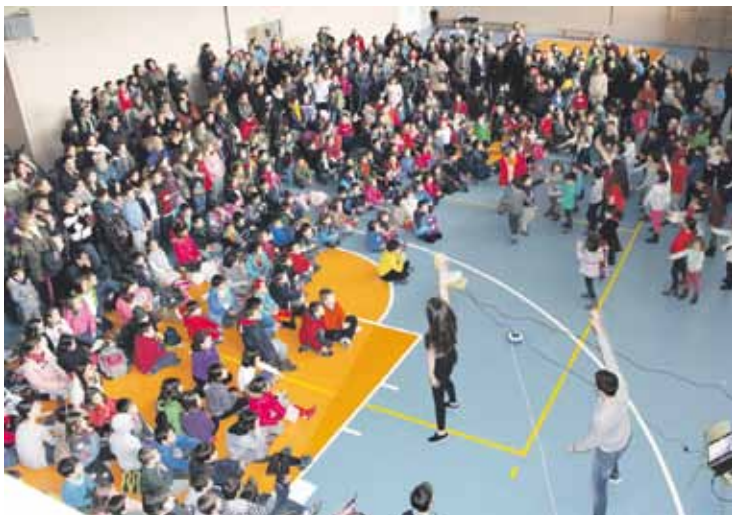
Santa Ana plazan Ibilaldiko koreografia dantzatzuz borobilduko dute goiza.

Euskal kanta ezagunen doinuak girotuko dituzte herriko kale eta plazak