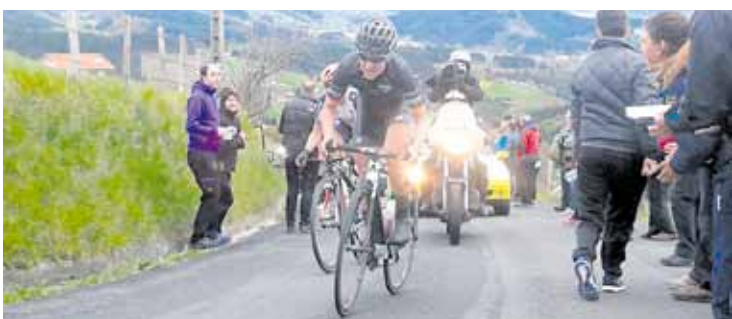
Longo San Juaneko aldapan tiraka, Guarnier gurpilean duela. M.Zuazubiskar

Longok eta Johansonek osatu zuten podiuma