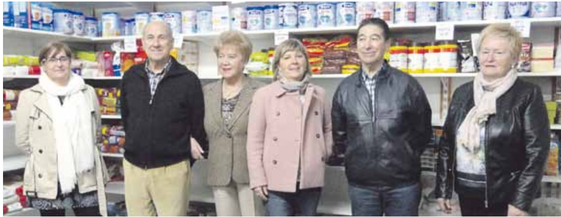
JAEDeko kideak, jatekoaren banaketa koordinatzen duten lokalean, eguaztenean.

2015ean, Durangoko eta Iurretako 164 familia lagundu zituen JAED elkarteak