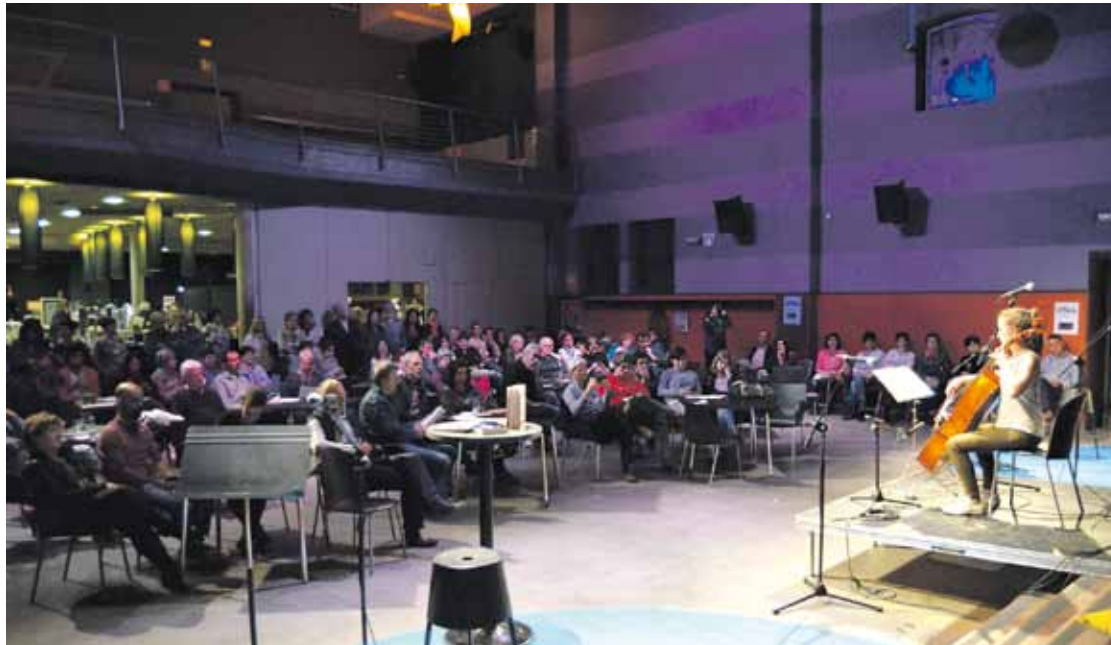
Aurreko bi edizioetan bezala, 18:00etan hasiko da ekitaldia, eta sei ordu iraungo du.