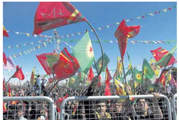
Newroz jaia Diyarbakirren eta Batmanen ospatu zuten.