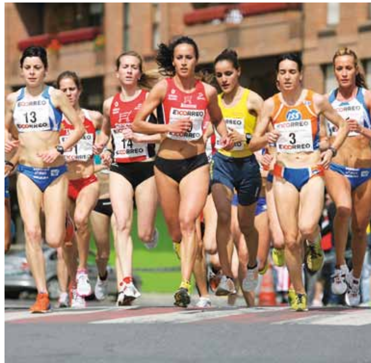
Maspe kalean hasi eta amaituko da proba.

Gainera, ume eta gazte mailetako probak ere ikusgai egongo dira, 10:40tik aurrera. 11:30ean Txupete izena eman dioten proba hasiko da, 6 urte baino gutxiagoko umeei begirakoa. Iaz 100 ume batu zirela nabarmendu zuen Hernandezek. Azkenik, 12:00etan irtengo dute afizionatu eta elite mailakoek, 34. edizioko txapelaren bila.