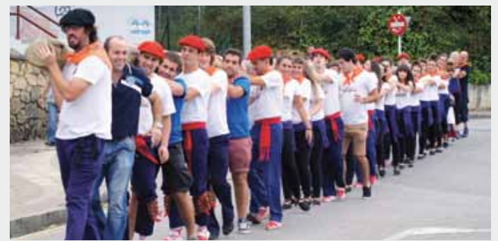
Iurretako dantzariak, iaz, Donien Atxa errotan.

Parekidetasunera bidean, Urriena jaian ere neskek parte hartzea erabaki dute.