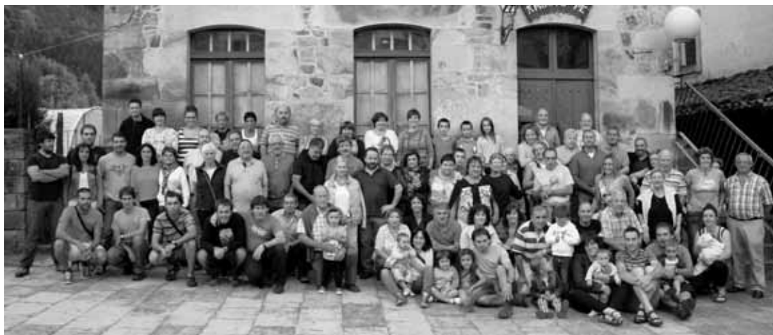
Arrazolarak sasoi bateko eskolaren eraikinaren aurrean.

ematen zion ebazpena argitaratu zuen, eta lokala libre uzteko eskatu zion Anbotope elkarte-kideei. Alokairu kontratua