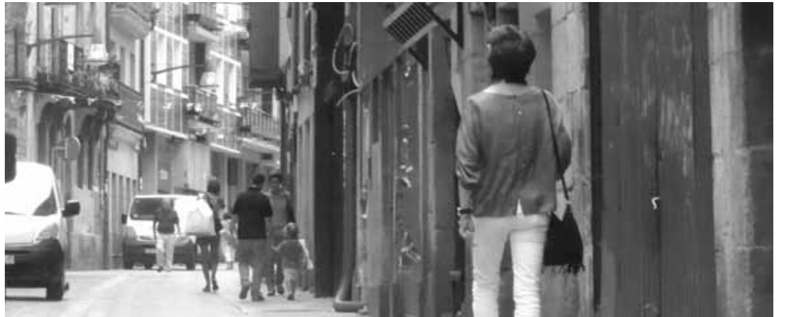
Kalebarriko etxe bitan topatu zuen Ertzaintzak Anboto elkarteko marihuana.