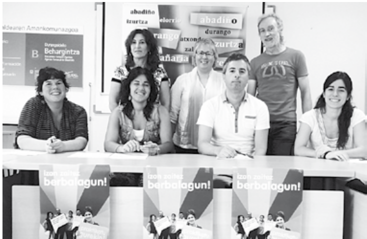
Berbalagun egitasmoaren bultzatzaileak, prentsaurrekoan.

tza Eskola eta Berbarok antolatuko dute egitasmoa, Amankomunazgoagaz eta udalekin elkarlanean.