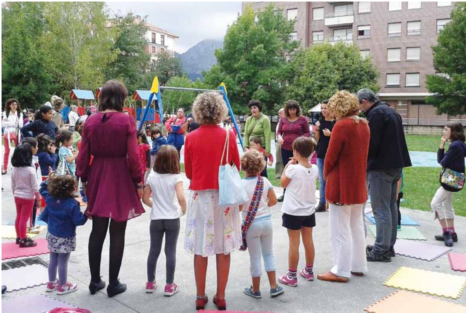
Iazko Zabu Zibu ekimenaren ekitaldietako batean ateratako argazki bat.