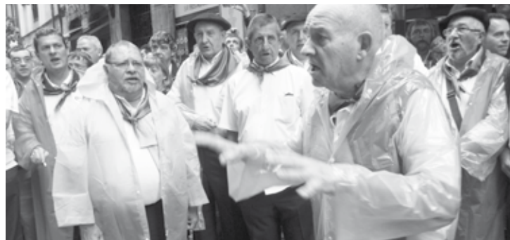
100 urteko historia du Agate Deuna abesbatzak.

100 urteko historia daukan taldea da Uribarriko Agate Deuna abesbatza, eta 50 gizon elkar-tzen dira bertan.