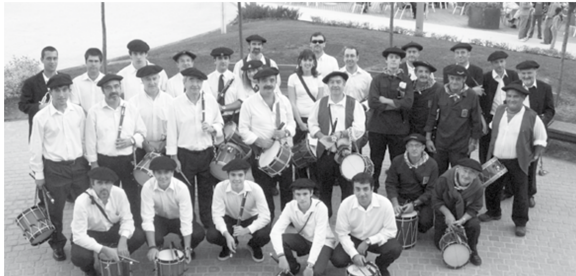
Txistulari Egunaren aurreko edizio bateko argazkia.

batuko dira, azkenik, eguna biribiltzeko, parte hartuko duten musikari guztiak.