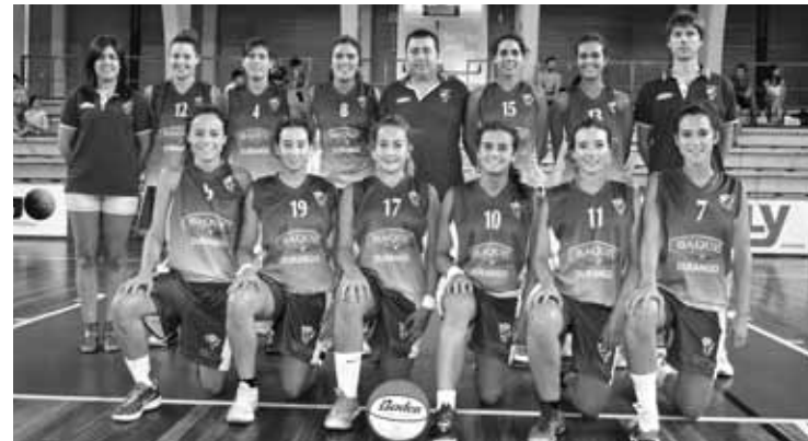
Emakumeen talde nagusia bigarren sailkatu da Baqué torneon.

Bestalde, gizonen Baqué Torneoa jokatu da asteburuan. Bihar, 16:45ean, La Salle eta Zarautz lehiatuko dira; 18:45ean, Tabirako eta Getxo. Domekan, 12:00etan izango da finala.