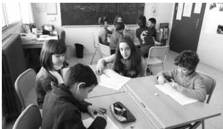
Eskolako ikasle ohiek ikasleekin opor aurretik egindako saio batean.

Ikasleekin hasi aurretik, boluntarioek formakuntza labur bat jasoko dute irakasleen partetik.