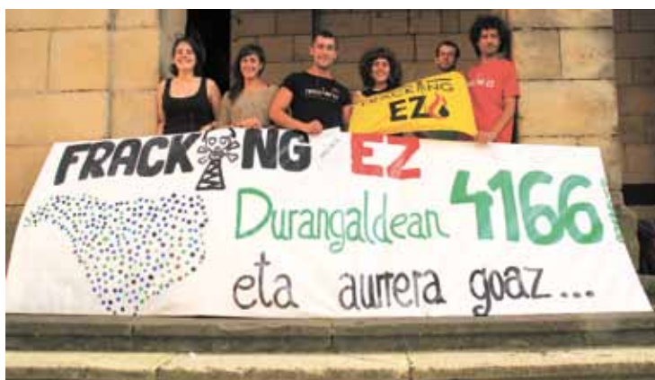
Durangoko Santa Ana plazan egin zuten agerraldia, eguaztenean.

Eskualdeko 4.166 sinadurak babestu dute frackinga debekatzea eskatzeko herri ekimen legegilea