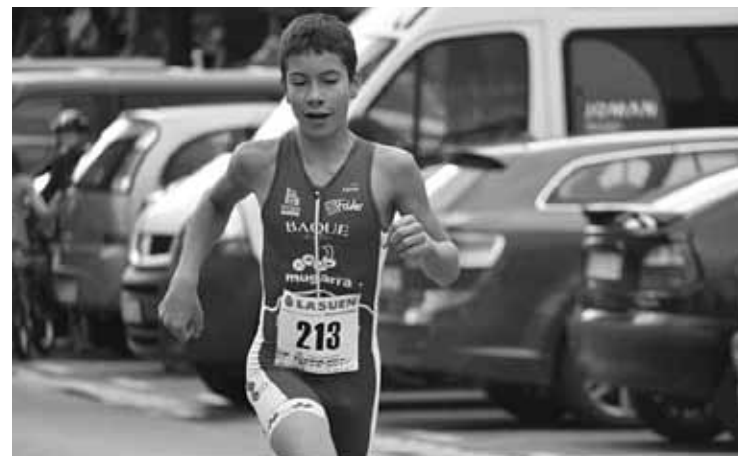
Apurka-apurka gazteak triatloian trebatzea du helburu eskolak.