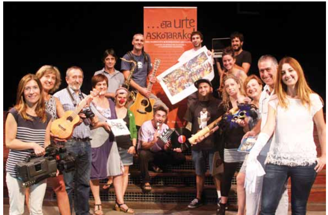
Plateruenerako ekarpen kanpaina babestu duten herritarrek, atzo, aurkezpenean.