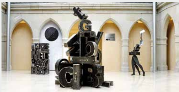
‘Memoriaren lurraldea’ erakusketako irudia. Borja Agudo.

Buruan duen guztia produzitzeko modua bilatzea da arazoa.