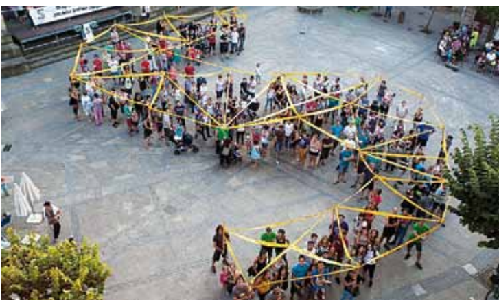
Sarearen irudia islatu zuten barikuan, aurkezpenean.

Ekitaldi nazionala deitu dute biharko, 18:00etan, Bilboko Miribillan, eta presoaren sakabanaketagaz amaitzeko ibilbidearen hasiera lez islatu gura dute.