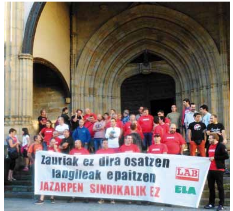
Atzo, epaiketa egin aurretik hartutako irudia, udaletxe parean.

Bestalde, greba sasoian izandako tentsio egoera batean gerenteak, ustez, "irainak eta erasoak" jaso zituen, eta, horregatik, hiru langileren kontrako epaiketa egin zuten atzo. LABek eta ELAk deituta, protesta egin zuten, langileen arabera, akordioan geroko errepresaliarik ez egotea adostu zutelako. Hainbat bider artxibatu ostean, salaketa-gaz aurrera egin izana kritikatu dute sindikatuek. Gerentearen esanetan, langile horiek irainak zuzentzea bakarrik gura dute.