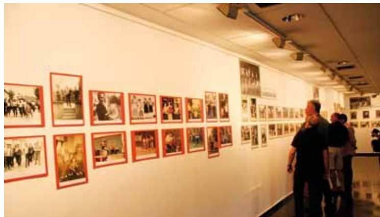
Asteon zabaldu dute musikariz osatutako argazkien erakusketa, Zelaietan.