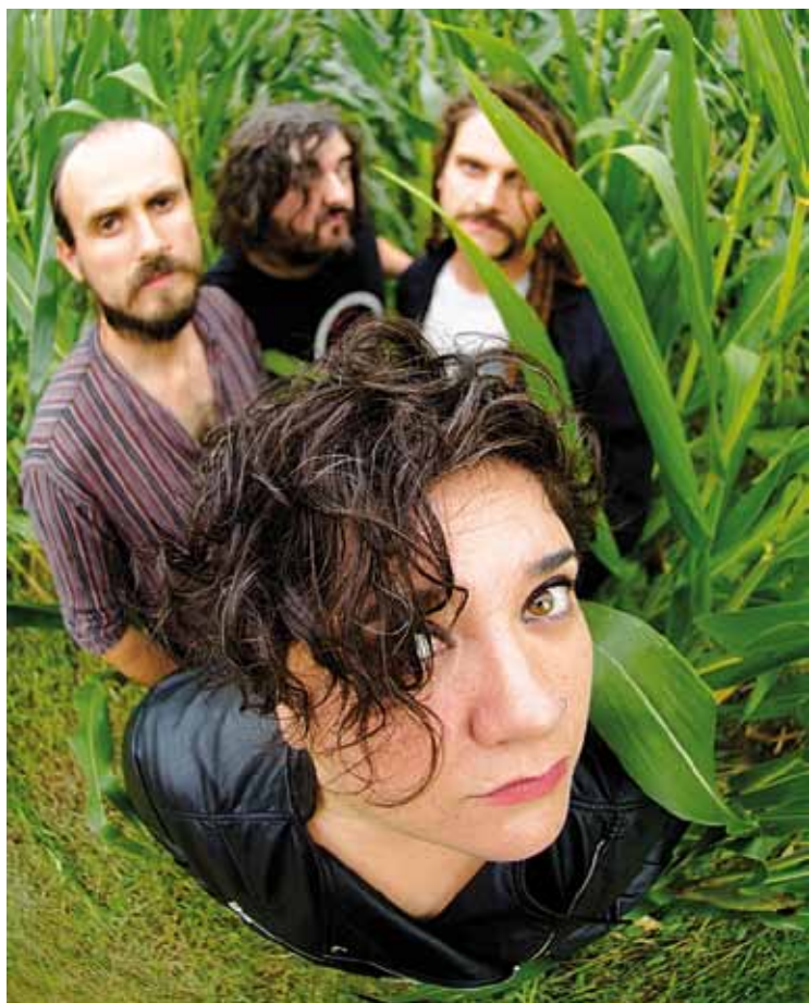
Zea Mays talde bilbotarrak 'Da' diskoko kantak ekarriko ditu Atxondora.