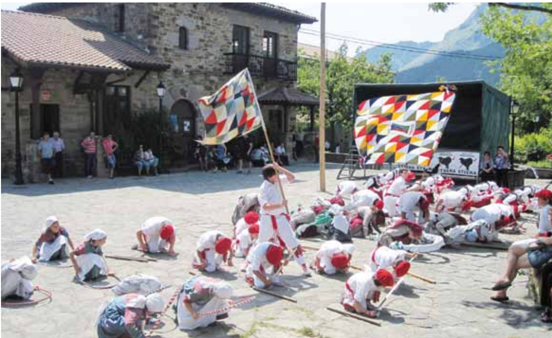
Gaur txopoa jasoko dute, eta domekan dantza saioa eskainiko du Andasto taldeak.

Arratsaldean pilota partiduak jokatuko dituzte, eta gauean txopoa jasoko dute