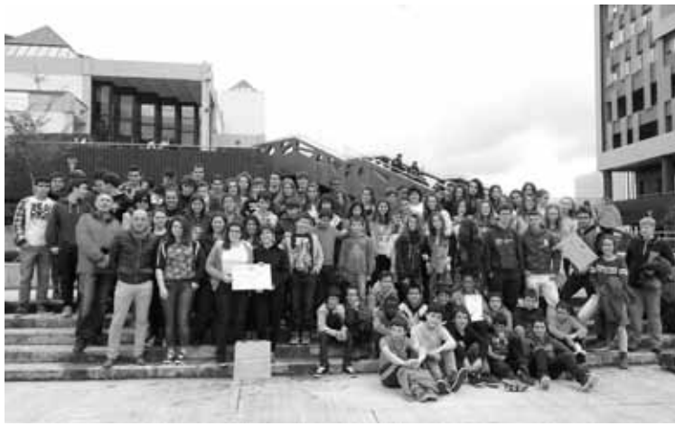
Institutuko ikasleak, saria ospatzeko ateratako argazkian.