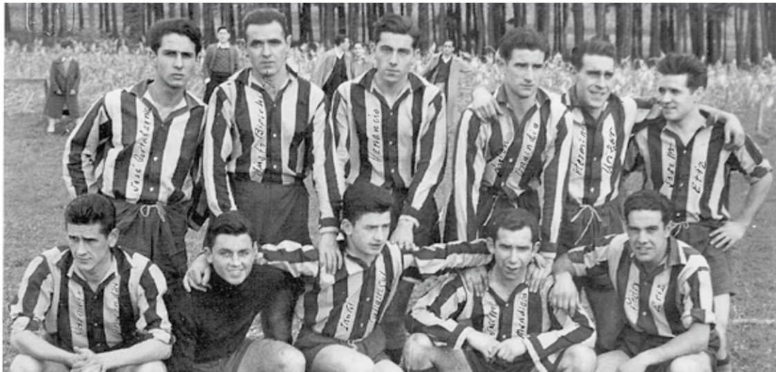
1953an eta San Mamesen Bigarren Mailako finala jokatu zuen taldea.

Zapatuan, sortu zeneko 90. urteurrena ospatu du Elorrio futbol taldeak