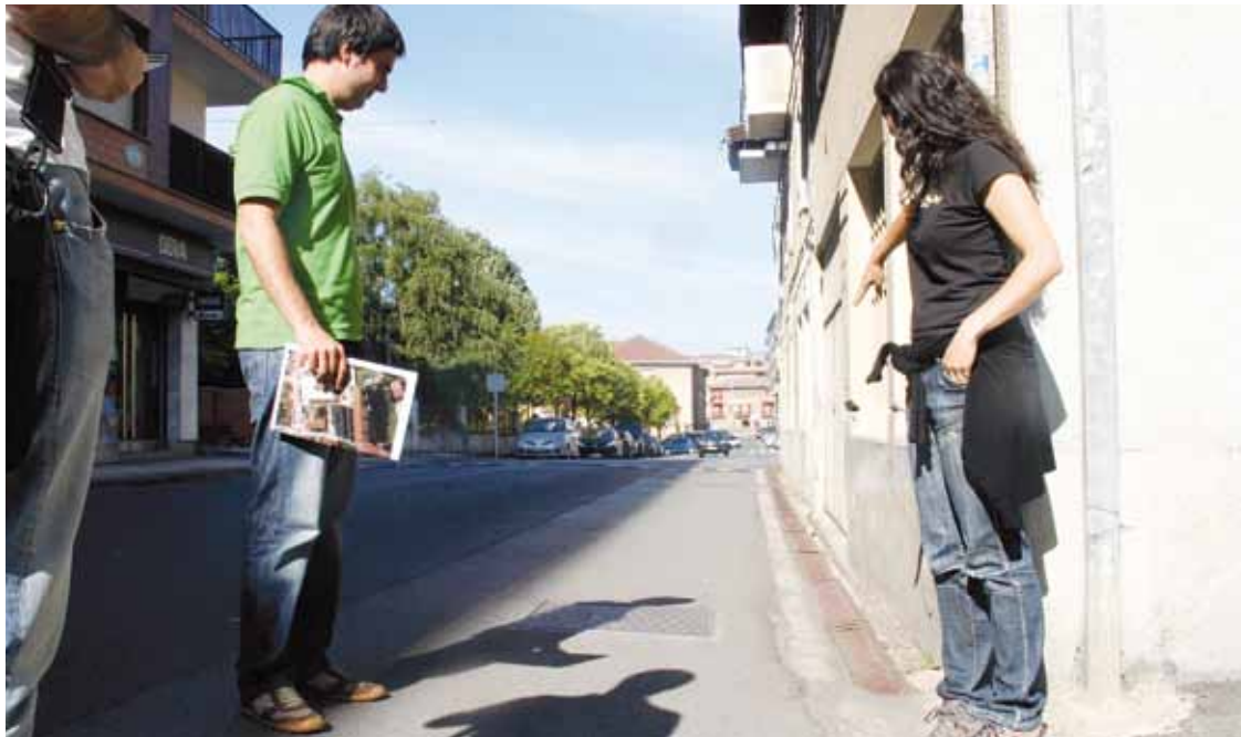
Gaur egun falta den lekuan, Bekoetxe parean, espaloia egingo dute.

Herriguneko hiru lekutan egingo dituzte espaloiak zabaldu eta babesteko lanak