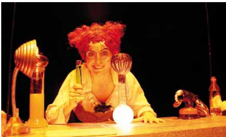
'Barrearen laborategia' ikuskizuneko une bat.

Zurumuru antzerki taldeak 'Barrearen laborategia' ikuskizuna eskainiko du