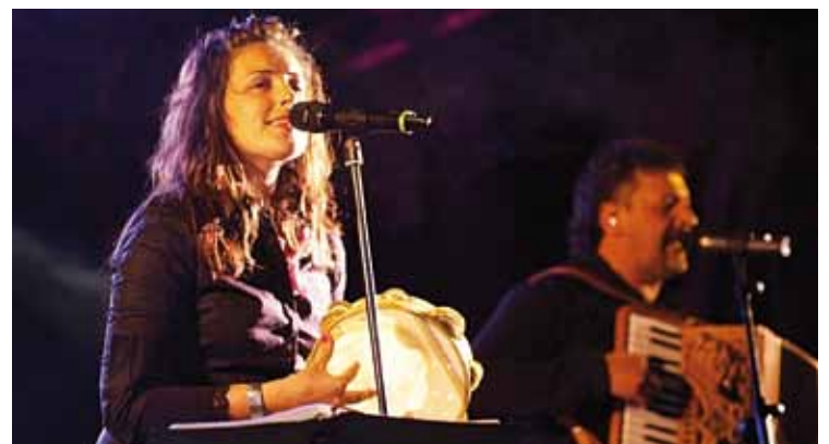
Luhartz taldeak zapatuan eskainiko du erromeria.

auzotarrek indarrak hartu ostean, Etzilimu taldeak erromeria eskainiko du. Bihar, berriz, Iurretako Luhartz erromeria talde ezaguna izango da agertoki gaitetik axpetarrak mugiaraziko dituen bere ohiko dantzeekin eta abestiekin. Kontzertua 22:30ean hasiko da.