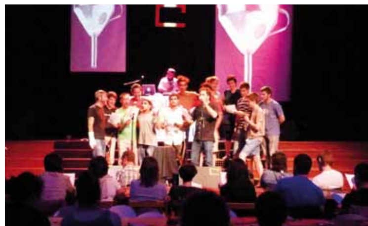
Bertsolari gazteentzako plaza izan zen Plateruena.

100 entzuletik gora batu ziren joan zen barikuko Plateruenerako II. Koplak Txapelketa jarraituzera