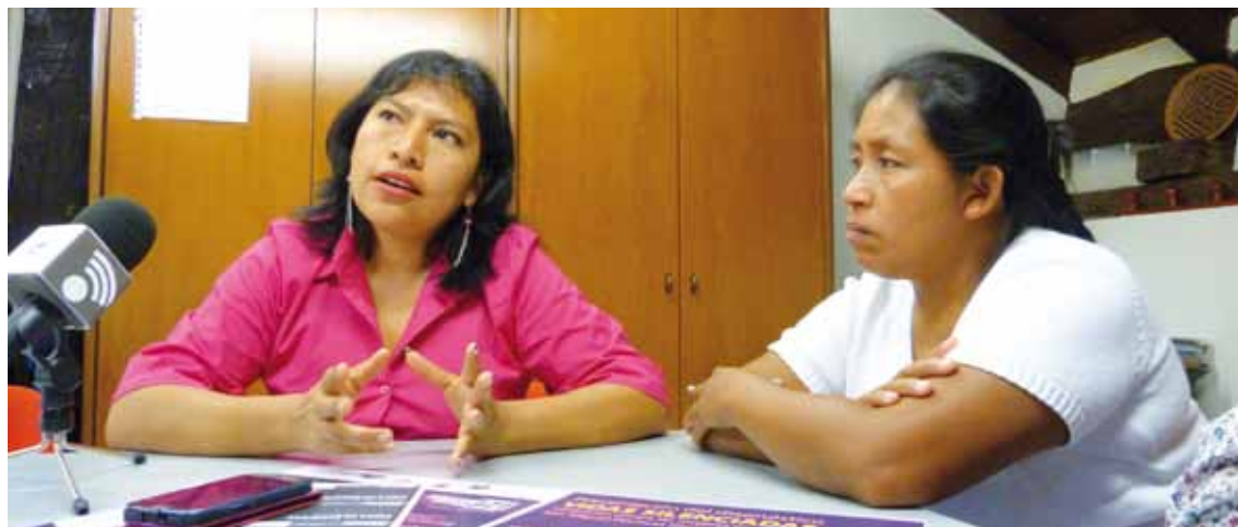
Corona eta Pichillá, gaurko aurkezpena iragartzeko prentsaurrekoan.

Pochutako (Guatemala) emakumeen egoeraz berba egingo dute gaur