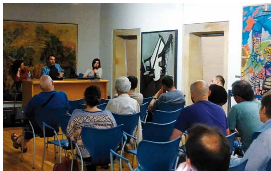
Durangoko Arte eta Historia Museoa eskaini zuten argazkilariak berbaldua, martitzenean.

Goiuri Aldekoa-Otalora eta Rous Boisier argazkilarien lana izan da berbagai