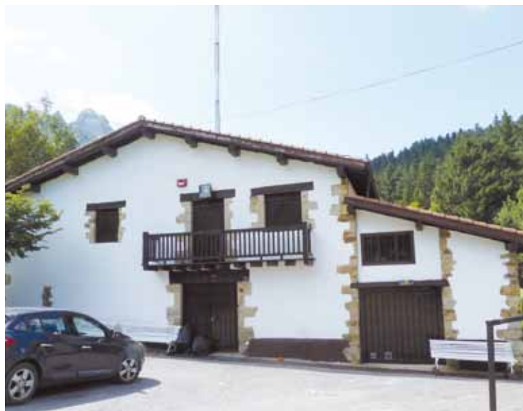
Etxaburu dorrearen ondoko baserrian egon dira orain arte gazteak.

Zazpi urtez egon dira Izurtzan; urte hauetan herritarren aldetik jasotako "harrera ona" eskertzeko hainbat ekitaldi prestatu dituzte sanjoanetan