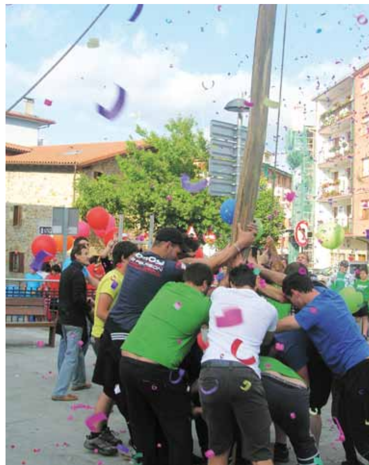
Jende asko batzen da jaiari hasierako ekitaldira.

Mozorro eta Kuadrilla Egunean egingo dutenaren moduko herri bazkarietara bakoitzak bere mahai tresnak eramateko eskatu dute antolatzaileek: plastikozkoak alboratu, eta birziklapenaren alde egiteko. Helburu berragaz, txosnetan, herri tabernan zein gaztetxean berrerabiltzeko edalontziak ipiniko dituzte aurtengo jaietan.