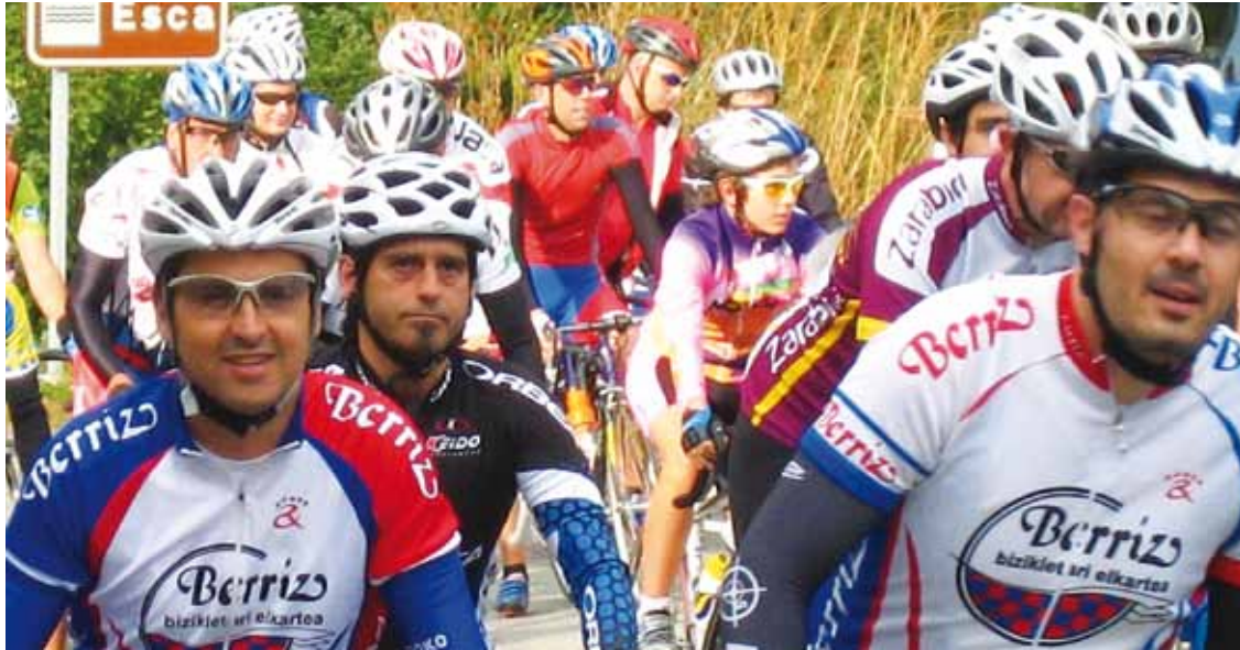
Aurten, bosgarren aldia egingo du Berrizko martxak.

Berrizko udaletxe paretik irtengo dira 09:00etan, eta toki berean izango da helmuga; Bizkaiko kostaldeko hainbat herritatik zehar ibiliko dira