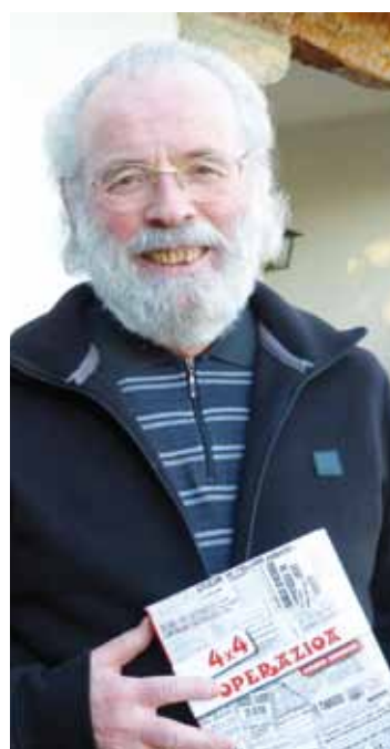
Izendapenagaz “oso pozik” Amuriza.

Artikulu ugari idatzi du hainbat komunikabidetan: Punto y Hora de Euskal Herria , Egin , Euskadi Información eta Gara . Lau urtez Anboto astekarlan lanean aritu ondoren, 2006an