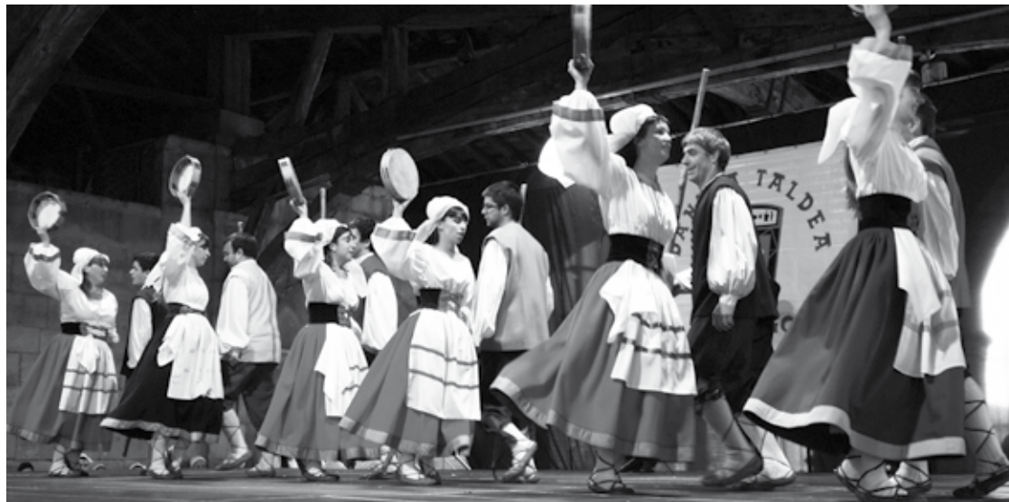
Euskal Herriko sei herrialdetako dantzak izango dira Andra Marian ikusgai.

19:45ean, eta etzi, 12:45ean, Andra Mariko elizpean: Tronperri dantza taldeak antolaturiko ekitaldia. Tronperri euskal dantzen emanaldia antolatzen duen 32. urtea izango da hau. Ehundik gora dantzari ariko dira ekitaldi horretan parte hartzen, eta Euskal Herriko sei herrialdetako dantzak izango dira bertan ikusgai: Bizkaiko, Zuberoako, Nafarroako, Arabako, Lapurdiko eta Gipuzkoako taldeak gonbidatu dituzte.