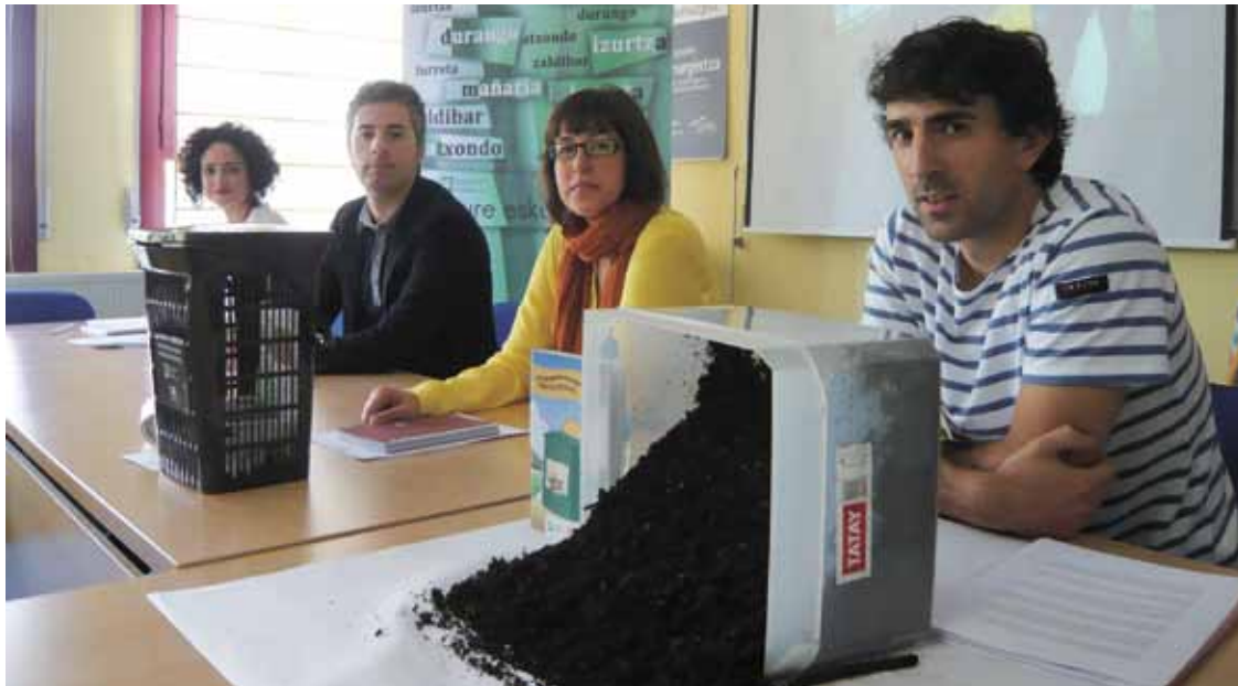
Mandaluniz, Zarrabeitia, Zuazo eta Areitiourtena, martitzeneko prentsaurrekoan.

Amankomunazgoak Iurretan eta Traña-Matienan hasitako ekimenaren balorazioa egin du