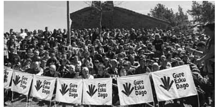
Zornotzarrak Bizkargin, erabakitzekeo eskubidea aldarrikatzen.

Anbotok domekako giza kateari jarraipena egingo dio webgunean: www.anboto.org . Tokikom elkarteko hedabide batzuekin - Goiena , esaterako-, eta Berria eta Argia hedabideekin elkarlanean arituko da giza katearen berri emateko.