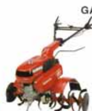
GASOLINAZKO MOTORDUN AITZURRA