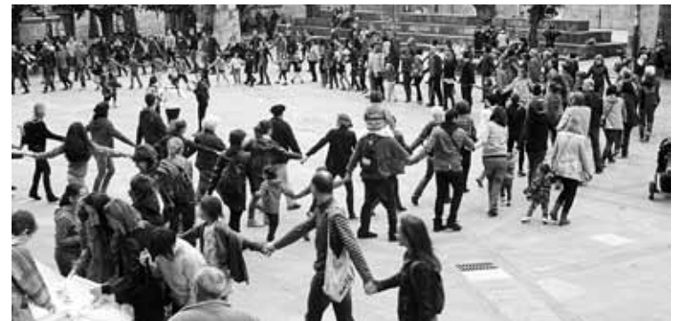
Elorriarrek giza kate sinboliko bat irudikatu zuten plazan.