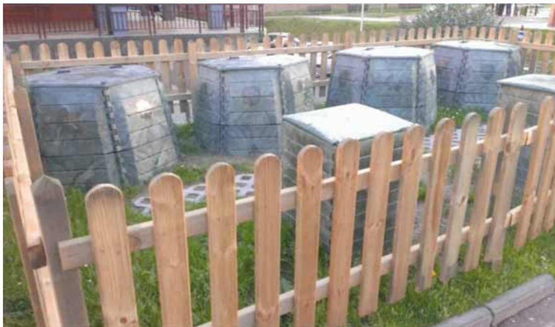
Mallabian konpostagailuekin dabilta, auzoan eta herriguneari.