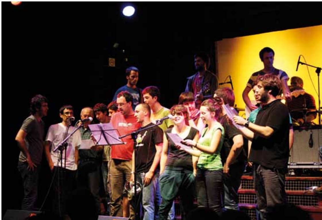
Iazko kopla txapelketako partaideak, amaieran, batera kantatzen.

Hamar bertsolari ibiliko dira neurri laburrean, bizi-bizi, ekainaren 13an