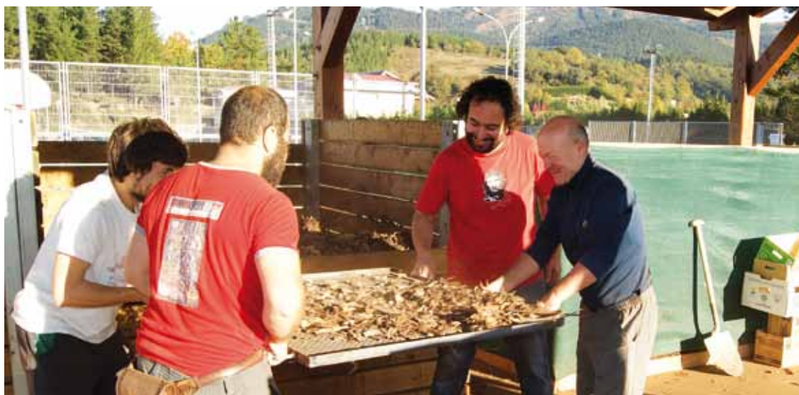
Berrizko konpostaje fabrian, beharrean.