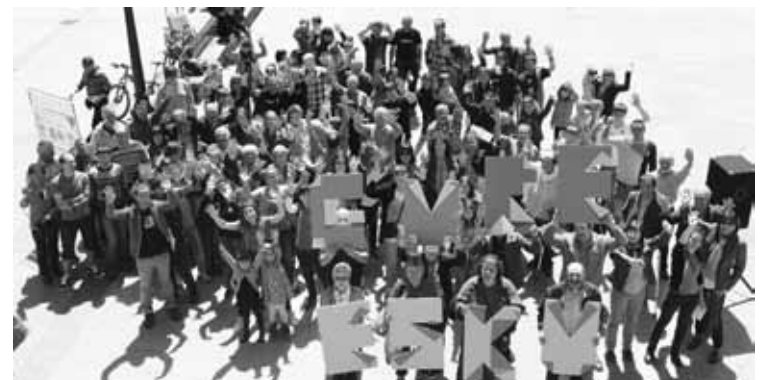
Otxandiarrek plazan, Gure Esku Dago dinamikagaz bat egiten.