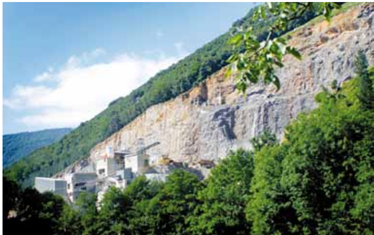
Zalloventa harrobia 2010ean itxi zuten Jaurlaritzaren aginduz.

Jaurlaritzak dioenez, helburua parke naturaleko baliabide naturalak babestea da