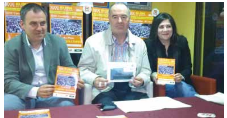
Atzo egin zuten asteburuko egitarauaren aurkezpena.

Asteburuan ospakizun bi-koitza izango du SAC Zornotza abesbatzak, izan ere, taldea sortu zela 60 urte bete dira aurten. Urteurren hori ospatzeko, Zumaiako abesbatzazagaz kalejira egingo du bihar eguerdian, eta, 21:00etan, Donostiako Easo abesbatzaren emanaldia izango da Zornotza Aretoan.