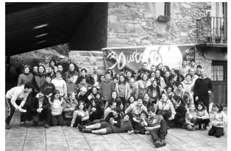
Inurri Eskaut taldearen argazkia.

Guraso batzorde bat dugu, eta lan oso ona egiten dute. Laguntza oso handia dira guretzat. Esate baterako, udan, udalekuak hasi aurretik, asteburu bat lehenengo kanpamentua muntatzera joaten gara gurasoekin.