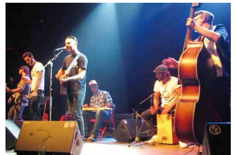
Ekainaren 13an joko dute Dead Bronco taldekoek, gaztetxean.

Gaztetxean izango dira, aldiz, ekainaren 13ko eta 14ko hitzorduak. Hiru rock talde gonbidatu dituzte jaialdira. Dead Bronco joko du barikuan, eta Niña Coyote eta Chico Tornado bikotea zein Porco Bravo taldea ariko dira zapatuan. Zapatuko bazkari osterako, Despeluque talde kolonbiarraren musika izango da 17:00etan, dantzarako gogoz daudenentzat aukeran.