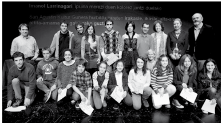
Hamahiru sari banatu zituzten domekako ekitaldian.