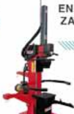
ENBORRAK ZATITZEKO MAKINA