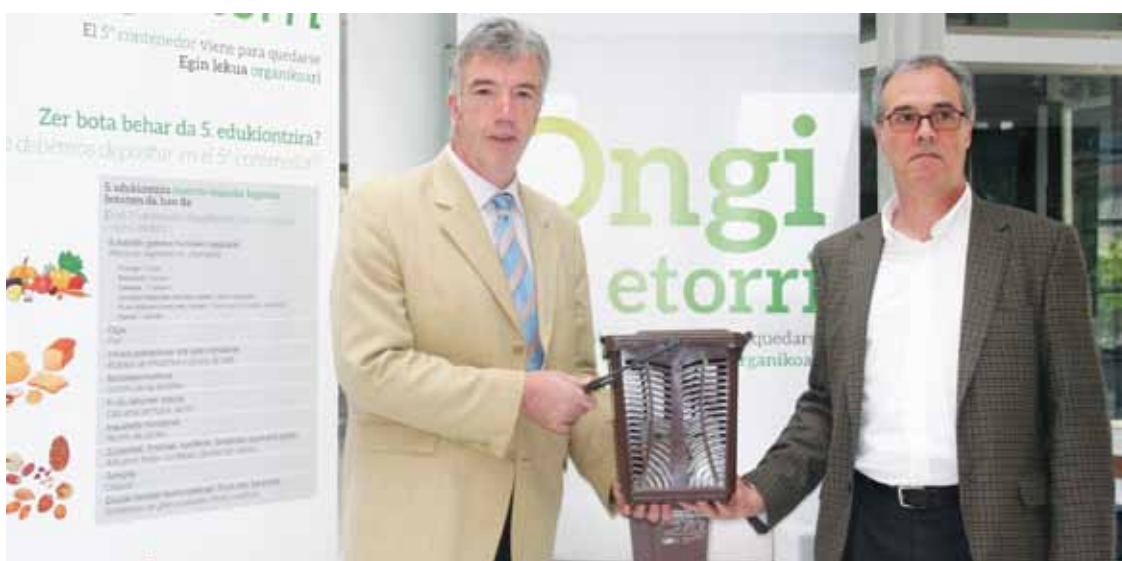
Zornotzako bosgarren fasearen aurkezpena.

ZELULOSAZKO ONTZIAK BIODEGRADAGARRIAK ETA BIRZIKLAGARRIAK