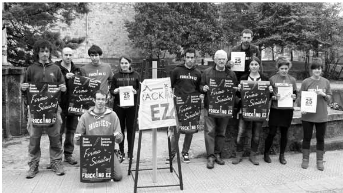
Frackingaren kontrako mugimenduko kideak, Pinondon, prentsaurrekoan.

EH Bilduren iritziz, hauteskundeak testuinguru latzean datoz: “Zerbitzu publikoak murrizten eta eskubide sozialak deuseztatzen ari dira etengabe; horren ondorioz, milioika pertsona langabezia, etxe desjabetzeak, ezegonkortasuna, pobrezia eta bazterketa soziala sufritzen ari dira”. Horren aurrean, “herrien autodeterminazio eskubidearen defentsa argia egin eta Europar Batasuneko eredu sozioekonomikoa aldatzeko ardura” hartuko duela dio.