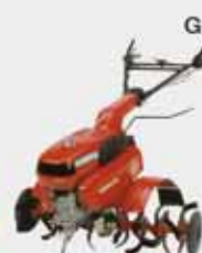
GASOLINAZKO MOTORDUN AITZURRA