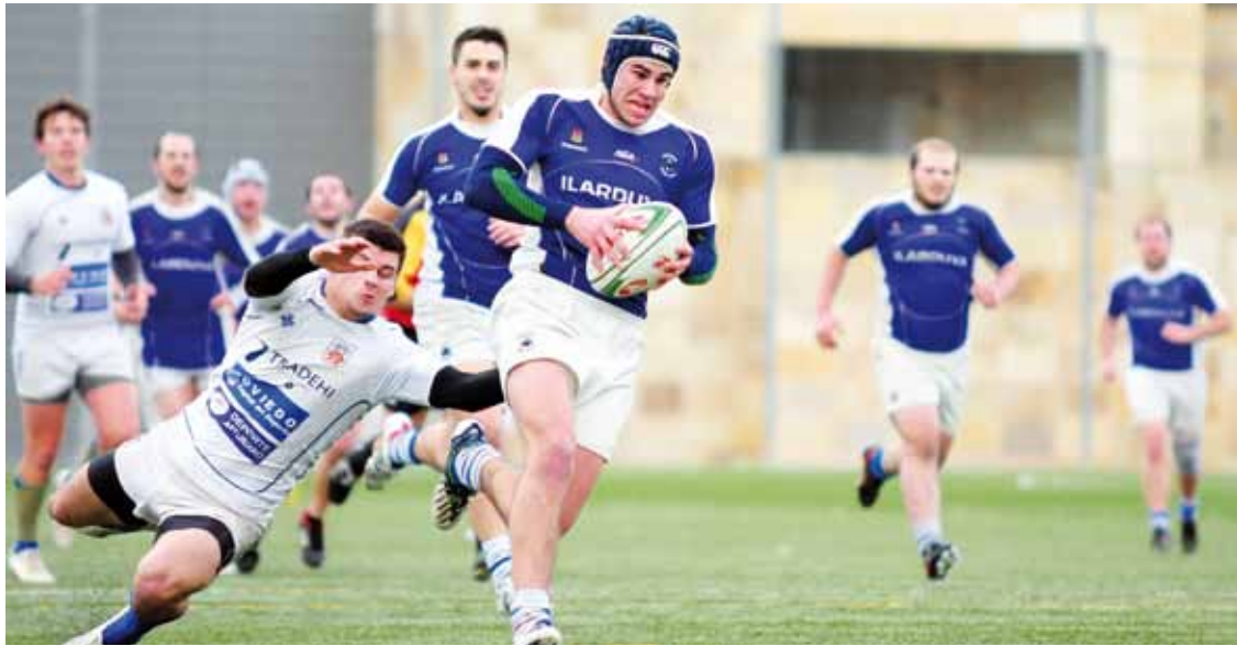
Aurtengo ligan bost garaipen erdietsi ditu DRTren lehen taldeak.