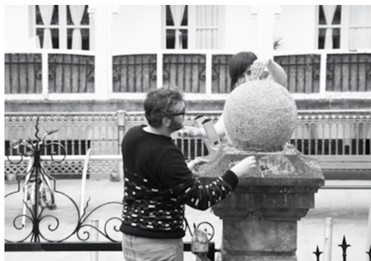
Bi orduz jardun ziren artistak ekintza hori plazaratzen.

Durungaldeko hiru artistaren ekintza artistikoa