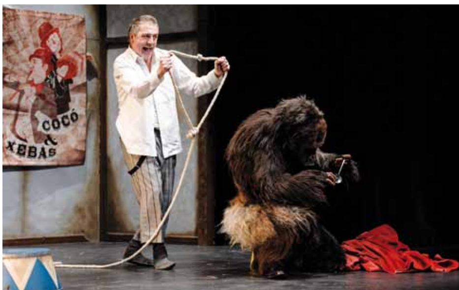
Gorila hezi guran, Cocó eta Xebas izango dira gehien ikasiko dutenak.

Bai, horrela da. Umeak helduekin etor daitezela da nahi duguna: umeak amagaz, aitagaz edo aiton-amonekin istorio horiek partekatzea gura dugu. Oso aberasgarria eta oso polita da hori.