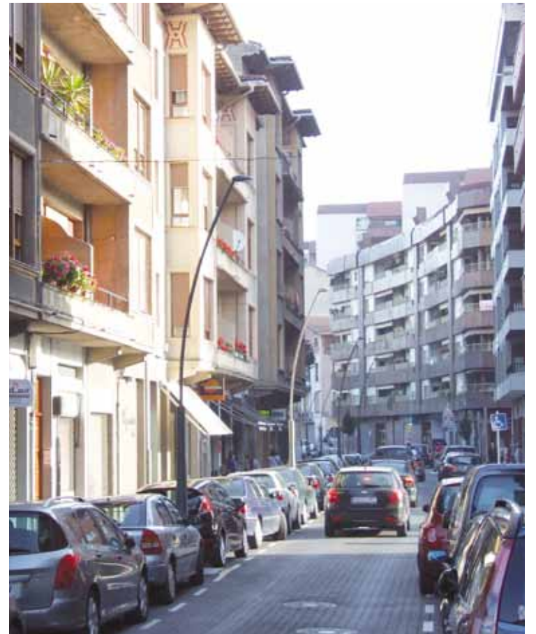
Luis Urrengoetxea kalean ospatuko dute Txakolin Eguna.

Txakolin Eguna girotzeko hainbat ekintza prestatu dituzte. Goizean trikitilariak, txistulariak, umeentzako jolasak eta herri kirol erakustaldiak egongo dira. Iluntzean, aldiz, Galdakaoko Oxabi erromeria taldea kalean zehar ibiliko da musikagaz giroa alaitzen.