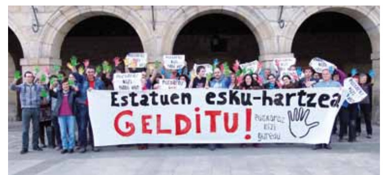
Eskuak margotuta eta gelditzeko keinua eginda egin zuten elkarretaratzea.