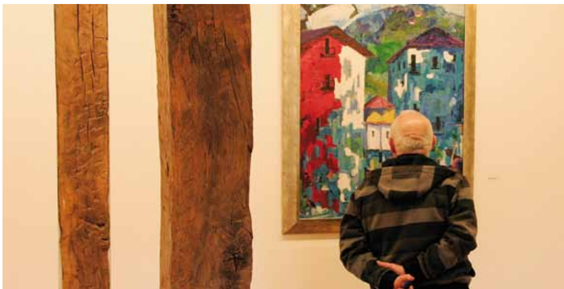
Baztango (Nafarroa), Lapurdiko kostaldeko eta Durangaldeko paisaiak agertzen dira koadroetan.

Hastapenetan inpresionismo gerturatu zen Xabier Soubelet, baina laster Cezanne margolariaren jardunak eragin zuen bere margotzeko eran. Gaur egun espresionismoaren bidean doa, espresionismo abstraktutik gertu dihardu, eta kolorea da bere konposizioetako oinarritzko elementua: ahalik eta kolore puruenak, bizienak, primarioenak bilatzen ditu.