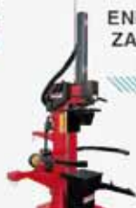
ENBORRAK ZATITZEKO MAKINA