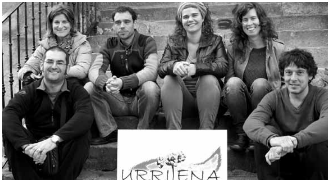
Urrijena antolatzeko talde berria osatu dute, eta logotipo berria ere sortu dute jairako.

“Iurretako dantzari guztien jaia” antolatzen dabil Urrijenako batzordea; herriko emakume dantzarien artxiboa sortzen hasi dira, eta laguntzeko deia egin dute