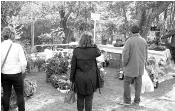
laz arrakasta eduki zuen Landare Azokak.

Landare Azokaren bigarren edizioa antolatu dute domekarako; 23 postu ipiniko dituzte herrigunean