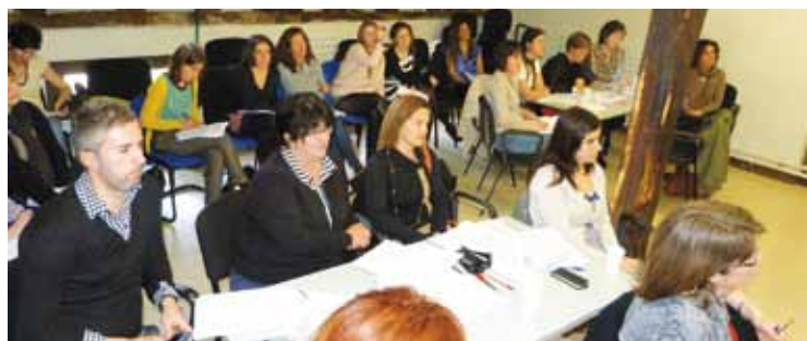
Tailerreko partaideak, Pinondo Etxean.

EUDEL-en tailerrean 35 ordezkari egon dira