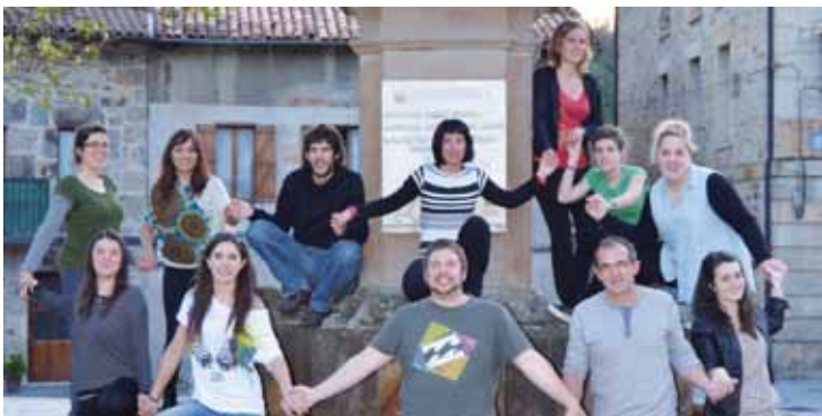
Askotariko ideologiak batu gura dituzte erabakitze eskubidearen aitzakian.

herrian, eta astelehenero batzen dira, 20:30ean, gaztetxean. Herriarrei batzarretara joateko gonbita egin diete. Zapatuan, 13:00etan, giza katerako metroak eta kamisetak saldu, eskuorriak banatu eta bideo bat egiteko irudiak grabatuko dituzte plazan.