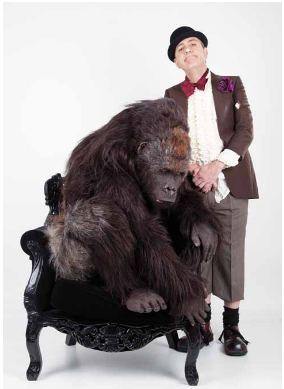
Kibubu gorila eta Xebas dira antzezlaren protagonistetako bi.

Pertsonaiari aurre egitean datza, beti, gure lanaren parterik inportanteena, eta adierazkortasuna lortzean; pertsonaiari keinuak, gorputzaren konposizioa eta mugimendua ematea da garrantzitsua. Hori da gure lanaren ardatza, eta ohituta gaudenez, ezin esan zaila denik. Baina