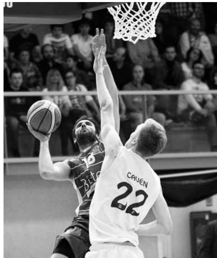
Joan zen asteburuan, Larrean, jokatu duen partiduko une bat. Kepa Aginako.

Euskadi mailako Lehen Mailan Tabirako Baqueren gizonen taldea playoff postuan dago liga amaitzeko bost jardunaldiren faltan. Baina ez dago ezer ziurtatuta, talde asko daudelako garaipen baten barruan. Zapatuan, 19:00etan, Fundación Baskonia arerio zuzena hartuko du Landako kiroldegian.