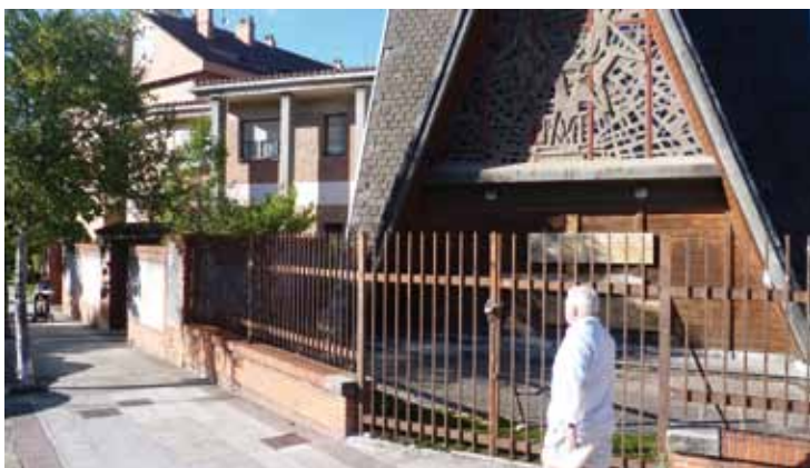
Salesen komentua urri hasieran okupatu zuten, Galtzaretan kalean.

Ondoren, udalak eta elkarteak prestatutako bina sari zotz egingo dituzte bertaratzen direnen artean. Segidan, briska txapelketako sari banaketa egingo dute. Musikagaz amaituko dute domekako ekimena.