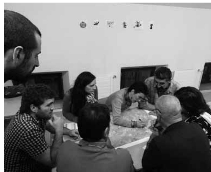
Batzarretan 30 bat lagun inguruk parte hartu dute.

Harrobi zaharrak herriarentzat berreskuratu daitezkeela uste dute, funtzio berri bat emanez