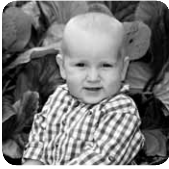
> Zorionak Lier! Urtetxo bat egingo dozu zapatuen, beraz, prestatu txokolate berue! Mosu potolo bat!