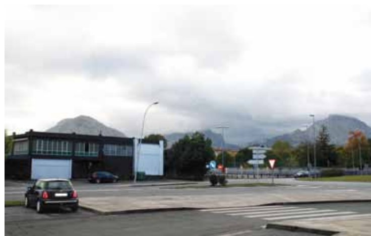
McDonald' sek bi pisuko hanburgesategia zabaldu gura du Abadiñon.

tasunaren defentsan bultzatu dituen ekimenekin. Lizentziak prozedura arautuak direla gogoratu du, eta enpresa horiekin beste edozein kasutan aplikatzen den prozedura jarraituko duela.