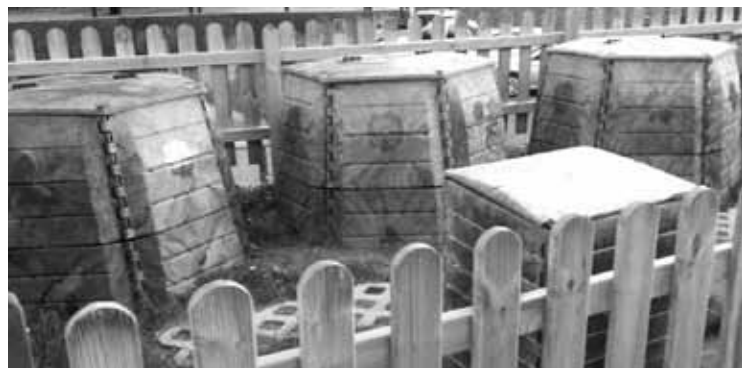
Familiek etxeetan sortzen dituzten hondakinen %40 inguru materia organikoa da.

Autokonposta edo auzokonposta erabiltzen duten mallabiarrek %15eko hobaria izango dute zaborraren tasan.