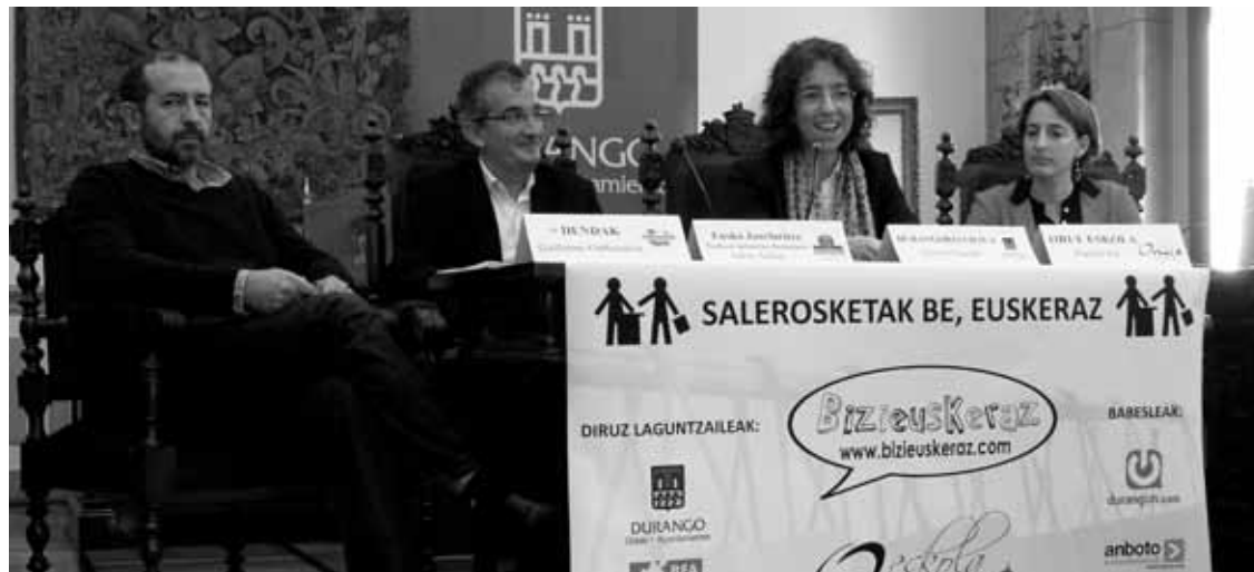
Oarbeaskoa, Azkue, Irigoras eta Iza prentsaurrekoa ematen, udaletxean.

‘Salerosketak be euskeraz’ kanpainara merkatari gehiago batu gura dituzte