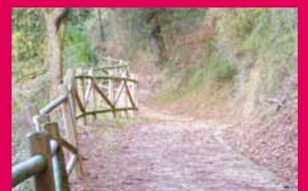
Bidegorria San Pedro Legañoa bidean.