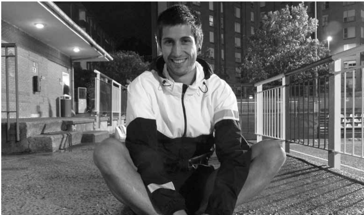
Joan zen asteburuan laugarren urtez segidan irabazi zuen Soraluze-Bergara lasterketa.