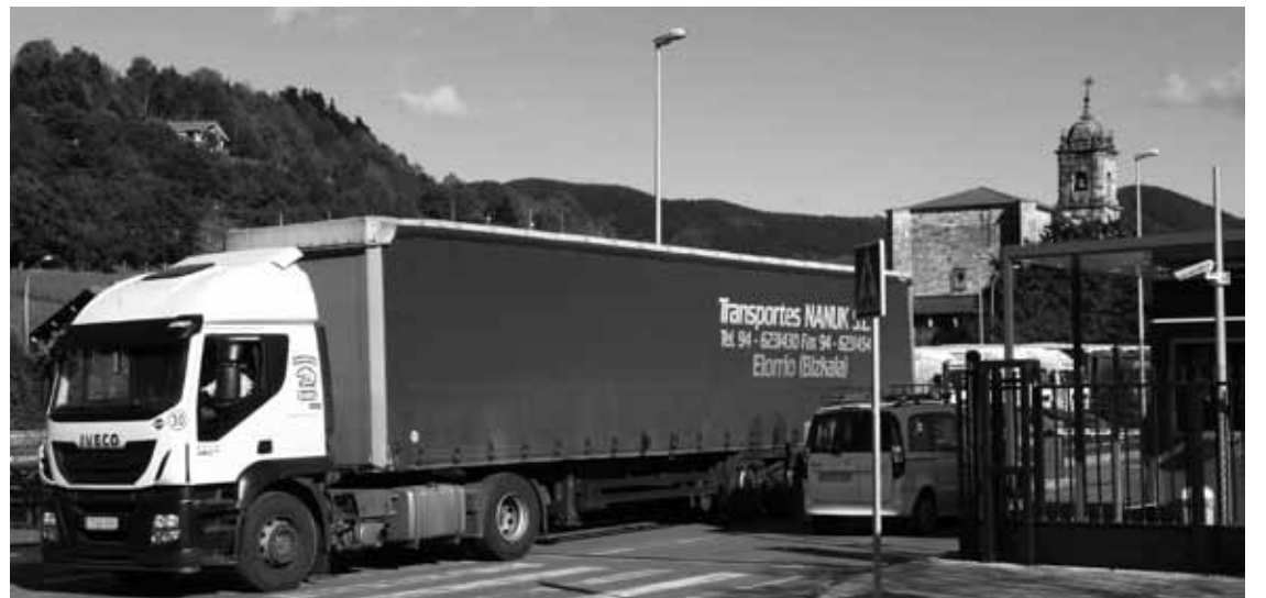
Transportes Nanuk enpresako beharginak lanera bueltatu dira, akordioa lortu eta gero.

63 egun eman dituzte greban grebalariek. 90 lagun inguruk osatzen dute lantaldea, eta horien erdia egon da greban. Enpresak %4ko soldata jaitsiera ezarri zien, eta aparteko sari batzuk ere ordaindu barik zeuzkan. Horregatik eta enpresa hitzarmen baten alde hasi zuten