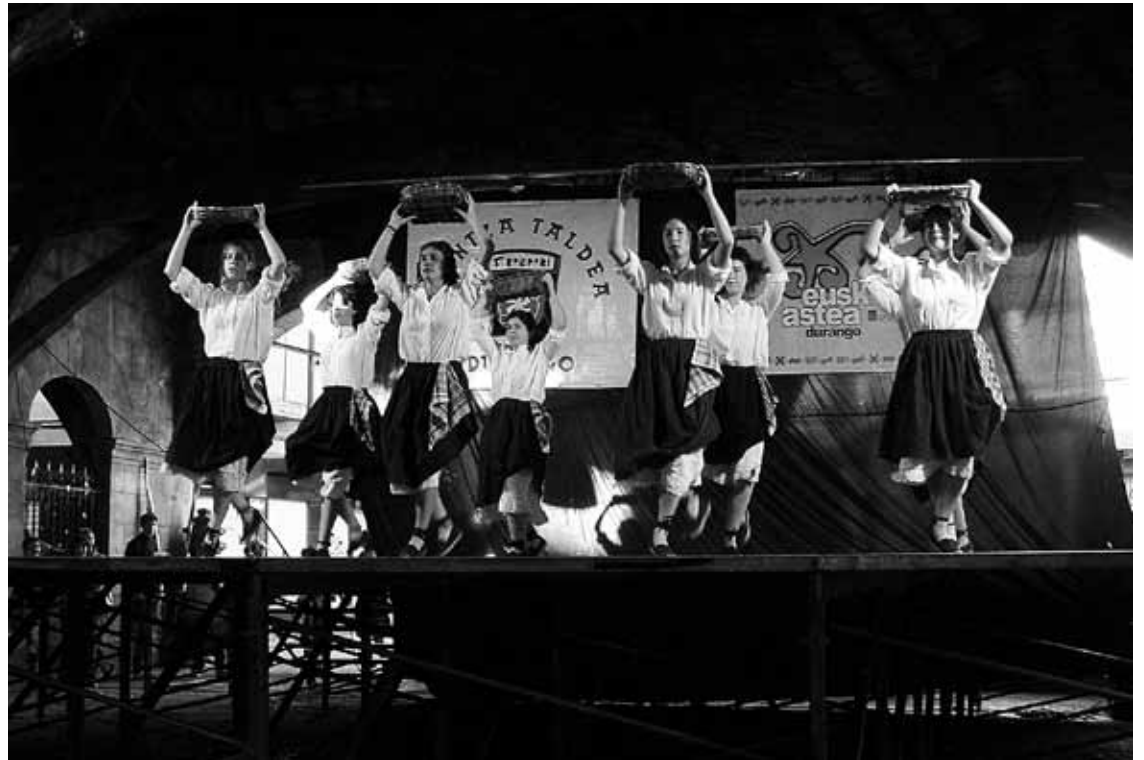
Ehun dantzari baino gehiago batuko dira Durangoko Ezkurdi plazako ekitaldian.

Emanaldiaren parte bien artean txalaparta emanaldi labur