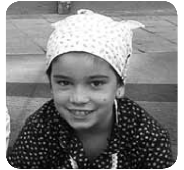
> Zorionak neskatilla! Mosu handi bat etxekoen, Anartzen eta Iurretako laguntxo danen partez!