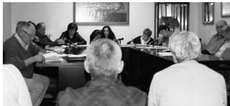
Gaia udalbatzarrean eztabaidatzea eskertu zuten elkartekideek.

Elkarteak aurkezturiko mozioaren alde Bilduko sei ordezkariak egin zuten, kontra bozkatu zuten PP eta PSE-EEko ordezkariak, eta abstenitu egin zen EAJ.