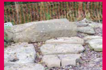
San Pedro Legañoiko gunea hurretik.