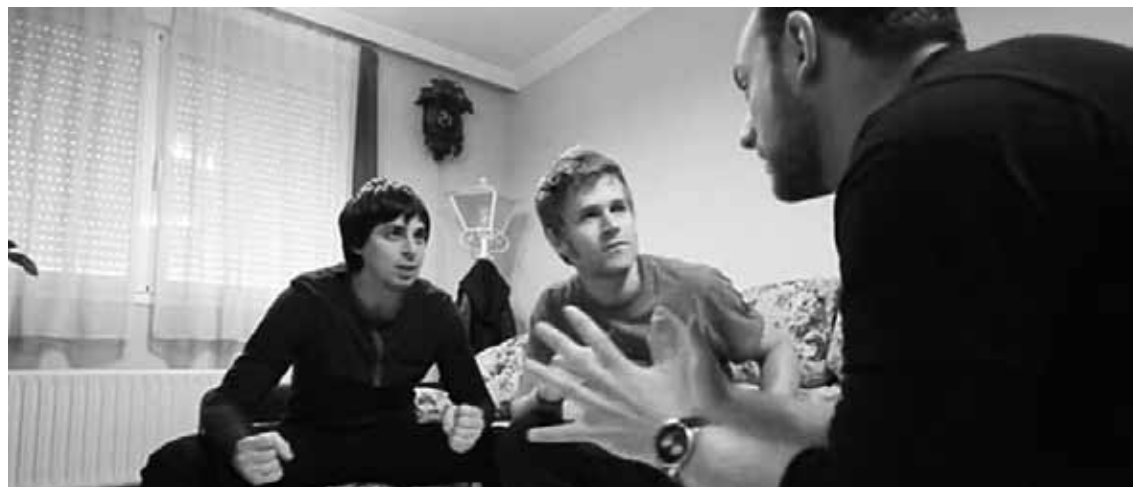
Elorrioko Arriola antzokian burutu zuten sari banaketa ekitaldia.

Parte hartu duten 16 taldeetatik erdia baino gehiago Elorriokoak izan dira