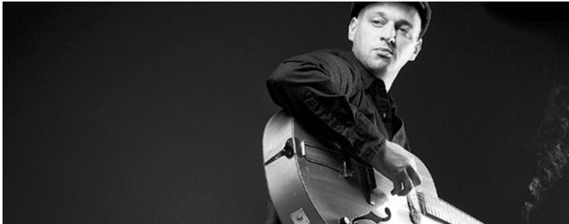
Little G. Weevil blues sortzailea gonbidatu dute azaroaren 16rako.

Elorrioko Ateneoan izango da lehenengo kontzertua, azaroaren 14an