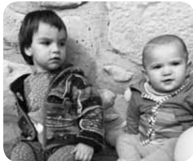
> Garazi eta Aiur lehengusuek urteak bete dabez. Zorionak eta patxo potolo bana etxekoen partez!