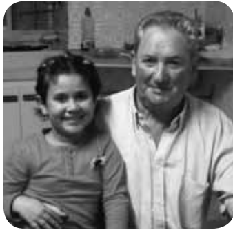
> Zalua , domekan egun zoriontsua pasau San Martingoen partez! Musu handi bat!