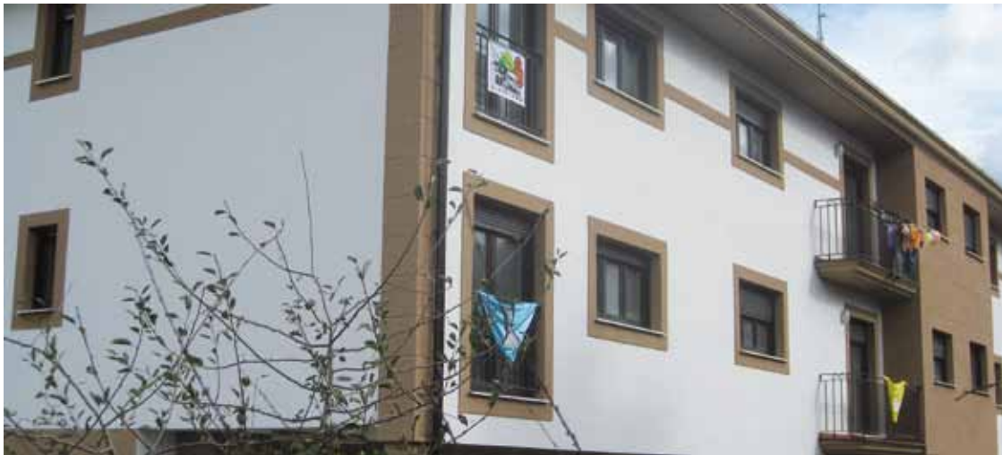
Barraskiko hiru etxe blokeetatik bat okupatu zuten joan zen zapatuan.

Barraskiko etxe bat okupatu dute, Durangoko Salesen okupaziotik hilabetera