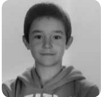
> Elorrixoko mutil guapuenari zorionak danon partez, ta ondo pasau eguna!