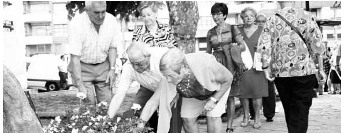
Iazko irailaren 11n egindako lore eskaintza.

Besteak beste, Gemikako bonbardaketa eta osteko erbesteratzea ardatz dituen filma ikusi ahalko da