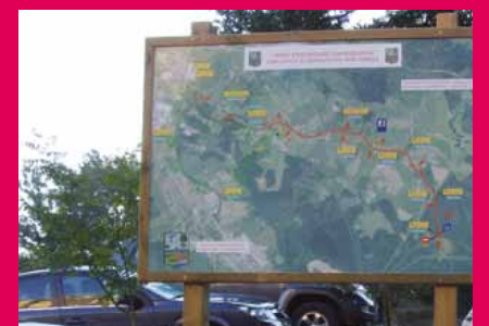
Zirkuitu alternatiboan panela Astolan.