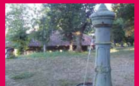
San Martin ermita ondoko iturria.