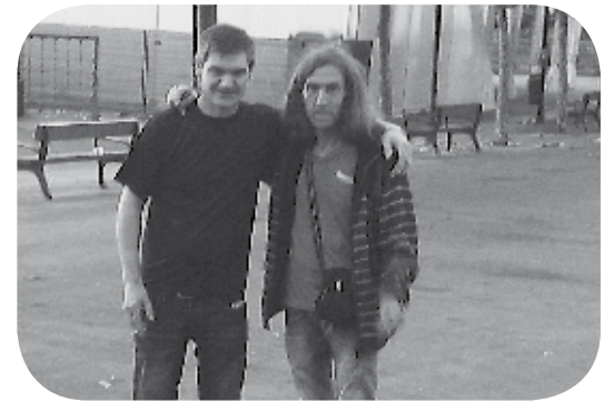
> Gai batzuetan ez dira ados egongo, baina ez euren urtebetetze urtea, ez hilabetea, ez eguna, ez dira eztabaidagai izango: 1960ko irailaren 7a. Zorionak denon partez.