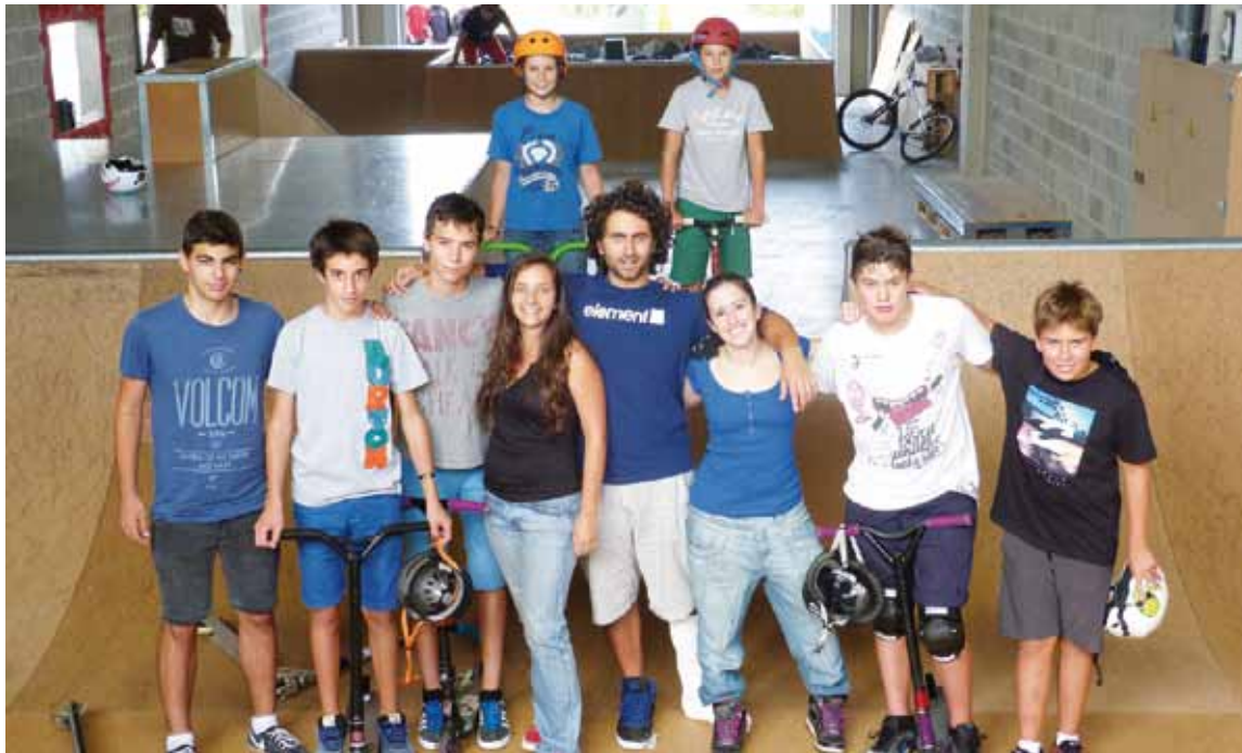
Skate guneko hiru sustatzaileak askotariko arrapalen erdian, gaztetox inguratuta.

Maiatzean inauguratu zuten 500 metro karratudun eremua Aliendalde industriaguneko pabilioi bi batuta