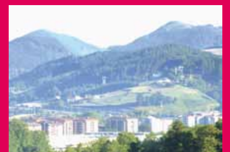
Traña-Matienaren ikuspegia Gazteluatik.