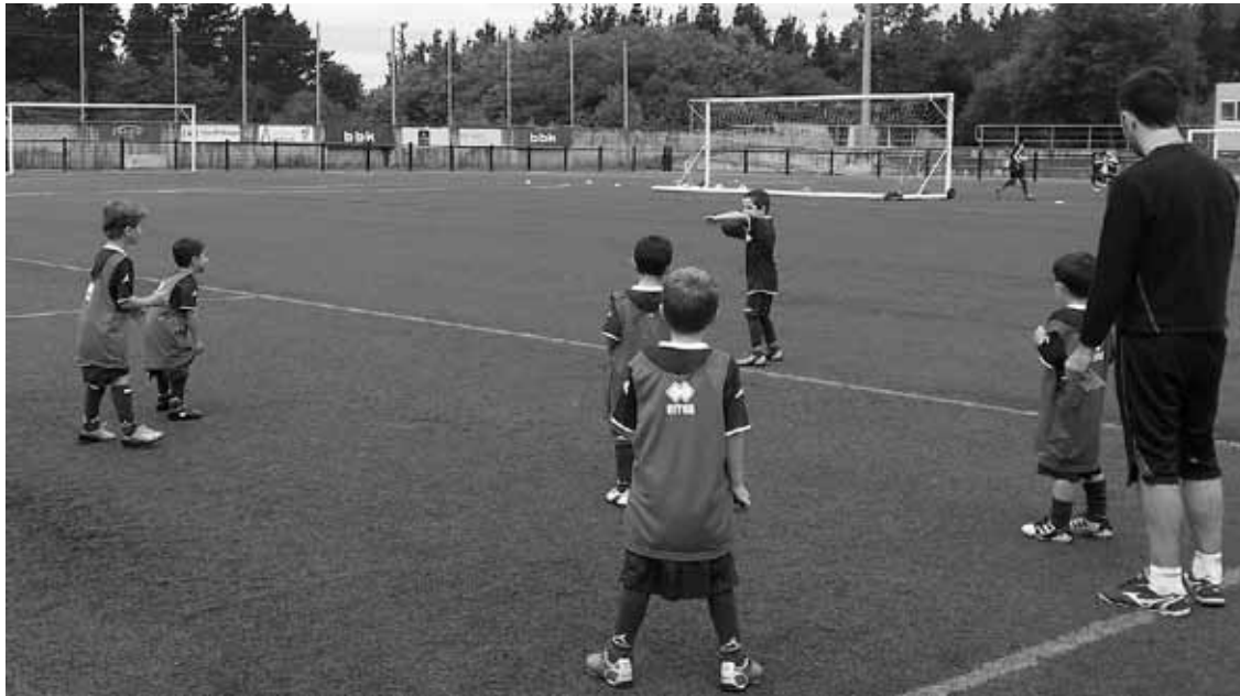
Gertasport-ek antolatutako futbol kanpuseko irudia.

Gertasport elkarteak sortu du, eta 4 eta 9 urte artekoei zuzenduta dago; astean birritan Iurretako Larrakozelaian eta Maiztegiko azpiegituretan batuko dira