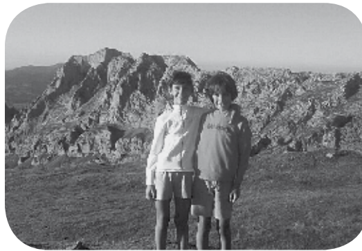
> Zorionak Xixili eta Inaxio etxeko danon partez.