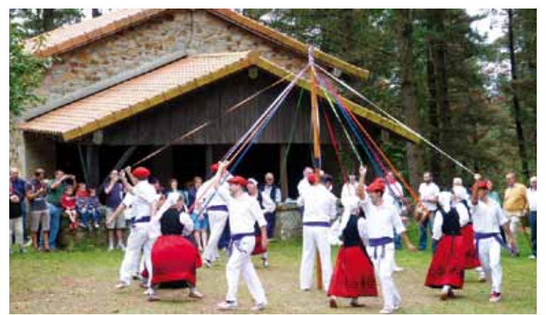
Joan zen domekan Santa Ageda ermitan eskaini zuten dantza saioa.