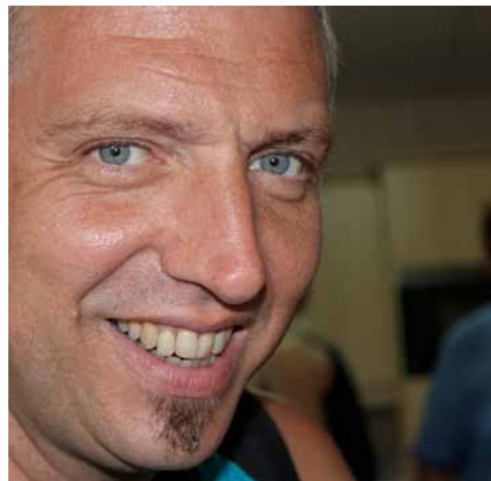
Maiatzean Donostian aurkeztu zuten ikuskizuna, eta datorren urtean estatuan eta nazioartean erakutsiko dute. J.Usoz