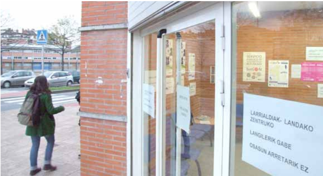
Landakoko larrialdietako beharginek protestak egin dituzte euren lan baldintzengatik.