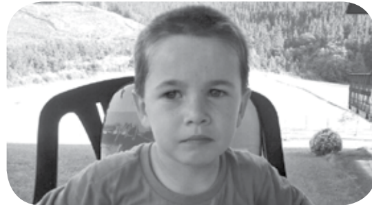
> Gaur, uztailak 19, Aitzolek 5 urte bete dauz! Zorionak mutil handi familia osoaren partez, eta egun ona pasatu!