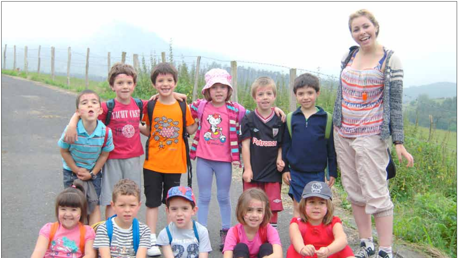
'Enjoy English' programan aurten parte hartu duten gaztetxoetako batzuk, begiraleekin.