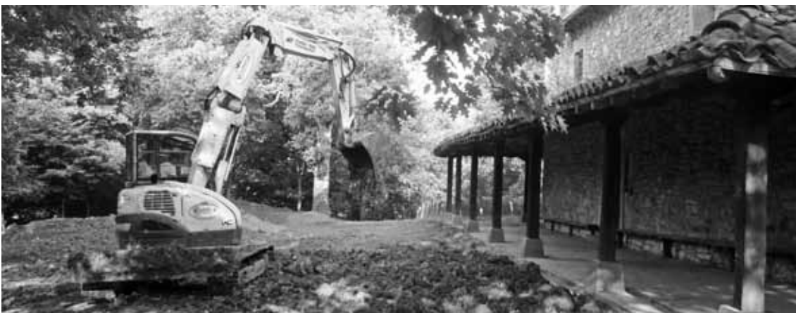
Zuloak tapatzeko lanetan ibili dira egunotan.