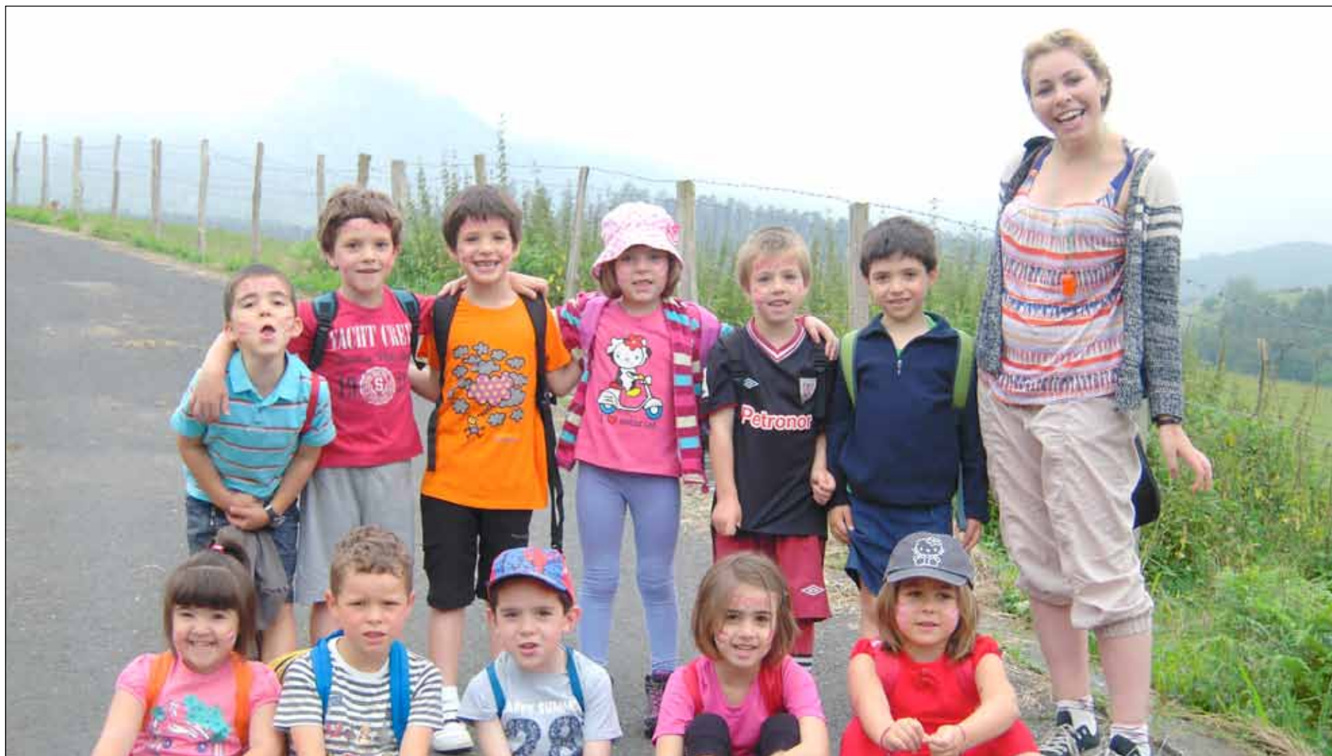
'Enjoy English' programan aurten parte hartu duten gaztetxoetako batzuk, begiraleekin.