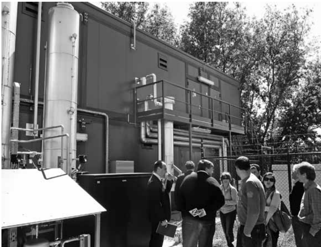
Otxandioko Udaleko, EEKo, Onitek enpresako eta biogas enpresako ordezkariak Herbehereetako planta bisititzen.