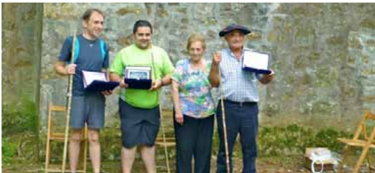
Makilaren inguruko sari banaketaren ondoren, irabazleak euren sariekkin.