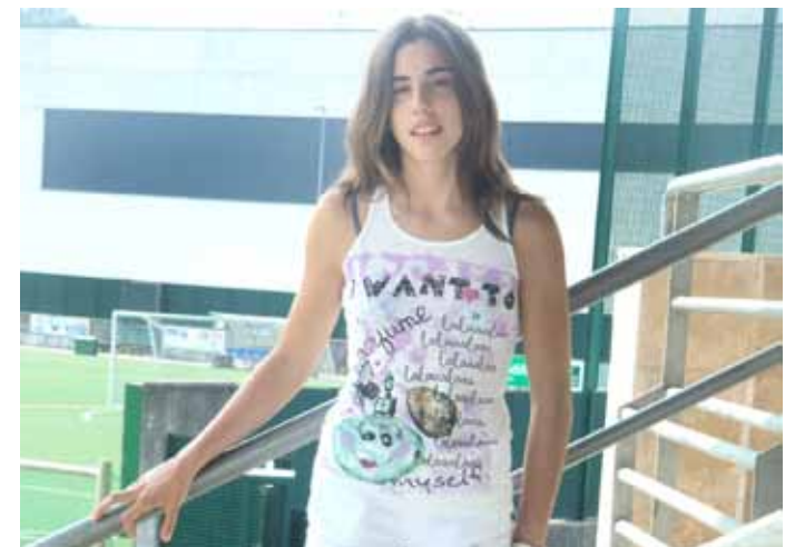
14 urtegaz, lehenengo bider sailkatu da Espainiako Txapelketa lehiatzeko.

50 metroetako gutxiengo marka Getxon lortu zuen urtarrian. Baina distantzia horretako sailkapenagaz bakarrik ezin daiteke joan Espainiako txapelketara. Beharrezkoa da gutxienez beste bat. Horregatik 100 metroetako lortu guran ibili da hil askoan, eta Santurtziko Bizkaiko Txapelketan lortu zuen berau, ekainean. Zilarrezko domina irabazi zuen.