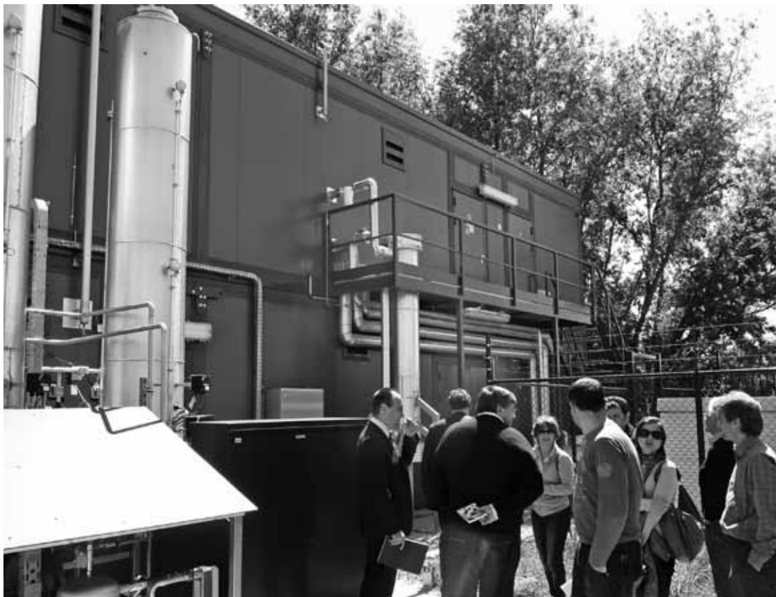
Otxandioko Udaleko, EEEko, Onitek enpresako eta biogas enpresako ordezkariak Herbehereetako planta bisitatzen.

EAJk esan zuen proiektua esleitzeko prozedurako atal batez ez zegoela ados, eta orduko horretan baietz bozkaturiko zuela, baina etorkizunean antzeko kasurik egoten bazen, euren botoa ezezkoa izango