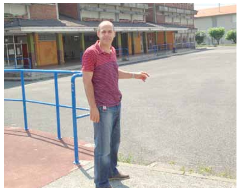
Zoladura berria jarri eta kolore tratamendua emango diote. Iurretako udala.