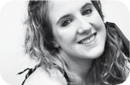
> Zorionak rubia! 21 mosu hippie handi gure kuadrillako printzesa kapritxosientzat. Ederto ospatuko dogu bixer, xalamera!