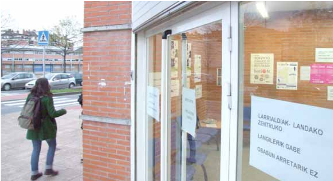
Landakoko larrialdietako beharginen protestak egin dituzte euren lan baldintzengatik.