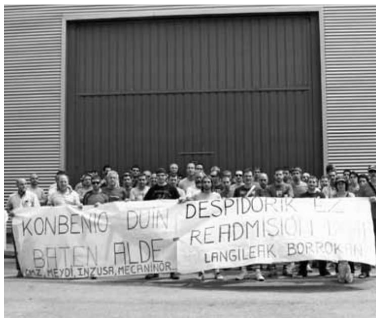
Enpresa aurrean egin dituzte, asteon, langileek mobilizazioak.

Langileak greban egon arren, arduradunek produkzioarekin jarraitu gura izan dutela eta horrek greba eskubidea urratzen duela ere salatu dute.