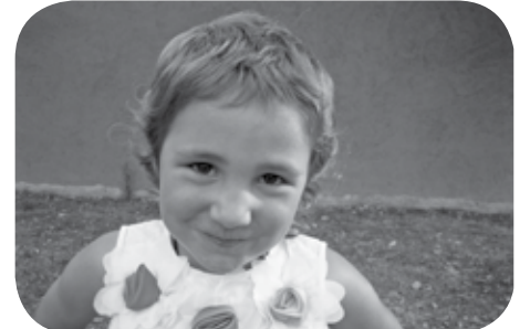
> Uztailaren 21ean ospatuko dogu Maierrren 4. urtebetetze. Maitte zaittugun guztixon partez, ZORIONAK!!