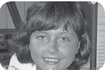
> Zorionak Narrea! Uztailaren 30ean 9 urte beteko dituzu. Ondo pasatu Beko-Errotako familia osoaren partez. Mua!