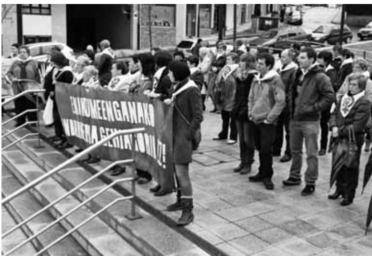
Udaletxeko balkoian gaitzespen pankarta ipiniko dute eraso berri jasotzean.

Udalbatzari aurkeztu zioten proposamena, atzo