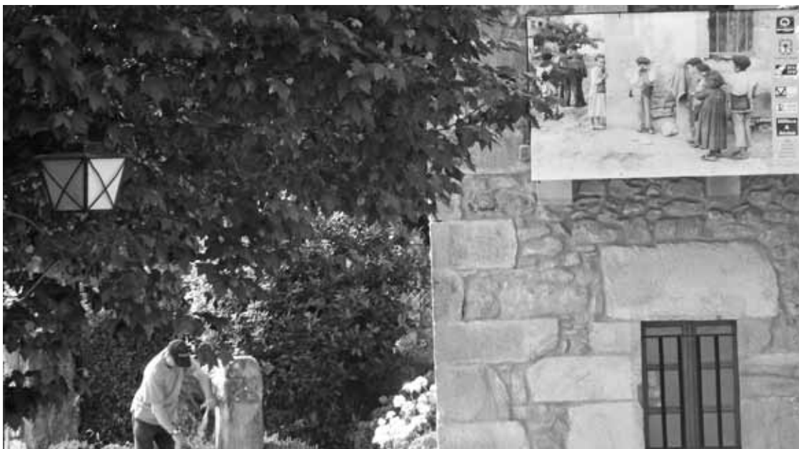
Garaiko etxe eta eraikinetan ipini dituzte argazkiak.