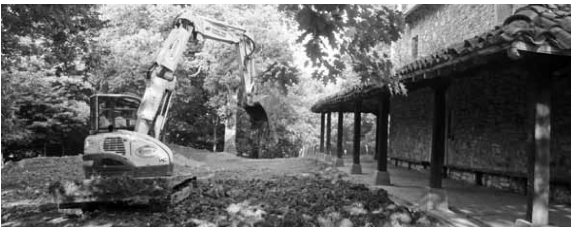
Zuloak tapatzeko lanetan ibili dira egunotan.