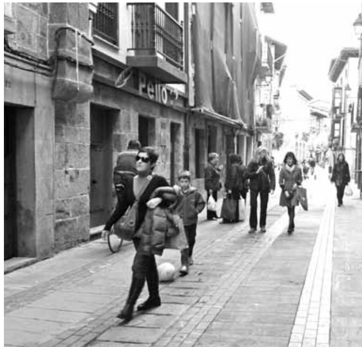
Elorrioko herritarrei gaztelaniaz galdetu dietela kritikatu du Bilduk.