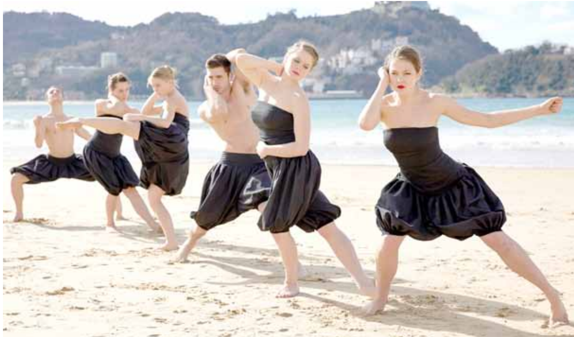
Maiatzean Donostian aurkeztu zuten ikuskizuna, eta datorren urtean estatuan eta nazioartean erakutsiko dute.