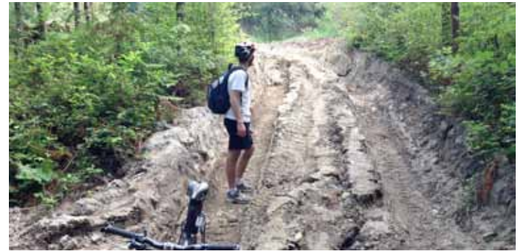
Izurtzatik Mañarira arteko ibilbidean zorua egoera txarrean dago.