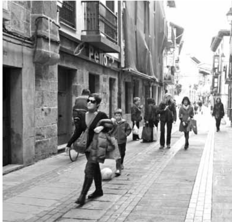
Elorrioko herritarrei gaztelaniaz galdetu dietela kritikatu du Bilduk.