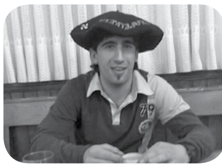
> Zorionak Badi! Guardiatxuko basurde nekazaina. 31 urte eta ondiño pelotan tinko! Bixerko bazkarixe zeure kontu!