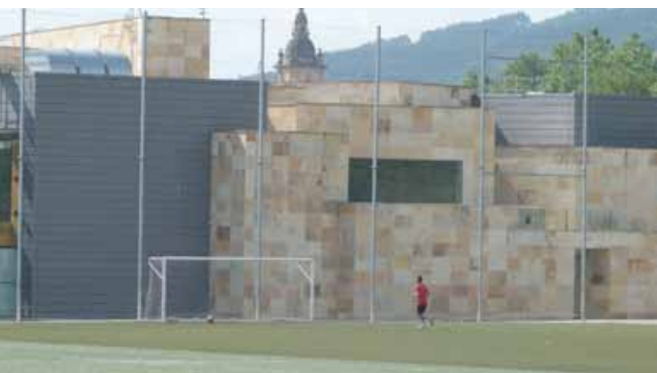
Belar artifizial berria ipiniko dute futbol 7ko zelaietan.