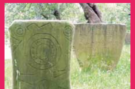
Baseliza ondoko hilobiak.