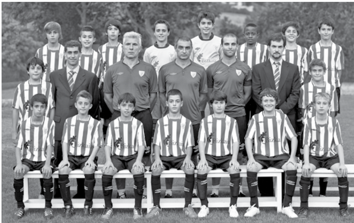
Athletic Clubeko gaztetxoak dira txapelketan parte hartuko dutenetako batzuk.

Guztira, zortzi talde lehiatu dira: tartean daude, Durangoko Kulturala, Athletic eta Aurrera Vitoria