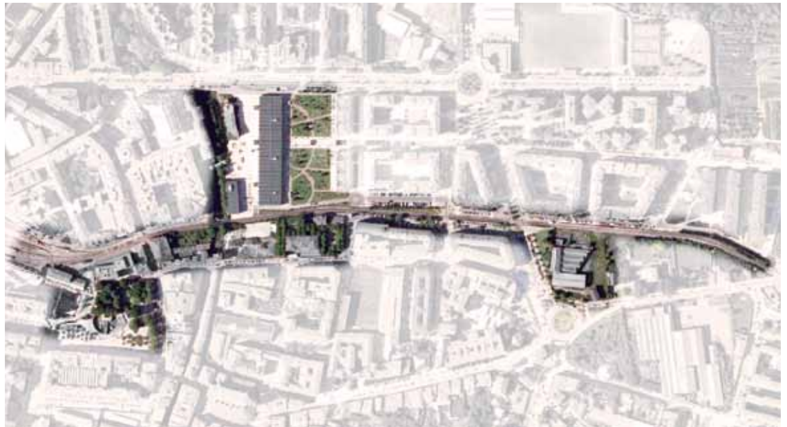
Ikasleek trenbidean proposatutako etorbide edo parke luzea.

EAEko herrietan ez ei dago halako parke luzerik. Gune desberdinak izango lituzke: kioskoak, wifi guneak, rokodromoa, jateko mahaiak... Musika Eskola eta Landako artean, aire zabaleko espazio eszenikoa eraikitzea proposatu dute, esaterako.