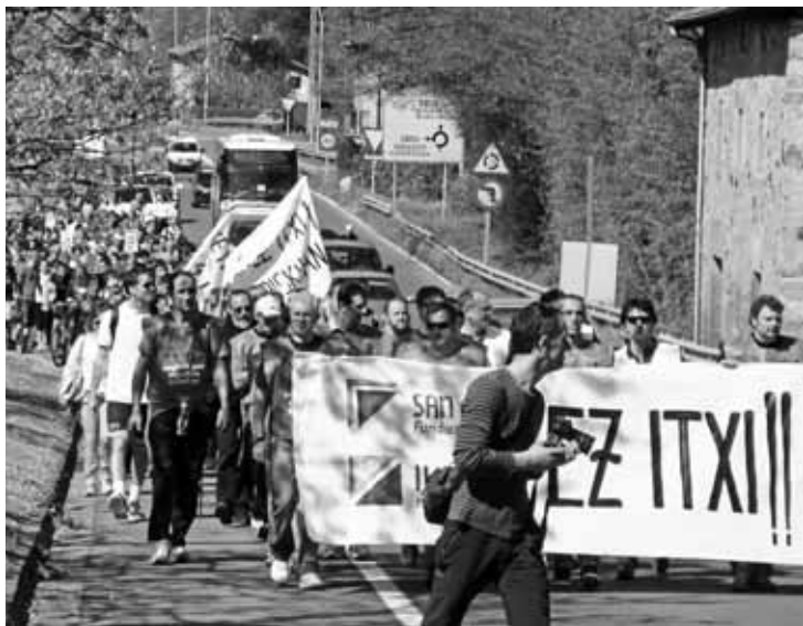
Iketz eta San Eloyko beharginak, protesta batean.

Oraindik zehaztu gabe dago inbertsoreak San Eloyrako duen eskaintza