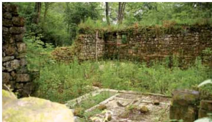
Azken urte bietan dirulaguntza barik, gelditu egon dira arkeologia lanak.

Lanak gelditu ez egoteko dirua ipiniko du urtero