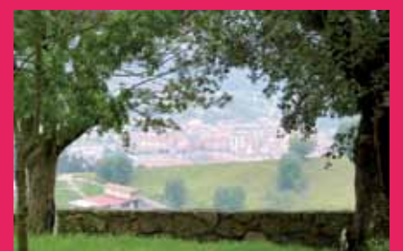
Durangaldearen ikuspegi paregabea.