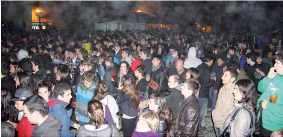
Zapatu gauean Multa, Inedituak, Katekesis eta Eromen taldeek kontzertua eskeiniko dute.

Bihar arratsaldean grabatuko dute, Izar Gorriren urteurreneko abestiarekin