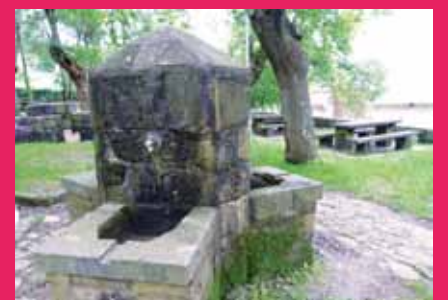
Iturria eta mahaiak, basiliza alboan.