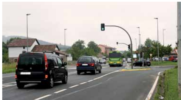
Oso tarte laburrean hainbat semaforo ipini ditu Bizkaiko Aldundiak.

Hainbat herritarrek helarazi dituzte Muntzaraz auzoko semaforo berriei buruzko kexak udalera