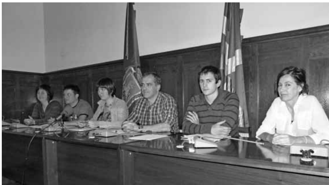
Bildu udal taldeko zinegotziak, martitzenean, udaletxean emandako prentsaurrekoan.