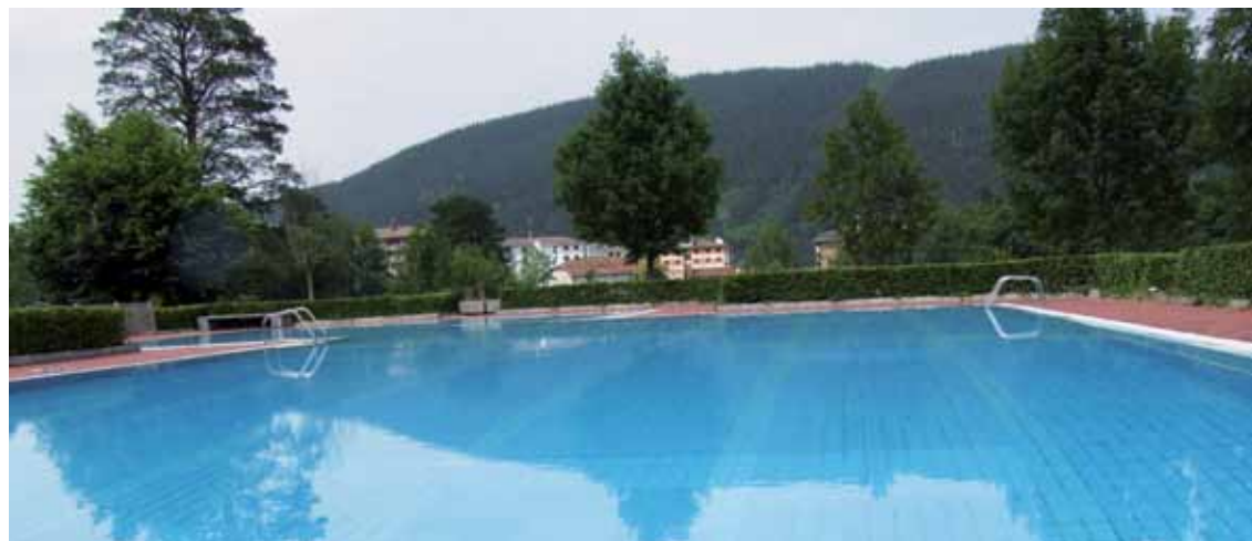
Igerilekuak ekainaren 15ean zabalduko dituzte, denboraldia hasteagaz batera.

Igerileku bietan ur-ihesak konpondu dituzte aurten ere brigadako langileek