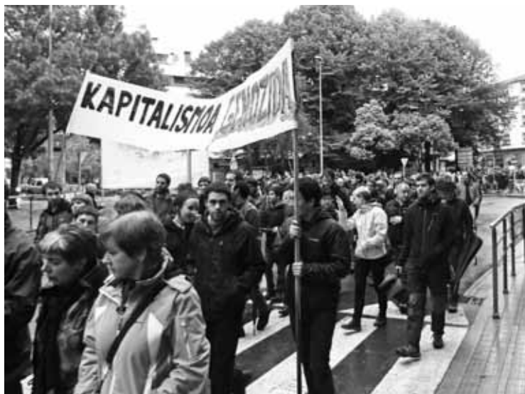
Goian, atzo, Elorriko manifestazioa. Behean, Durangoko protesta ekitaldia.