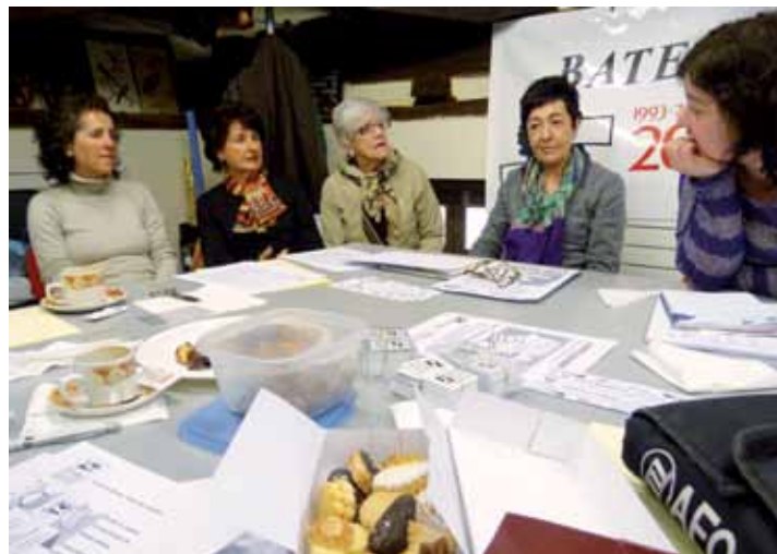
Bateginez GKEko kideak, astelehenean, prentsaurrekoan.

Bateginezek hogeitauko urte bete ditu, eta bertako kideek beharrean jarraitzeko asmoa agertu dute