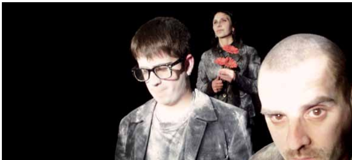
'¿...y lloverá?' antzezlanaren aurkeztu zuten iaz, Banarteren antzerki tailerrekoak.