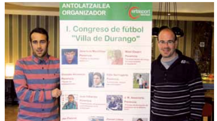
Antolatzaileak, Durangoko Gran Hotelen egindako aurkezpenean.

Izen-ematea zabalik dago ekainaren 5era arte (90 euro, zapatuko bazkari barne). Modu bitara egin daiteke: gertasport@gmail.com helbidearen bidez edo 717 166 845 telefonora deituta. Informazio guztia eskuragarri dago euren webgunean: www.gertasport.com .