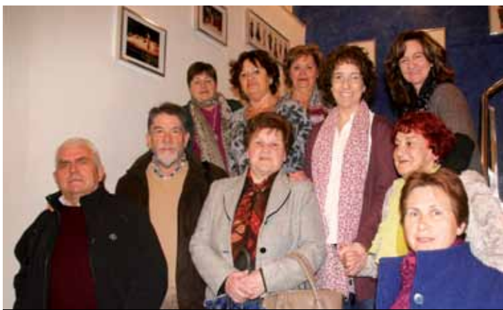
Maiatzaren 31n, Durangoko San Agustinen

Ekainaren 7an, 19:00etan, Kalejira. 19:30ean, IV. Peter esku pilota jaialdiaren finalerdiak , Ezkurdiko Jai-Alai pilotalekuan.