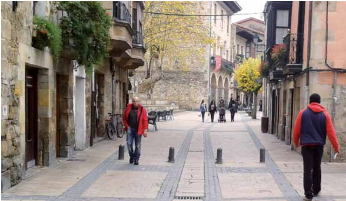
300 herritarri inkesta egingo die udalak, eskaintzen dituen zerbitzuen inguruan.

Udalak inkesta egingo die 300 herritarri; ekainean egitea aurreikusi dute