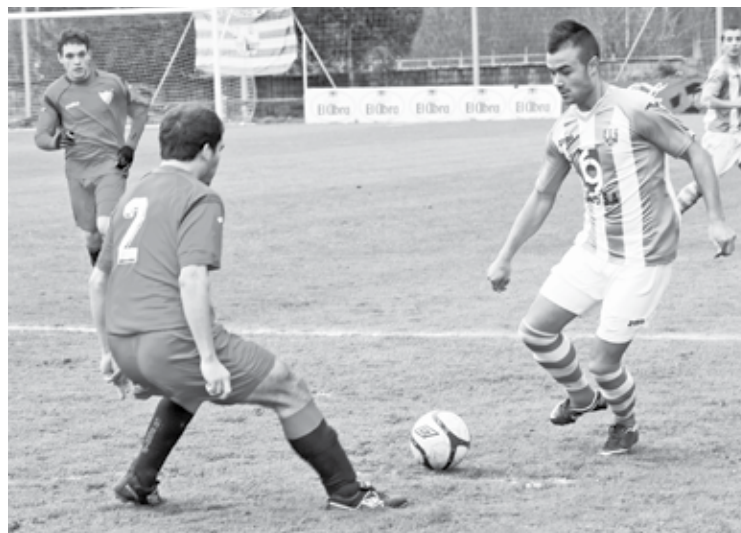
Abadiñok eta Berrizek aurtien jokatu duten derbiko une bat. Zaldua Fuertes

Areto futboleko Presion Breakek igoera promozioa segurtatu dezake, eta Sapuberri eta Elorrio B igotzeko aukerekin daude. Sasikoa Bk eta Gu Lagunak-ek ez jaisteko borrokan segitzen dute.