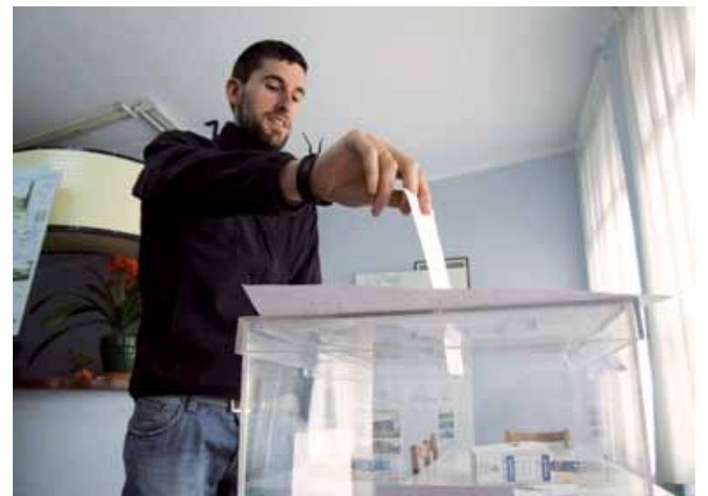
Izurtzarrek euren iritzia eman ahal izan zuten apirilaren 27ko herri galdeketa.

Funtzionaltasunean, ingur- ruagaz duen erlazioan eta ener- gia eraginkortasunean jaso du irabazleak puntuaziorik altue- na. Atal horretan azpimarratze- koak dira berokuntza zoru erra- diatzaileagaz izango duela eta biomasa galdara zentralizatua. Isolamendu termiko handia du.