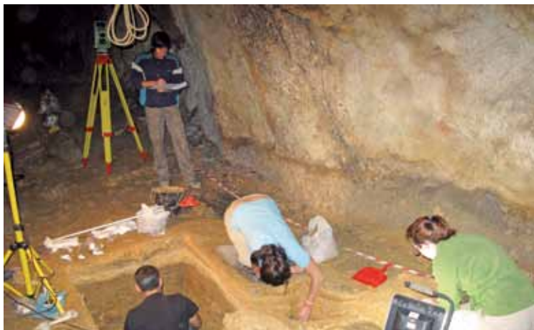
Askondoko koban topatutakoak berba egingo dute egunean.