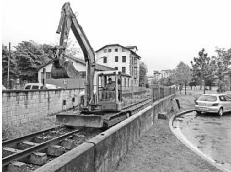
Asteon hasi dira pasabide berriak zabaltzen ETSko beharginak.

Polemika egunez egun handitu zen joan zen astean. Eguaztenean, 30 bat herritar pasagune berri bat egiten ahalegindu ziren Uribarri eta Landako artean. Eguenean, ekintzaileei elkartzatuna adierazi zien EH Bilduk, eta EAJri "utzikeria" egotzi zion: "Agerian geratu da udal gobernua kezkatuago dagoela irudikeriagaz, herritarren beharrianak konpontzeagaz baino". Barikuan iragarri zuen Irigora-