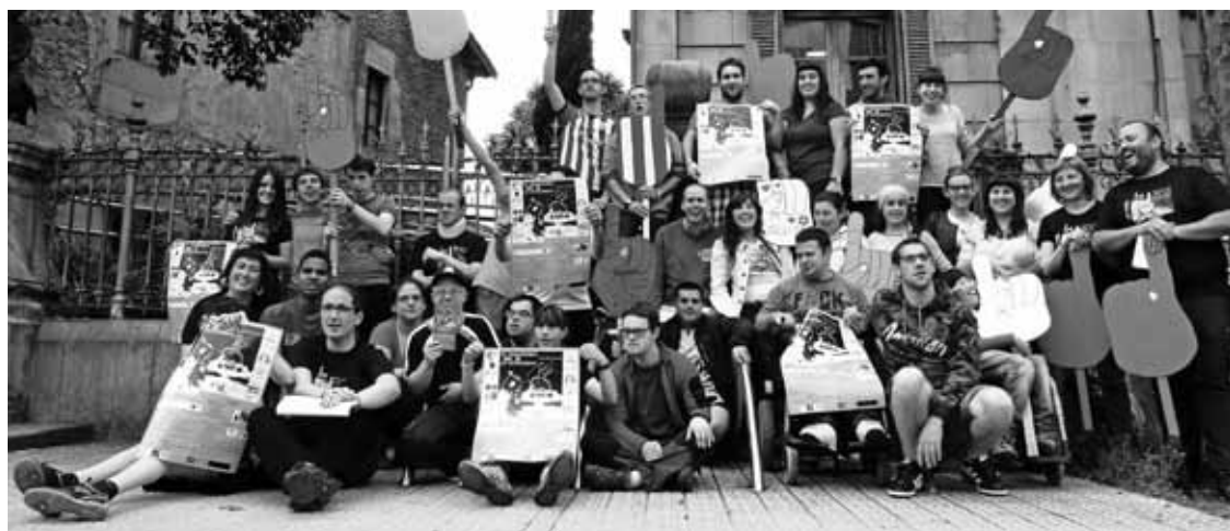
Geu Be elkarteko kideak, martitzenean, euren egoitzaren aurrean.

Datorren asteburuan ere ekitaldi ugari izango dituzte. Barikuan, esaterako, Mendibil eta Jasokunde abesbatzek kontzertua eskainiko dute, eta zapatuan, mendi lasterke-ta herrikoia egingo dute.