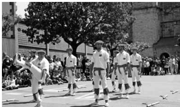
lazko San Trokaz eguneko ezpatadantzarien saioa.

Maiatzaren hirugarren eta laugarren asteburuetarako ere egitarau zabala daukate: Oskorri eta Willis Drummond musika taldeen emanaldiak, esaterako.