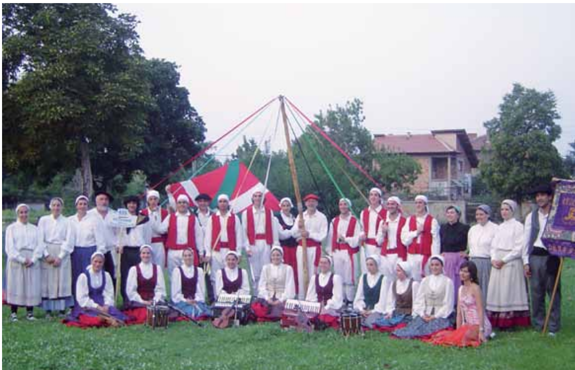
Hainbat dantza estilotako ikuskizunak izango dira De Norte a Sur, Kriskitin eta L'Atelierren eskutik.

De Norte a Sur, Kriskitin eta L'Atelier dantza taldeek dantza emankizunak eskainiko dituzte Ezkurdin