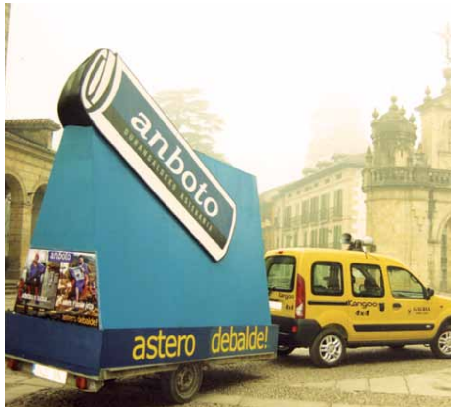
Badira hamaika urteik gora Erazen erreleboa hartu eta lehenengo Anbotoa kaleratu zela. Anbotora ez bazoaz Anboto etorriko jatzu zioen hasierako leloak.