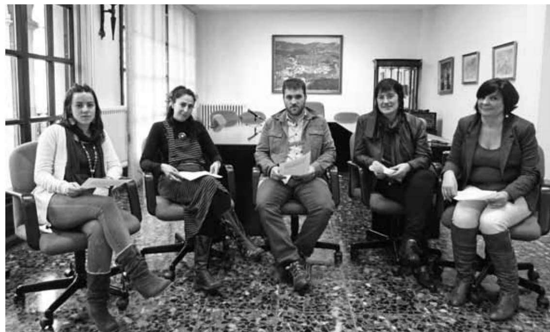
Bilduko alkate eta zinegotziak, Zaldibarren, atzo eskainitako prentsaurrekoan.

nera, ez dute prozesua gogoko: “EAJk ez du herritarren proposamenak ezagutzeko ahaleginik egin”. Euren ustez, Aldundiaren ereduari jarraitzea proposatu du Amankomunazgoak –Aldundiak gizarte ongizatera 144.000 euro gutxiago bideratuko dituela gogoratu dute–. Zaborrak batzearen gaian, zerbitzua hobetzeko eta “zero zabor”-aren ildotik jotzeko proposamen zehatza egin dutela aurreratu dute.