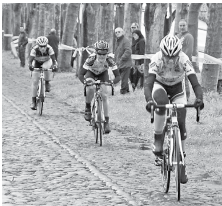
Txirrindulariak Elorrioko harbidean, iazko Bizkaikoloreak lasterketan.

Iurretan hasi eta amaituko den lasterketa Elorrioko harbide bitan sartuko da