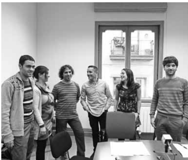
Bildu eta Aralarreko zinegotziak, eguaztenean, prentsaurrekoa eman ostean.

Bilduk eta Aralarrek esan dute EAJk ez diela aurrekontuko soberakinaren gaineko daturik eman; jeltzaleekin batzarra egiteko eskaera erregistratu dute