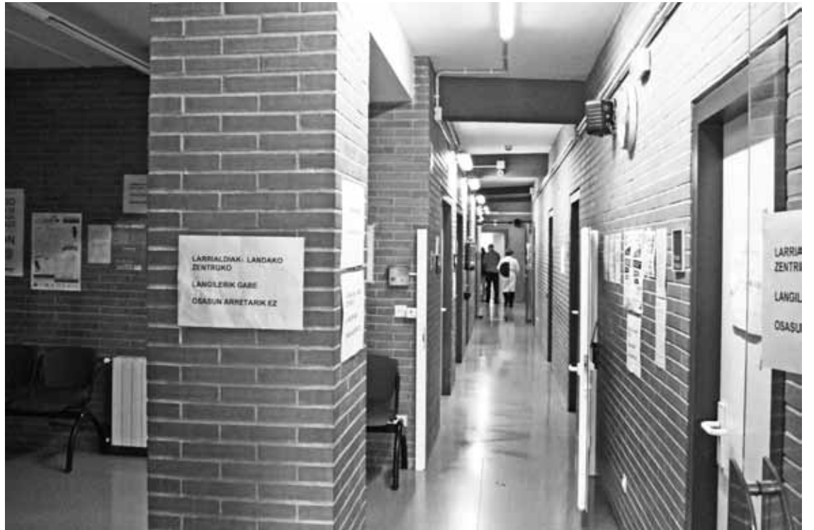
Landakoko larrialdietako irudi bat, zerbitzuetik kanpoko une batean.

Txanda bakoitzeko, mediku bi, erizain bat, jagole bat eta gidari bat egoten dira. Durangaldeko etxeetako abisuak ere hartzen dituzte, eta irteera askotan erizainagaz joaten da medikua. Horrela, Landakon ez da erizainik geratzen gaixoak artatzeko. Azken hilabeteetan, kasu hauetan, erreserban dauden erizain batzuei deitzen diete bertaratzeko. Denbora eskatzen du horrek: “Osasunean denboragaz jokatzeko da. Nolabaiteko konponketa da, ez da erantzun zuzena”. Errefortzu hau irailan jazotako egoera baten ostean ipini zuen zuzendaritzak; Berrizen gertatutako istripu batera irten zuten, eta erizain barik zeudela, gaixo larri bi eto-