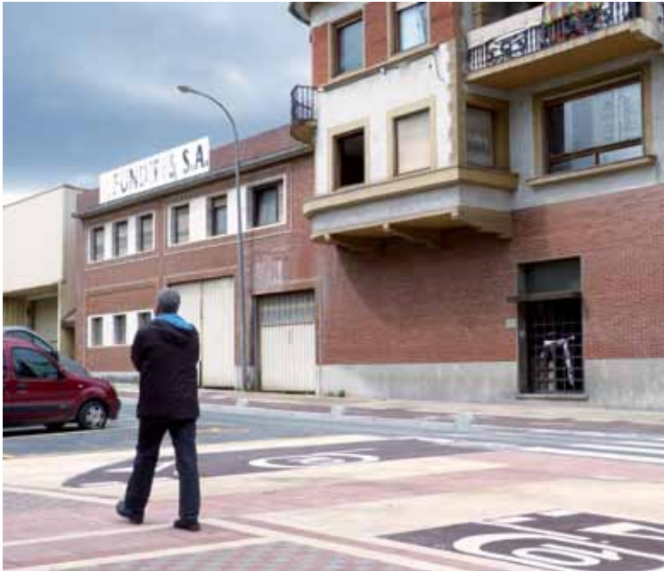
Fundifes enpresako eraikin zaharra zigilatu du udaltzaingoak.