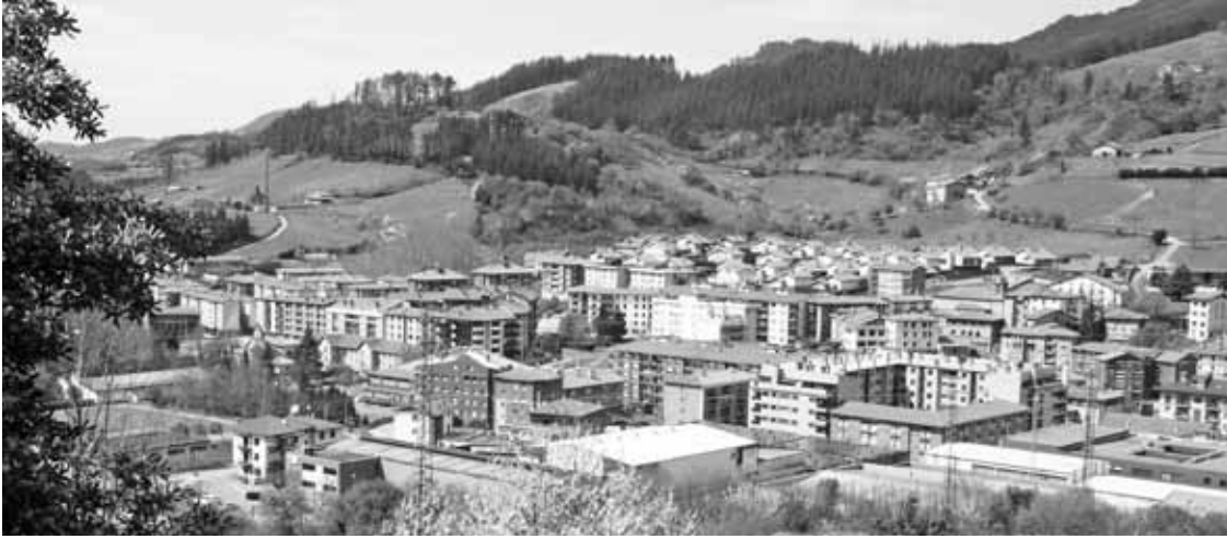
Aldundiak eskura daukan norbanakoen diru kontuen informazioa baliatuko dute zergak betearazteko.

Udaleko lau alderdiek aho batez bozkatu zuten hitzarmena lotzearen alde