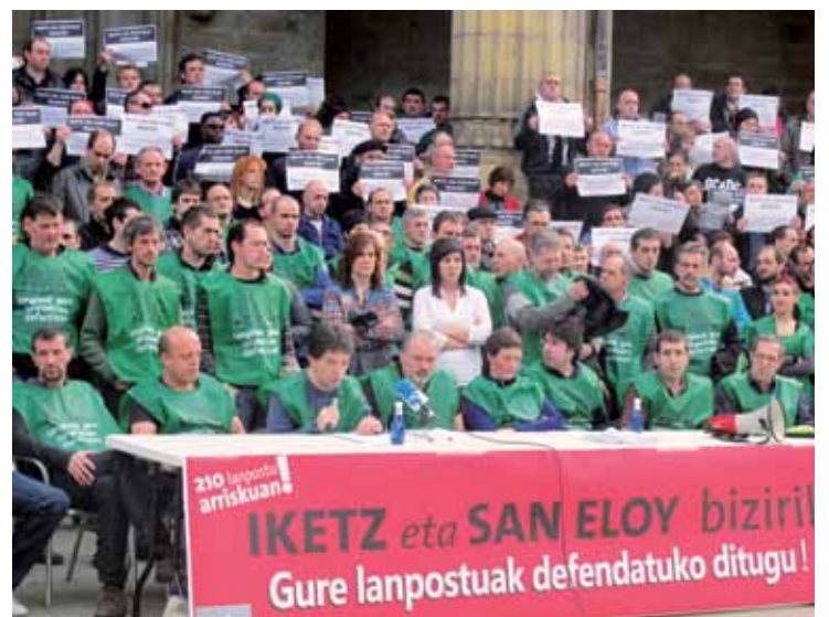
Martxoaren 23an Elorrioren egindako manifestazioa eta prentsaurrekoa.