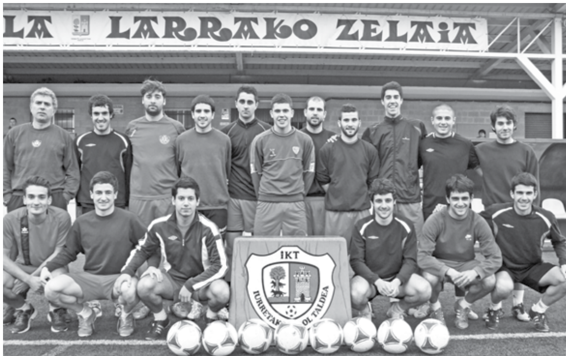
Iurretako eta Kultureko gazteen taldeak eta Abadiño zein Berriztik etorritako jokalariekin talde gazte eta sendoa osatu dute.

Azken aurreko jardunaldian etxean partidurik galdu ez duen Larramendi bisitatuko du Iurretako Bk