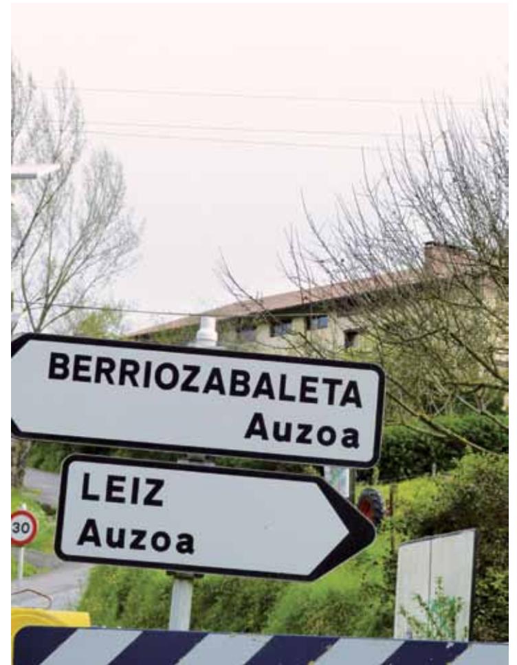
Auzoetako informazioa batuko dute larrialdi taldeen kudeaketarako.

Gainera, landa eremuagaz lotutako beste proiektu bat ere esleituko du: auzo eta baserrien seinaleztapena. Bide-seinaleetan, auzoaren izena eta bertako baserriena agertuko dira. Herriko plazetan ere ipiniko dituzte panelak. Ideia horregaz, herriko zein kanpokoan joan-etorriak erraztu gura dituzte. Proiektu biak batuta, 30.000 euro inguru inbertituko dituzte.