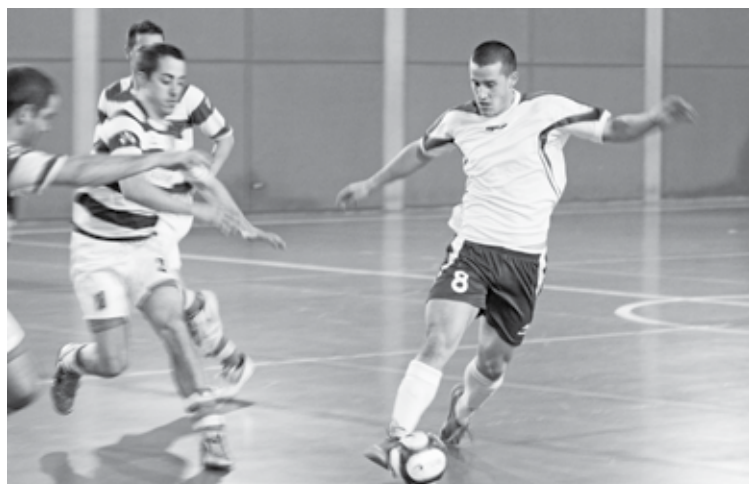
Sapuberri lider egon daiteke, Zamudiori irabazten badio. Zalaa Fuertes

Durangoko Gu Lagunak, ostera, ez jaisteko borrokan dabil maila berean. Jaitsieratik puntu bira daude. Zapatuan, Arabella taldea hartuko dute etxean.