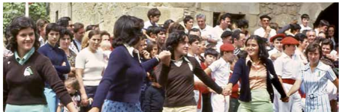
Liburuaren egileak goian, aurkezpene egin ostean, Garain. Behean, liburuan argitaratutako argazki zahar bat.