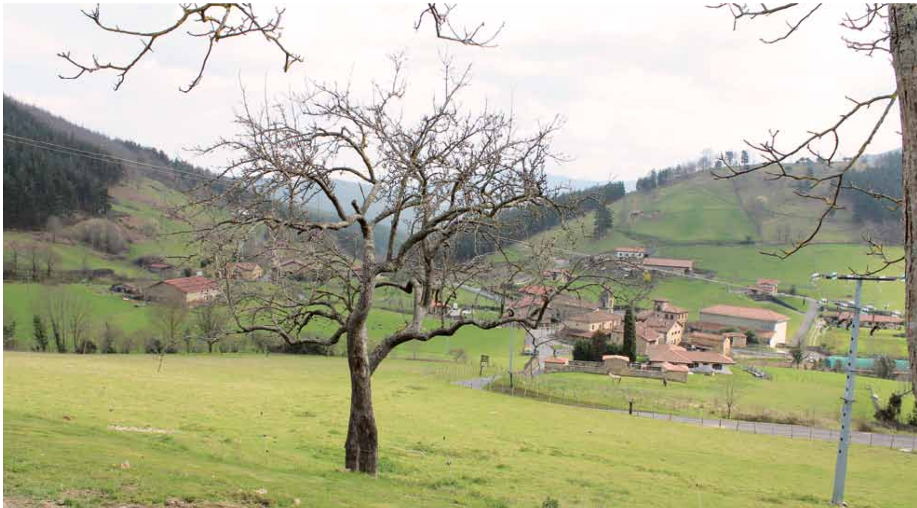
Durangotik Axperaino bizikletaz joateko ibilbidea erraza da.