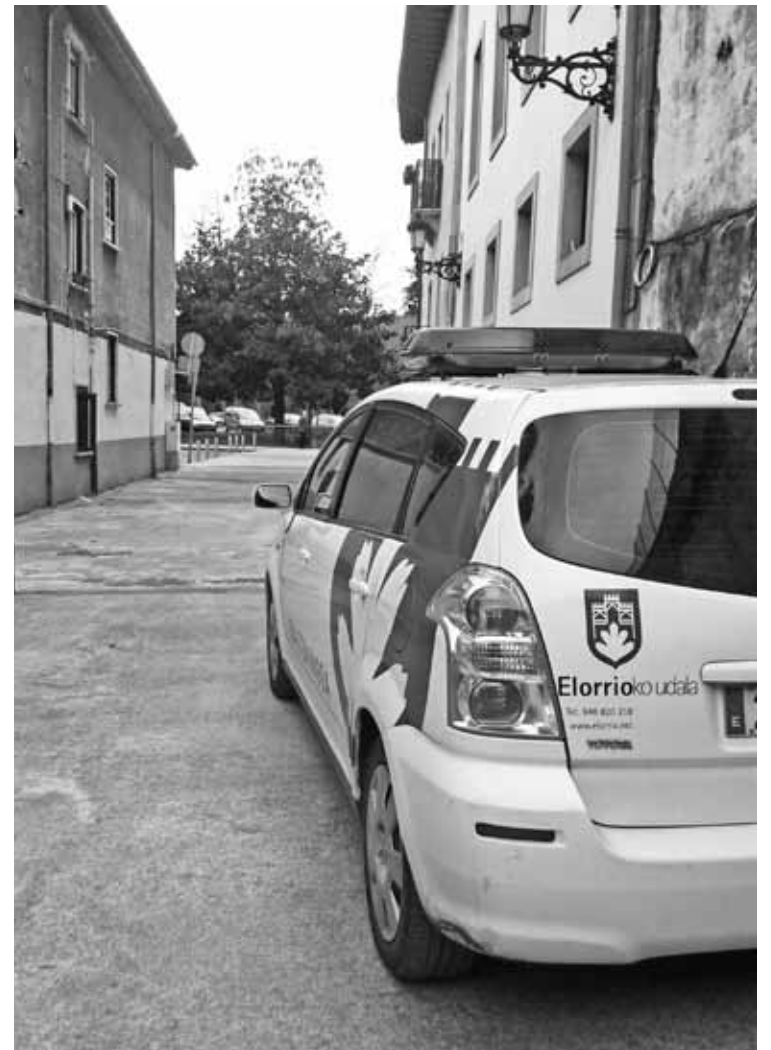
Udaltzainen arteko koordinazioa ere hobetuko du sistema berriak.