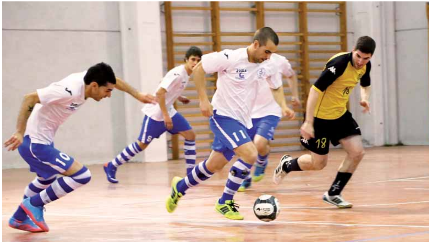
Mallabia areto futbol taldea, joan zen asteburuan Goierriren kontra jokatuko partiduan. Zalaa Fuertes

Sarrerak gutxitu zaizkie, eta ezin diete Hirugarren mailako gastuei aurre egin; datorren denboraldia bigarren erregionalean hastea erabaki du Mallabia futbol taldea Kirol Elkarteko kudeaketa batzordeak