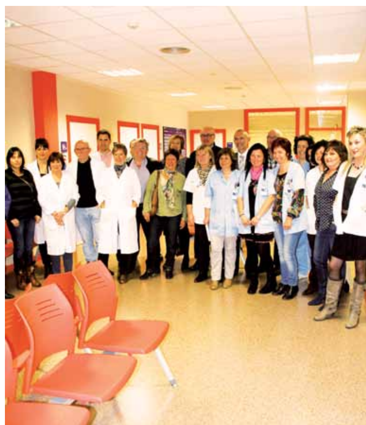
Eguaztenean egin zuten anbulategi berriaren inaugurazioa.

"Zerbitzua baldintza hobetan eskaini ahal izango dute aurrerantzean zentroko profesionalak"