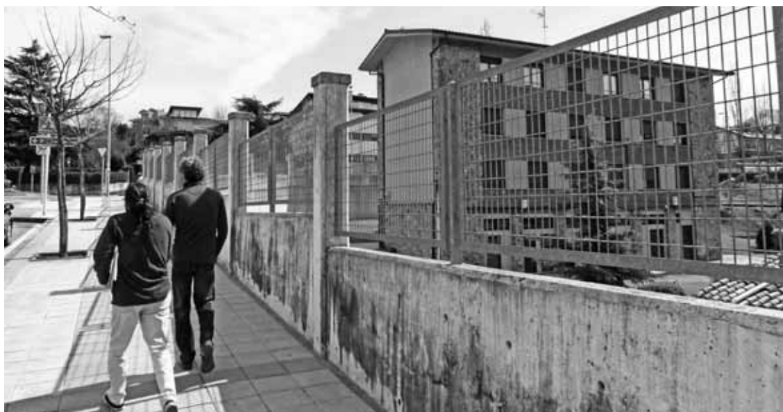
Intxaurrenondan dauzka hainbat etxe udalak, eta larrialdi kasuetan erabiltzeko egokitu ditu.

Etxeak bizitzeko moduan egokitzea izango da udalaren hurrengo pausoa