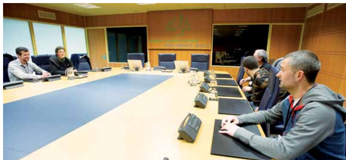
LABeko delegatuak Industria batzordearen eztabaida beste gela batetik zuzenean entzun ahal izan zuten.