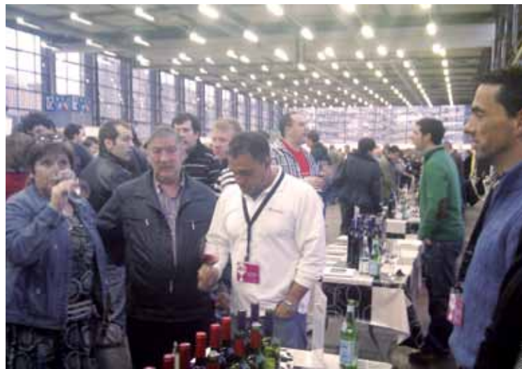
Iazko Ardo Saltsan azokan hartutako irudi bat.

tzaileek esan dutenez, hemengo zein atzerriko 52 upategik parte hartuko dute. 140 ardo marka, eta 200 mota baino gehiago probatzeko aukera egongo da bertan.