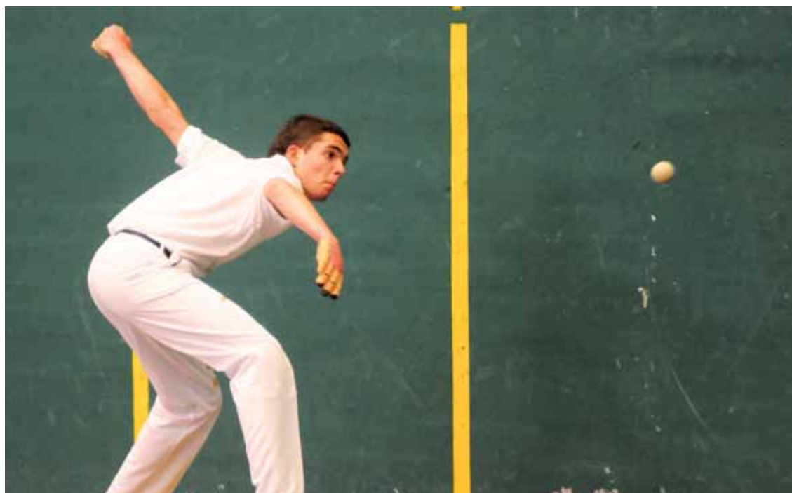
Traña-Matienako eta Zelaletako pilotalekuetan jokatuko dituzte partiduak. K.Aginako

Kadeteetan eta seniorretan binaka lehiatuko dira; gazte eta promesetan lau t'erdia barruan