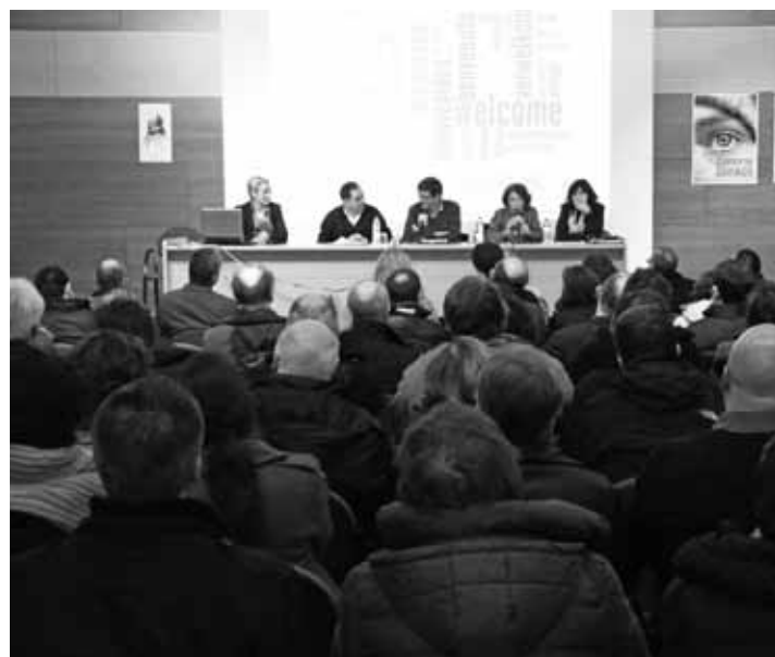
Arrupe Aretoan eman zituzten ikastetxeko proiektuen gaineko azalpenak.

Loiolan egindako Europako kongresuaren barruan, Durangoko ikastetxea bisitatu dute