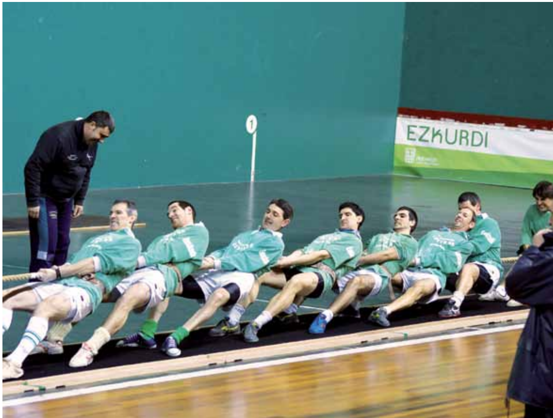
Iaz Durangoko pilotalekuan jokatu zen txapelketako Abadiño Sokatira Taldearen tiraldia. Gorka Larrinaga

Sailkapen fase bana irabazita, 640 kilora arteko txapela janzteko faboritoak dira Abadiño eta Ibarra, bihar, Landako Gunean jokatu den finalean