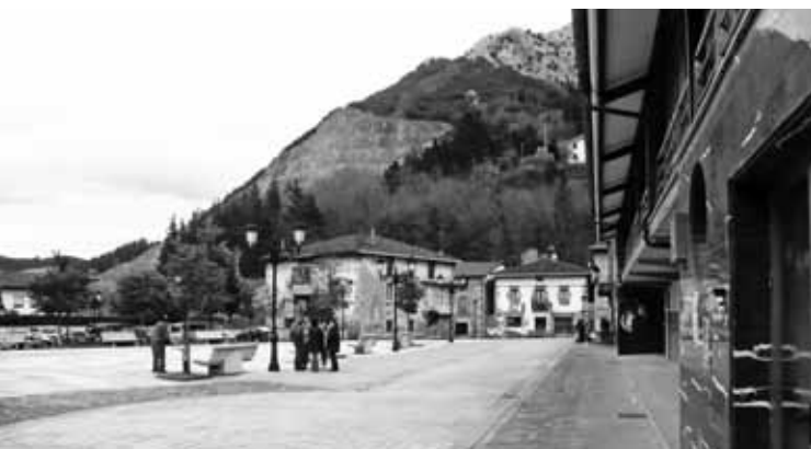
Lurraren erabilera ekonomia iraunkorra bultzatuz arautzea dute helburu.

Antolamendurako Plan Orokorren bidez. Hori idatzi aurretik, ordea, herritarrekin prozesu parte-hartzailea garatuko du-