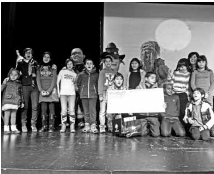
Kurutziagako gazteak saria jasotzen.

Bideo lehiaketak arrakasta izan duela esan dute antolatzaileek, eta horregatik, sari banaketa ekitaldia egin zuten zapatuan, Mungiako Olalde aretoan.