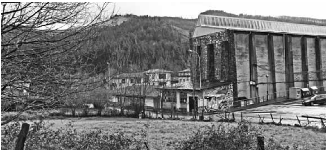
Garauntza inguruan etxebizitzak egiteko asmoa aurrera eramateko 105.000 euro bideratu dituzte.

Inbertsioei bideratuko zenbatekoa %14 baxuagoa da aurten. Zenbatekorik handiena, iazko