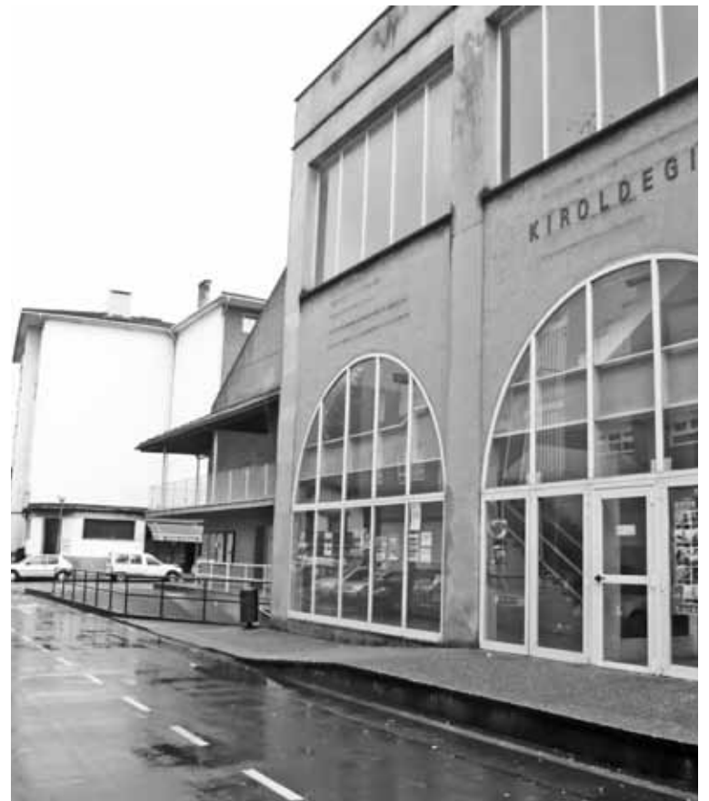
Elorrioko Kirol Etxearen irudia.