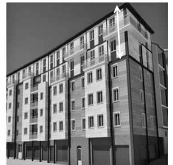
San Fausto auzoaren eraldaketaren konparazioa egin dute teknikariek dossierrean.

gailu sistema zentrala izan ahal den probatu gura dute.