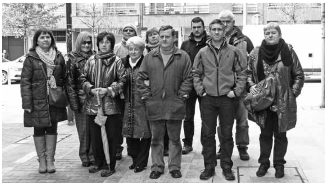
Durungaldean hogeitau kaltetu inguru hurreratu dira elkartera. Ehun baino gehiago direla uste dute.

Eguazteno, Bilboko Plaza Biribilean kontzentratzen dira kaltetuak, 12:00etatik 13:00era. Informazio gehiagorako: 653745280