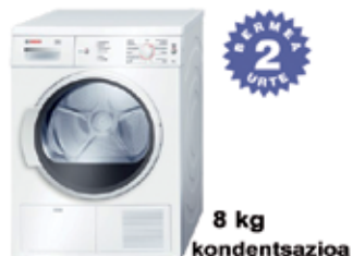
8 kg kondentsazioa LEHORGAILUA WTE86111EE 465 € BOSCH