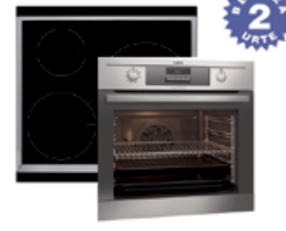
LABE PIROLITIKOA BP3313091M 475 € INDUKZIOA HK633220XB 445 € AEG