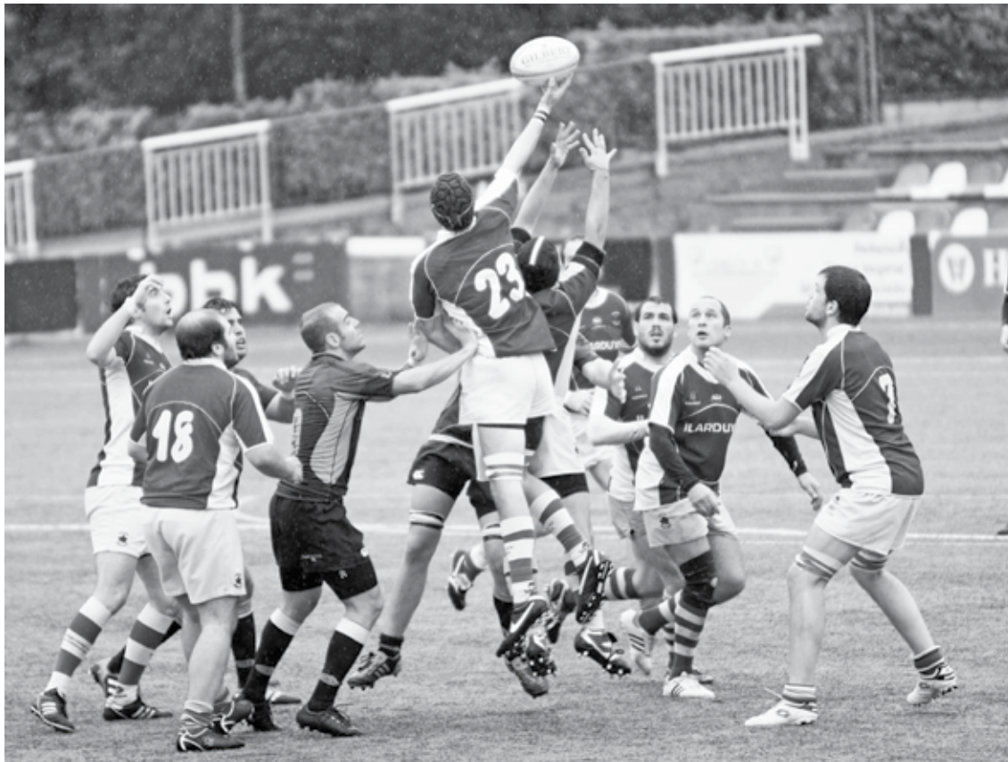
Asteburu biko atsedenaldiaren ostean, BUC Bartzelona taldeak bisitatuko du Arripausueta. Kepa Aginako

Sailkapenean puntu barik dagoen DRT-ri loriak eskaini dizkio Hospitalet taldeak: "Plazera da miresteko balioak dituen talde baten aurka jokatzea"