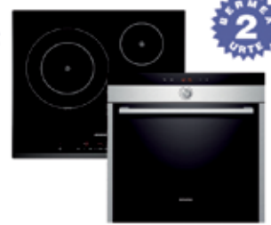
LABE PIROLITIKOA HB74AS551E 499 € INDUKZIOA EH651TK11 465 € SIEMENS