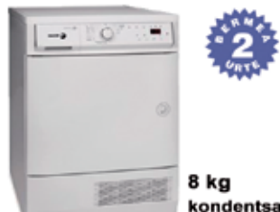
8 kg kondentsazioa LEHORGAILUA SF820CE 399 € FAGOR