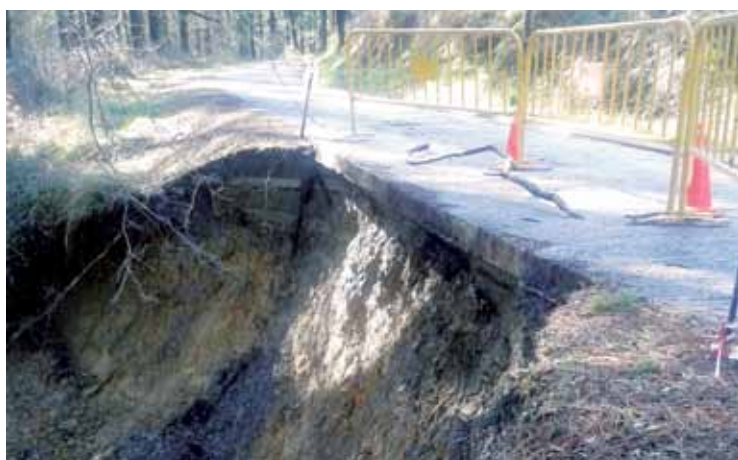
Euriteek sortutako kalteak Mallabiko auzo bidean.

Auzo bidea puntu batean zerratuta dago joan zen asteko euriteek eragindako kalteen ondorioz