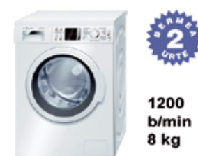
A+++ Saikapen energetikoa GARBIGAILUA WAQ24468EE 465 € BOSCH