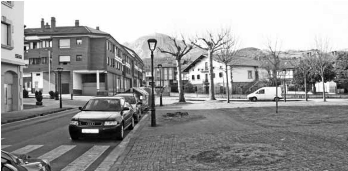
Urte amaieran ipini zituzten argi berriak Gaztañodi inguruan.

Kontsumo baxuko kale argi berriekin ez daude gustura hainbat herritar