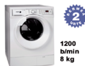
A+++ Saikapen energetikoa GARBIGAILUA F-8212 430 € FAGOR