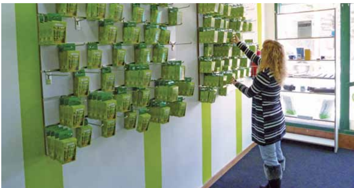
Maspe kalean dago kokatuta Logicart gizarteratze enpresa berria.