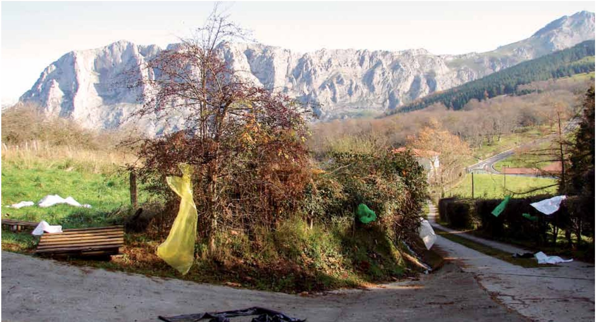
Hainbat plastiko agertzen dira Urkiolako aldatsetan elurra urtzen denean.