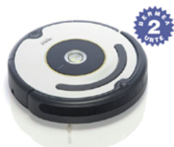
ROOMBA 620 349 € iRobot