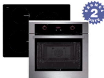
LABE PIROLITIKOA 6H-760AX 450 € INDUKZIOA IF-33BS 430 € FAGOR