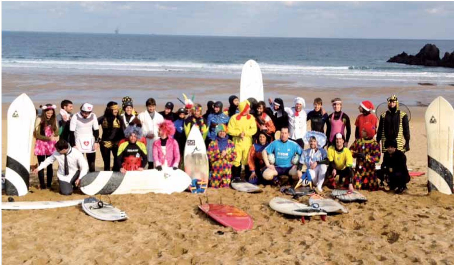
Zapatuan, 09:00etan, Lagako hondartzan batuko dira mozorrotuta surfeatzeko.