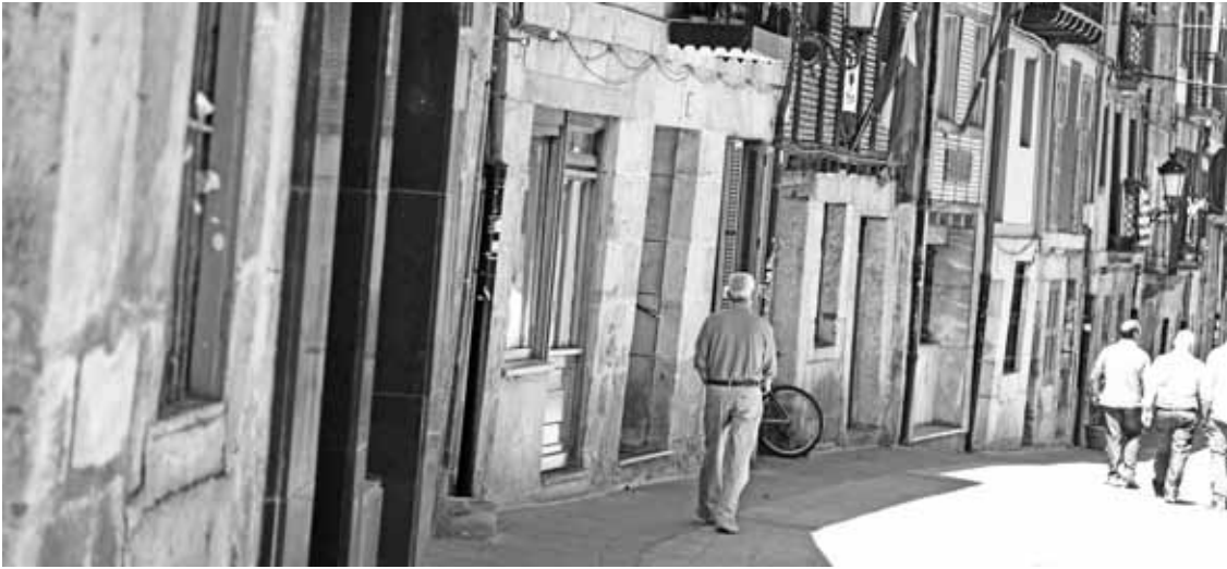
Ohiko zerbitzuetan, kanpora ateratako zerbitzuetan bakarrik egin dituzte doiketak.