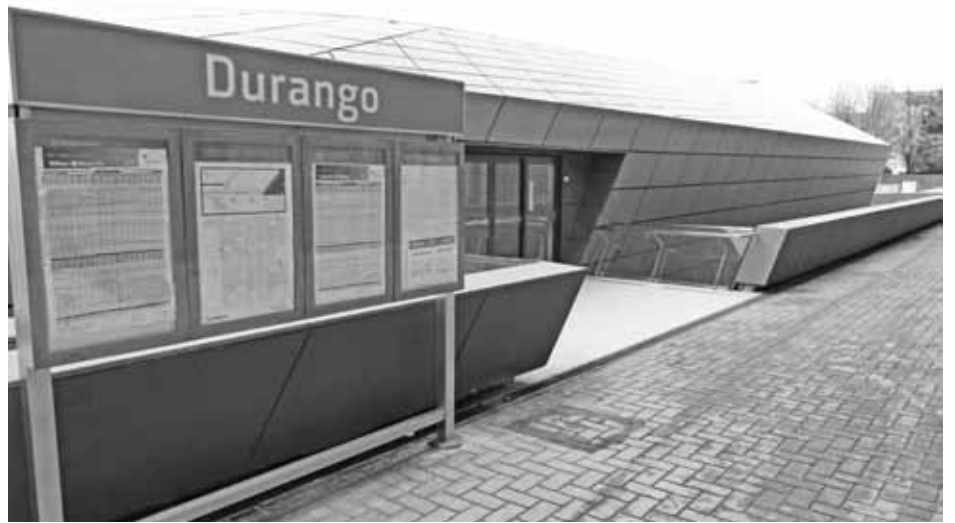
Geltoki zaharraren atzealdeko sarbidea (ezkerrean), eta igogailurako sarrera Askatasun etorbidean (eskuman).