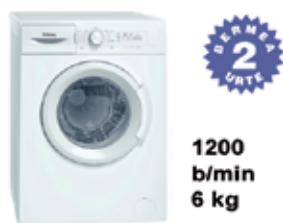
A+ Saikapen energetikoa GARBIGAILUA 3TS865E 299 € Balay