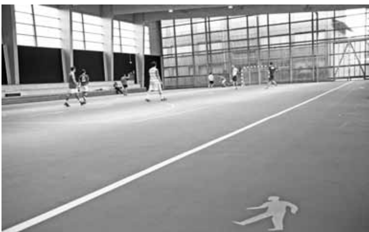
Asfaltozko zoruagaz lesionatzeko arrisku handia dagoela diote erabiltzaileek.

Pozik hartu dute erabiltzaileek iragarpena