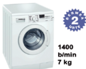
A++ Saikapen energetikoa GARBIGAILUA WM14E470EE 420 € SIEMENS