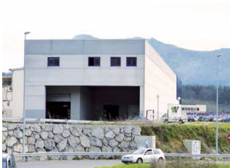
Abadiñoko Mendiguren y Zarraua enpresa.

Erregulazio espediente hau seigarrena litzateke Berrizko lantegirako, eta hango 110 behargini eragingo lieke. Abadiñoko lantegiari dagokionez, bosgarren espediente litzateke, eta 117 beharginentzako litzateke.