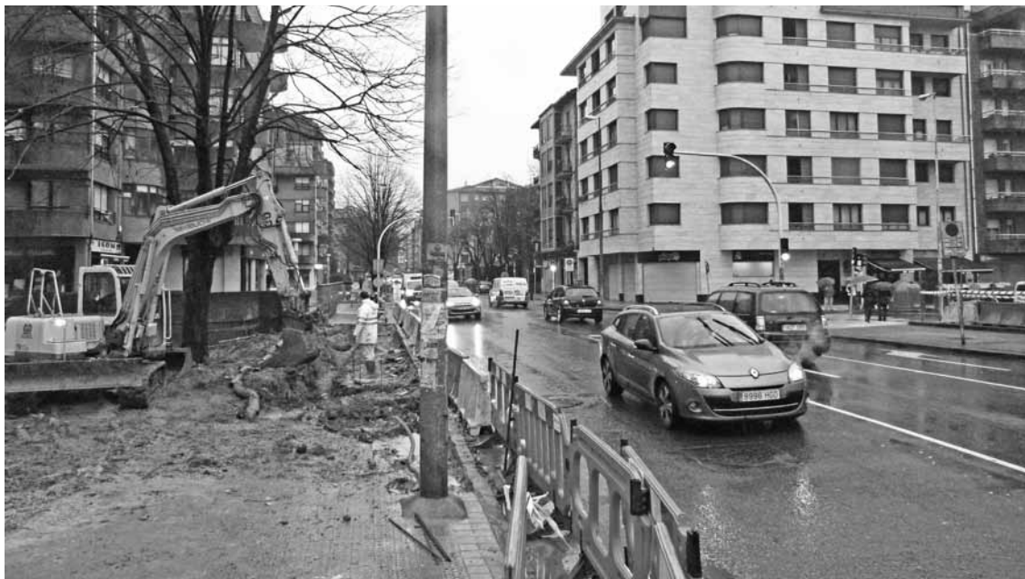
Biribilgunea egiteko, espaloia altxatuz hasi dituzte obrak beharginak asteen.

Astelehenean hasi ziren Frai Juan Zumarraga eta Alluitzen lotuneko obrak