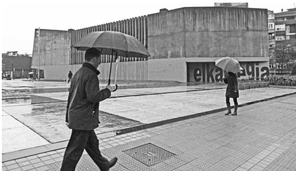
Durangoko Udalak Elkartegia aukeratu du hileta zibilak egiteko.