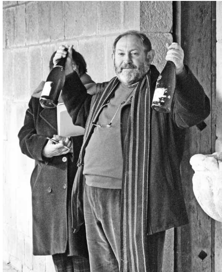
Urtero legez Lazaro Milikuak zuzendu zuen Erremata.