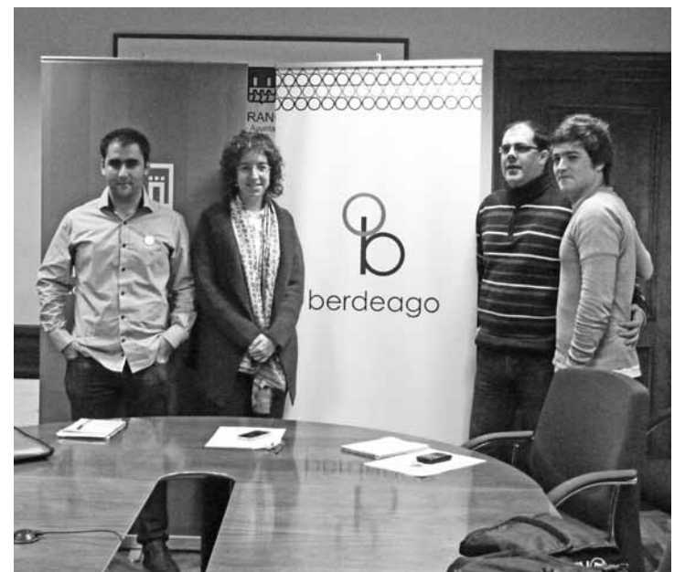
Berdeago egitasmoak kideak udal ordezkariekin prentsaurrekoan.

Azoka sustatzeko, Berdeago egitasmoak kideak kotxe elektriko bat zozkatuko dute. Kalearik kale ibiliko dira txartelak saltzen. Mondragon Unibertsitatean Ekintzaitza eta Berrikuntza Lidergotza gradua ikasten dabilzan zortzi ikasleak osatzen dute Berdeago egitasmoa.