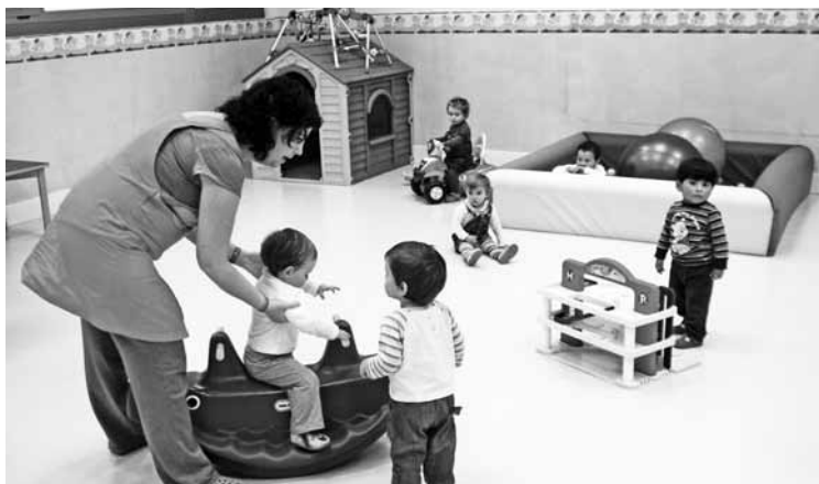
Haurreskolako laguntzen partida 18.000 eurotik 28.000ra igo du udalak.

Sozialistek azaldu dute otsailean hasiko dela dirulaguntzak eskatzeko epea. 2011-2012 ikasturteetatik egin ahal izango dituzte eskaerak gurasoek. Horrela, 2009an, 2010ean eta 2011n jaiotako umeak izango dira onuradunak.