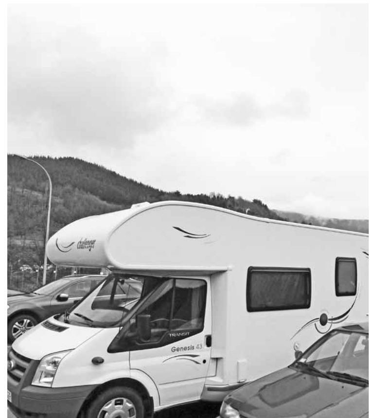
Karabana San Agustingo industrialdean uzten dute herritar batzuek.

Turistentzako bakarrik ez Azaldu dutenez, ez da turistentzako bakarrik izango. Guneak, herriko zein inguruko karabana zaleei bertan ur zikinak botatzeko aukera emango lieke, esate baterako.