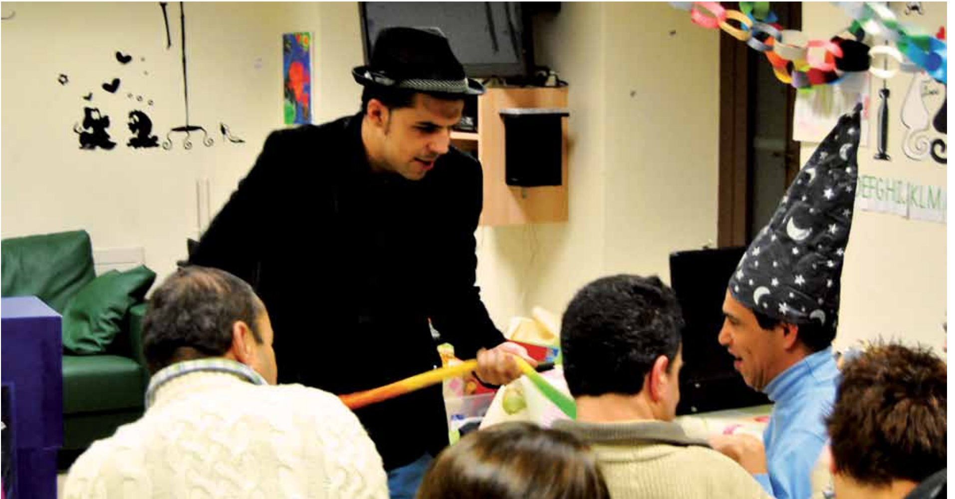
Durangoko Gorabide elkarteko aisialdi taldeko parte-hartzaileak.