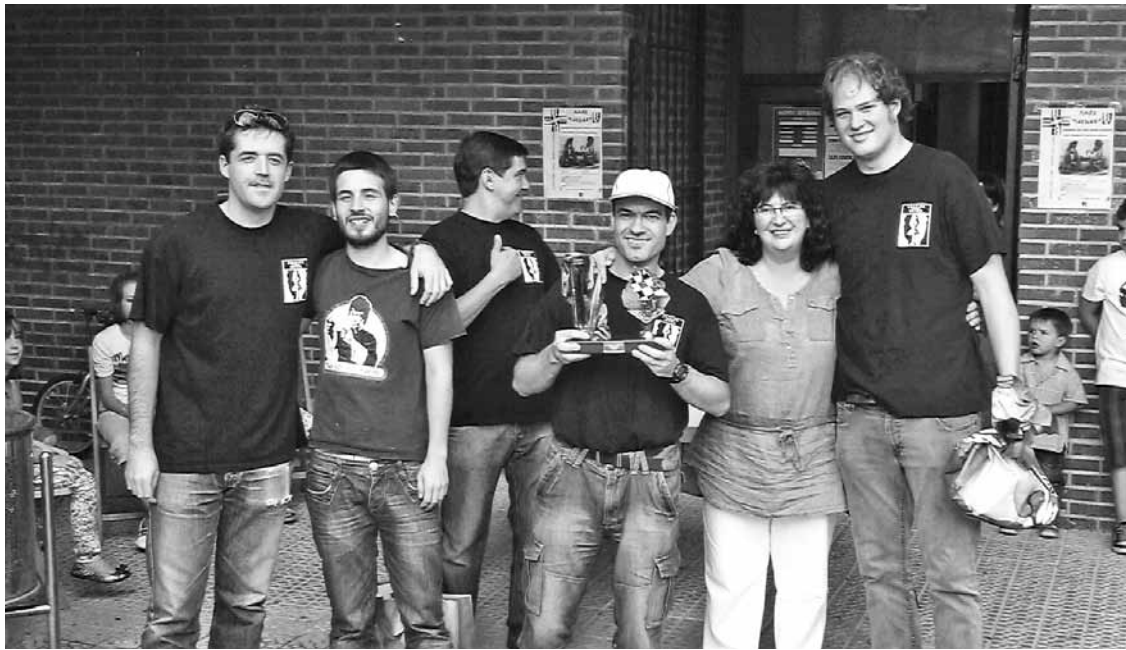
Partida Azkarren Euskal Zirkuitua irabazi du Abadiño Xake Taldeak.