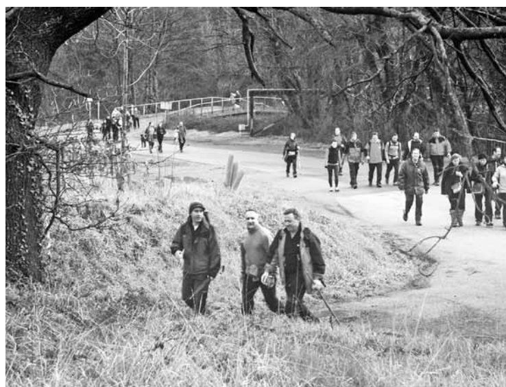
Urtero jende askok parte hartzen du ibilaldian.

Handik, berriro Abadiñorantz abiatuko dira. Lebarioko industriagunetik Zalloizera heldu eta Gazteluko ur depositura arte igoko dira. Han galtzada hartu eta Arrankurri, Santikurutz eta Untzilla igaroko dituzte. Mendilibarretik pasatu eta galtzadatik Txanportan amaituko dute ibilaldia, otordu batekin.