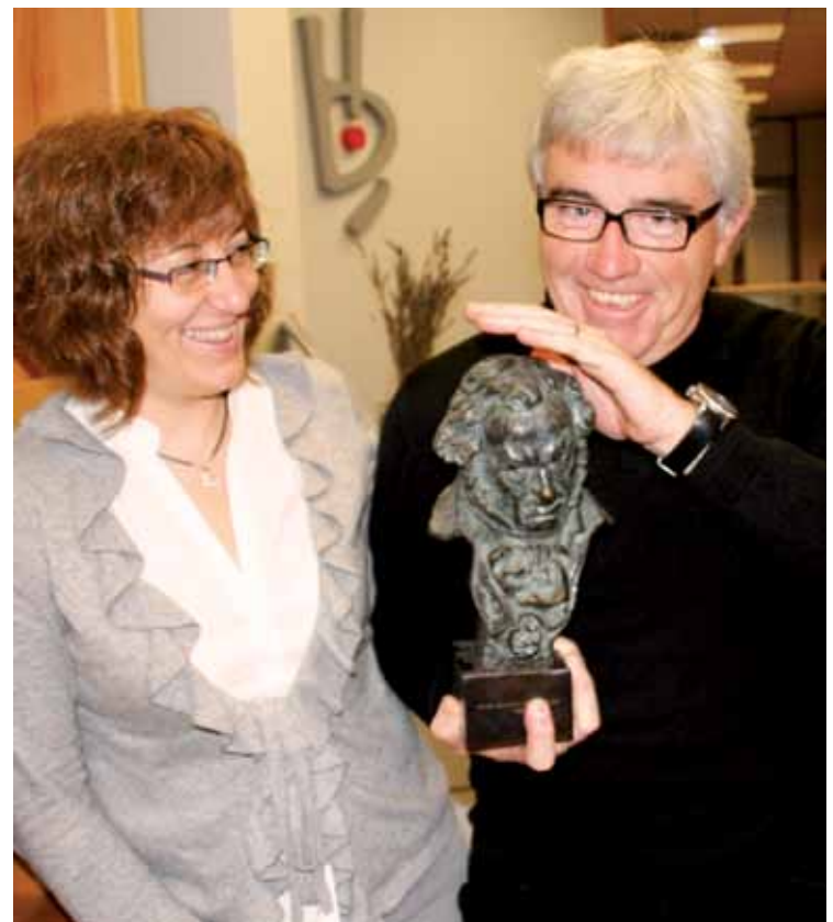
Bulegoan daukate 1998an jaso zuten Goya saria.

E.B.: Durangon sortutako proiektu bat munduan zehar ibiliko da horri esker.