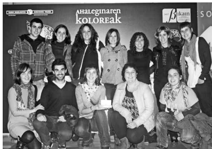
Txintxirri ikastolako ordezkariak, ziurtagiria jasotzeko ekitaldian.