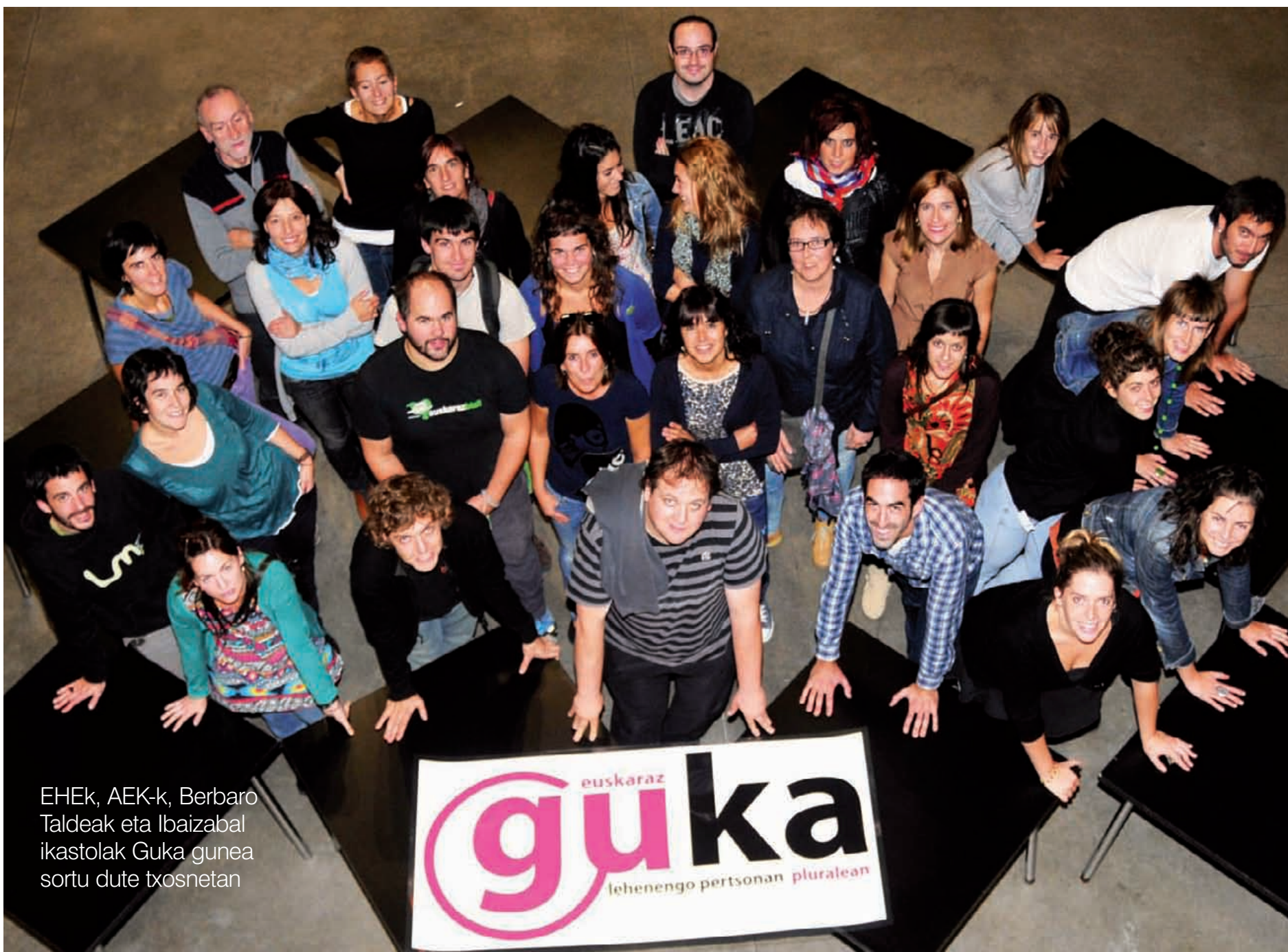
EHEk, AEK-k, Berbaro Taldeak eta Ibaizabal ikastolak Guka gunea sortu dute txosnetan