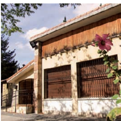
Antzinako auzo eskola.