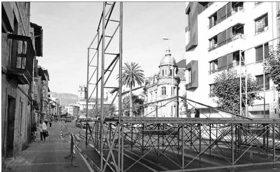
Eszenatokia muntatzen ibili dira asteon; atzo oraindik amaitu barik zegoen.

Anboto n publikatutako albistearen ostean, Txosna Batzordearen partetik ere jaso dute kokapenaren berri. "Eurek ere esan digute Kurutziaga leku txarra dela".