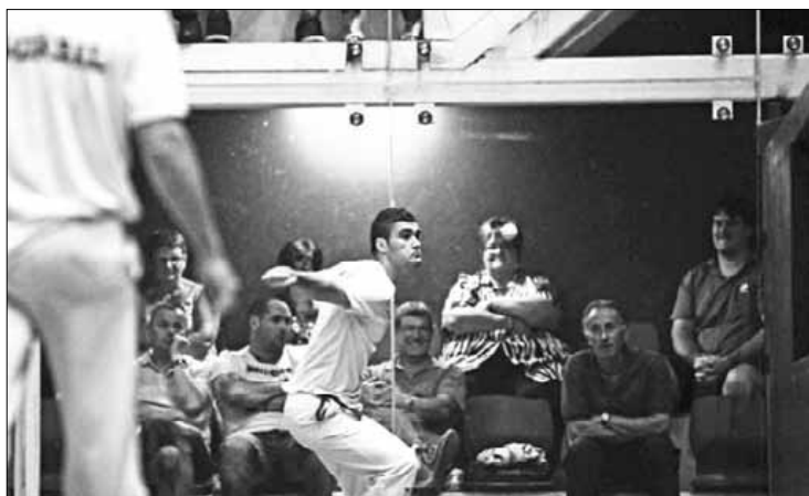
Final laurdenetako partiduko irudia Tornosolo trinketean. K.A.

Durangaldeko aurrelari biek sasoiak daukela erakutsi zuten finalerdietan. Gaurko finalean Gonzalez pilota alde batetik bestera bizi mugitzen saiatuko da. Uriartek tantoa amaitzen duen trebetasuna izango du arma nagusia. ■ J. D.