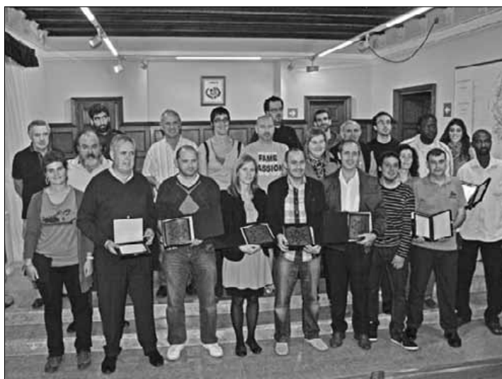
Famili argazkia, udaletxeko bilkura aretoan. I. Irazabal

1911 Herri Batzordeak izan duen babesa eskertzeko oroigarria banatu du