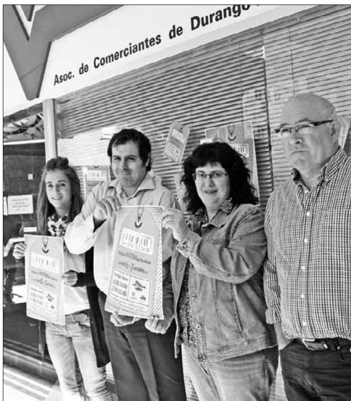
+Dendak elkarteko eta Abadiñoko Udalaren ordezkariak.