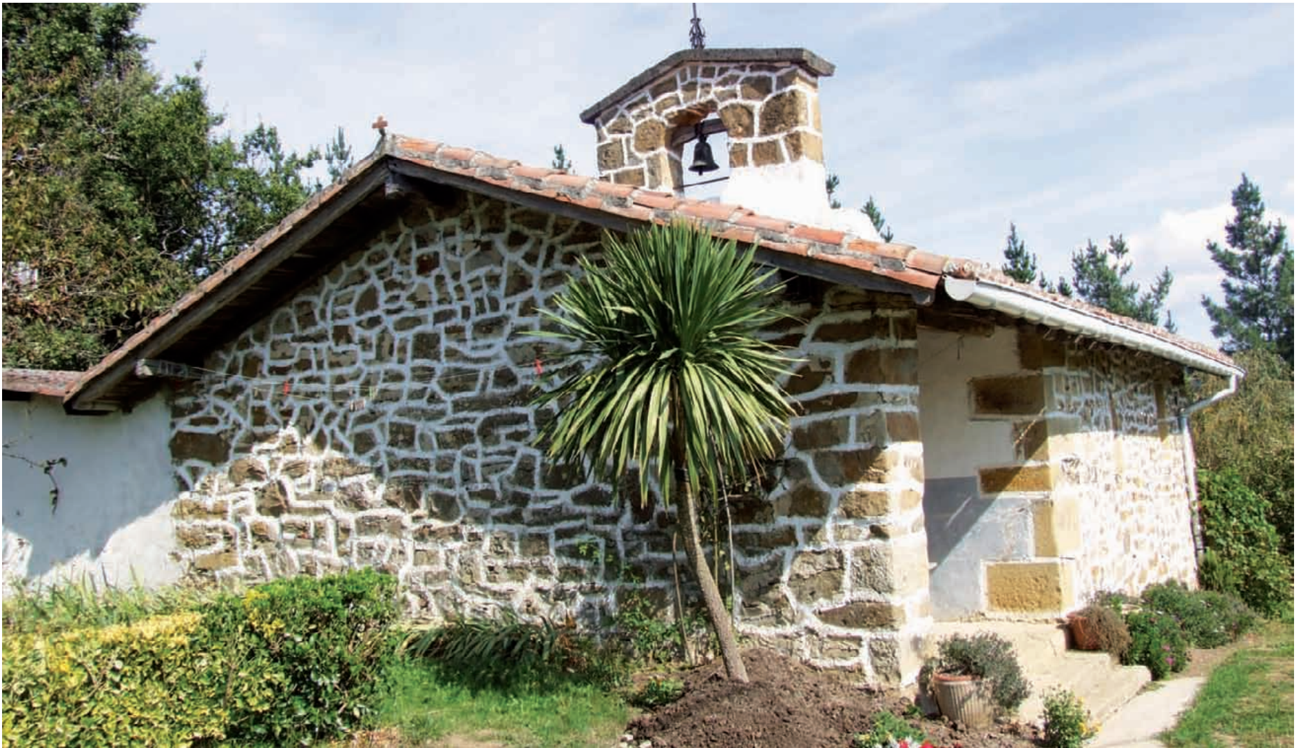
San Martin ermita izen bereko baserriaren ondoan kokatuta dago.