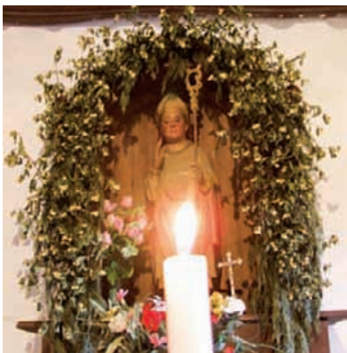
Santa Martin ermitako santua.