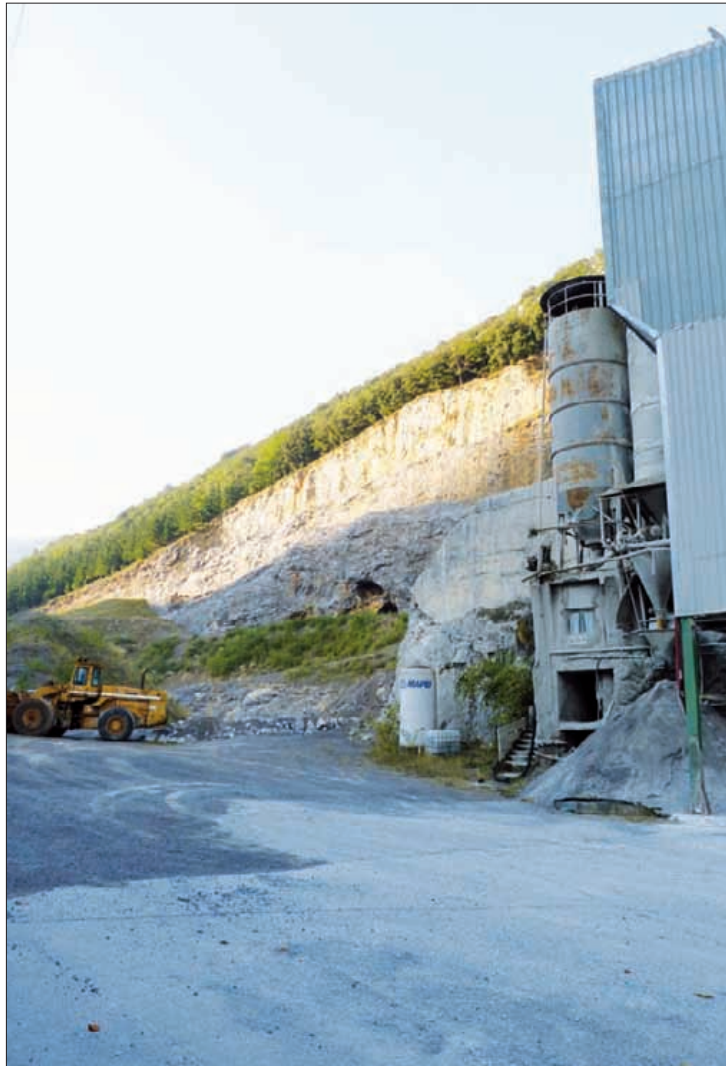
Hasi dira Zalloventako instalazioak kentzen.

Atxarten, azterketarik ez Atxarte eta Atxa-Txiki harrobiak berreskuratze proiektuaren ezaugarriak dira. Horretaz galdetuta, Letamendiak dio ez dela beharrezkoa ingurumen eraginaren azterketarik. AHTaren obretan ateratako materiala ere lehen mailakoa dela esan du. ■ M. Onaindia