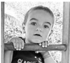
Gaizkak urriaren 3an, 3 urte bete zituen. Zorionak mutil haundi! Musu handi bat Abadiñoeko eta Lekitxoko familia guztiaren partez!