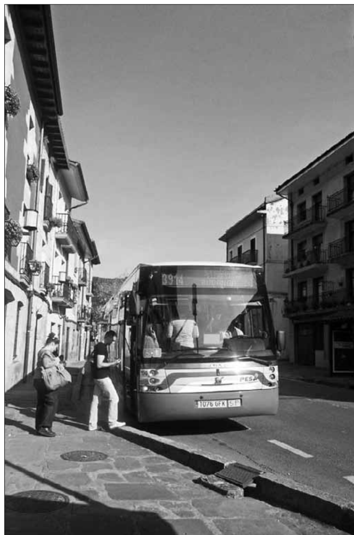
Bizkaibuseko autobus bat, Elorrioren, San Pio X geltokian.

Aldundiak Mañaria eta Izurtza ere hartu ditu kontuan sare berrian. Planaren arabera, egunean hiru autobusek irtengo dute Mañaritik Bilbora eta alderantziz. Oraindik ez dago zehaztuta zein ordu-tan. Durango-Bilbo linearen luzapena izango da. ■ M. Onaindia