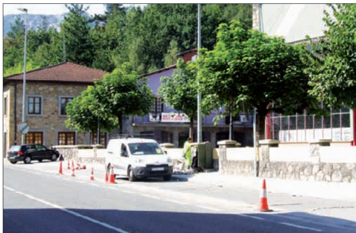
Beharginak lanean, martitzenean, autobus geltoki berrian.

Udalaren materialagaz egin dituzte markesinak