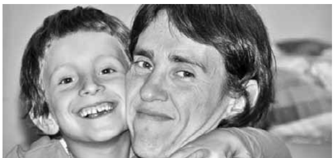
Herenegun Nerearen urtebetetzea izan zen eta opari bat emango diogu. Zorionak, amatxo! Besarkada handi bat eta mila musu zuretzat!