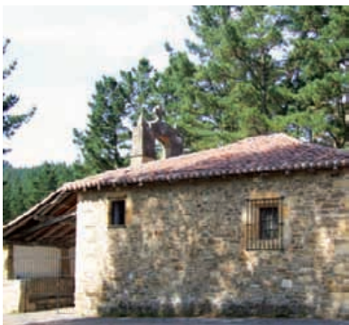
San Juan ermita.