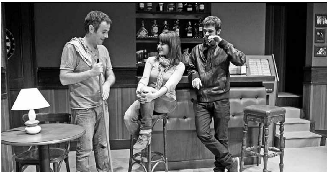
Hil arte bizi antzezlanaren momentu bat; 22:00etan hasiko da gaur, Arriolan.

'Hil arte bizi' eskainiko du Txalok gaur Elorrioko antzokian, korapilatzen diren harremanak