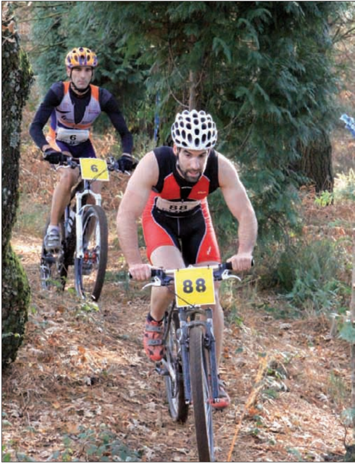
lazio lehenengo aldiko parte hartzaile bi.