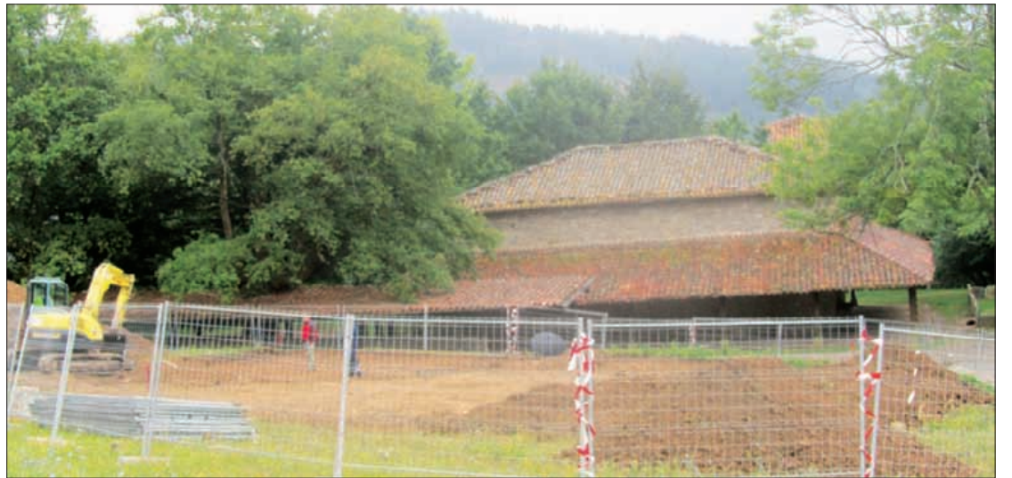
Astelehenean Argiñetan hartutako irudian, beharginak lurra mugitzeko lanetan. Jabier Ugalde

rraldeko eremuan eta nekropolian egingo dute behar. Ikerlariak jakinmina aspalditik eduki arren, EHUko ikerketa talde batek 2010ean egindako zundaketen ondorioa da egungo proiektua. Baselizaren iparraldean gizakiaren antzinako kokaleku baten aztarnak aurkitu zituzten: zutoin zuloak, mozketak harrietan eta egurrezko eraikuntza zaharren arrastoak. Ermitaren hegoaldean, VIII. eta XII. mendeen arteko bost