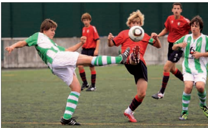
lazio kadete mailan antolatu zuten txapelketa.

Athletic Clubeko kimu mailako gaztetxoek jokatu dute txapelketa, besteak beste