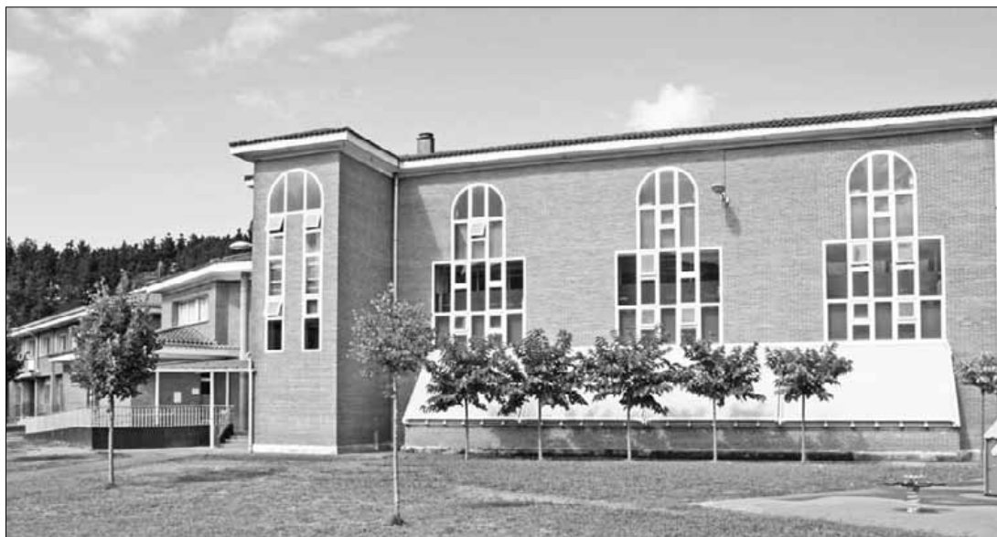
Zelaietako eskolaren eraikinari lotuta eraiki gura dute proiektu berria.