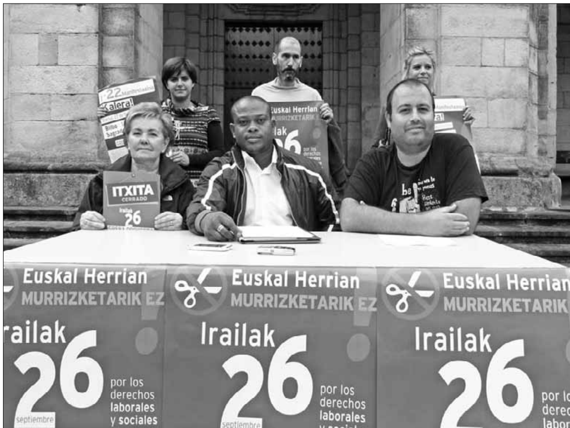
Alfaro (jarrita, eskuman): "Ez gaude haiek sortutako krisia ordaintzeko prest".

Baina, krisiaren ordaina gaurko arazo da dagoeneko. Alfaro emandako datuen arabera, esaterako, Durangaldean 2.215 pertso-