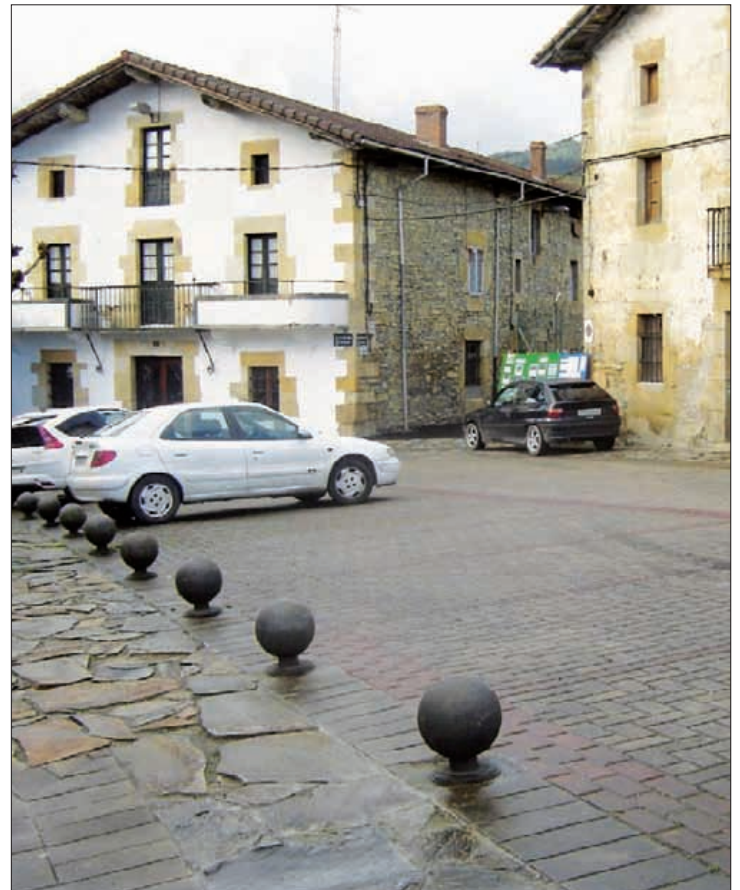
Mallabarrenatik plazara doan bidea.

Mallabarrenatik plazarako bidean autorik ez pasatzeko, piboteak ipini ditu udalak. Herritarrei piboteen alboan ez aparkatzeko eskaera egin dute. Autoak aparkatzen badi-tuzte, anbulantziei-eta traba egi-ten dietela gaineratu du Mallabi-ko alkateak: "Bidea libre uzteko eskatzen zaie herritarrei, piboteen atzean ez aparkatzeko. Edo-zein urgentzia gertatuz gero, bidea libre egon behar da bertatik pasat-zeko moduan". ■ J.G.