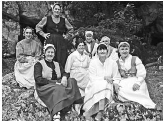
Zorionak Mañariko dantza talde langileenari eta eskerrik asko hor egoteagatik. Onenak zarie!