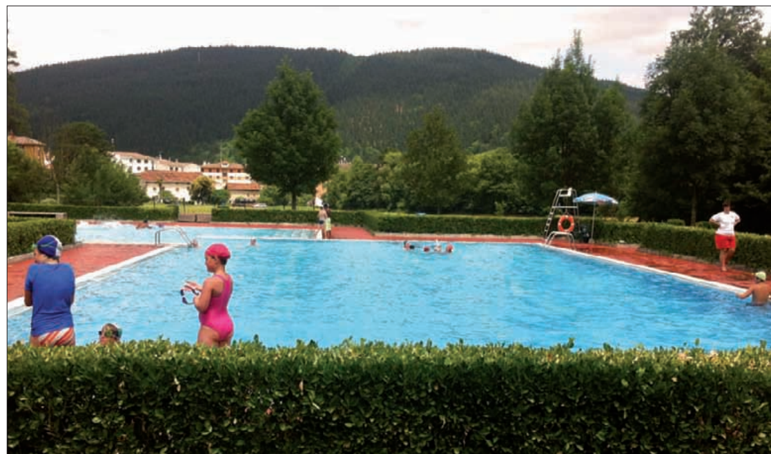
Astelehen honetan ireki dituzte Atxondoko igerilekuak.

Igerilekuko erabiltzaileen bonoetan izandako igoerek eragindako kexei erantzun die Norak: "Iaz 53.000 eurokoa izan zen defizita. Prezioak igo ditugu eta Atxondotik kanpoko egehiago. Baina kontuan hartu defizitari atxondarrek bakarrik egiten dietela aurre zergen bidez, erabiltzaileak hainbat herritakoak izan arren". ■ J.D.