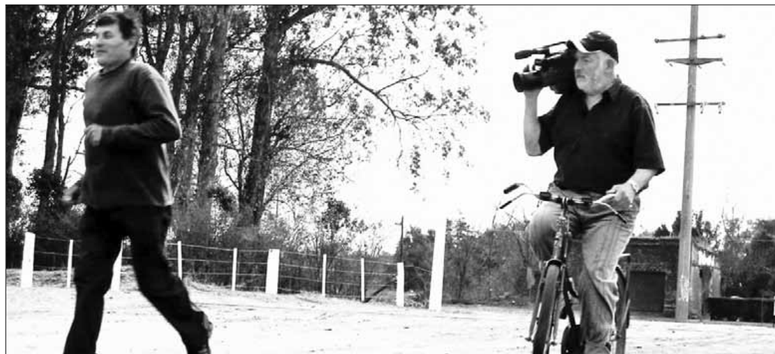
Argentinan ekoitziriko da uztailean plazan emango duten filma.

Hilean Behin zikloaren baitan, El Ambulante filma emango dute datorren egunean