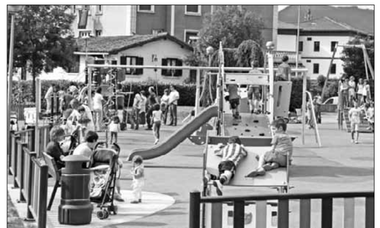
Hainbat ume, eguaztenean, Tabirako jolasgune berrian.

Bi eremutan banatu dute; bi eta sei urte arteko umeena, eta sei eta hamabost urte artekoena