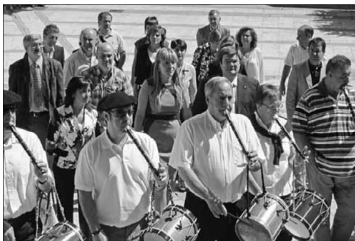
Txistularien kaljiran heldu ziren agintariak basilikara.