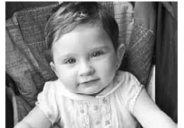
Zorionak Ainaraxo! Uztailaren 9an urtebete egingo duzulako. Musu handi bat guraso, osaba-izeben, amama-aiten eta lehengusuen partez!