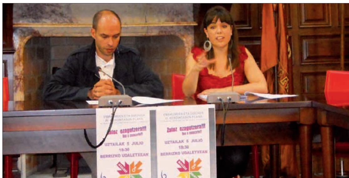
Isoird eta Mardaras atzo udaletxean planaren inguruko prentsaurrekoan.

Aurreko planean ere udalak arlo guztietan berdintasuna bultzatzeko aukerak eskaini zituen. Mardarasek adibide bat eman du: "Kiroldegian goizetan ohikoak ez diren orduetan ikastaroak ematen ditu umeak eskolan utzita joaten diren gurasoentzako. Bestela, ez lukete kiroltik egiteko aukerarik izango". ■ A.Ugalde