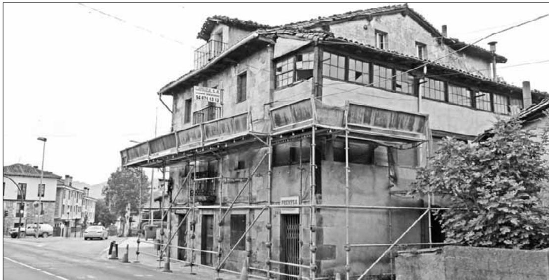
Zelaietako estanko-etxearen antzeko eraikinak "babestu egin beharko lirateke", Bilduren ustez.

Otsailean eskatu zion udalak jabeari segurtasunagaz lotutako obrak egitea