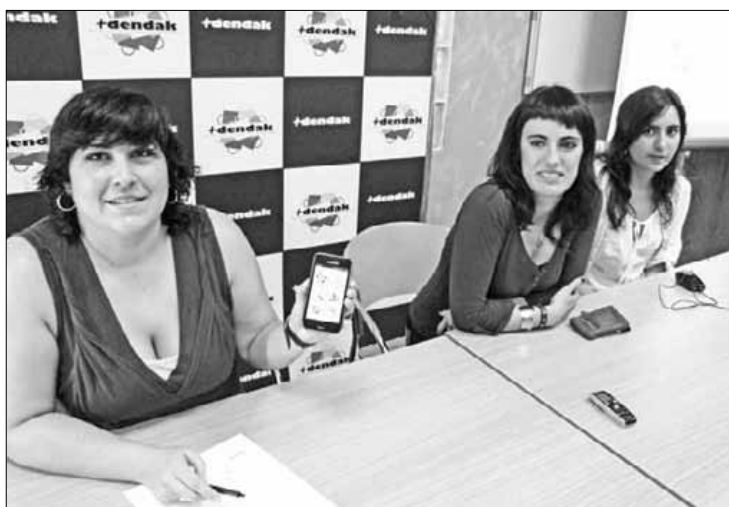
+Dendak eta Skura Mobileko arduradunak, prentsaurrekoan.

Arrasateko Skura Mobile enpresak sortu du aplikazioa. Diotenez, erabiltzeko arina eta erraza da. Bilatzailea eta Durangoko mapa bat gehitu dizkiote. Mapak, non dagoen esango dio erabiltzaileari. Adibidez, okindegira joan gura duenak, dagoen lekutik hurbilen zein dagoen ikusi ahal du. Android eta Blackberry sistemako telefonoekin erabili ahal da, eta laster Iphone-etan ere bai. ■ M.O.