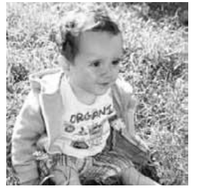
Xikerrek gaur bere lehen urtetxoa bete du. Zorionak mutikote! Txiki txiki txikia... Hasi naiz handitzen... Maite zaitugu!