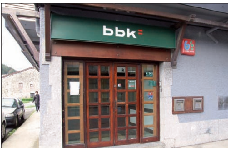
Eguazten eta bariku goizetan zabalduko dute bulegoa.