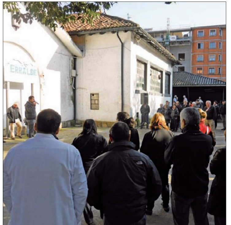
Itxiera aginduaren osteko batzarra, urtarrilean.

Inork zorra abalatzeari "gaitz" ikusten du Elgezabalek, eta proiektuak aurrera egiteko administrazioen eta politikarien arteko adostasuna falta da, bere ustez. ■ A. U.