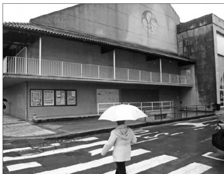
Kiroldegia kudeaketa eraginkortzeko asmoa dute.

Kirolaren sustapena eta azpiegiturak baloratuko dituzte prozesuan, plan estrategikoa garatzeko