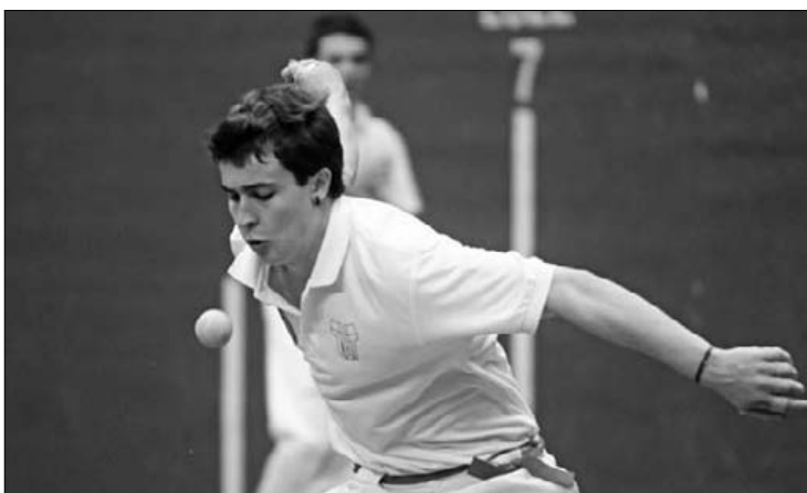
Ibarrondok dena ondo egin beharko du aukerak izateko. K.A.

16 urte gaz heldu da gazteen arteko finalera