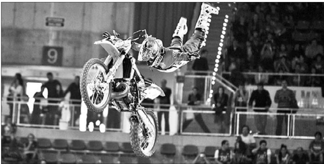
Euren erreperitorio zabala eskainiko dute Melerok eta Morenok.