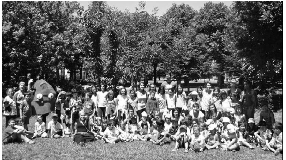
Udalekuetako lehenengo edizioko ume eta hezitzaileak, Ibaizalen.

LABek manifestazioa deitu du 'Langileok Euskal Herria helburu, lotu borrokari' lelopean, 12:30ean