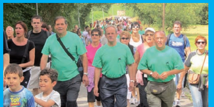
luz, Elorrioren zuten lehenengo martxa.