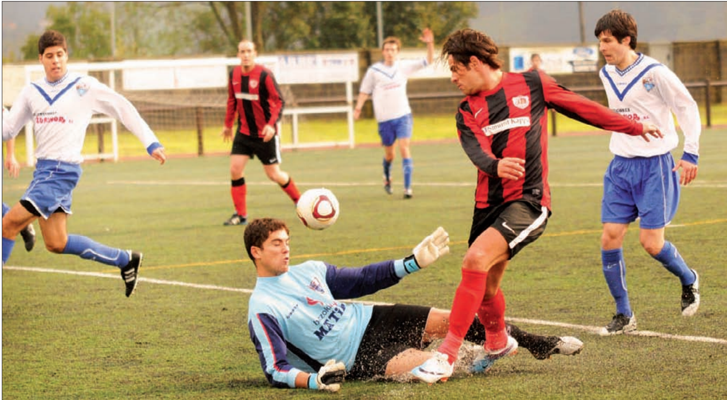
lurretako futbol taldeak domekan jokatuko du, 11:30ean, Iturrigorri taldearen kontra, Bilbon. Kepa Aginako

Lehenengoz Ohorezko mailara igo daitezke; Berriz, aldiz, matematikoki jaitsi daiteke