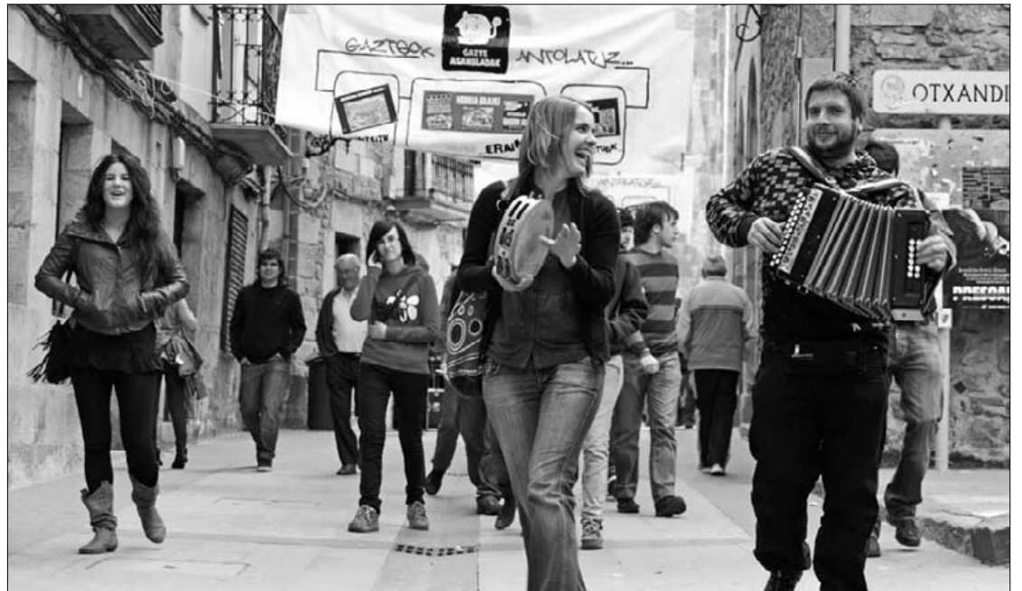
15:00etan bazkari herrikoia egingo dute plazan; euria bada, Pasealekuan.

Olinpiaden garaipena oilar batek irudikatzea ez da kasualitatea: kondairak dio, behin herri biek tratu bat egin zutela auzia ebazteko; egunsentian, oilarren lehenengo kantuagaz, herri bakoitzetik eztabaida eremurantz abiatuko ziren eta herri bietako ordezkariak bat egiten zuten tokian ezarriko zituzten mugak. Kondairak dioenez, aramaiorrek oilarrak xaxatu zituzten lehenago kantatzeko, eta otxandiarrak abiatu zirenerako, erreka alboan aurkitu zituzten aramaiorrek, Otxandion bertan.