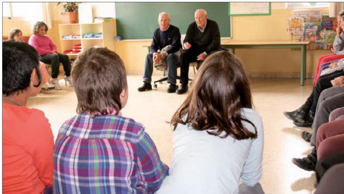
Gorrotxategi eta Arteagaren kontakizuna adi-adi entzuten.

Castet, Ahaztuak eta inguruko herrietan memoria historikoa lantzen duten hainbat elkarte dira antolatzaileak. Udaletxetik abiatuko dira domekan, 10:00etan, Santamañezarretza, eta ikurriña ipiniko dute ton-torrean. Ekitaldia egingo dute gero, elkartearen egoitzan, 13:00etan, eta Goierriko kofradian bazkalduko dute. ■ I.E.