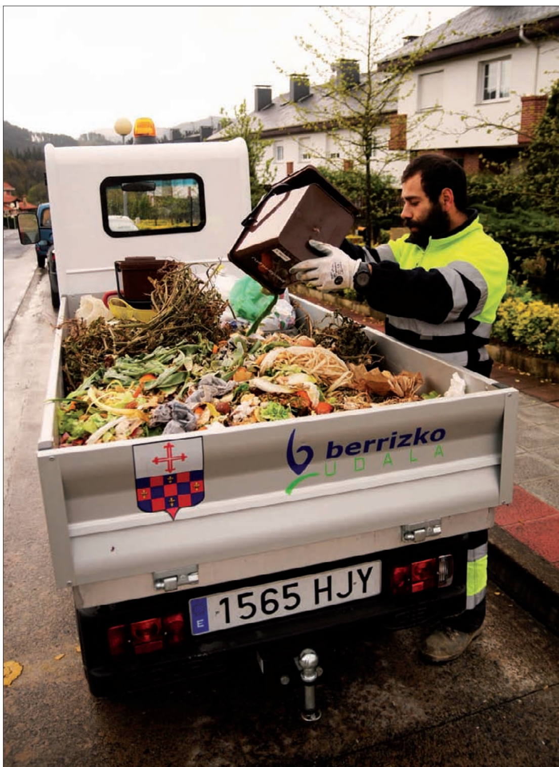
Hondakin organikoak batzen, Berrizburuko konpostaje plantara eroateko. Kepa Aginako

58 familiak, eta jatetxe eta supermerkatu bana hasi dira parte hartzen udalaren ekimenean