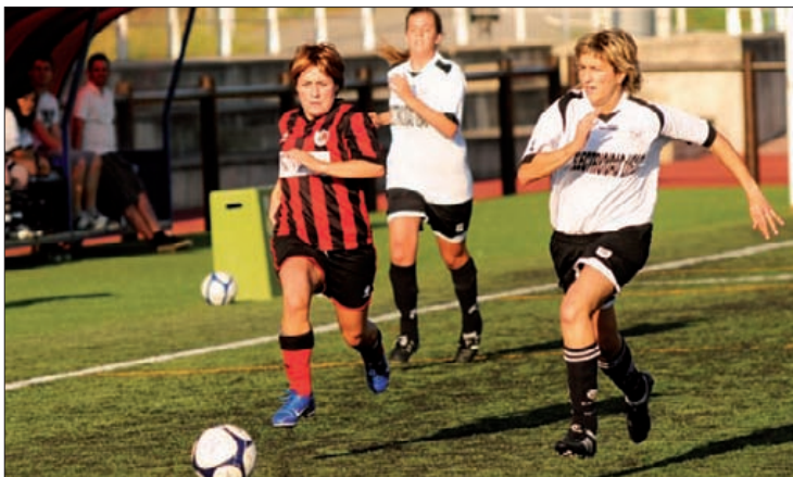
lurretakok sailkapenaren erdian dago, eroso. K.A.

Bihar derbia jokatuko dute, Arripausuetan