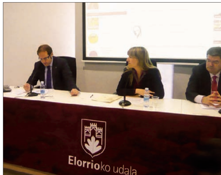
Alkatea eta BiscayTIK-eko arduradunak, aurkezpenean.