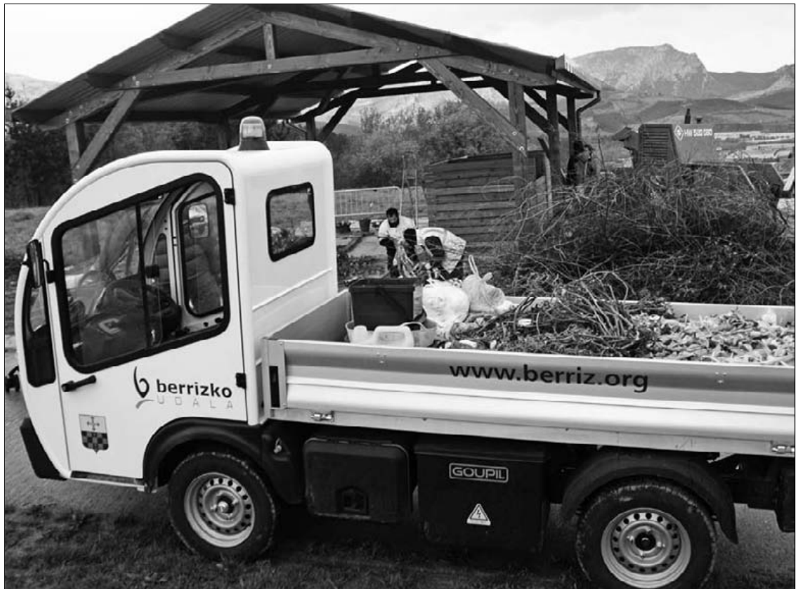
Berrizburuko plantan konpostaje-prozesua hasi dute asteon.

Organikoz gainera, sailkatu ezin daitekeen materia ere batzen dute, teknikoki 'errefusa' deitzen diotena. Zigarrokinak, konpresak, bizaraitzurak edota zeramika dira, esaterako, multzo horretakoak. Boluntarioek ondo bereiztu behar dituzte organikoa eta errefusa, eta horretarako etxean dute iriz-