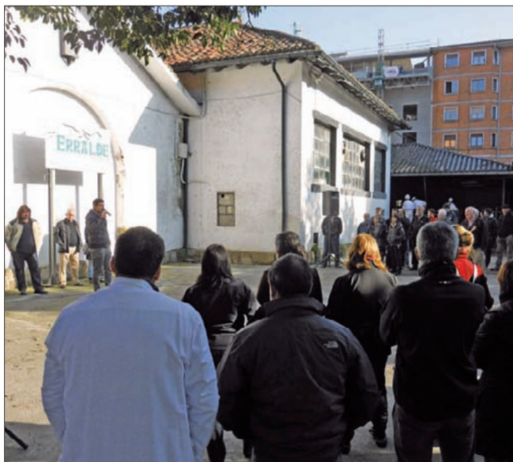
Urtarrilean hiltegiaren itxiera aurretik egindako asanblada.