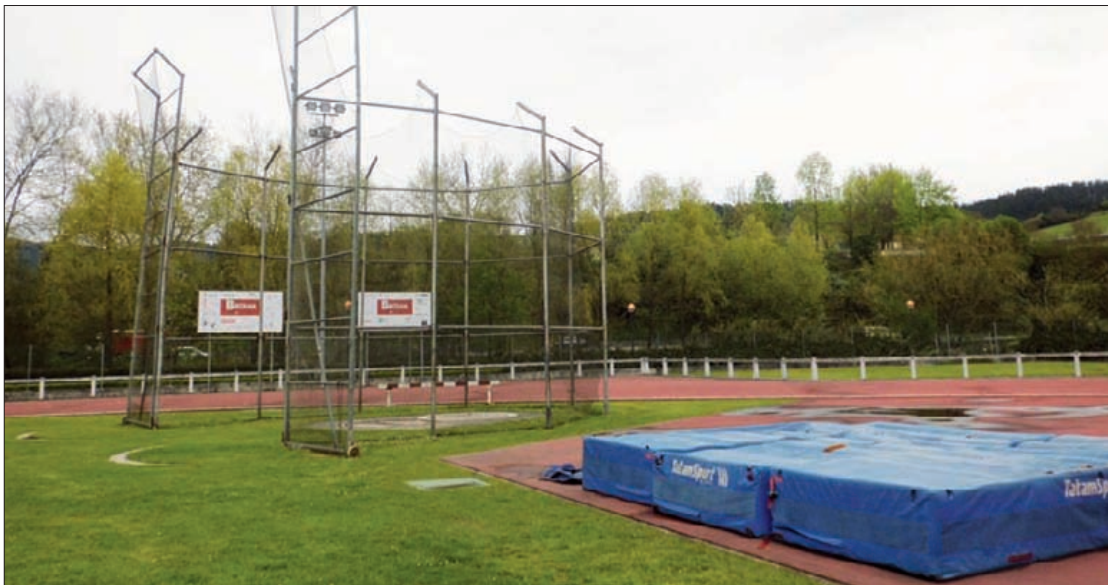
Durangoko atletismo pista Landakon kokatua dago.

Besteak beste, pertikarako koltxoneta eta jaurtiketa kaiola eskuratuko dituzte