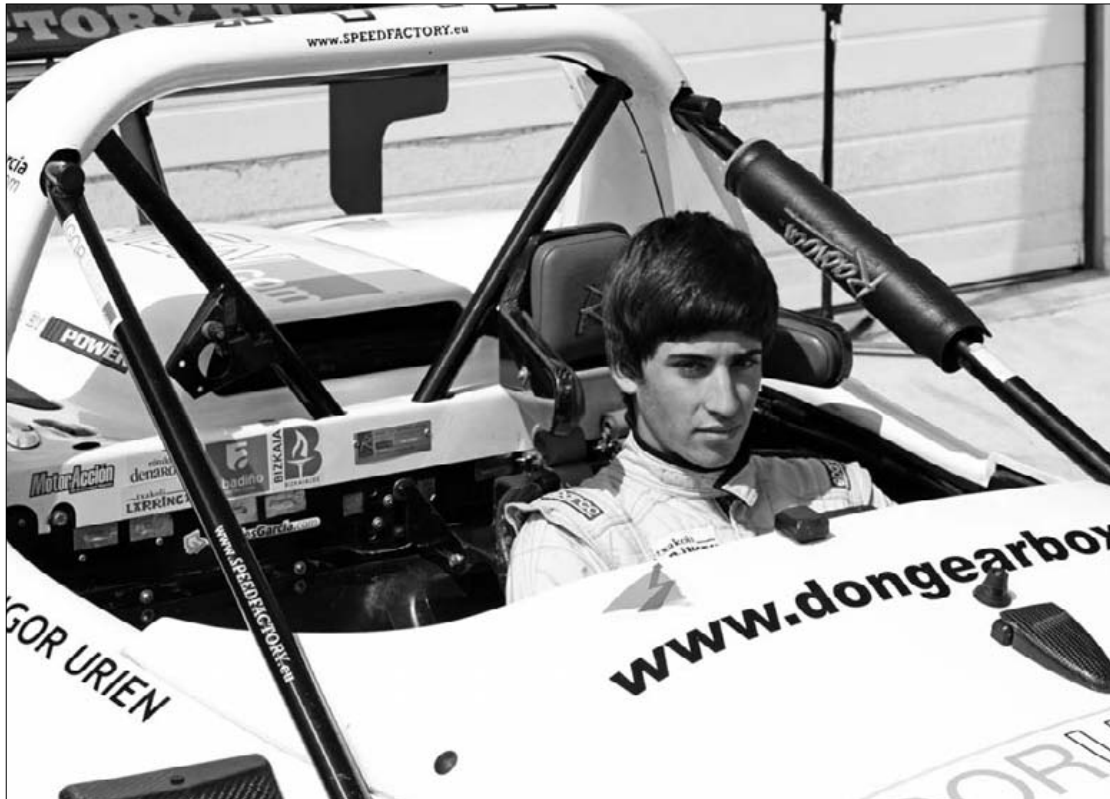
Domekako lehenengo lasterketan 50 autok parte hartuko dute.

Radical SR8a gidatuko du Silverstone, Spa eta Donington bezalako zirkuitu ezagunetan