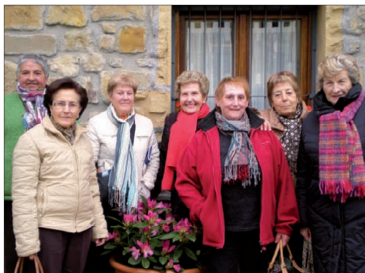
Elorrioko Alargunen Elkarteko kide batzuk.

EAEko federazioak elkarten egoera landuko du