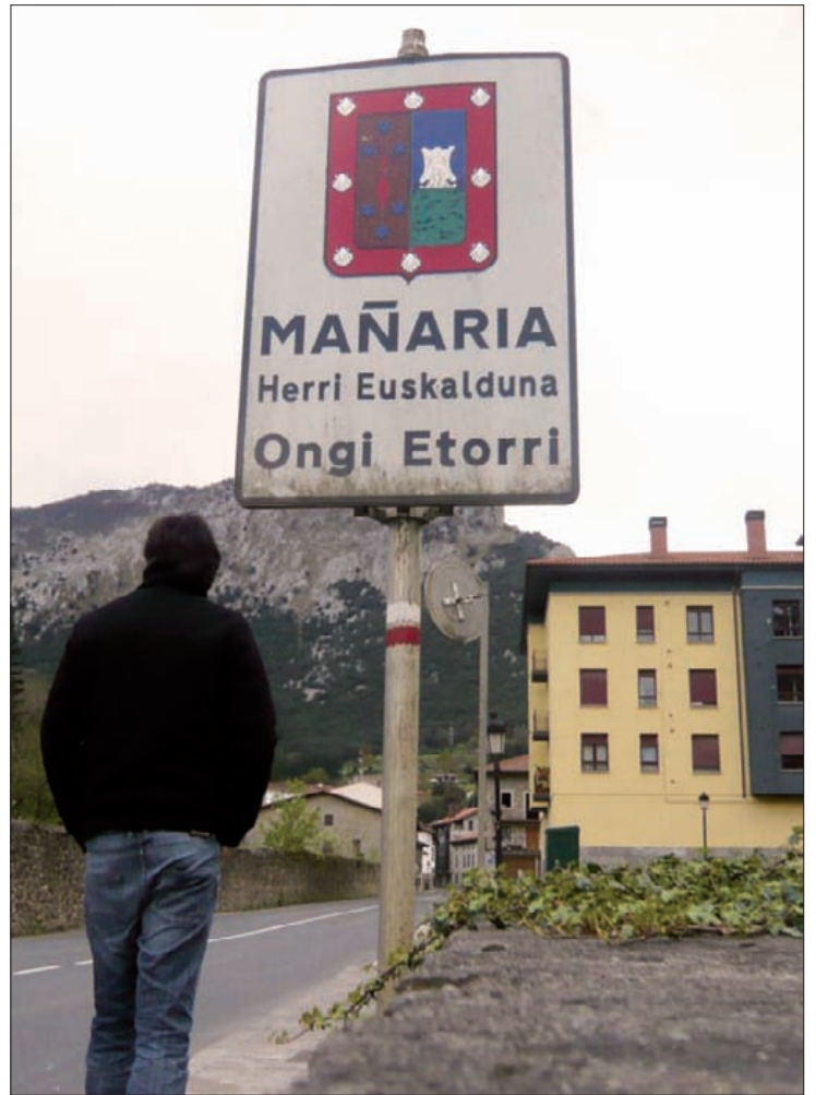
Azkeneko datuek diotenez, mañariarren %89 da euskal hiztun.

Bieremutako dinamika da UEMAREN. Batetik, udalak euskaldunen hizkuntza eskubideak errespetatzeko ildoak jorratzen du, instituzioan zein herriko zerbitzuetan eraginez. Esaterako, umeen erregistroa euskaraz egin ahal izatea. Bestetik, herritarren kontzientzia zuzatu gura dute, "herri euskaldunetan ere euskara galtzeko arriskua" ikusarazteko. "Sarri erdaraz berba egiten dugu, eta ingurukoak euskaraz egin duelako salbu dagoela uste dugu", esan dute UEMAKOek. Euskarak, bizirauteko, "nagusi" izango den lur-gunea behar duela diote. ■ M.Onaindia