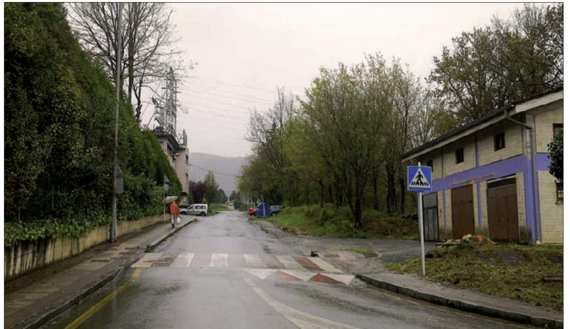
Olaburu kalea konpondu gura du aurten udalak eta horretarako 70.000 euro erabiliko dituzte.

"Hainbat premia" jaso ez izana kritikatu du Bilduk; tartean, Erraldeko proiektuari babesa