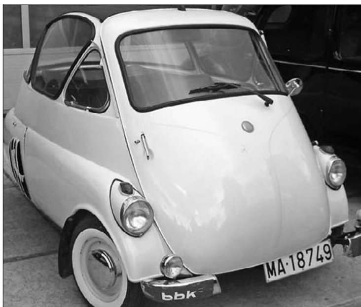
Izeta markako autoak ikusmina eragiten du zaleen artean.

25 urtetik gorako 40 bat auto egongo dira ikusgai Landako etorbidean eta San Roken