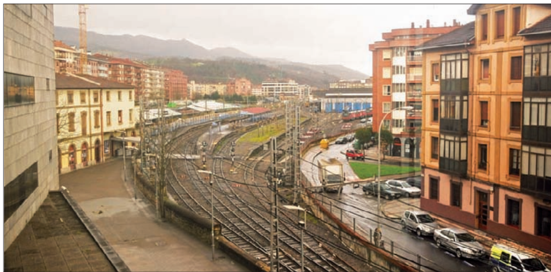
Durangoko tren geltoki berria eraikitzen dabilta.