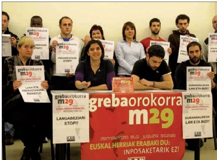
LABek langabetuen inguruko "dinamika erraldoia" eratuko du.

Mobilizazioa dela "tresna" bakarra iritzita, martxoaren 29an Bilbon eta Durangaldean antolatuko diren protestetan parte hartzera dei egin dute. ■ J.Guenetxea