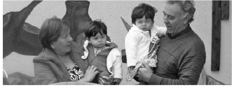
Bihar, martxoak 24, Amaiur eta Jarek 1. urtetxoa beteko dute. Prestaketa guztia eta gero aitita eta amamagaz doaz irteera parrillara. Prestatu zaitetz Vettel, zeregin gutxi daukazu-eta generazio berri honekin! Zorionak bio!