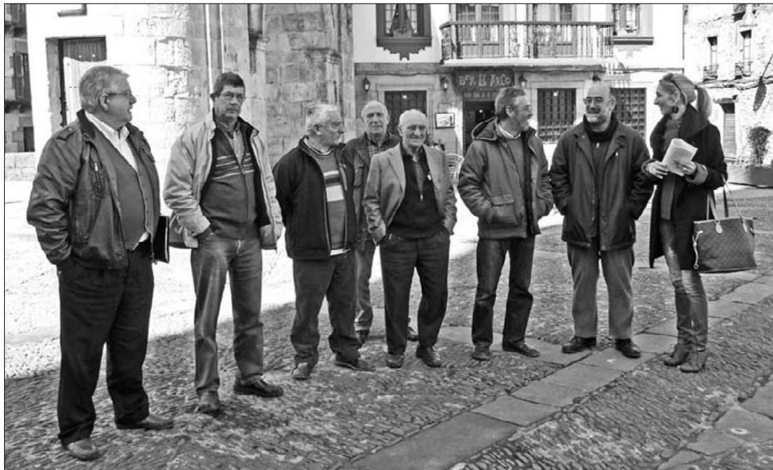
Elkarteetako kideek aurrerantzean bat eginda jokatzeko asmoa agertu dute.

"Ez du krisia konponduko" DAZeko Agurtzane Idigorasen iritziz, lege dekretuak ez du ostalari-zako krisia konpontzen lagunduko: "Kontsumitzeko dirurik ez badaukagu, ez dugu gehiago kontsumituko taberna ordu gehiagoz zabalik egonda ere". ■ A. Ugalde.