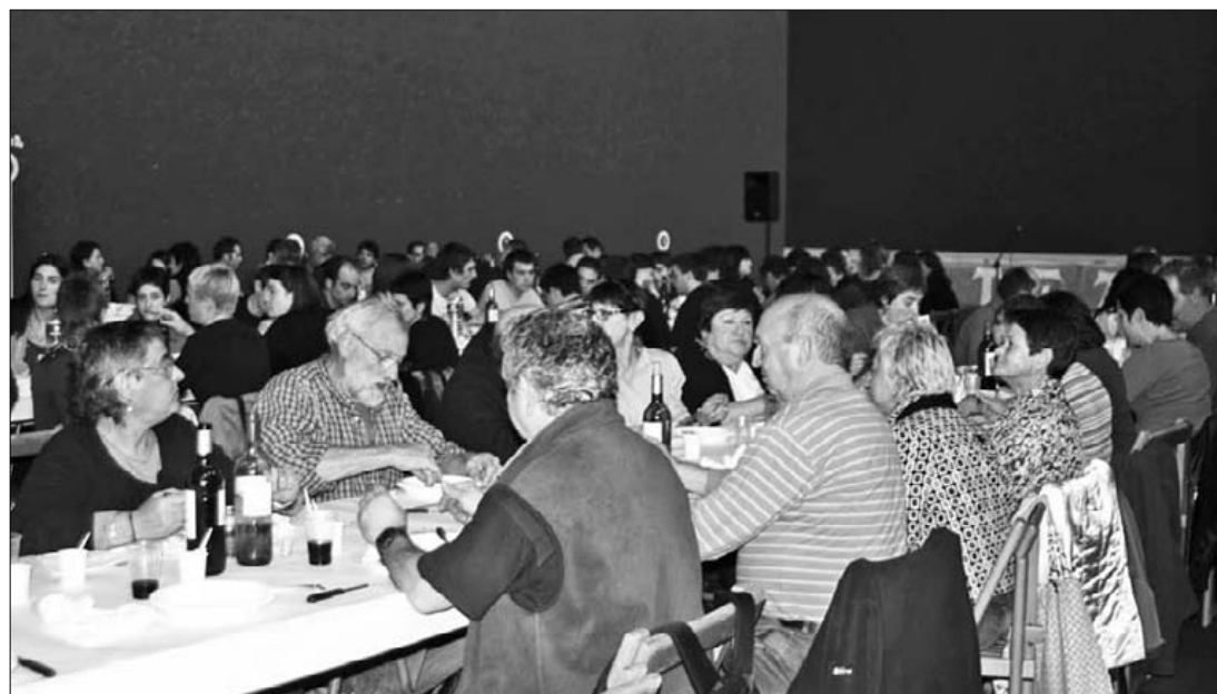
Antolatzaileek azaldu dutenez bazkarira joateko txartela erosi beharra dago.

Arratsaldean, 17:00etan, haurrentzako herri kirolak antolatuko dituzte plazan. Eguna borobiltzeko The Frikis, The Mokors eta beste talde sorpresa batek kontzertua eskainiko dute. Egun guztian zehar Ibaialde ikastolako guraso elkarte ordezkariek parte hartuko dute. ■ J.G.