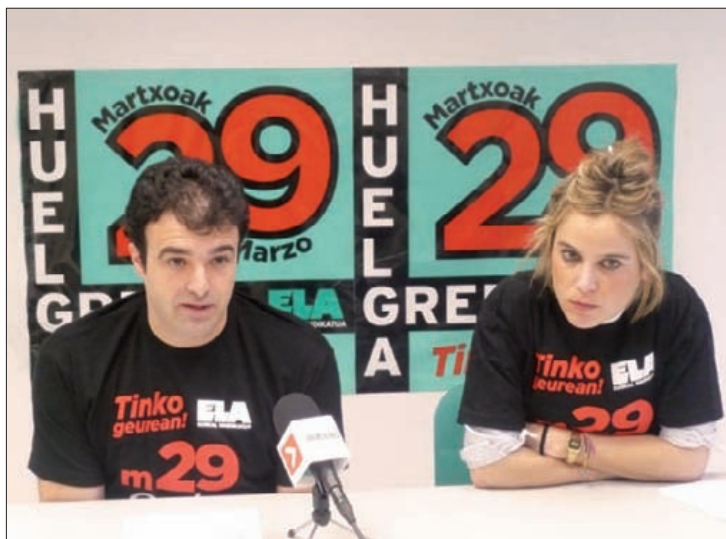
ELAk grebaren inguruko prentsurrekoa eman du asteon.