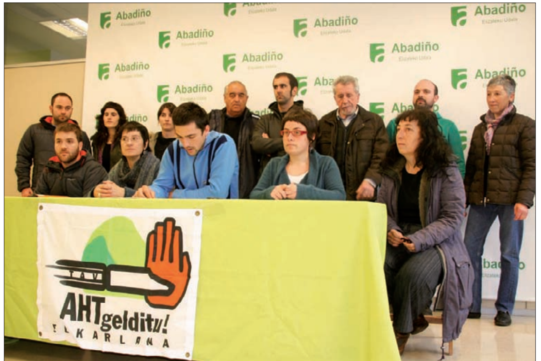
Durangaldeko Bilduko ordezkarien eta AHT Gelditu! Elkarlaneko kideen agerraldia.

Eusko Jaurlaritza, Abadiño-ko Udala eta Adif "arduragabeke-riaz" jokatzaren ari direla kritikatu dute. Udalaren eta Urkiolako Parke Naturaleko Paatronatuaren jarrera ere gaitzetsi dute, "orain arte isilik egon baitira". ■ I.E.