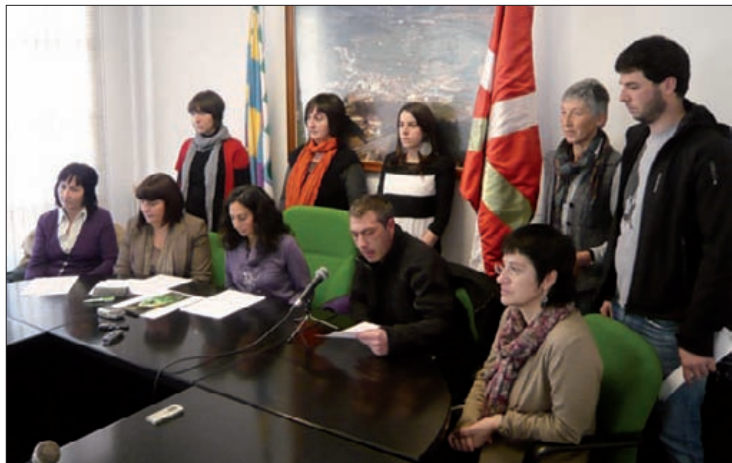
Durangaldeko Bilduren hainbat zinegotzi prentsurrekoan.

"Madrildik inposatutako erabakiak" salatu dituzte koalizioko zinegotziek