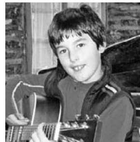
Martxoaren 26an gure Aimarrek 10 urte egingo ditu. Zorionak laztana, familia osoaren partez eta segi horrelakoa izaten!