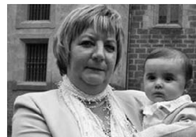
Zorionak amama! Jarraitu horrelakoa izaten, hain pozik, beti jolasteko gogoz... Askoi maite zaitugu. Zure familixatxue!