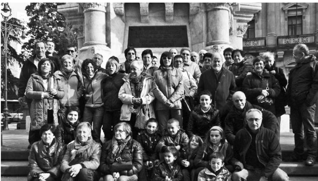
Hamabi Harriko bazkideok Iruñara txangoa egin genuen pasa den domekan Nafarroa bisitatzeko. Alde Zaharrean bapo bazkaldu ostean, foruen monumentuaren aurrean familia argazkia atera genuen.