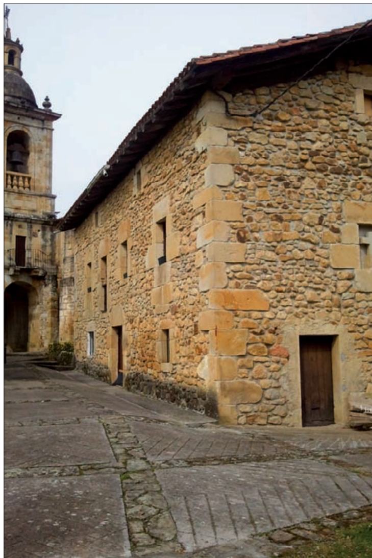
Elizbarrutiko eraikina dute alokatuta Umerrikoek.

Momentuz hamar umeren bueltan daude Umerrin, eta horietatik lau egunero doaz. Txikiak gurasoekin ere egoten dira, hezitzaileagaz gainera. Gurasoetako batek lehen hileotako balantze positiboa egin du, eta datorren ikasturterako ateak zabalik dauzkatela gaineratu du. ■ M.Onandia.