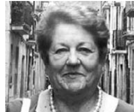
Zorionak Maribi ! Domekan bazkari ederrean artalde osoa batuko gara ama eta amama dotore honi musu asko emateko! Eskerrik asko danagatik