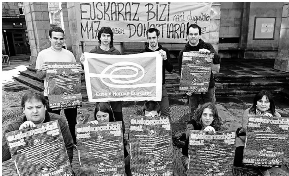
Atxikitu diren eragileetako kideak, aurkezpenean.

hainbat eragilek babesa agertu diote ekimenari: Berbaro euskara elkarteak, Zapaburu gazte konpartsak, Durangaldeko AEK-k, Gazte independentistek, Durangaldeko Ikasle Abertzaleek eta Kimuak aisialdi elkarteak. "Euskaldun eta burujabe izateko determinazioari beste bultzada bat ematera" gonbidatu dute. ■ M.O.