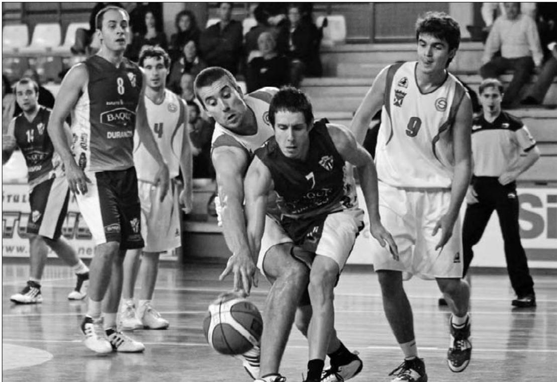
Jaitsiera fasean garaipen biren barruan daude hamarretik zazpi talde. Kepa Aginako

Irregularitasunak jaitsiera fasera kondenatu du Tabirako; hainbat mailaren egokitzapena dela-eta zazpi taldek galduko dute maila