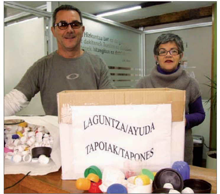
Izurtzako udaletxeko langileak tapoiz betetako kaxekin.