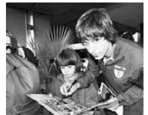
Zorionak aita, ama, koadrilla eta matienako guztien partez! Ageri da fan gehiago dituzula! Zure amari ere zorionak martxoak 8an!