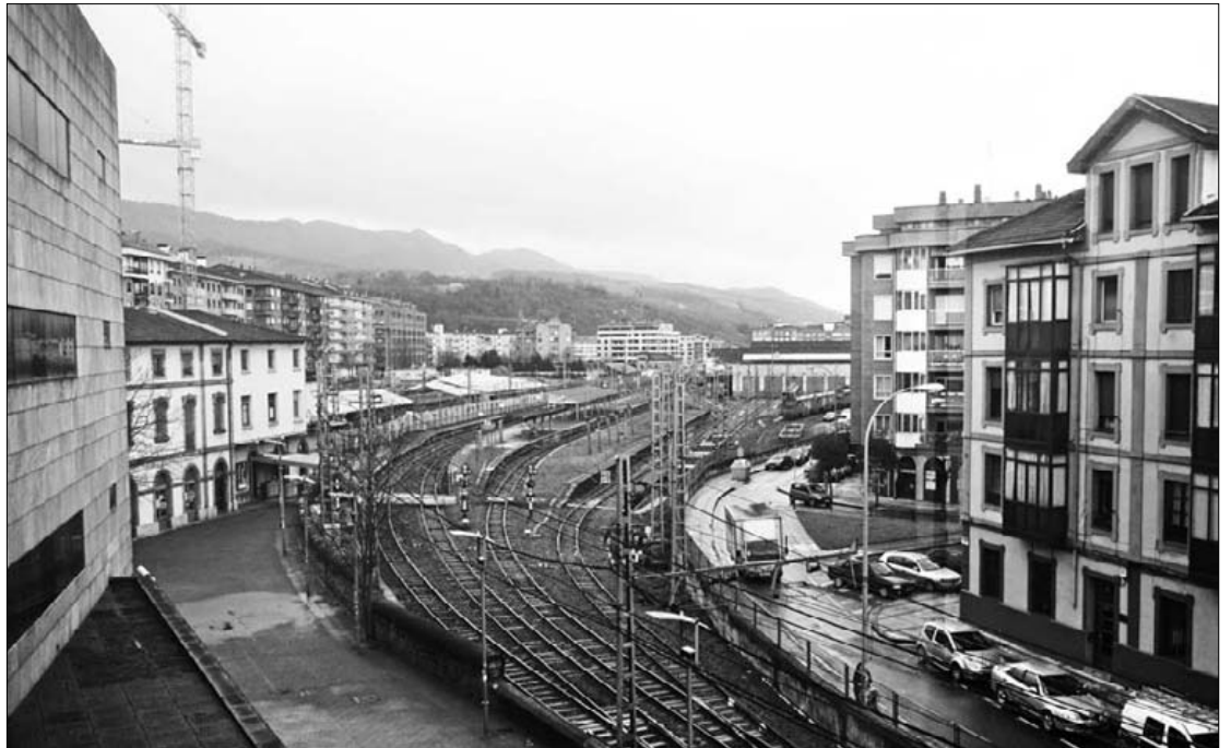
Argazkiko eremuan, Euskotrenen egoitza eta bost dorreak zeuden aurreikusita, besteak beste.