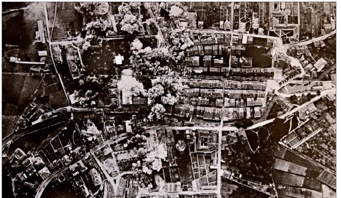
Aurten 75 urte beteko dira Durangoko bonbardaketetik. Gerediaga elkarteak

Durango 1936 K.E.: "Bonbardaketaren egiletza luzaroan isilik egon da"