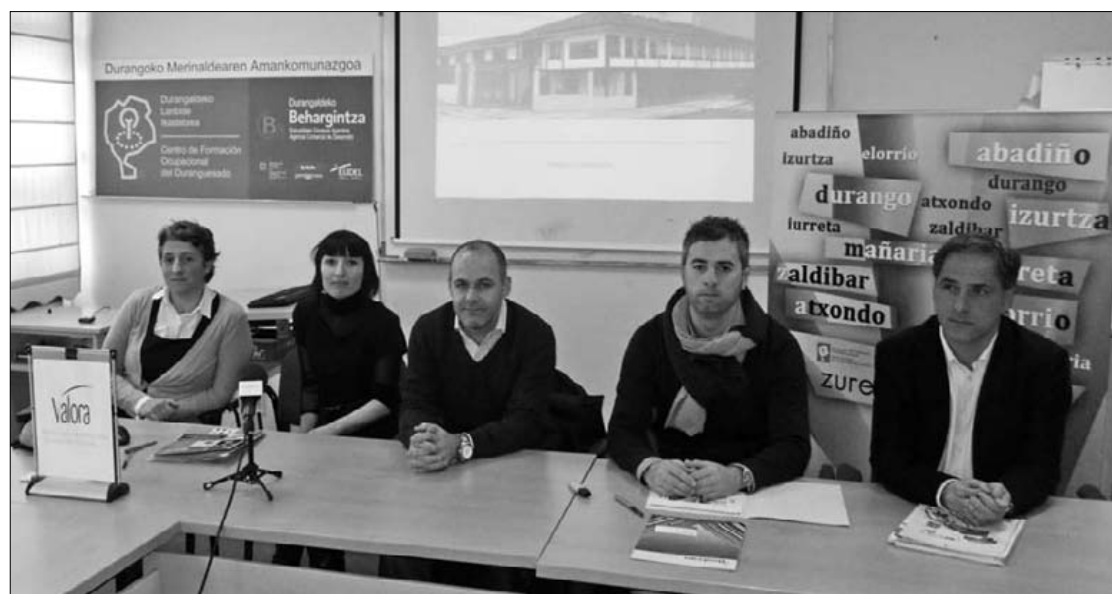
Enpresen diagnostikoa eta bete beharreko pausoak zehaztuko dituztela adierazi dute arduradunek

Egoeraren diagnostikoa egin eta gero, hartu beharreko neurriekin plangintza indibiduala egingo dute enpresa bakoitzarentzako. Erkuden Arrastua Behargintzako teknikariak azaldu duenez, "enpresa txikietan batez ere, beharrezkoa da diagnostikoa gainera jarraipena egitea, legeak ez dituztelako ezagutzen". ■ A. Ugalde