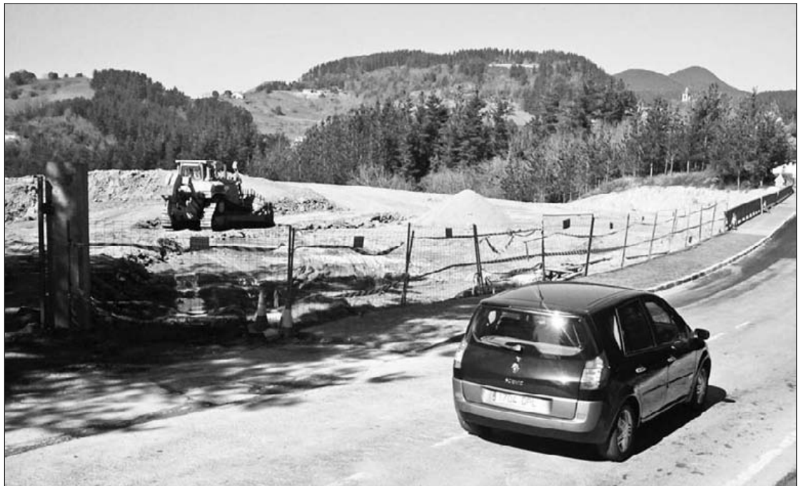
Errepideko lanak azkenetan direla, zabortegea ixtean amaituko dute egitasmoa.

Oraindino arduradunek ez dakite egitasmoa guztiz noiz amaituko den. Azken asteetan, baina, lanek aurrerakada nabarmena izan dute. Espaloia, bere zati guztietan, eraikita dago, eta ibilgailuen abiadura moteltzeko ezarritako sakangune edo oztopoak estali dituzte. Asteon, bideko marrak horitik zurira aldatzen ibili dira beharginak, eta bidegurutze bateko kanala ere konpondu dutela