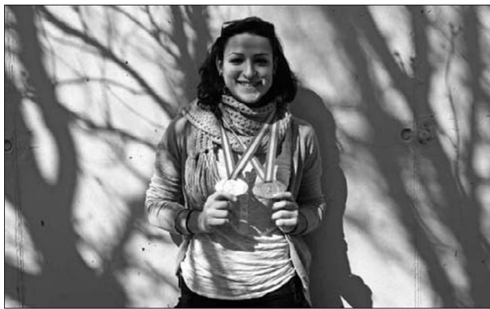
Distantzia berean urrea ere lortu du oraintsu promesetan.

Bestelakoan, hemendik aurrera pista gaineko txapelketetan zentratuko dira Durangoko Institutuko neskak. ■ J.D.