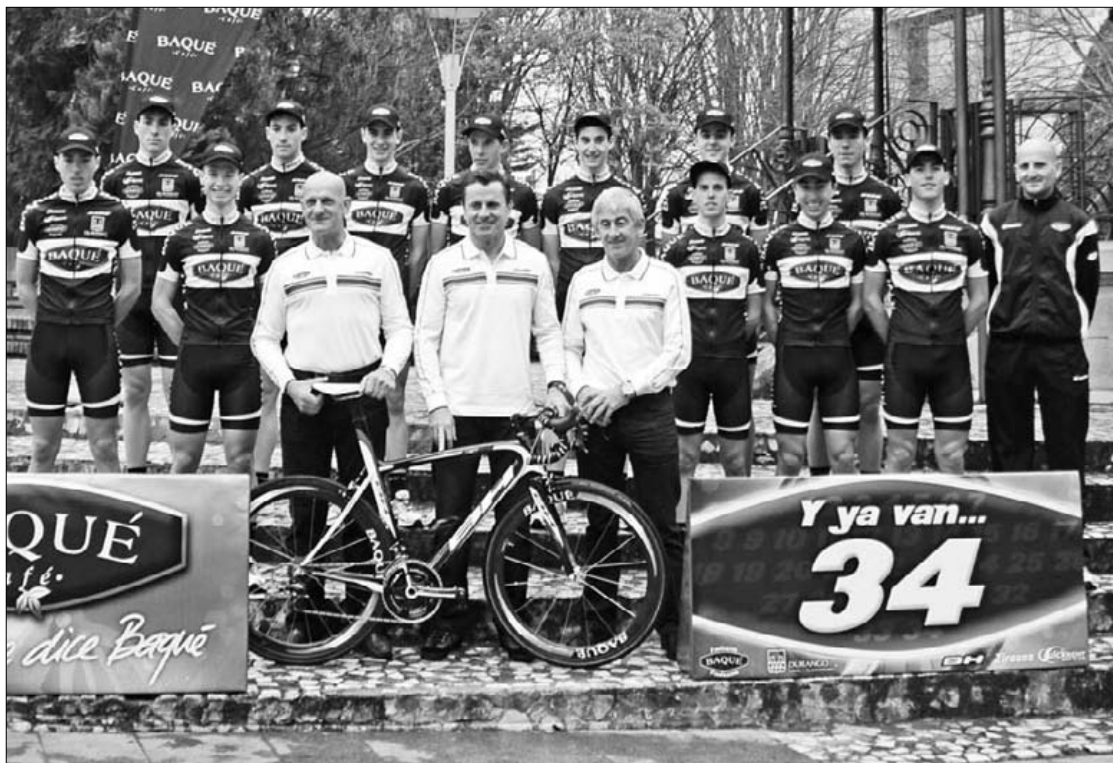
Eguenean aurkeztu zuen Cafés Baquék aurtengo talde ofiziala. Kepa Aginako

Hainbeste talde eta proba desagertzekotan diren sasoiak, Cafés Baquék 34. denboraldia egingo du errepidean