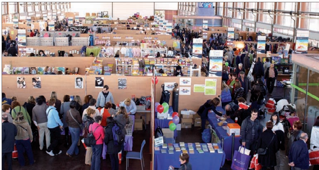
Asteburuan 18.000 bisitari itxaroten dituzte Aukera Azokan.