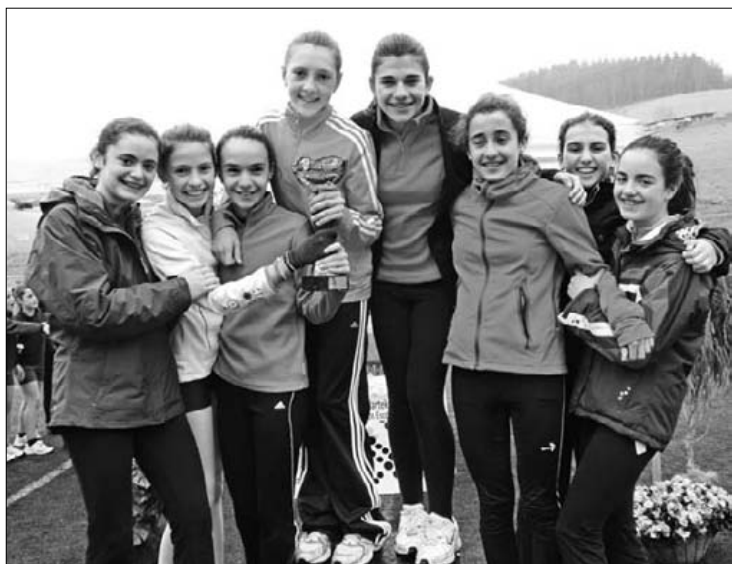
Hemendik aurrera pistako txapelketetan zentratuko dira.

Kanporaketa gaintzen badute ohorezko B mailan jarraituko du Durango Ilarduyak. Galduz gero, lehen nazional mailako bosgarren sailkatuaren kontra jokatuko dute azken kanporaketa erabakiorra. Izan ere, datorren denboraldian ohorezko B maila handitu egingo dute, eta horregatik lehen laurak automatikoki igoko dira. Esan beharrik ez dago, estuasunik larrienean ere maila bat beheragoko bosgarren sailkatuaren kontra jokatzea abantaila polita dela durangarentzat. ■ J.D.