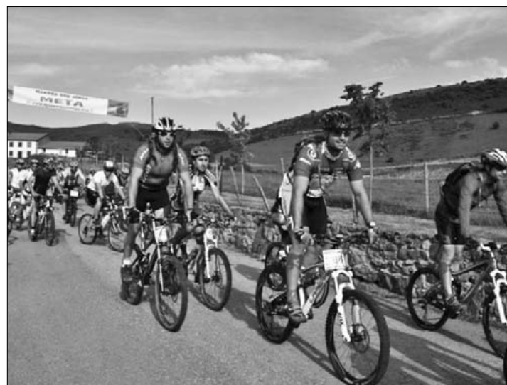
Goizko 10:00etan hasiko da lasterketa, Herriko Plazan.

29 eta 18 kilometroko ibilbide biez gainera, gaztetxoentzako beste bat prestatu dute