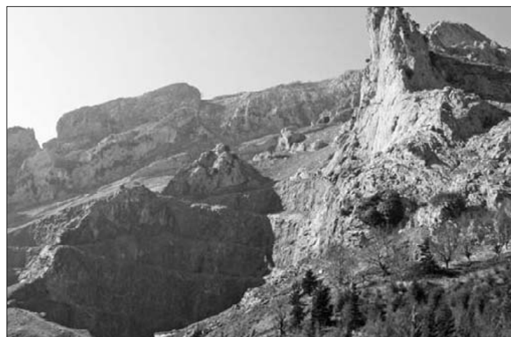
Adif enpresak aurkeztu zuen berreskurapen proiektua.

Ingurumen inpaktuari buruzko txostenik ez dago