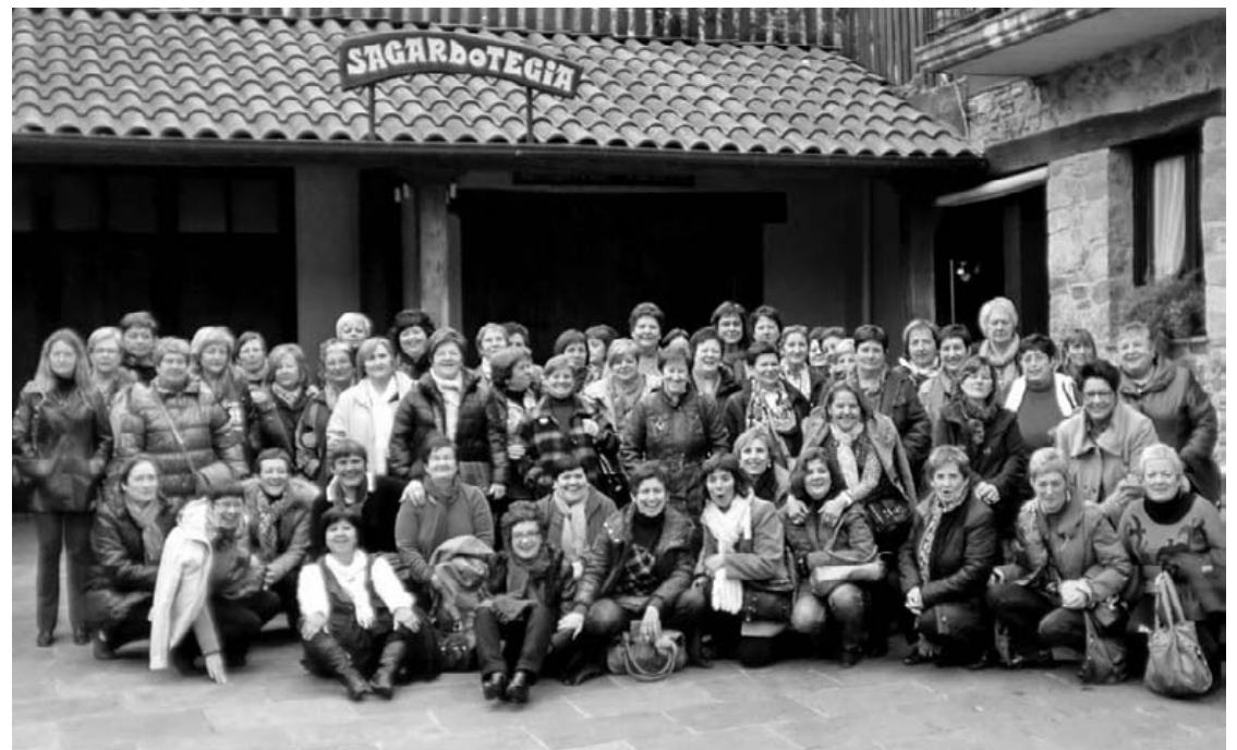
Otsailaren 5ean 55 emakume izan ginen sagardotegian, Anderebide elkarteak antolatutako irteeran.