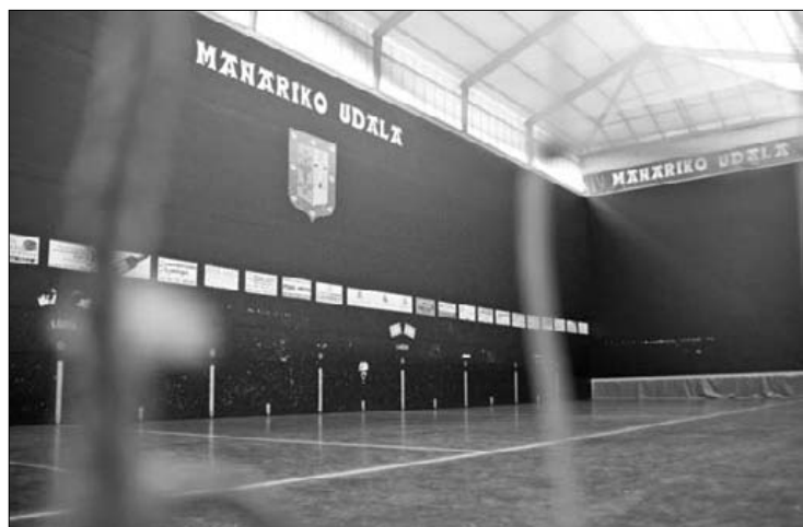
Asteburuetan ezingo da frontoia alokatu 11:00etatik aurrera.

Gaia lantzeko foro irekia burutu dute asteen