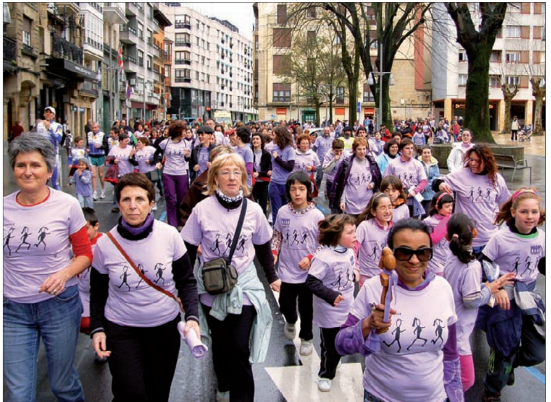
Aurten Durangoko 20 elkartek parte hartuko dute elkarri testigua pasatzen.

Durangoko Bateginez GKEari emango diote krosetako kamisetekin batutako dirua