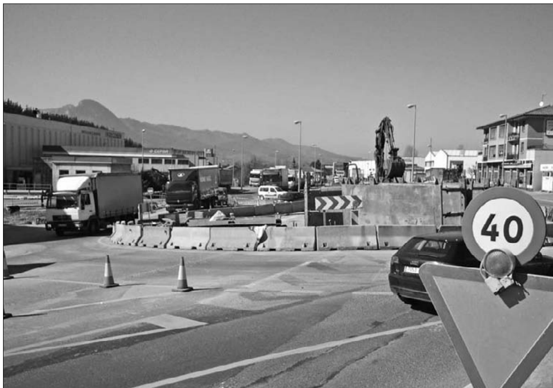
Gasolindegia parean hasi dituzte biribilgunea egiteko lanak.