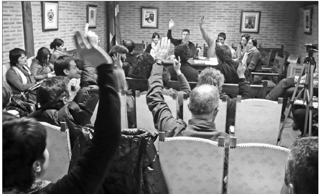
Astelehen arratsaldean burutu zuten Amankomunazgoko osoko bilkura, Astolan.

Guztira, 3 milioi eurotik gora jasoko ditu Gizarte Zerbitzuen atalak. Bilduk, ordea, murrizketa egotea salatu du. Euskararen alorrean ere, bestalde, "ez da logikoa Izarren Distira eta Futbola Oinarritik Euskaraz egitasmoak kopuruak igotzea eta Berbalaguni jasatea", dio koalizioak. Izarren Distirari buruz, nerabeen artean lehiakortasuna bultzatzen duela dio Bilduk, eta bigarrenaren kasuan gazteek futbola baino kirol gehiagotan dihardutela. Galdetu