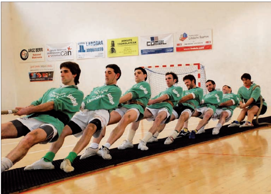
Gizonetan 640 kilora arteko finala jokatuko dute, eta emakumeetan 500 kilora artekoa.

Zapatuan 17:00etan Ezkurdi Jai-Alai pilotalekuan jokatuko den finalean, irabaztea du helburu Abadiño Sokatira Taldeak