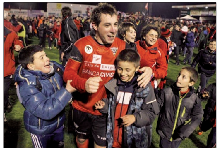
Espanyolen kontrako partidua magikoa izan zen.