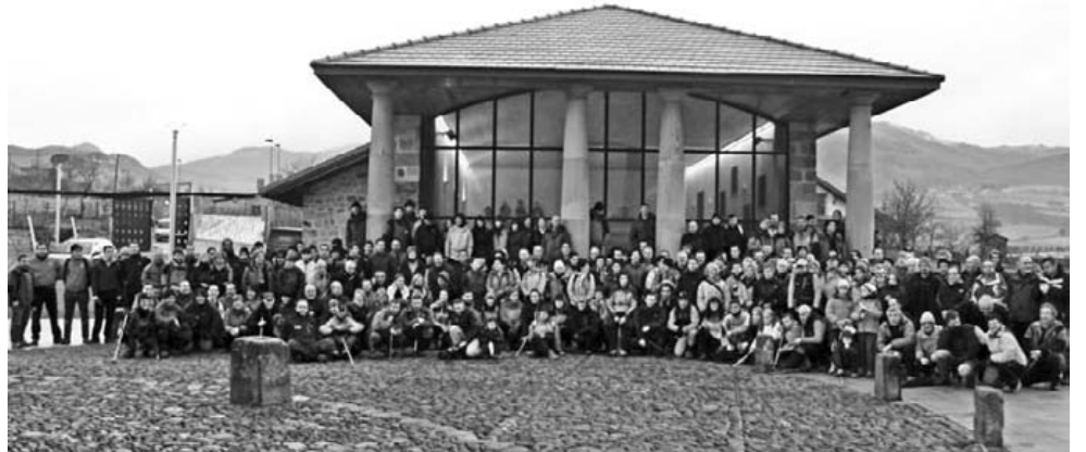
Eskerrik asko domekan Auzorik Auzo ibilbidean parte hartu zenuten guztioi. Hamabi Herri auzo elkarte