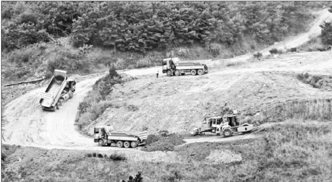
Iazko udan Lukupeko Troka eta Luku Txiki lurra botatzeko erabili zirela salatu dute. Goiuriko Kofradia