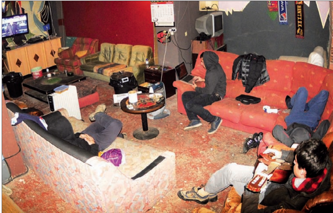
Lokalen erabilera arautzeko ordenantza iazko otsailan hasi ziren lantzen. Kepa Aginako

Lokalen erabilera arautzeko ordenantza onartu dute EAJK, PSE-EEK eta PPK