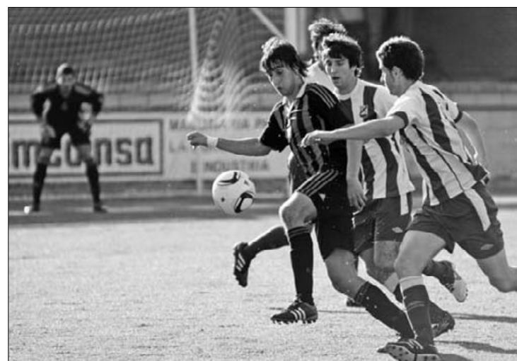
Elgoibar, Baskonia, Laudio eta Alaves Bri irabazi diete. K.A.

Azkeneko lau partidak segidan irabazita, onenen artean kokatu dira berriro ere