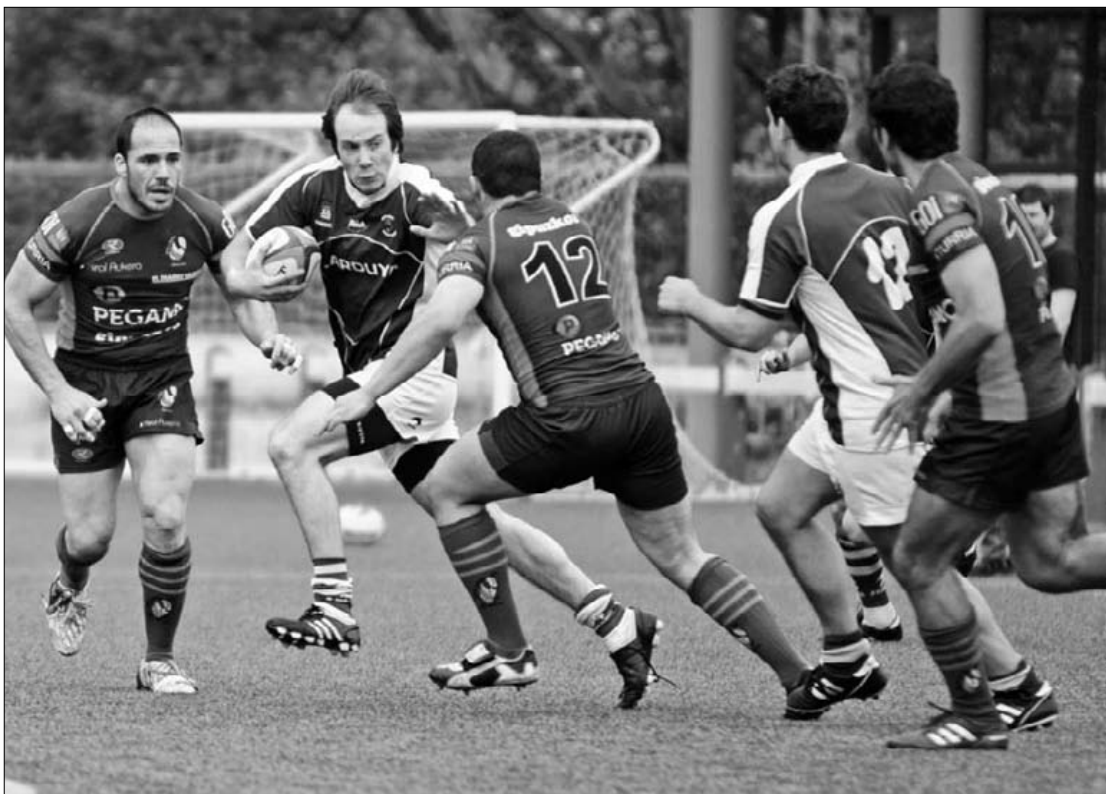
Hospitaleten kontra ez zen maila onean aritu Durango Ilarduya. Kepa Aginako

Hori ekiditeko lehenengo baldintza geratzen ziren partida biak irabaztea zen, eta horretan huts egin dute DRTko errugbilariek