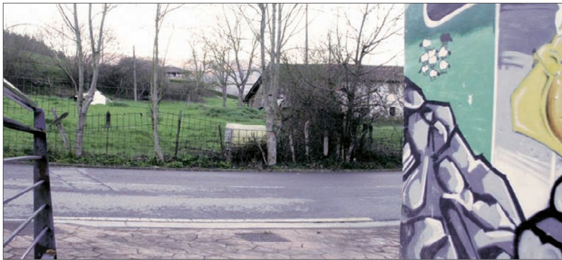
Frontoi aldamenean sustatu gura du udalak hamabost etxebizitzaren eraikuntza.

Herriko buzoietan zabaldu du udalak etxebizitza beharrei buruzko inkesta