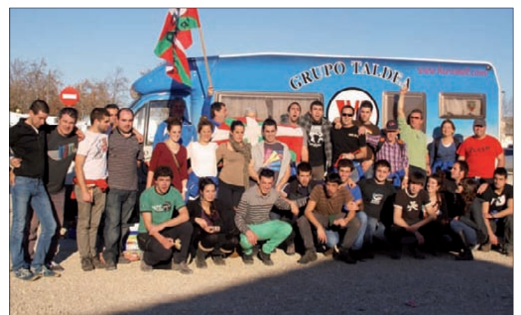
Murgoiok hurretik sentitu ditu zale eta lagunaren animoak.