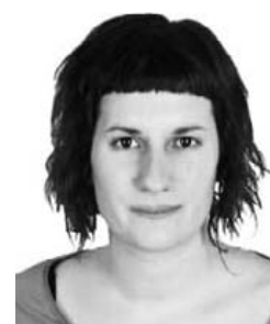
Libe Mimenza Kazetaria