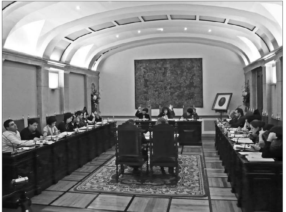
Herri-kontuen Euskal Epaitegiak hainbat ondorio eman ditu jakitera.