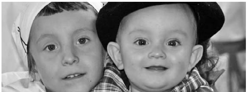
Urtarrilaren 19an eta 27an Uxar eta Igtzen urtebetetzeak izan dira. Zorionak eta musu potolo bana, etxeko guztion partez!