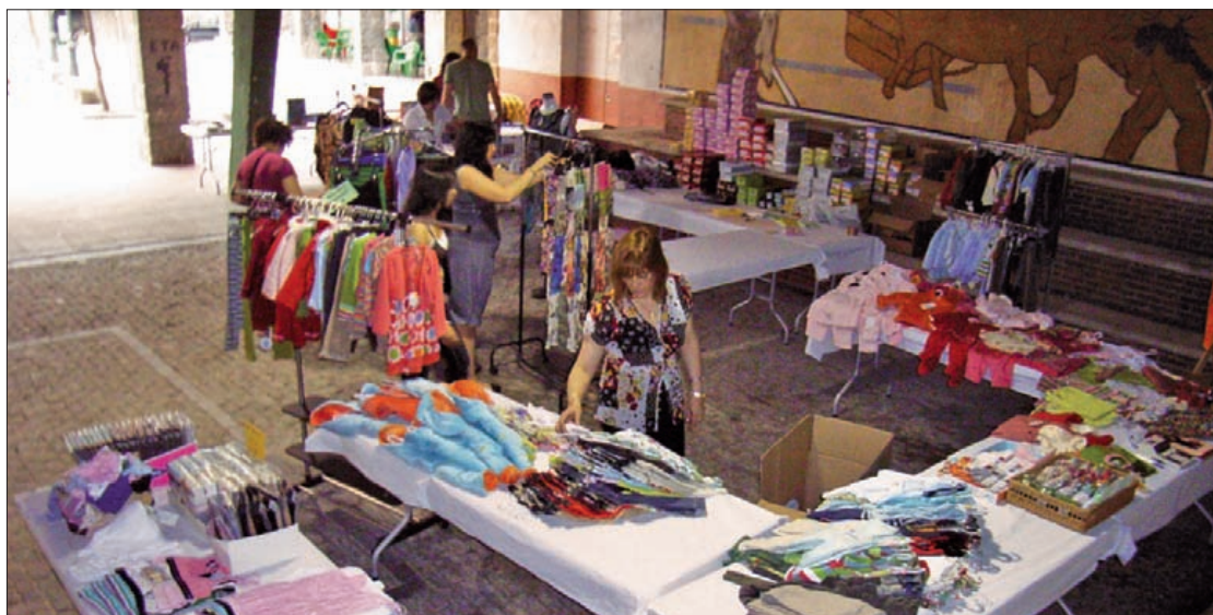
Aukera Azokaren aurreko edizio bateko irudia; probalekuan garatutakoa aldi hartan.

Zapatuan 10:00etatik 19:00ak arte zabalduko dute; domekan 11:00etatik 14:00etara