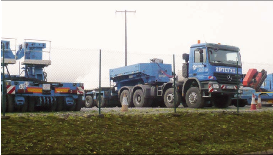
Gruas Artetxek dioenez, enpresa "dimentsionatuta" egon da eta orain "egokitu" egin behar du.