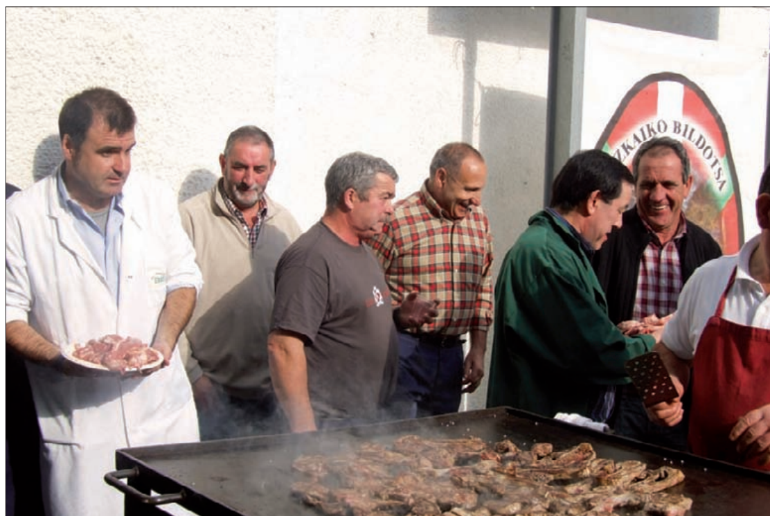
Urtarrilaren 14tik ez dago produkzioz Erralde hiltegian.

Bitartean, behargin batzuek mantenimenduan dihardute, eta besteak oporretan daude. "Abokatuekin gabilta langileen egoeraz zelan kudeatu zehazten". ■ J.G.