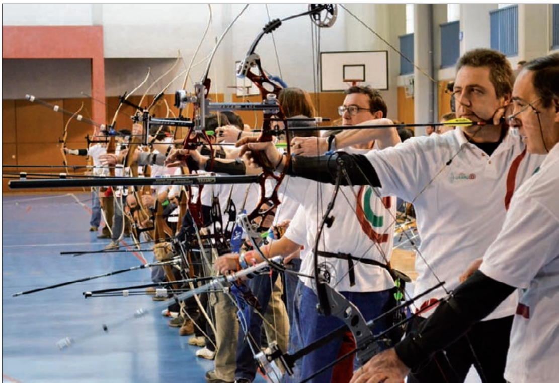
Adinaren zein arku motaren arabera maila batean edo bestean jardungo dute arkulariek.

Arkularien Euskadiko Ligako laugarren jardunaldia Durangoko Landako kiroldegian jokatuko dute, zapatu goizean, 65 lehiakidek