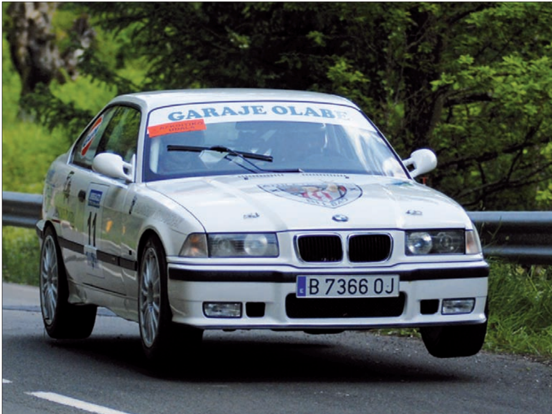
Durangalde Racing elkarteak zortzi lasterketen antolakuntza lanean ere parte hartuko du.

Urte biko parentesiaren ondoren, 2012ko ekainean berreskuratu egingo dute rally hori