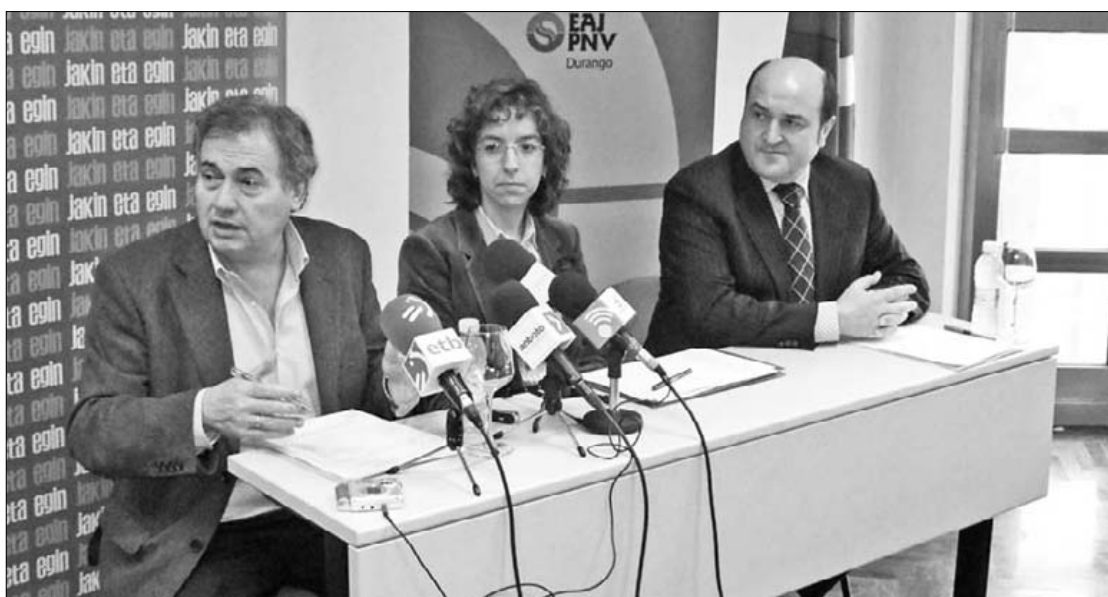
Trenbidearen segurtasun falta nabarmendu dute EAJko ordezkariak.

ko proposamena aurkeztu dutela jakinarazi dute, lanak aurten amaitzea eskatzeko. Obraren atzerapena eta haren gaineko "informazio falta" salatu dute Durangon egin-