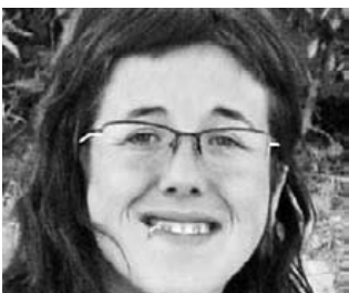
Zorionak Itziarrek 30 urte bete zituen. Zorionak guapisima! Musu handi bat zure lagunen partez! Jarraitu beti bezain irribarretsu!