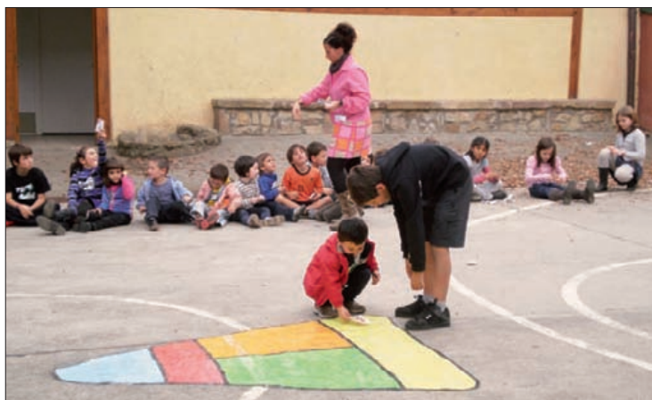
Aurreko esperientzia bateko unea, Txintxirri ikastolan.

"Bizikidetza hobetzeko 9 esaldiak" gogoratuz ekingo diote 14:45ean, eta 15:00etatik aurrera jolas kooperatiboen zirkuituan parte hartuko dute taldeka. ■ M.O.