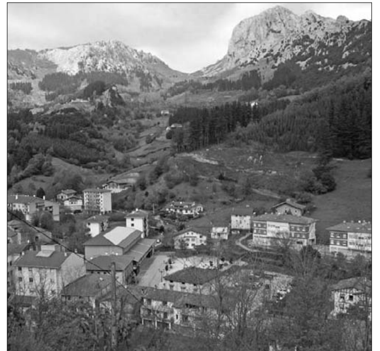
Plan Orokorra berritzeko 100.000 euro aurreikusi dituzte. J.F.

Guztira, 853.000 euro inguru jaso ditu Bilduko gobernu taldeko zinegotzien bozkarekin aurrera egin zuten aurrekontu proposamenak; horietatik 100.000, herriko Plan Orokorra berrikusteko prozesua abiatzera bideratu gura dute. Endika Jaio alkateak aurreratu duenez, 2012an udala-