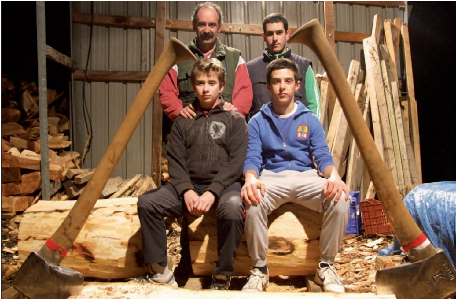
Mallabiko Goita auzoan entrenatzen dute; gune berezi bana atonduta dute aizkolarientzat eta harri-jasotzaileentzat.

Mallabiko Txondor herri-kirol elkartean hainbat gazte dabilta aizkolari zein harri-jasotzaile izateko trebatzen