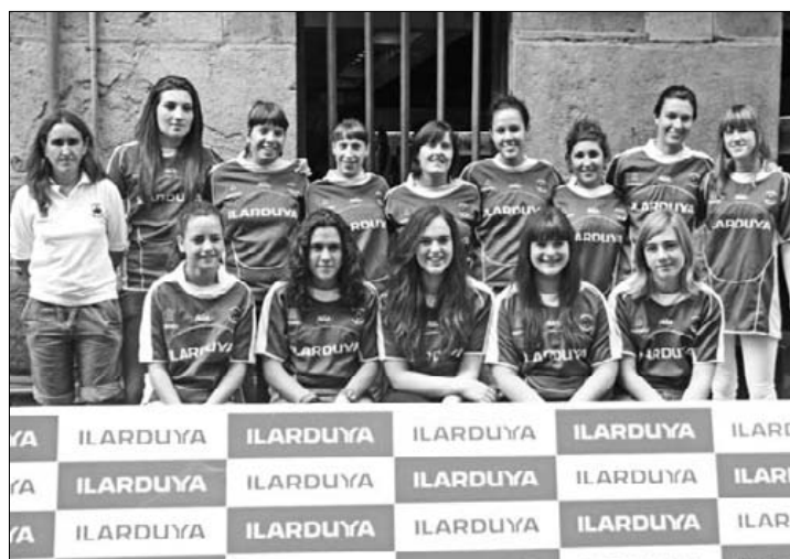
Gaztedi azken sailkatua hartuko dute etxean emakumeek.

Bestalde, gizonen talde nagusiak galdu egin zuen Santanderren aurka (23-25). Hecesak, aldiz, 40-12 menderatu zuen Bartzelona. Ondorioz, azken tokira jaitzi da berriro Durango Ilarduya. ■ J.D.