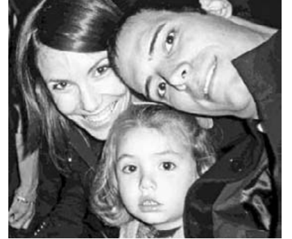
Zorionak Sara eta izeko! 21ean ospatuko dugu zuen urtebetetzea Formigalen! Paregabea izango da!