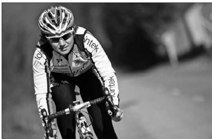
Londresko Jokoek lehentasuna izango dute udaberrian.