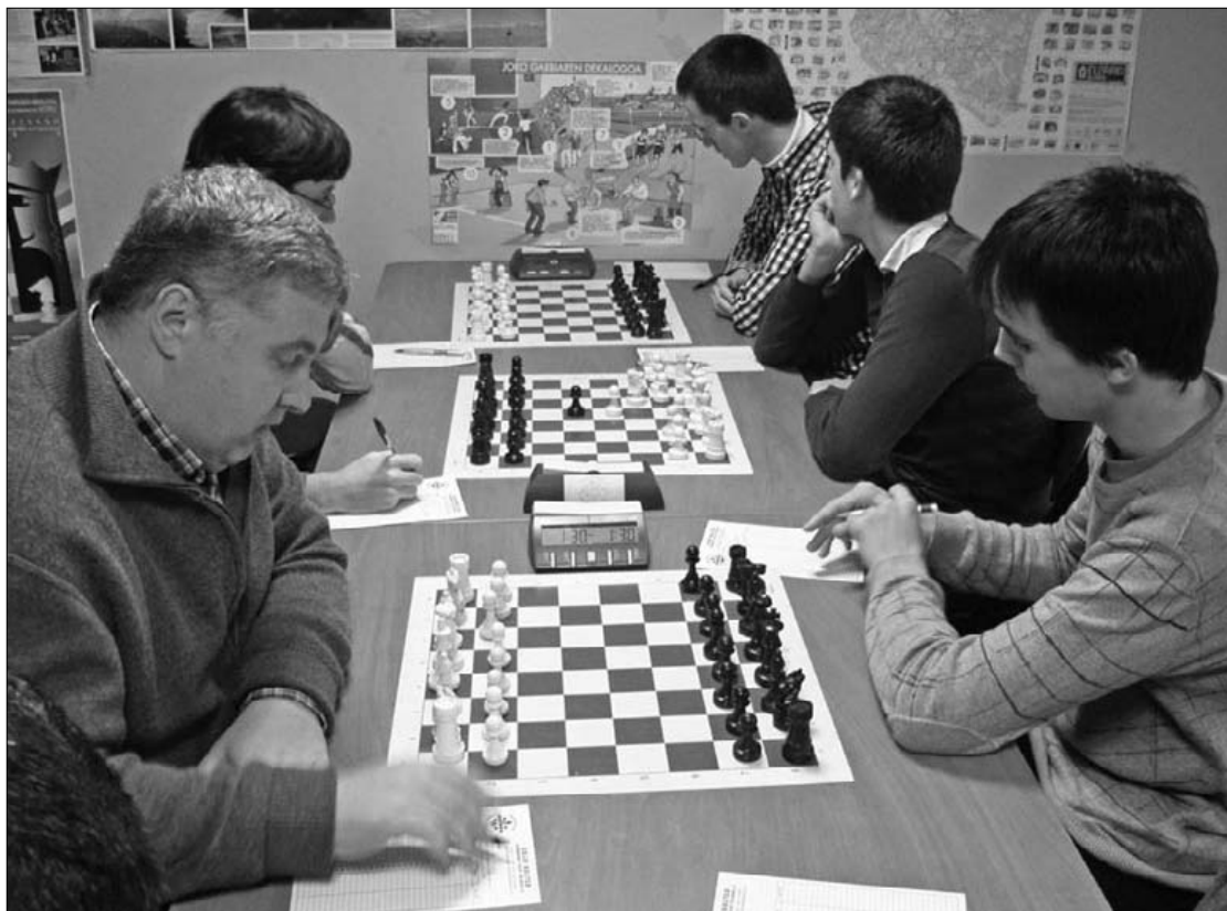
Zaldi Baltzak garaipen garrantzitsua lortu zuen lehen jardunaldian ez jaisteko borrokan. Zaldi Baltza

Larrasoloetatik Abadiñora joan dira; lehenengoek joandakoen hutsunea sumatuko dute eta bigarreni igotzeko ilusioa piztu zaie