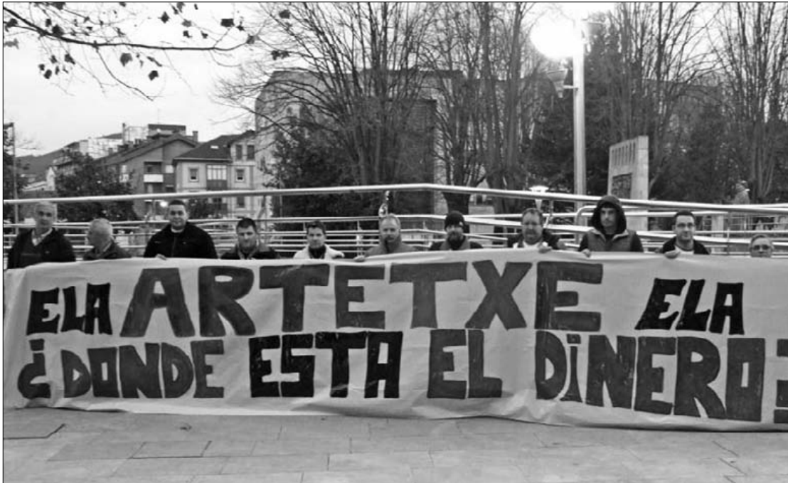
Durangoko Ezkurdin egin zuten protesta Gruas Artetxeko langileek, eguaztenean.