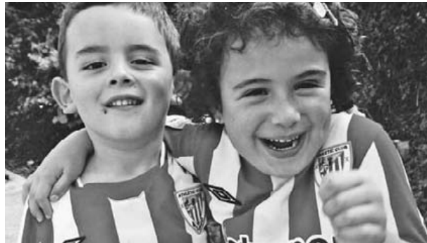
Pasa den urtarrilaren 12an, gure printzesita Leirek 5 urte egin zituen, eta datorren 23an bere lehengusu Gorkak ere urteak betekotu ditu. Zorionak etxeko guztien partez, eta horrela jarraitu!