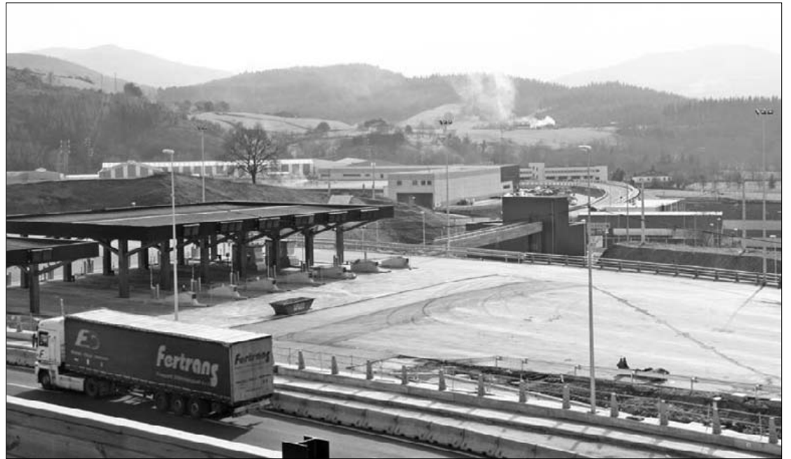
"Zenbait ustekabekok" eragin dute obraren amaiera atzeratzea.

Lanak amaitutzat eman orduko, auzotarrei eragiten dieten aipaturako obra horiek "amaitu barik hemendik hanka egin ez dezaten" eskatzen dute Hamabi Harri auzo elkarteok. "Egin ez dutena egin, amaitu barik utzi dutena amaitu edo txarto amaitu dutena konpondu dezaten" eskatzeko, udaleko ordezkariekin eta obraren ardura daukan Interbiak-ekin batzarra egin gura dute. ■ I.E.