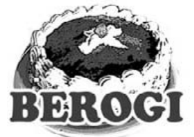
Zorionak Izar ! 15 egunero zotz egin dugun tarta zuri egokitu zaizu. Txartela gura duzunean jaso dezakezu, lurretako Bixente Kapanaga 9an.