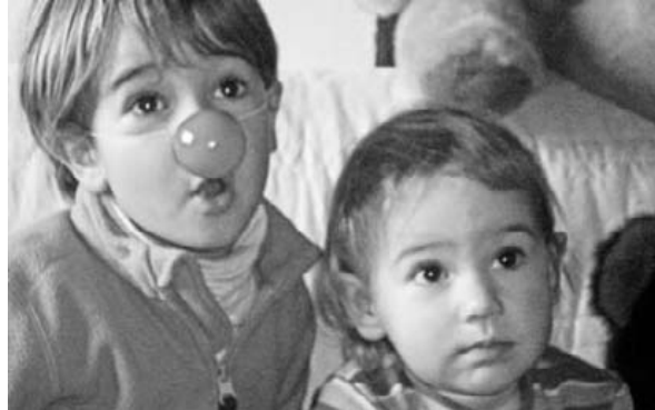
Sudurrean gorri, bihotzean irri, Maddi ta Garazi maitagarri! Zorionak eta pottak gure etxeko bi perle!

zorionak@anboto.org • Eguazteneko arratsaldeko 17:00ak arteko epea