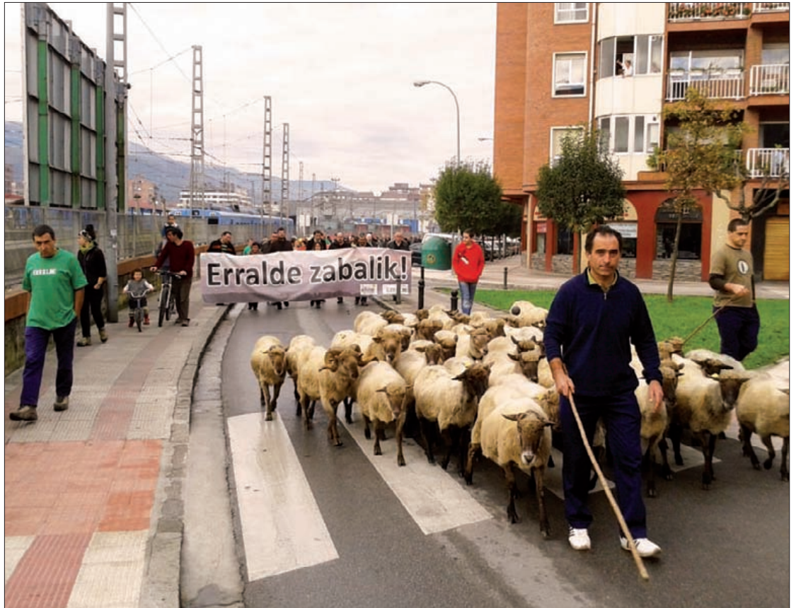
Plateruenean aurkeztu dute egitasmo berria, martitzen honetan.

Lan egiteko moduaren aldaketa horrez gainera, beste konponketa batzuk jasotzen dituen plangintza aurkeztuko dio Erraldek Osasun Sailari, "ahalik eta arinen zabaldu ahal izateko". Plangintza hori sortzeko Erraldek kanpo diharduen teknikari bat kontratatatu dutela aurreratu dute.