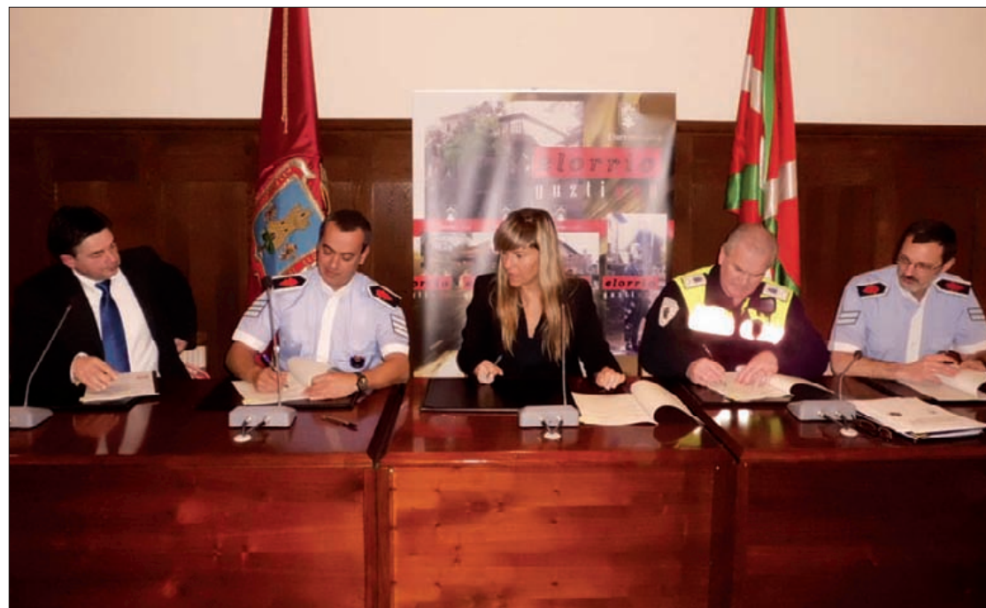
Udala, Udaltzaingoa eta Ertzaintzaren ordezkariak batu ziren joan zen barikuko sinatze-ekitaldian.

kasuen aurrean jokatzeko era ezarzteza dute helburu. Koordinazio maila altuena lortzeko eta administrazio autonomiko eta lokalaren giza-baliabideen eta materialen