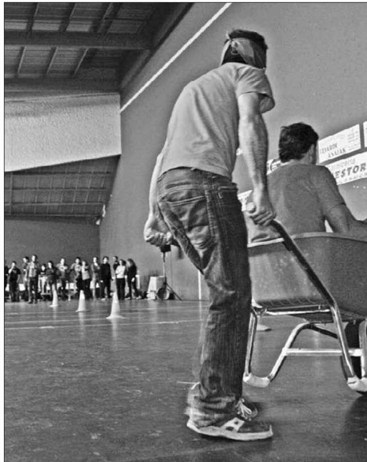
Nekazal kirolari bat, karretilan hartu eta begiak estalirik tiraka.

Zekorrek taldea izan zen garaile Nekazal Olinpiadetan, 300 euro poltsikoratuz