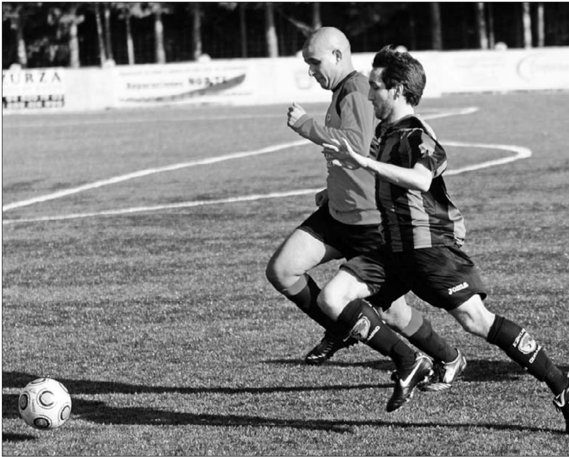
Joan zen asteburuan 2-3 irabazi zuen Ezkurdik Berrizen kontrako derbian. Kepa Aginako

Ezkurdik eta lurretako Bk hirugarren erregionaleko lehenengo postua izango dute jokoan