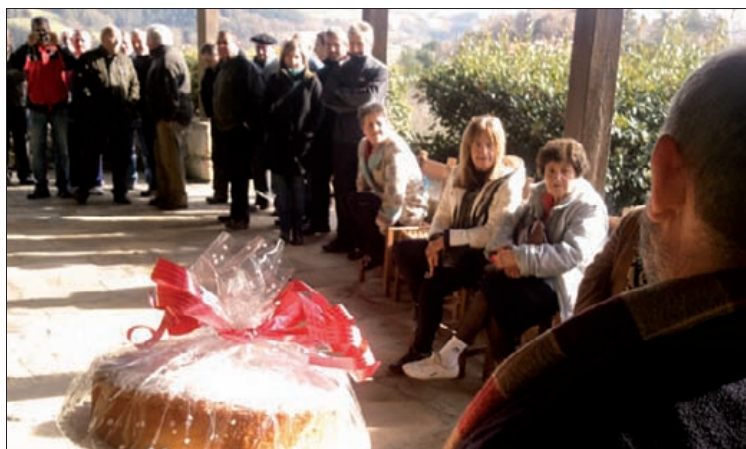
Elizabarrin batu ziren herritarrek produktuak eskuratzeko.

1.130 euro batu zituzten San Anton egunez