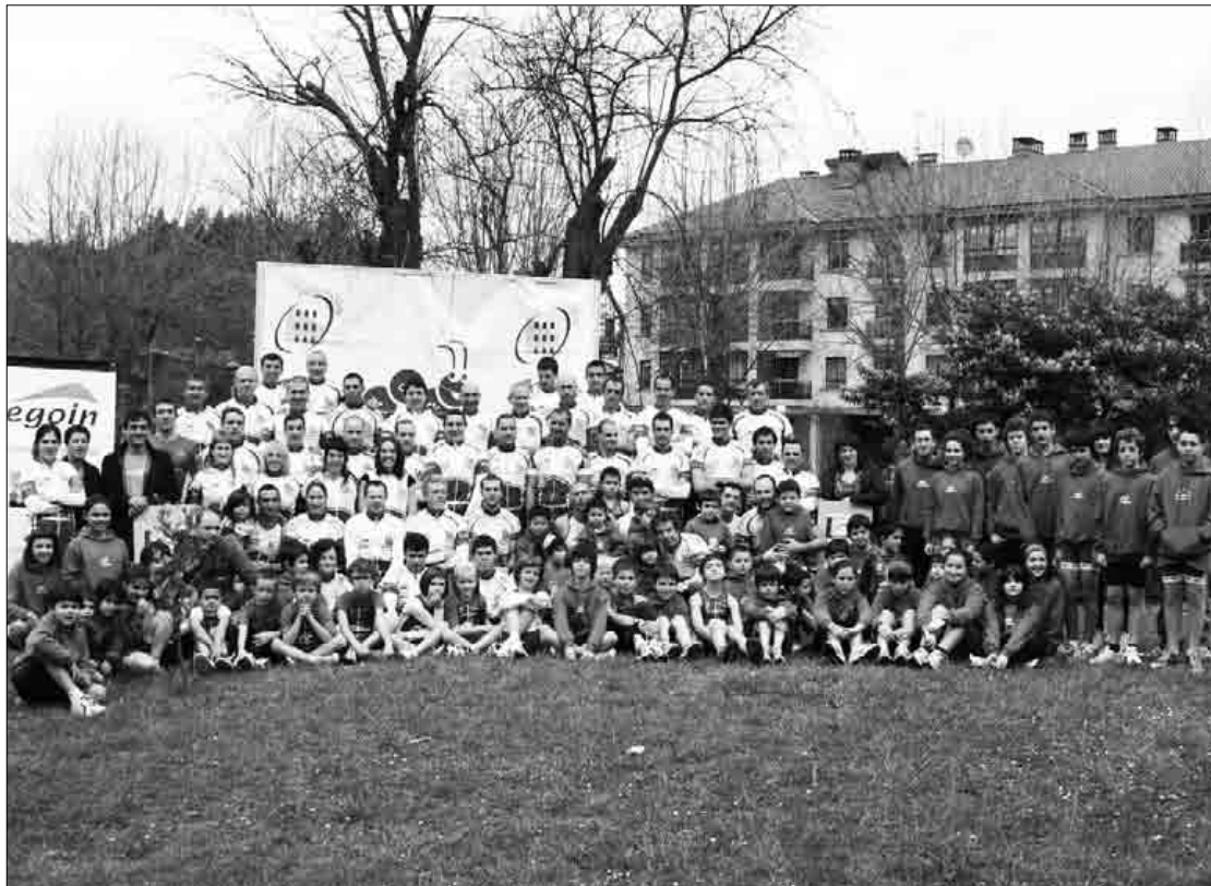
Martxoaren 12an egin zuten triatloi taldearen eta triatloi eskolaren aurkezpena.

Martxoaren 26an jokatuko da euskal zirkuiturako puntuagarria den duatloia. Probaz gainera, egun osoko egitaraua prestatu dute