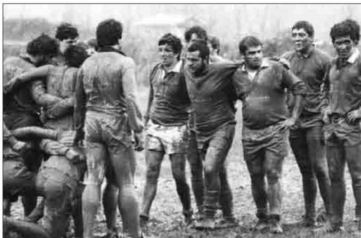
25 urteotan mota guztietako zelaietan jokatu dute DRTkoek.

heldu dira lehenengo taldeetara. 250 gizonezkoenera eta 137 emakumezkoenera. "Gure ustez, aukera bat eskaini diegu durangarrei kirol hau praktikatzeko" dio Iriondok. 25 urteotan DRTk "etxeokoen" jokatzeko filosofiari eutsi dio. ■ A.M.