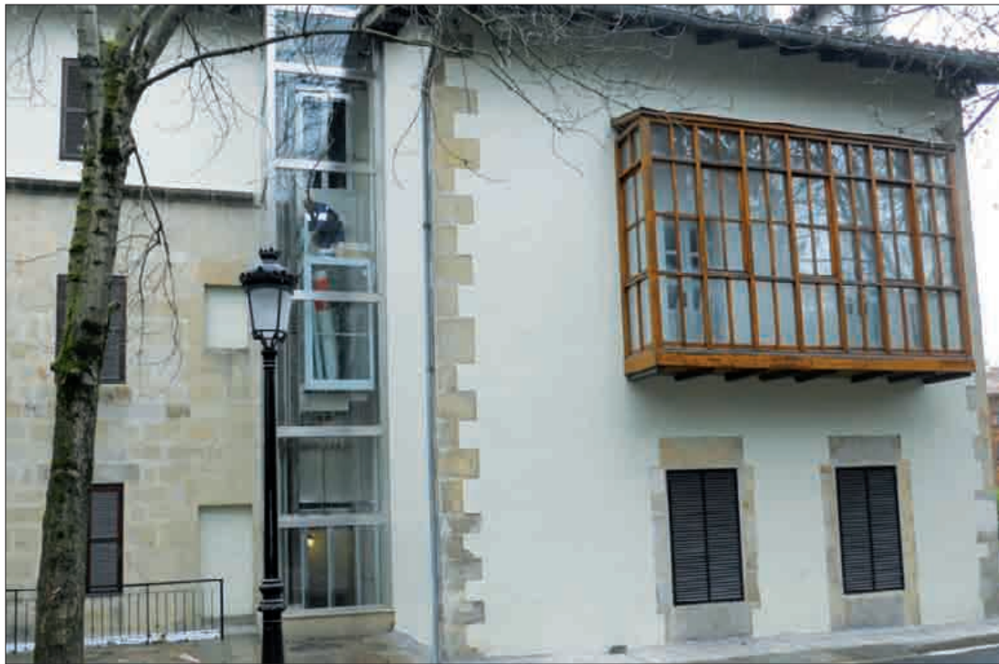
Hainbat aukera aztertu eta gero, kanpoaldean ipini dute igogailua.

Mugikortasun arazoak dituzten herritarrentzako erraztasunak ipini dituzte