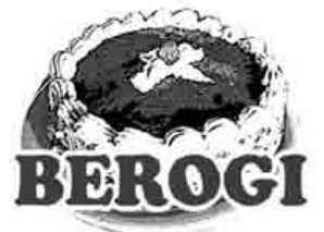
Zorionak Aner! 15 egunero zotz egin dugun tarta egokitu zaizu. Oparia eskuratzeko txartela gura duzunean jaso dezakezue, Iurretako Bixente Kapanaga 9an.