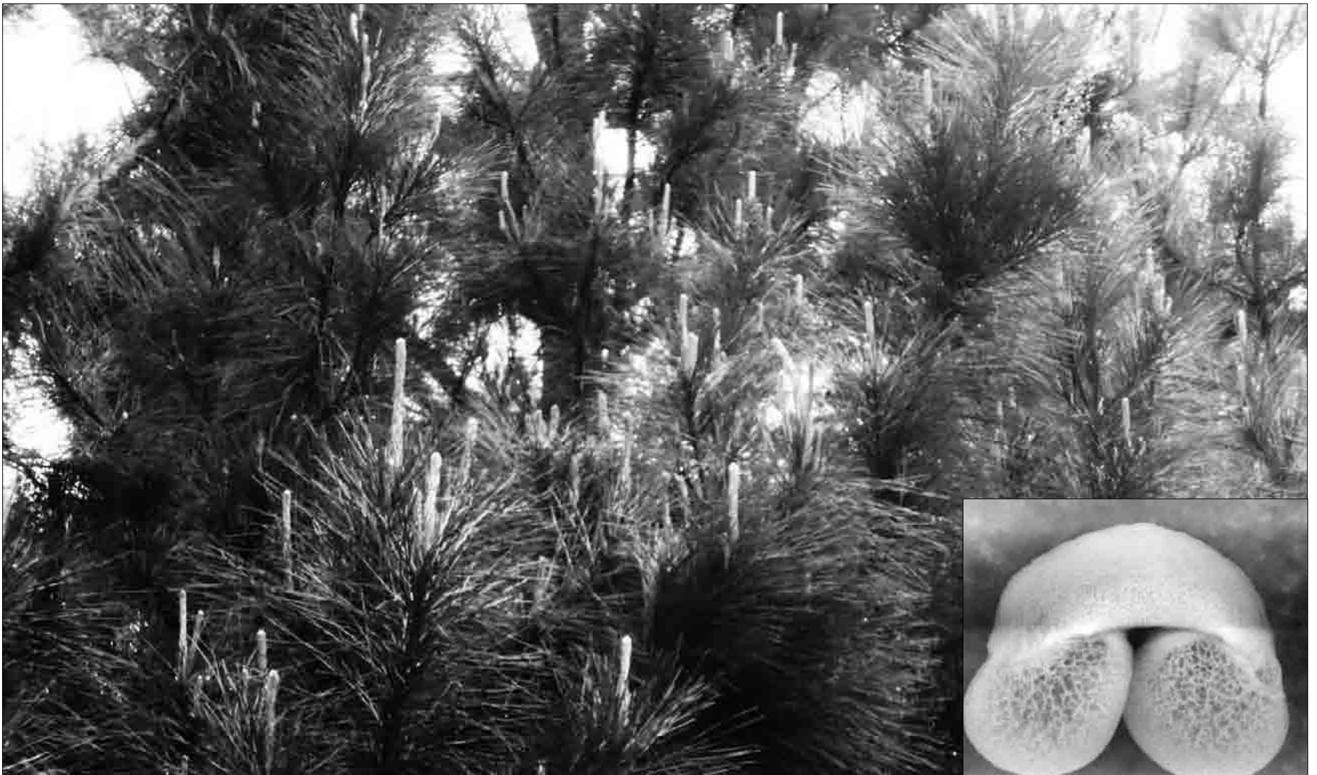
Intsignis pinuak argazkian, eta polen ale baten irudia alboko argazkian.