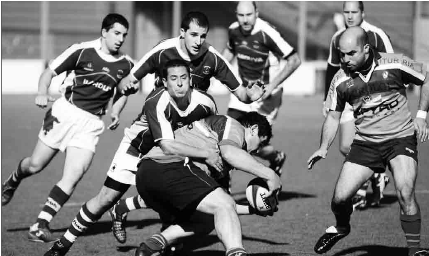
Mende laurdeneko ibilbide luze honetan zehar 1.000 fitxatik gora egin ditu DRTk. Kepa Aginako

1986tik 1.000 fitxa inguru egin ditu DRTk. Txapo lehendakariaren berbetan, modu batean edo bestean lagundu dutenak "eskertzeko modua" dira urteurrenean antolaturiko ekimenak