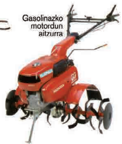
Gasolinazko motordun aitzurra