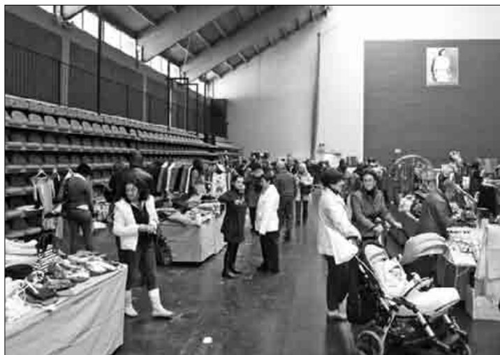
Hamasei dendetako generoa ipini zuten salgai.

Aurtengo Aukera Azokan aurreko aldietan baino gutxiago saldu omen dute EMEko dendariak