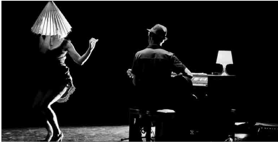
Bikote hartu-emanen hausturari eta bakardadeari buruzkoa da Khea Ziater-en antzezlan.

Martxoaren 24an 20:00etan estreinatuko dute antzezlan San Agustin kulturgunean