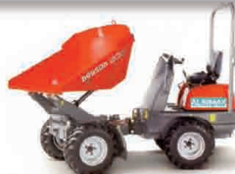
4 x 4 dumperra birakaria eta bere kabuz kargatzekoa