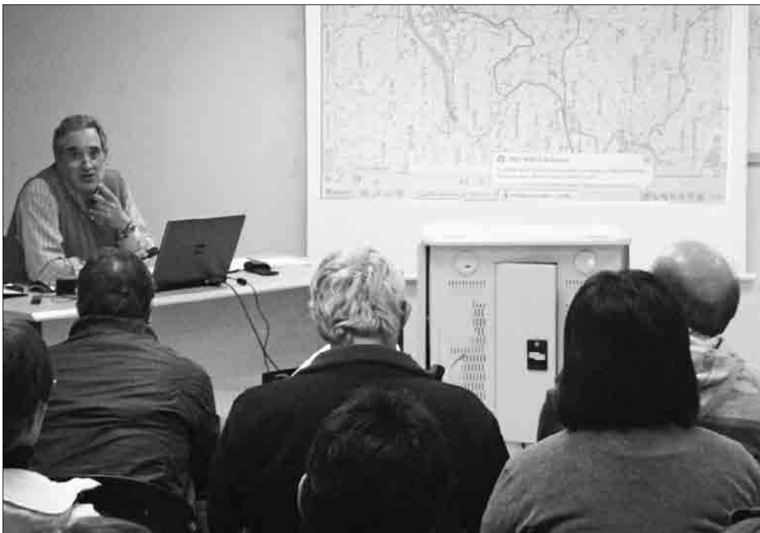
Martitzenean Mallabian egindako herri-batzarrean alkateak proiektua azaldu zien herritarrei.

Iurretak udalbatzarrean eta Berrizek batzordean, linea berriari ezetz esan diote