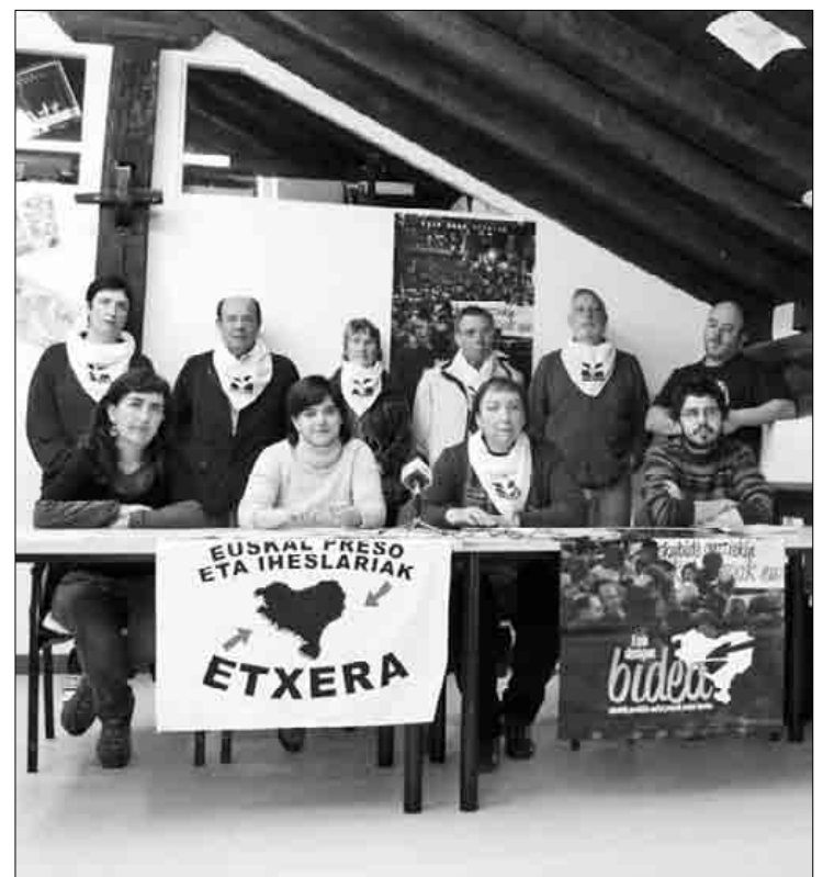
Sindikatuetakorde eta Etxerategaz batera martitzeneko agerraldian.