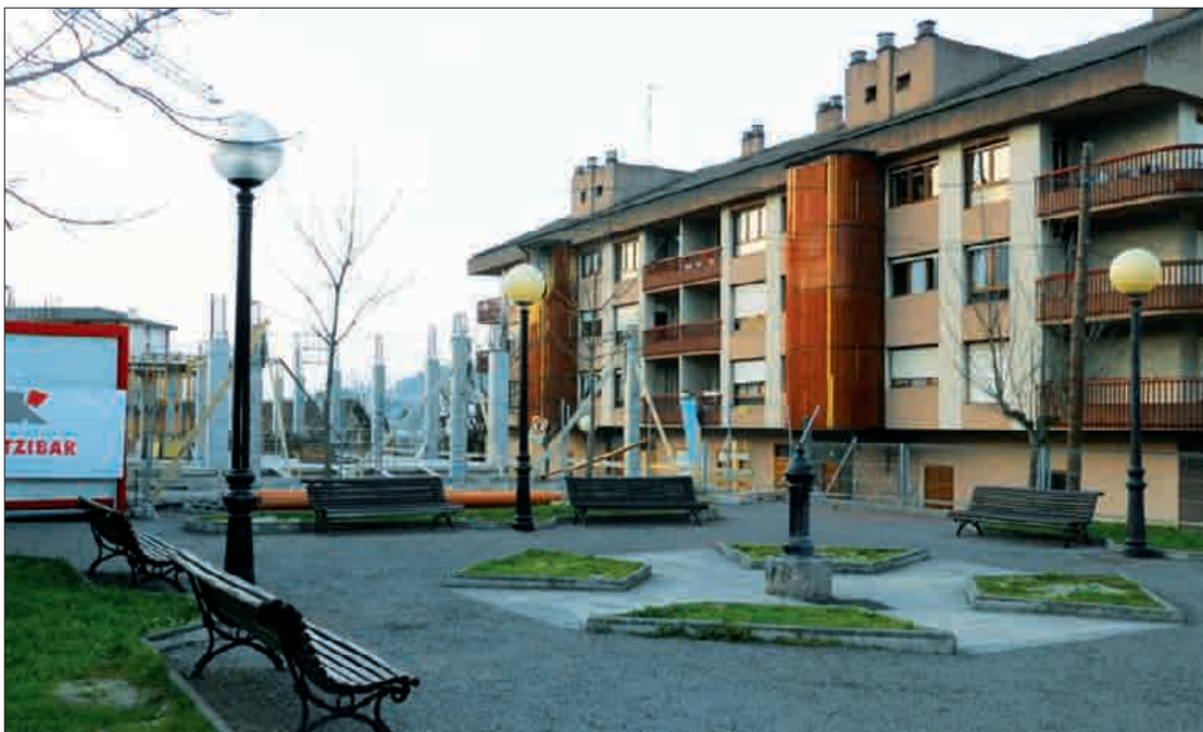
Eskola berria 2012-2013 ikasturterako amaituta egotea aurreikusi dute.

Eskola alboko etxebizitzetako bizilagunek obrak geratzeko eskatu zuten