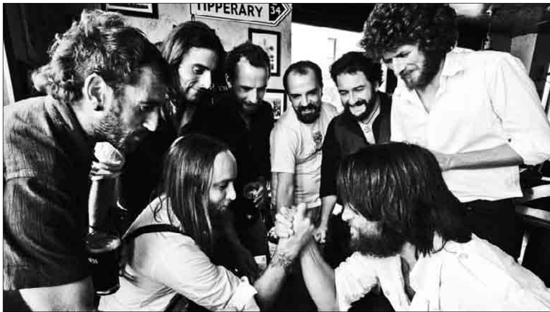
Hamahiru kanta berri biltzen dituen 'En Zugzwang' bigarren diskoagaz datoz.