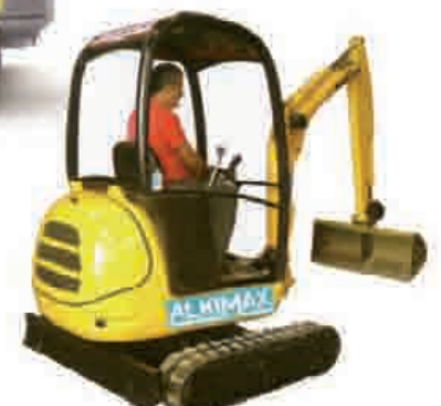
Mini hondeagailua 1.800kg