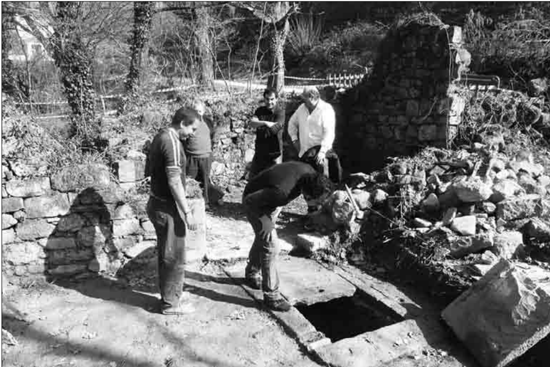
Joan zen barikuan egin zuten ikerketa-gunerako bisita arkeologoak eta udal ordezkariak.