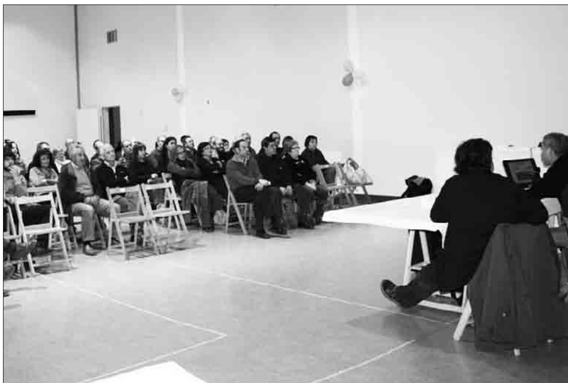
Mainondoko gimnasioan egin zuten batzarra, joan zen eguean.