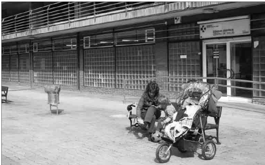
Araozari "soluzio global" bat eman behar zaiola aldarrikatu zuen Ezker Abertzaleak.

Traña-Matienako osasun-etxe ondoko udalaren lokala, zentroa handitu dezan, Osakidetzari lagatzea proposatu zuen gobernuak udalbatzarrean