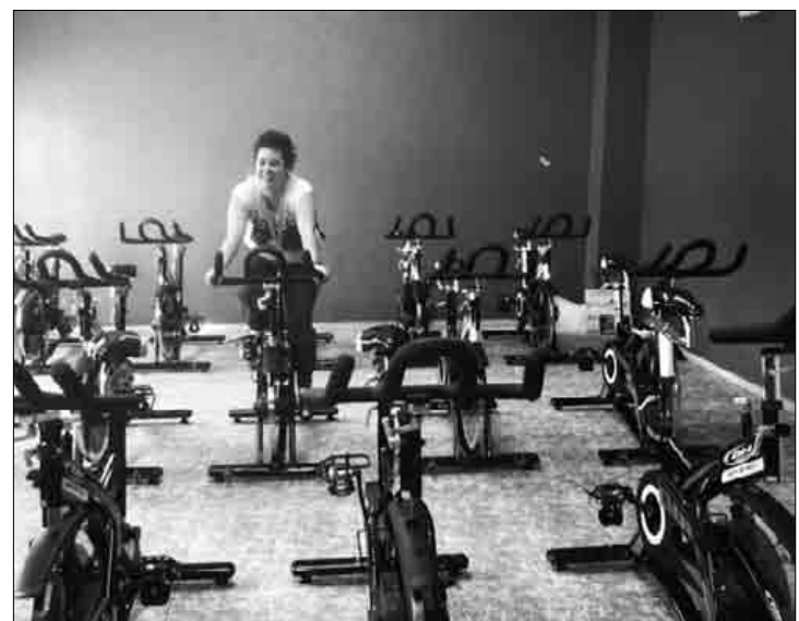
Spinning praktikatzeko gelak 15 bizikleta berri ditu orain.