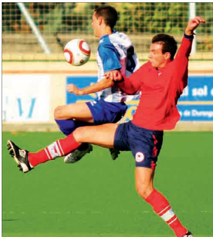
Kulturalak Zarautz jasoko du bihar Tabiran. Kepa Aginako

Hurrengo asteburuan Laudio bigarren sailkatua etorriko da Tabirara