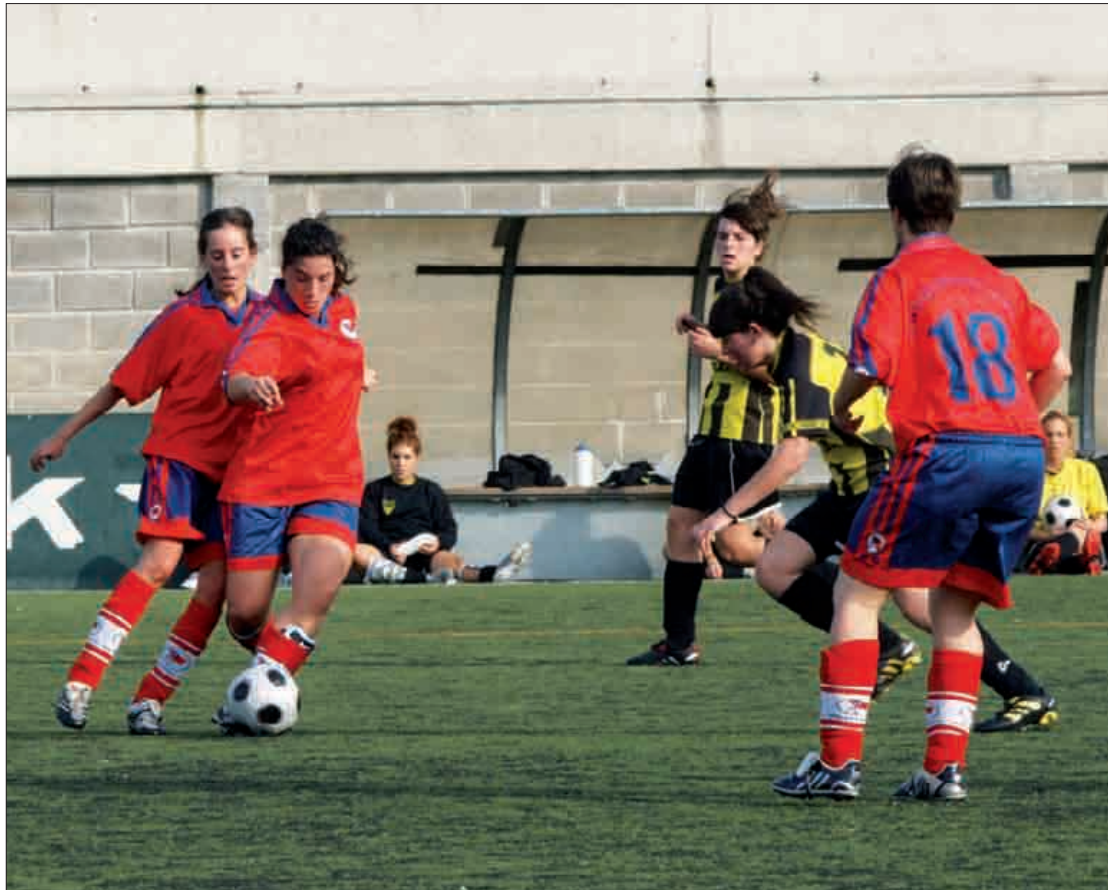
Joan zen astean etxean 2-1 menderatu zuten Santutxu taldea. Juanra de la Cruz

Jokalari eskasiagatik iaz gazteak eta nagusiak talde bakar batean batu zituzten eta mailaz igotzeko zorian egon ziren; aurten, orain arteko sei partiduak irabazita liderrak dira