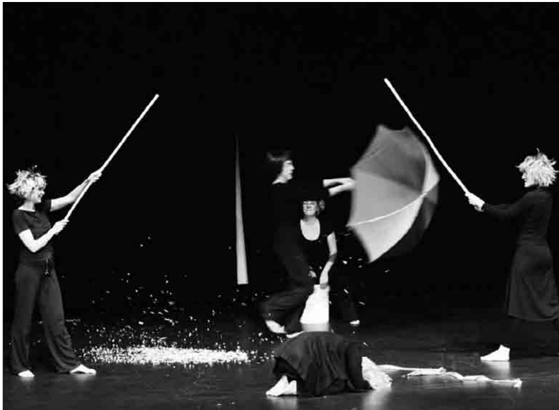
lazio 24 Ordu Digitalean lehiaketaren sari banaketa ekitaldia, Elorriko Arriolan. K.Aginako

Asteburu honetan hasiko da Ermuko lehiaketa, eta datorren asteburuan da Elorrikoa