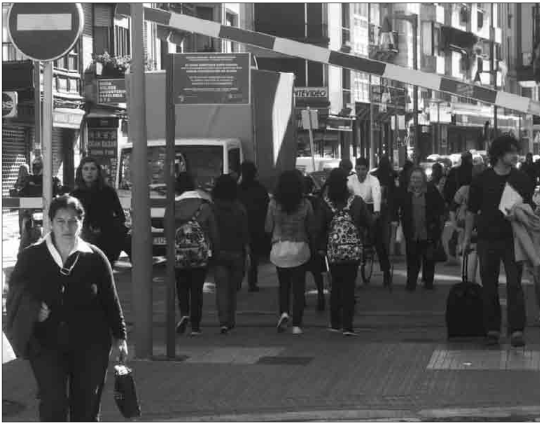
EAJren esanetan krisiak eskualdea "gogor" jo duelako proposatu dute tasak eta zergak izoztea.

EAJren eta PSE-EEren aldeko botoekin onartu dituzte ordenantza fiskalak