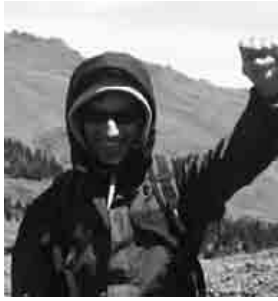
Adurrek urriaren 30ean urteak betetzen ditu. Zorionak Elorriko eta Bergarako familia osoaren partez!! Zurekin gauz! besarkada eta muxu erraldoi pillak!!! animo!!