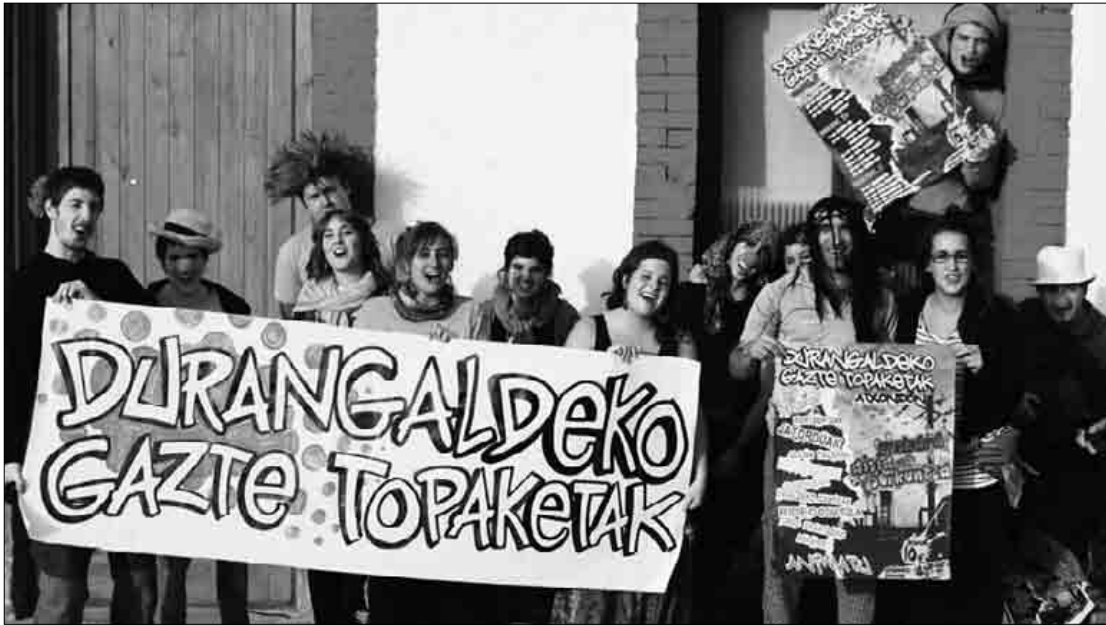
Atxondoko gaztetxean spot bat grabatu dute hainbat gazte topaketan berri emateko