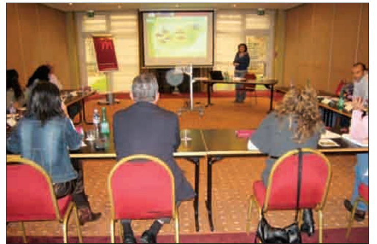
Ordezkariek Europa mailan gauzatu gura dute egitasmoa.

zaldi turismoari zerbitzua emango dion kalitatezko produktu turistikoa sortzea da. Zerbitzu honek erabiltzaile zein zaldientzako kalitatezko ostatua eskaintzeaz gainera, zerbitzu osagarriak eskainiko lituzke. Bestalde, zaldian ibiltzeko ibilbide homologatuak eskuragarri ipini gura ditu. Produktu honek, gainera, egitasmoan murgiltzen diren eskualdeen turismoa sustatuko du. ■ J.D.