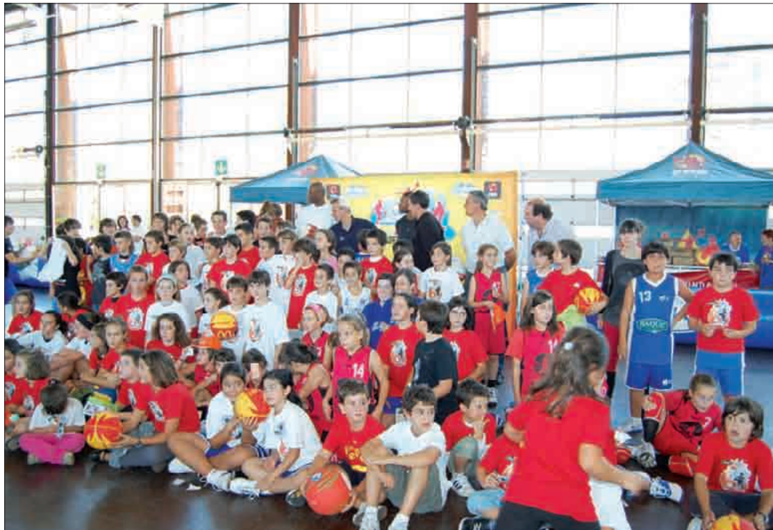
Iazko lehenengo aldian 1.200 lagun batu zituen guraso eta gaztetxoaren artean.

8-16 urte arteko gaztetxoei zuzendutako jaiak bigarren aldia egingo du; Fernando Romay eta Bizkaia Bilbao Basket-eko jokalariek batzuk ere etorriko dira antolatzaileen esanetan