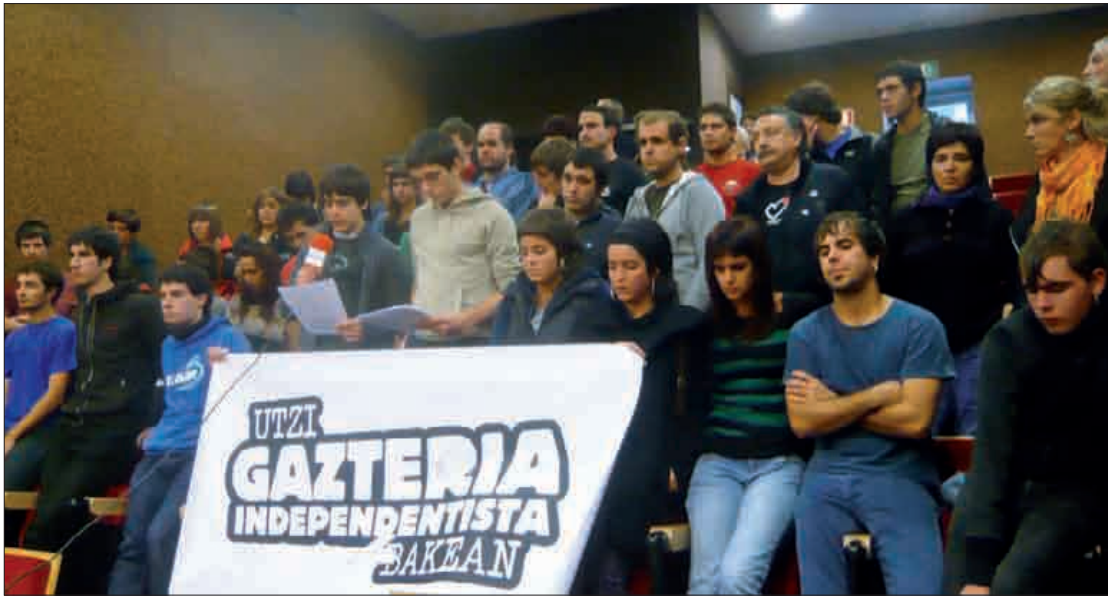
Hizkuntza Eskolako areto nagusian batu ziren prentsaurrekoa eskaintzeko.

Martitzenean agerraldia egin zuten eskualdeko hainbat herritarrek