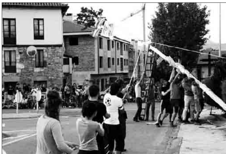
Auzotar gazteak, astelehenean, donien atxa jasotzen.

Astelehenean donien atxa jaso zutenetik nabaria da jai-giroa Zelaietan; domekara arte dira jaiak