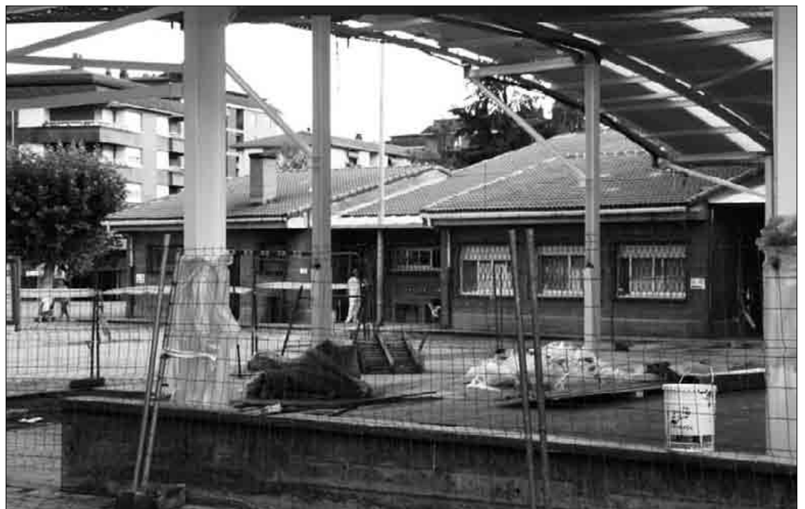
Eskolako patioan estalkia ipintzeko lanak laster amaitzea itxaroten du udal gobernuak.

Abiadura murriztu guran Auzotik igarotzen diren autoen "abiadura murrizteko eta oinezkoen segurtasuna hobetzeko" helburuagaz ipini dituzte, udal gobernuak ohar batean adierazi duenez, Zelaieta auzoko hainbat gunetan goruneak; Txanporta plazatik ger-