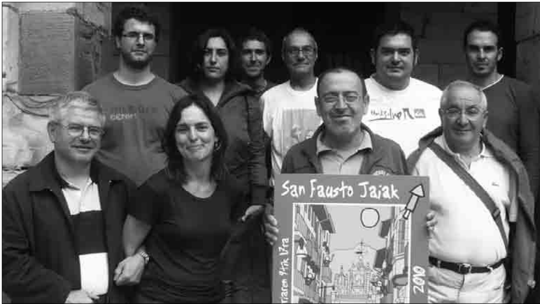
Udalak ez eze, herriko hainbat talde eta elkartek parte hartzen dute jaiak osatu orduan.