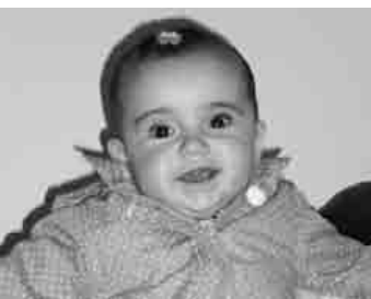
Gure Lurtxu maitie udako azkenengo lorie zer emongo neuke nik ikustearren zure barrie jaio zinela bada urtie eta zu zara jada gure bizie