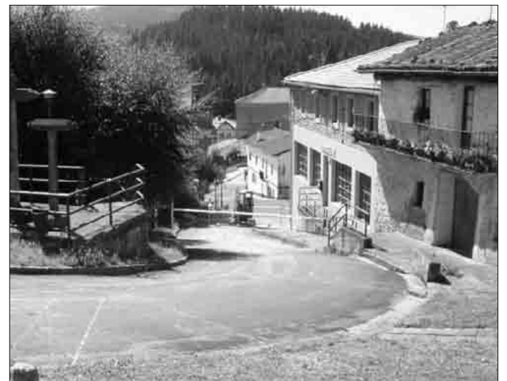
Kultur Etxearen ondoan dabilta makinak lanean.

Kalean autoz sartzeko aukera izango duten bakarrak bertako bizilagunak izango dira