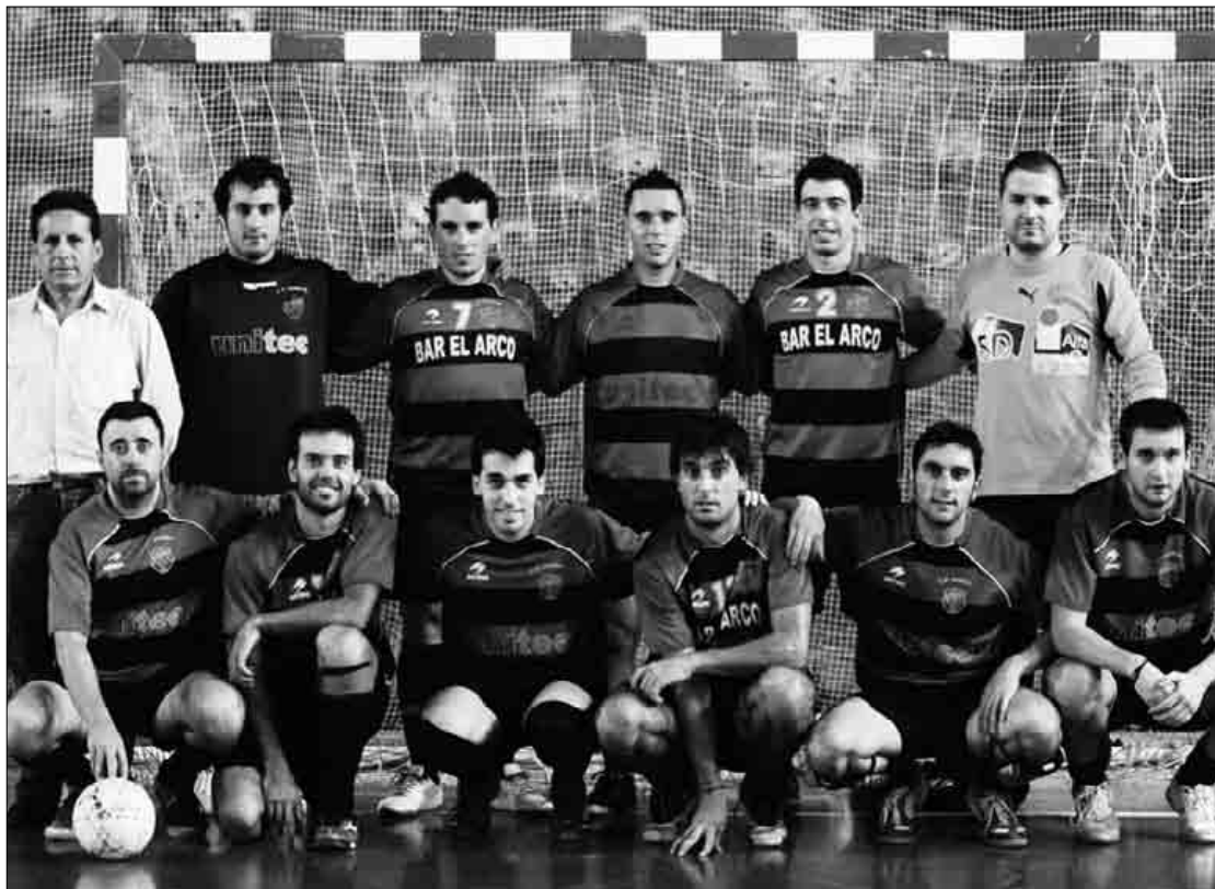
Eguaztenean lagun arteko partidua jokatu zuen Sasikoak Soloarteren kontra. Kepa Aginako

Aurten hamaseitzi zortzi talde jaitsiko dira ohorezko A mailatik; Sasikoak filialeko jokalarik gazteekin egingo dio aurre denboraldiari