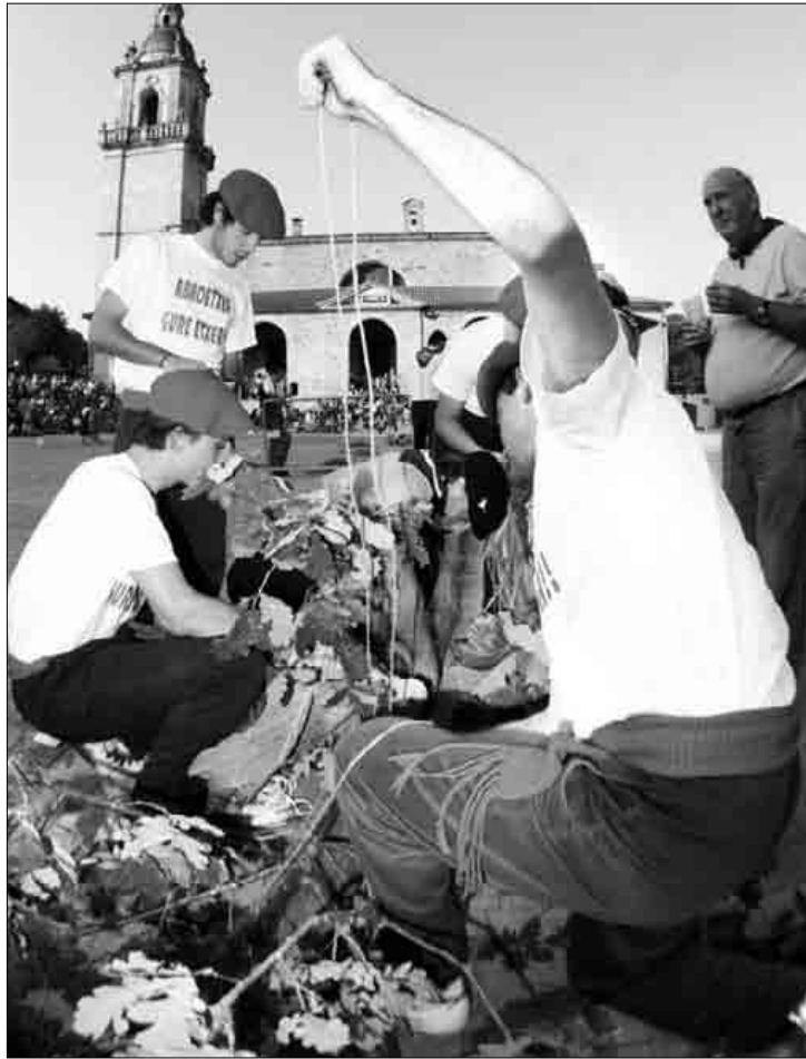
Donien atxa San Migel bezperan altxatuko dute, ohitura denez.