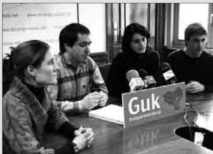
Talde Mistoak prentsaurrekoa eskaini zuen astelehenean.

Azkenik, PPko zinegotzi Cristina Ibarrolak aurrekontu “abertzaleak” direla esan zuen, eta PSE-EEK “aukera ona alperrik galdu” duela aurrekontuetako “filosofia hori aldatzeko”. ■ J.D.