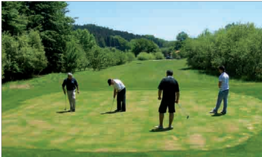
Hiru kategorია prestatu dituzte, aditu ez direnek ere jokatzeko aukera izan dezaten. DimaGolf

D imaGolf klubak Udaberri Torneoa antolatu du martxoaren 27an. Pitch & Putt zaleei bideratutako torneoa da, eta zelai berria ezagutaraztea ere badu helburu. Hala ere, zelaiaren irekiera ofiziala ospatzeko torneoa apirilaren amaiera aldera egingo dutela jakinarazi dute.