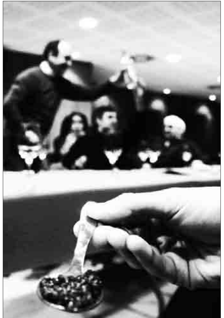
Landako Elkartegian kabiarrak dastaketa antolatu dute. K.A.

Azoka dela eta Turismo Bulegoak eskaintza berezia prestatu du