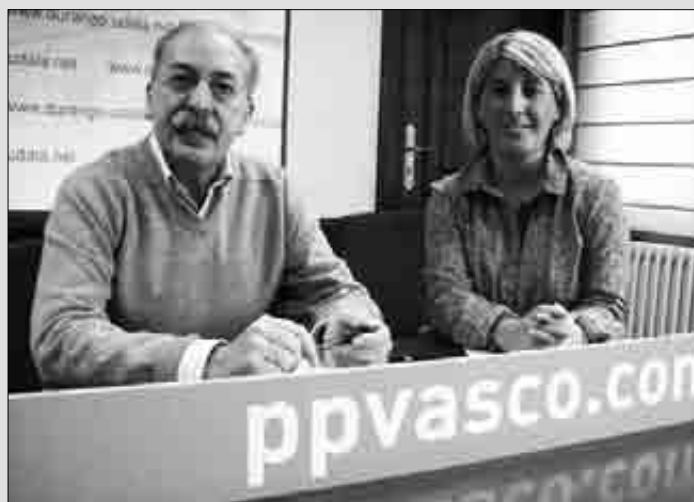
Gastañazatorre eta Ibarrolak ere prentsaurrekoa eskaini zuten.

seme-alaben gurasoen elkartearendako akordioa berritzea, etxerik etxeko catering zerbitzua martxan jartzea nagusiei eta minusbaliotasuna dutenei zuzenduta, San Francisco eta Kobentu plaza inguruak konpontzea eta umea izan duten gurasoendako 200 euroko diru-laguntza herriko dendetan gastatzea ere emendakinen artean proposatu ditu Alderdi Popularrak.