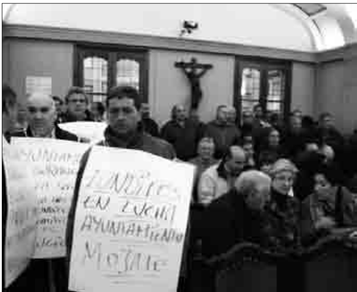
Udalbatzarrean Fundifeseko 40 bat langile batu ziren.