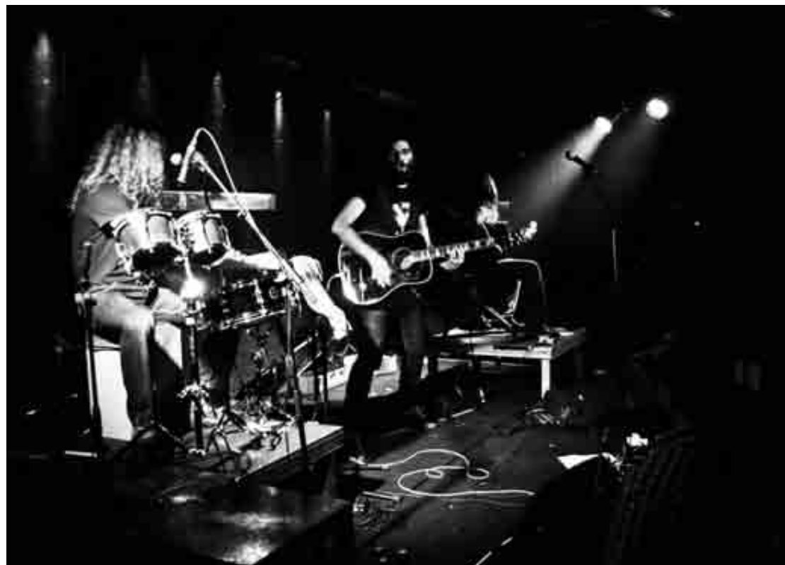
Martxoaren 18an, 22:00etan