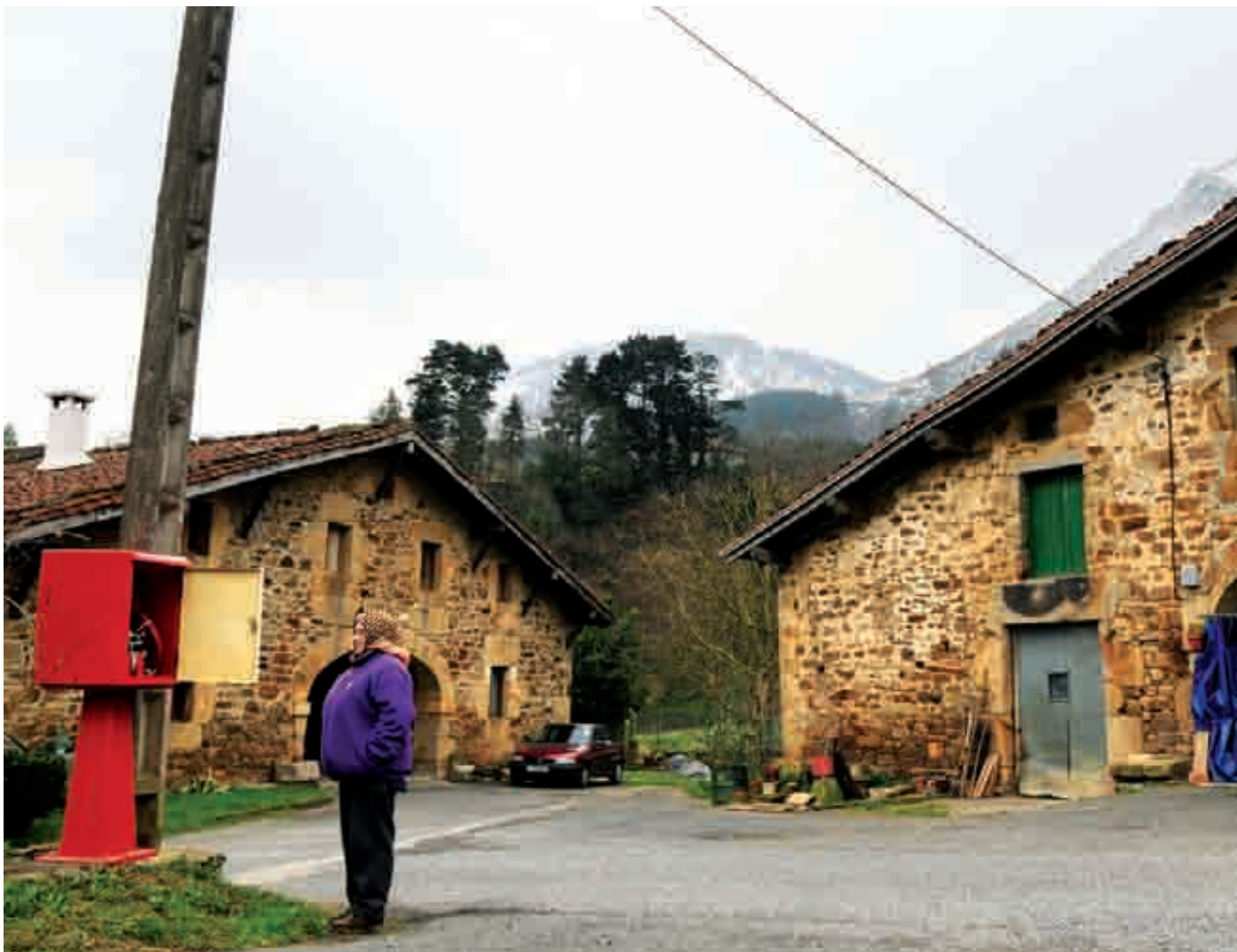
Arrazola, Axpe eta Apata auzoetako baserri inguruetan ipini dituzte ureztodi-kutxak. Kepa Aginako