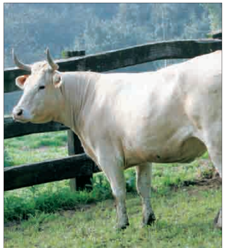
500 hektarea inguru izango ditu Bitartekaritza Bulegoak

Aldundiak 500 hektarea inguru Bitartekaritza Bulegoaren esku ipini ditu. Aldundiak bultzatuko du; nekazarien aurre-erretiroetatik datozen lur publikoen edo pribatuen borondatezko atxikipena, erosketak, trukeak, jabe pribatuen lagapen pribatuak eta herri titularitateko lurren kudeaketa. Hautaketa egiterakoan, nekazari gazteen lehenengo instalazioa izatea baloratuko da gehien. Prezioen Batzorde Teknikoak ezarriko du errendamenduen hileko prezioa, lurren espekulazioa galarazteko. Dirua Nekazaritza Funtsaren barruko lurak hobetzeko izango da.