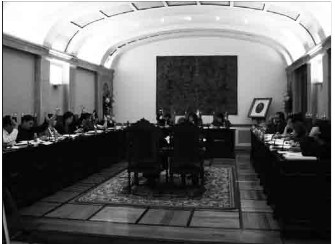
Emendakinek osotasunean bozkatu zituzten lehenengo, eta banan-banan ondoren.

beste aipatu den” estabilitate instituzionalerako akordioa EAJgaz egindako negoziazioen abiapuntua izan zela, baina “akordioa bera bi alderdien artean borondatea egon delako etorri dela”.