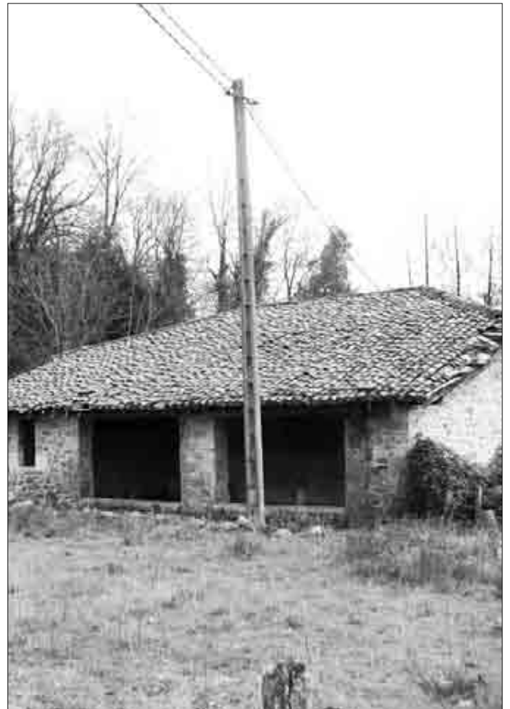
Dirurik gehien, Sarriko eskola zaharreko teilatua konpontzeko.