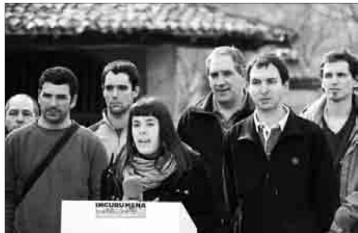
Joan zen zapatuan egin zuten aurkezpena Axpeko plazan.

Besteak beste, gaur egun planteatzen den garapen iraunkorra "ahula" dela azpimarratu zuten