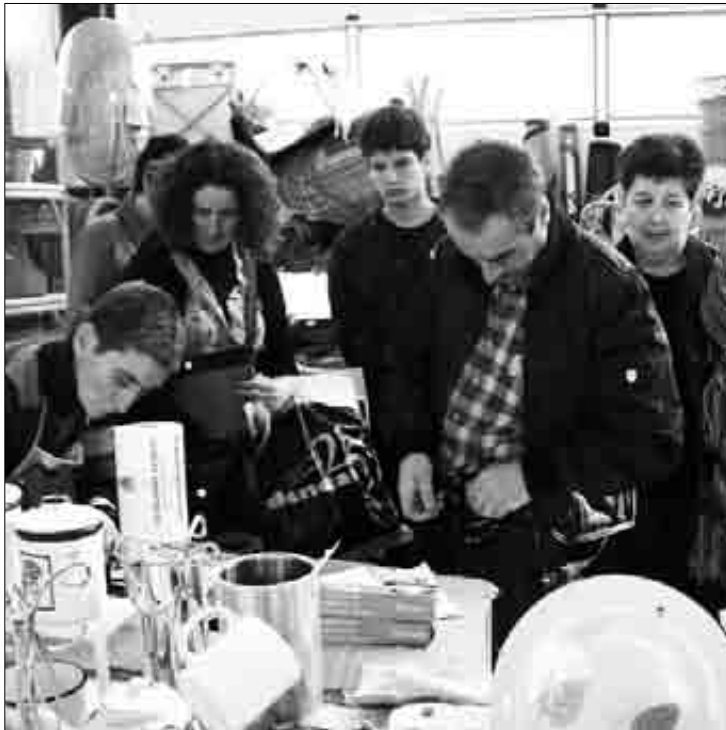
Azokan 12.000 salmenta egin zirela aipatu du + Dendak-ek

Eguerdian lasaiago erosteko aukera egongo zela uste genuen, baina orduan egon zen beteen". Antolatu dituzten ekitaldiek ere harre- ra ona izan zutela azaldu du Oarbeaskoak, "baina poneyek izan zuten arrakasta gehien." ■ G.A.