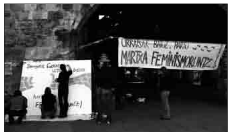
Bilgune Feministak zapatuan murala margotu zuen. A.D.

Emakumearen Nazioarteko Egunaren harira ekitaldi ugari antolatzen dihardute egunotan