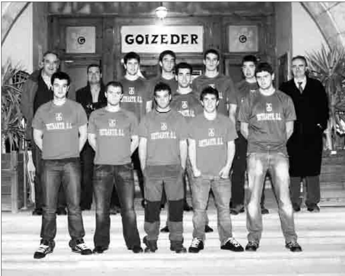
Goizeder jatetxean aurkeztu zuten aurtengo Biharko Izarrak pilota txapelketa.