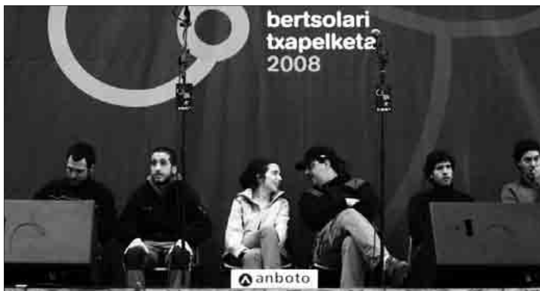
Garaiko frontoian izan zen 2008ko Durangaldeko txapelketaren finala. J.Fernandez

Martxoaren 9an da Durangaldeko eta Bilboaldeko bertsolari gazteen lehia