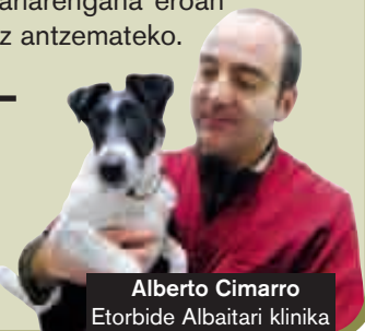
Alberto Cimarro Etorbide Albatari klinika