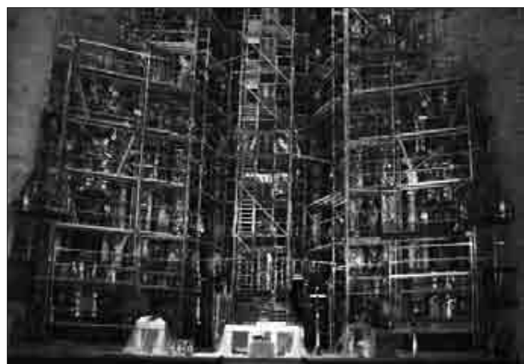
Aldamioekin babestu dute erretaula dagoen zonaldea.

Berogailuak erretaula egiteko erabili zuten kola sikatu duela uste dute, eta horregatik erori direla erretaula zatiak