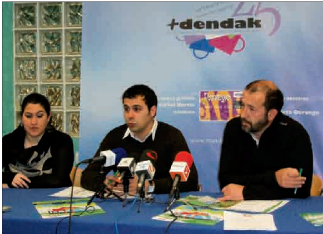
Landako Gunean egingo den 5. Aukera Azokaren berri eman zuten +Dendak-ek.

Azokaz gainera, umeentzako hainbat ekintza antolatu dituzte, “familia guztia bertan egon ahal izateko”, eta Azokako giroa Durangora zabaldu gura dute.