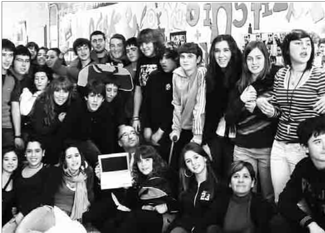
Bideoaren originaltasunagatik eman diete saria Elorrioko Institutuko ikasleei. Elorrioko Institutua

Ikasleen erdiak Hausburgora joango dira eta beste erdiak, berriz, Peinera