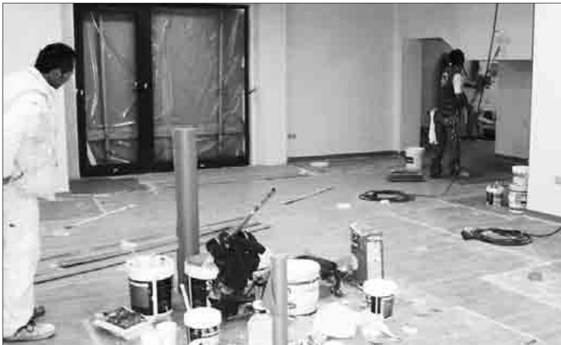
Zaldibarko liburutegi berria udaletxe pareko etxe berrien lehenengo solairuan dago.