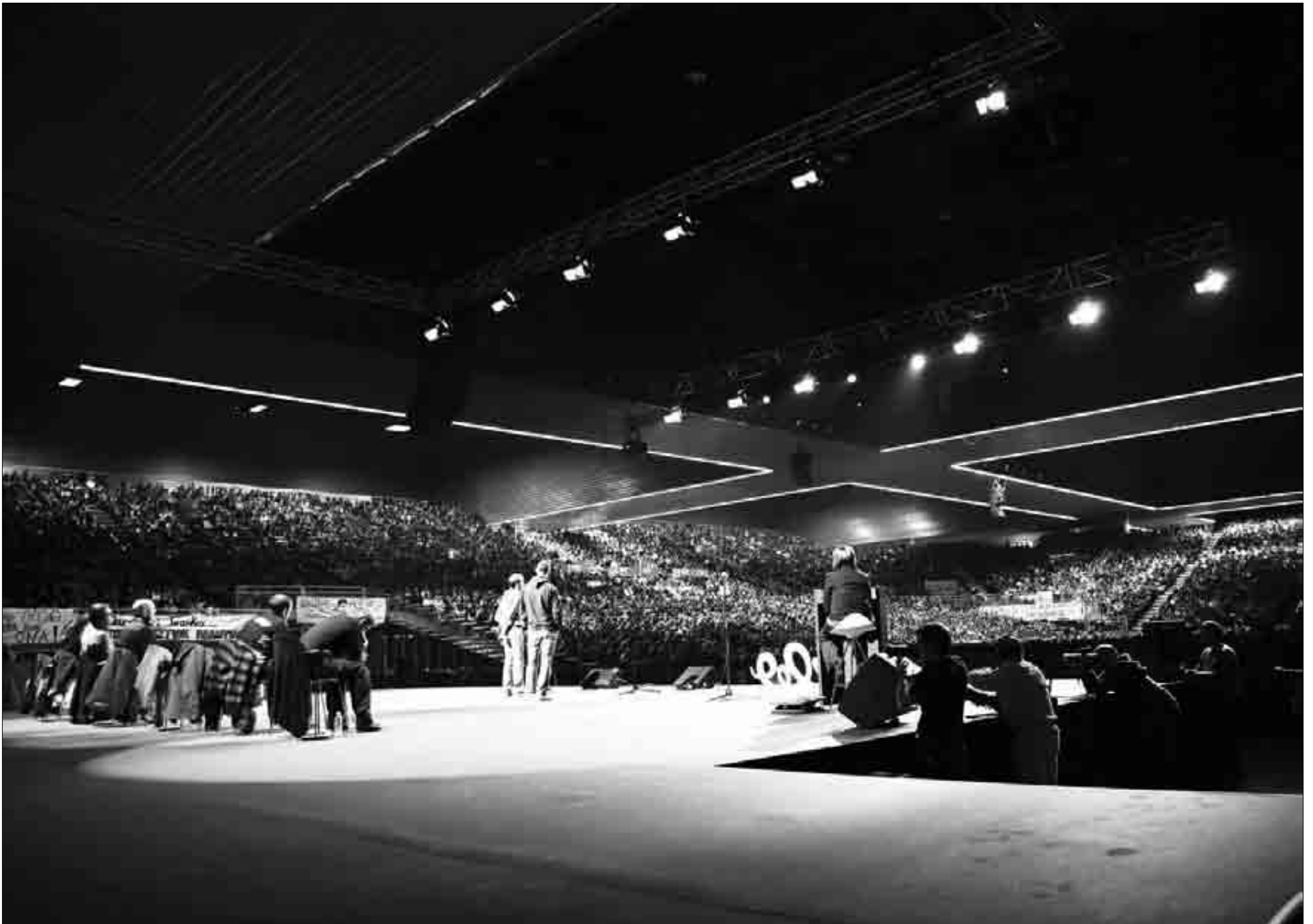
Milaka bertsozale batu ziren Barakaldoko BECen, 2009ko Txapelketa Nagusiko finalean. Asier Arroita

Bertsozaleen ikasgela izango da aurten ere Plateruena kafe antzokia. Atzo hasi zen DF bertsozale eskolaren bigarren edizioa, Andoni Egañaren berbaldiagaz. 2009ko Txapelketa Nagusia aukeratu dute azterketarako gai legeaz, eta hainbat gonbidatu izango dituzte hausnarketarako prest.