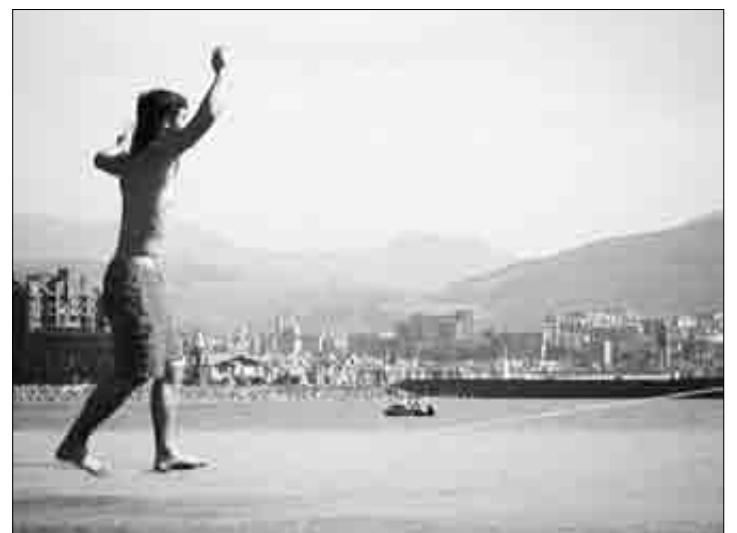
Slack line izeneko kirol jarduera landu dute. Bideografik

Durangoko ekoiztetxearen 'Slack-line: grabitateari erronka' lanak jaso du saria