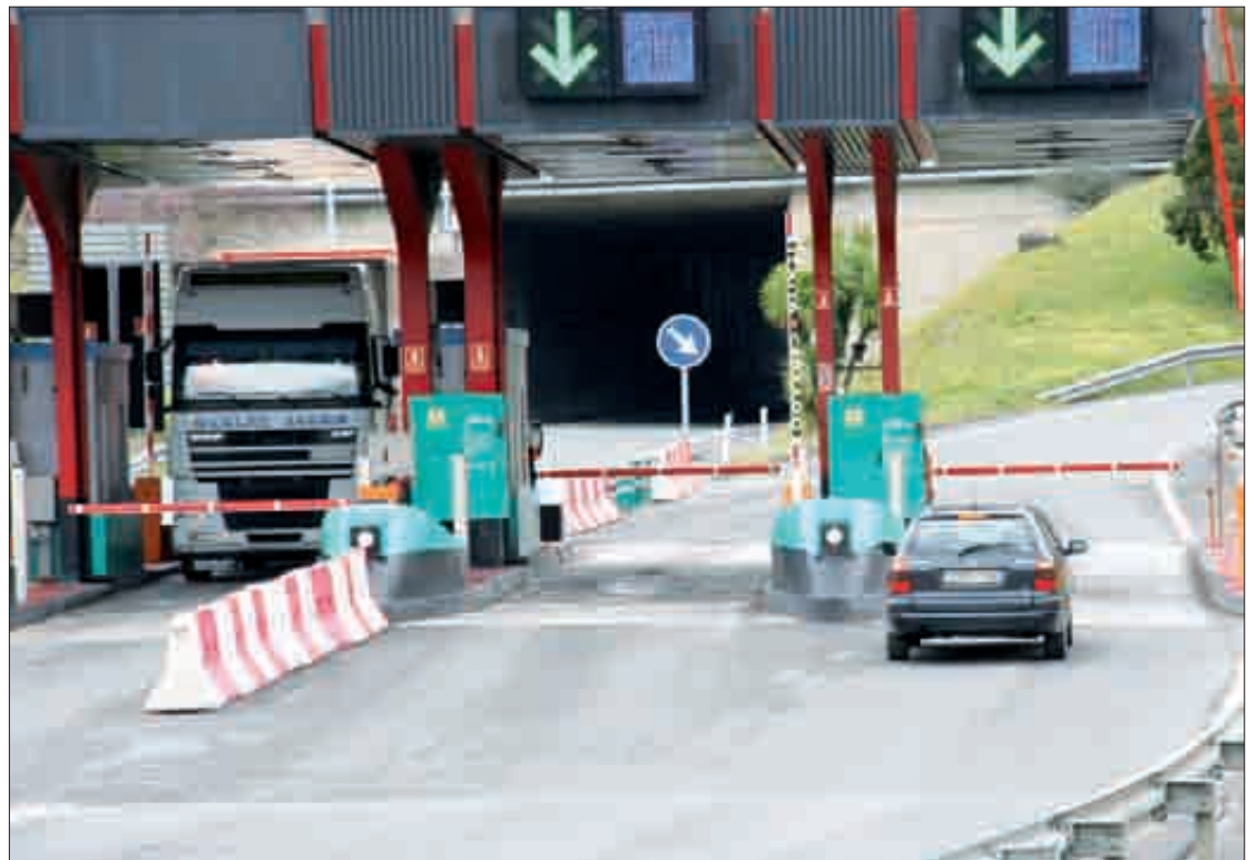
Erabiltzaileei sortutako kalteak ordaintzeko beharra nabarmentzen du mozioak.

Beste herri batzuetako kiroldegietan ordaindu behar dutenaren parte bat bere gain hartuko du Udalak