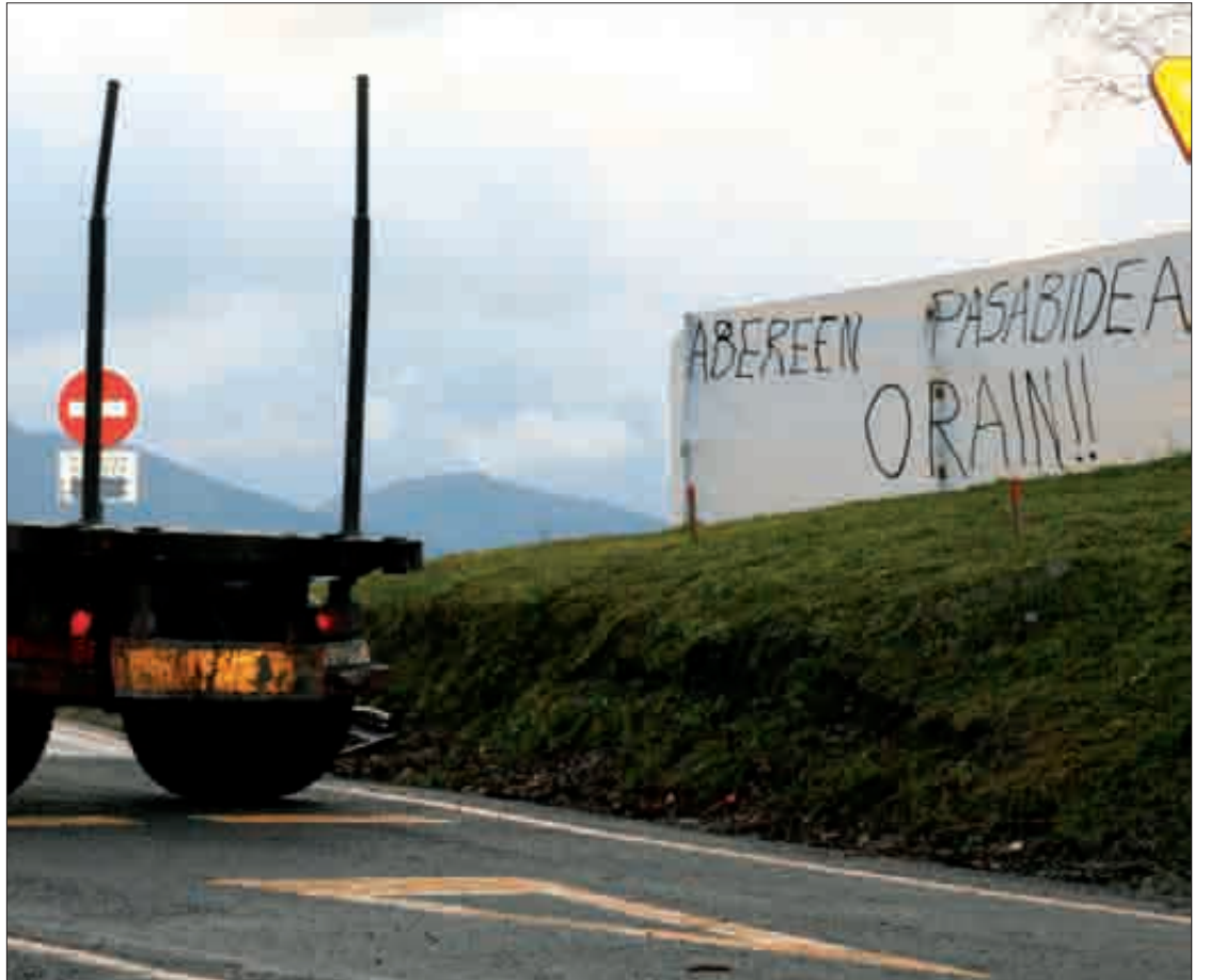
Errepide honetatik ibilgailu ugari pasatzen da egunero, bai Ondarrura bai Durangora bidean.

Aldundiak orainsu ekin dio herriko puntu arriskutsuak konpontzeari