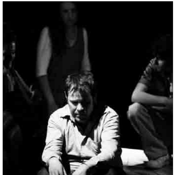
Lipus 'Putzuak lehortzen' antzezlanean, iaz. J.Fernandez

Martxoaren 13an, goiz eta arratsaldean (10:00etan hasi eta 14:00ak arte, eta 16:00etatik 20:00ak arte) izango da hitzordua. Informazio gehiagorako helbidea: banarte@gmail.com . ■ I.E.