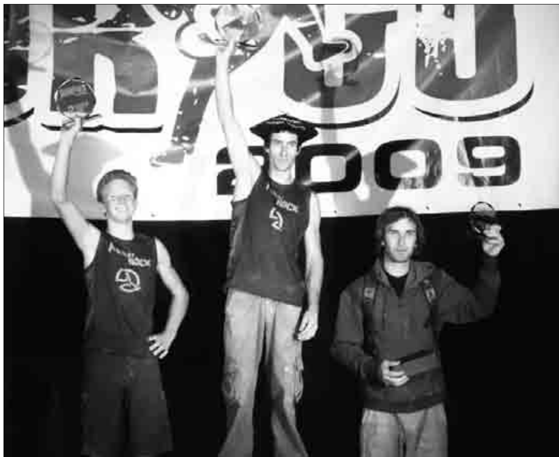
Patxi Usobiaga, Jacob Schubert (ezkerrean) eta Chris Sharma (eskuman) podiumean.

Patxi Usobiagak irabazi zuen Masterra gizonetan, eta Mina Marcovikek emakumeetan