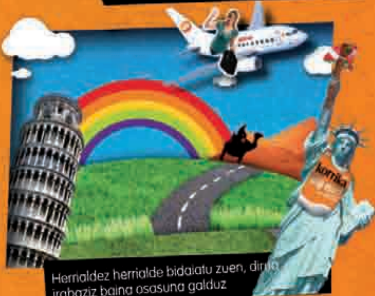
Herrialdez herrialde bidaiatu zuen, dirua irabaziz baina osasuna galduz.