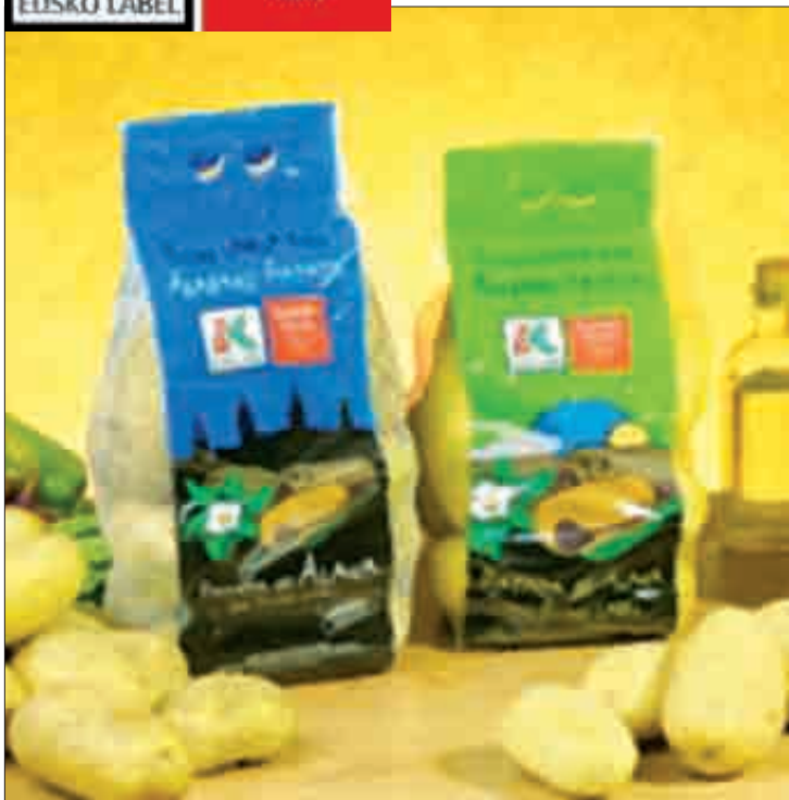
Monalisa eta Kennebecka dira gehien merkaturatzen direnak.

E usko Label bereizgarriak goi mailako kalitateko Arabako Patataren identifikazioa eta erabateko ber-