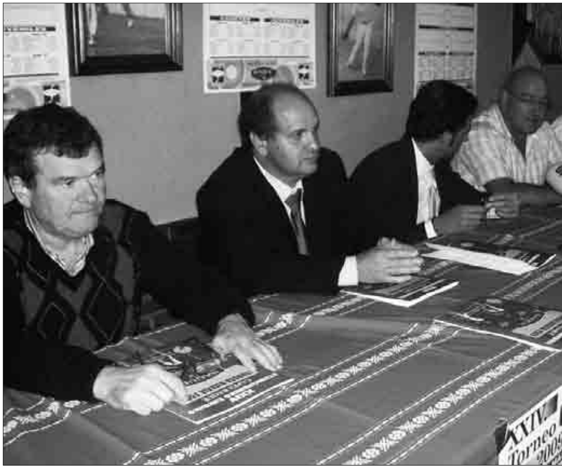
Aurkezpen ekitaldian Bizkaiko Pilota Federazioko ordezkariak eta Udaletako alkateak batu ziren.

Euskal Herriko eta Errioxako 48 pilotari lehiatuko dira maila bitan