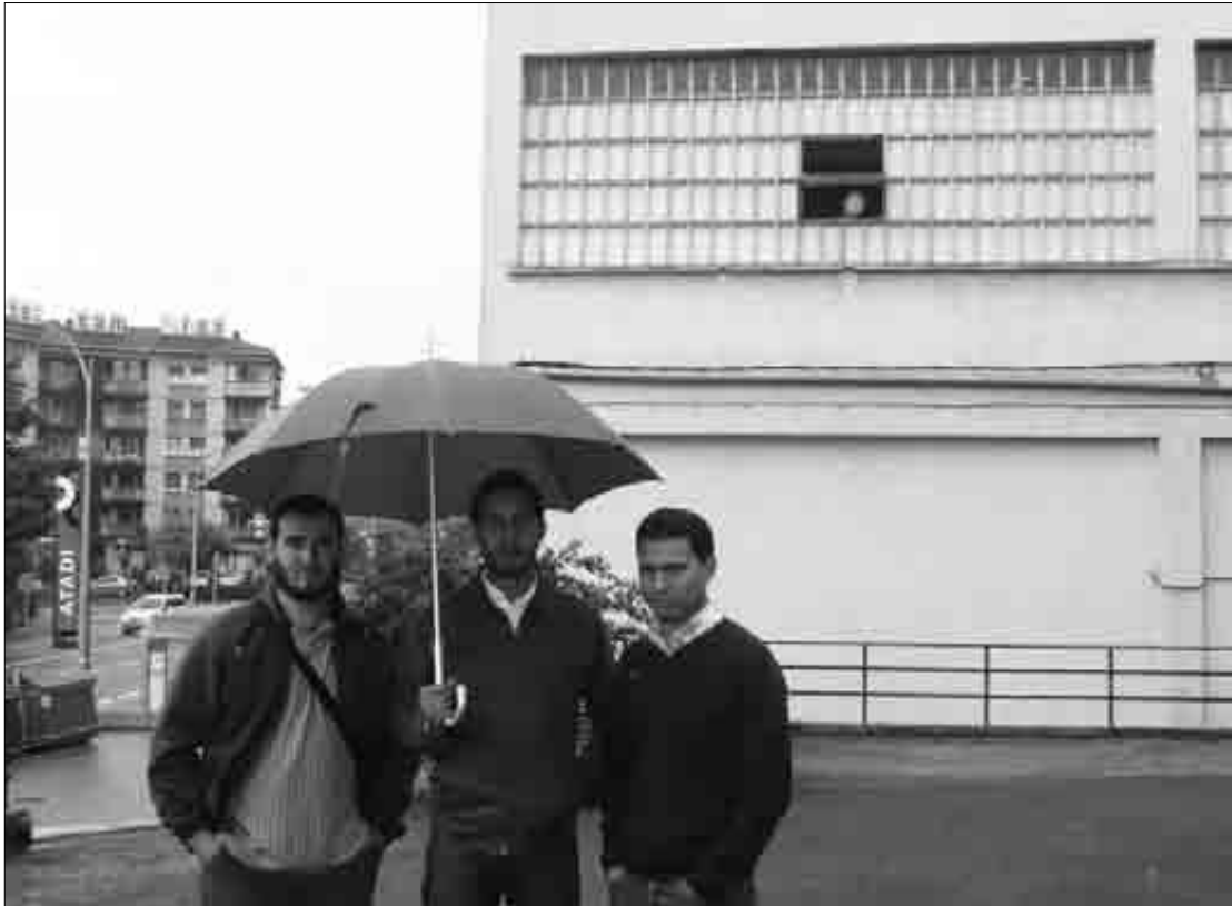
Lehenago Carrocerias Hirurok zegoen lokala alokatu dabe Axura elkarteko kideek. J.D.