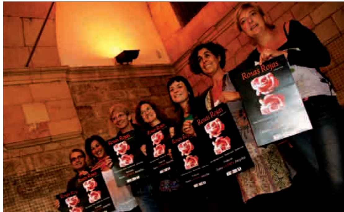
La Papa antzerki taldeko bost kide izan ziren ‘Rosas Rojas’ lanaren aurkezpenean.