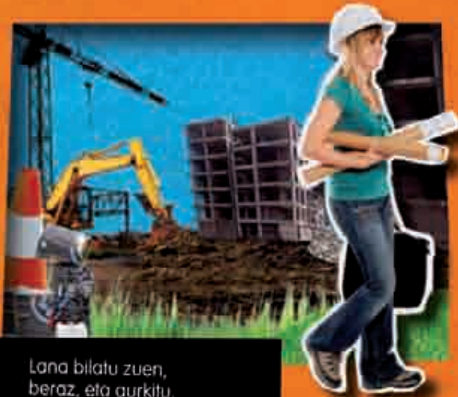
Lana bilatu zuen, beraz, eta aurkitu.