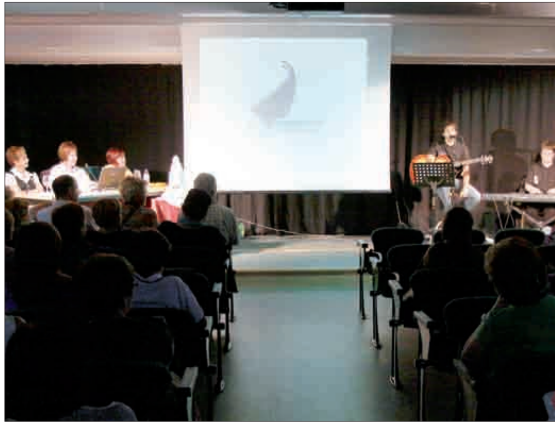
Ibarretxe kultur etxeko areto nagusian aurkeztu eben emakumeen elkarteak. Iban Gorri

70 bazkide dira elkarteak, eta Goiuria kultur-gunean daukie lokala