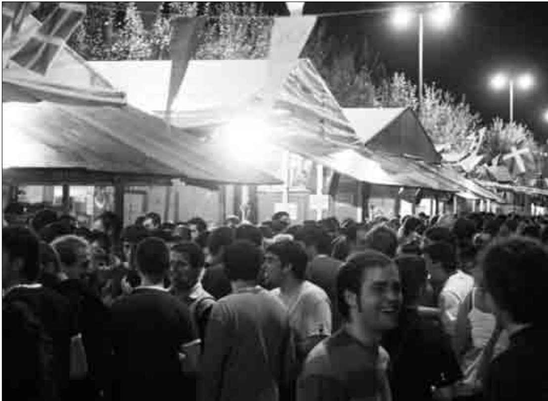
“ETAren sinboloak erakusteari” buruz Jaurlaritza eta Eudelen arteko ituna aitatu dau PSE-EEK.