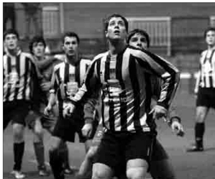
Erorriok erraz irabazi zuen Ezkurdiren kontra. K. Aginako

Fruizek azken lau partiduetatik hiru irabazi ditu, eta behetik gora dator