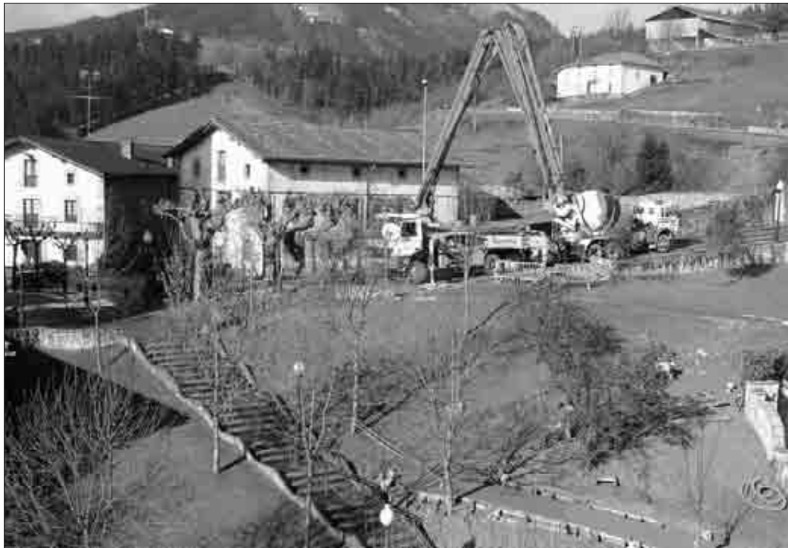
Hirigintza Sailak 2009an parkea konpontzeko lanak eroango ditu aurrera. M.G.