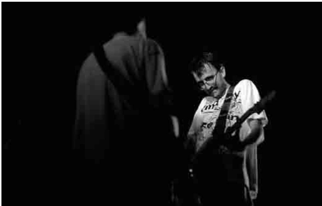
Urtarrilaren 16an, 22:00etan

» 'Con duende' zikloa: 'La banda nos visita' pelikula , urtarrilaren 20an, 20:15ean, Zornotza Aretoan.