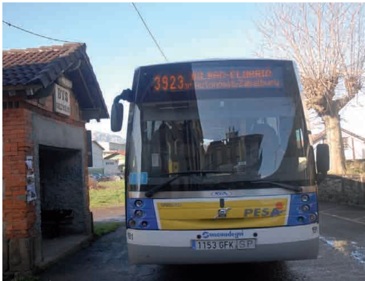
Bilbotik Elorriora doan autobusa Atxondon gelditu leiteke, baina kontrako noranzkoan ez dago geltokirik. Judit Fernandez