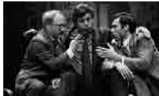
20:00etan, San Agustin kulturgunean.

>> 'Muerte accidental de un anarquista' (Suripanta Teatro-Badajoz), urtarrilaren 17an,