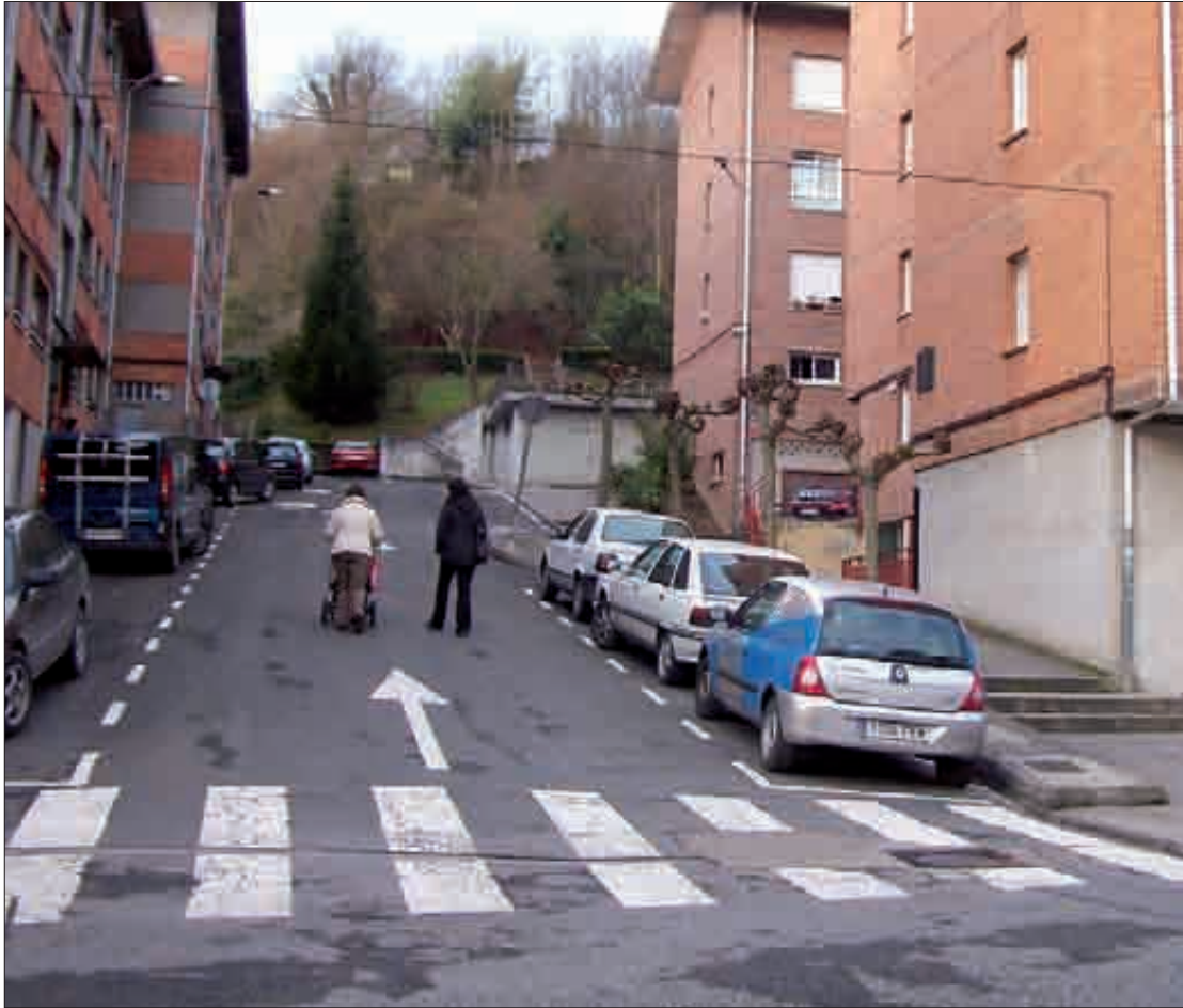
Gabiola kaletik Osasun Zentrora doan espaloi sarea birmoldatuko dabe.