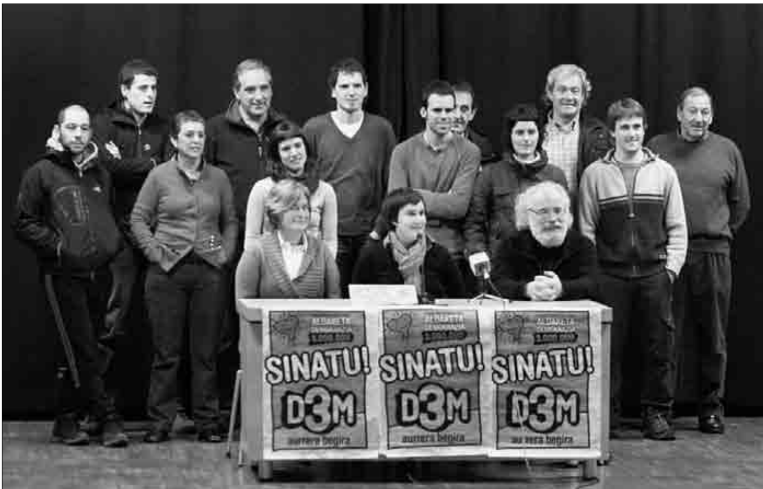
Abadiñoko Errota kultur etxean egin dabe Demokrazia 3 milioi herri plataformaren alde sinatzeko deialdia. Iban Gorriti

Martxoaren 1eko EAEko hauteskundeetan egotea eta ezker abertzalearen ahotsa izatea gura dabe