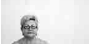
zuribeltzeko argazkiak. Otsailaren 1a arte, Arte eta Historia Museoa.