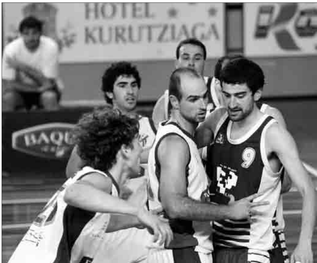
Tabirakok beheragoko mailetako jokalaria sarritan erabili ditu lesioak ordezkatzeko. K. Aginako

Donostian arerio zuzena menderatu eta averagea alde jarri zuen Tabirakok. Bihar ere, horixe du helburu etxean Baskoniaren aurka