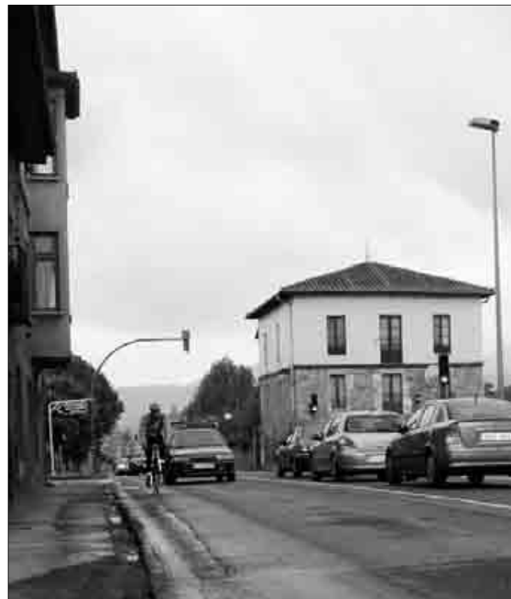
Egunero egiten dira auto-ilarak errepide zati horretan. I.E.

zen. Neurriok abadiñarrei zer onura ekarriko deutsezen ikusita, bestelako neurri gehigarriak hartu beharrik ete dagoen aztertuko ei dabe. ■ I.E.