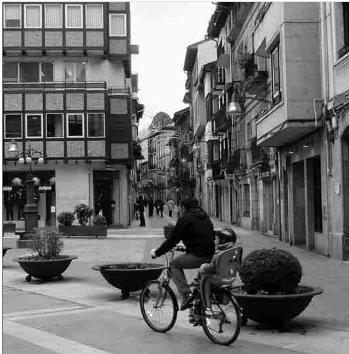
Durango zeharkatuko dauen bidegorria eraikitzea gura dau Durangoko Udalak.

Landako Gunea Kalebarriko udal liburutegi barri sartzeko plaza berriro urbanizatu dabe (95.700 euro), eta, Landako Guneako urbanizazioa be birmoldatuko (154.230 euro) da, "irisgarritasun-baldintzekin bat" etorri daiten; Alluitz eta Sasikoa kaleen artean errotonda bat egin gura dabela be jakin eragin dabe (199.081 euro). Ezkurdiko plazako aintzira eta kanalak egokitzeko eta kioskoa berreskuratzeko be erabiliko dabe Espainiako Gobernutik eratorritako dirua. Irisgarritasun arau teknikoak jartzeko 567.000 euro erabiliko ditue. ■ A.B.