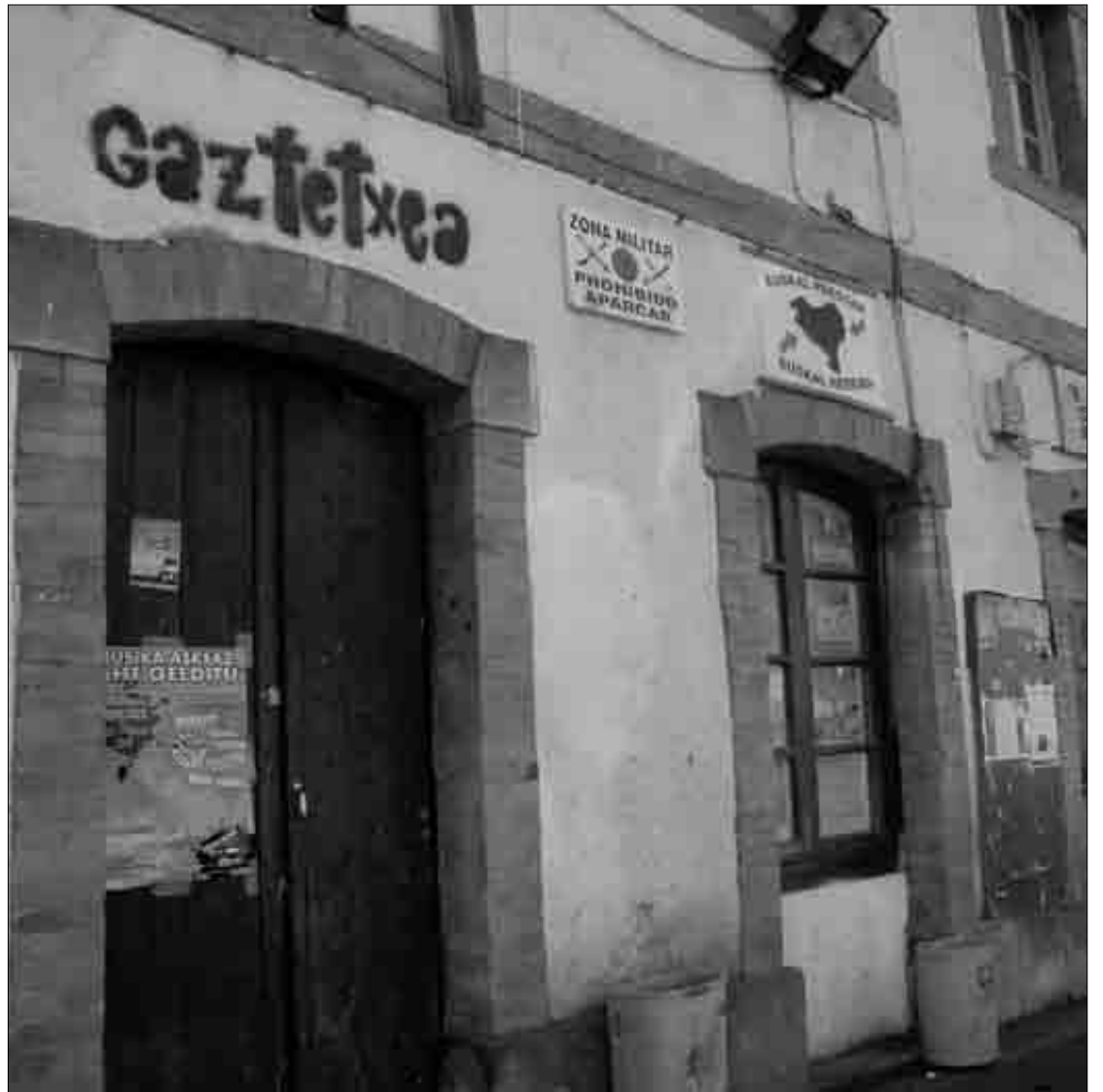
Hil honetan bertan ekingo deutsee Gaztetxea atontzeko lanei. J.Fernandez

Hileroko asanbladetan 15-20 bat lagun batzen dira Gaztetxean, eta eraikina zaharkitua zegoela eta barriztea beharrezko zela uste daben arren, larregizko be iruditzen jakez lanak; gitxiagogaz konforme eilegokez gazteak. Ulertzen dabela dinoe, halan be, halako obretan segurtasun eta irisgarritasun arauak betetzea ezinbestekoa izatea gaur egun.