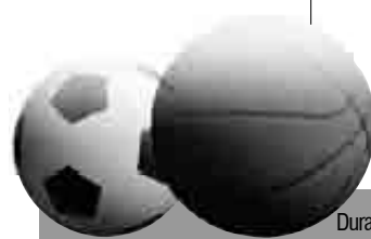
Durangoko Kulturalak 28 gol sartu eta 27 jaso ditu orain arte