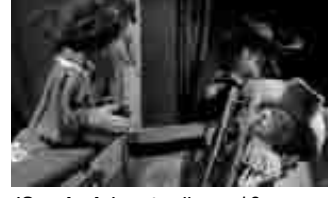
(Gorakada), urtarrilaren 18an, 18:00etan, San Agustin kulturgunean. Zazpi urtetik gorako gaztetxoei zuzenduta.