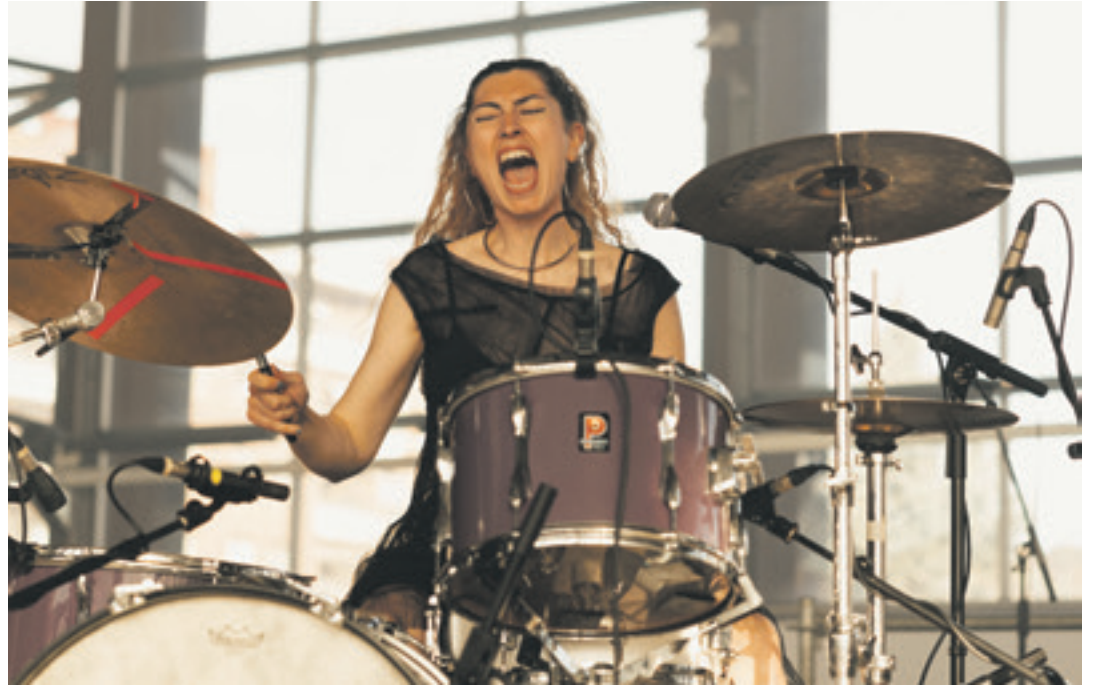
Pinpilinpussies talde durangarrak energia zabaldu zuen Landako Gunean.