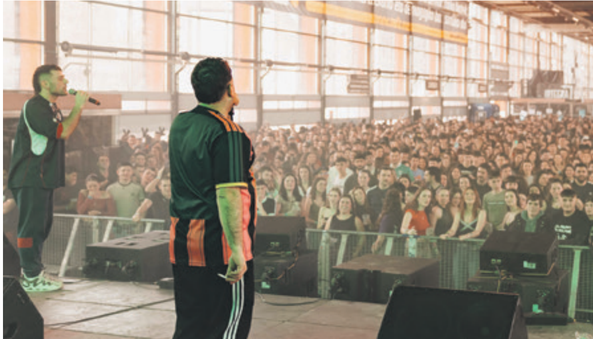
La Txama taldeak ederto baten zirikatatu zituen jaialdira joandakoak.