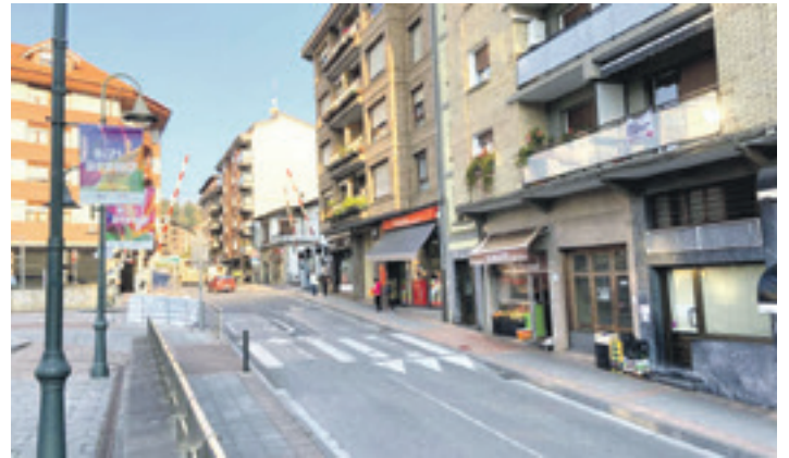
Ikastaroei buruzko informazio gehiago Berrizko Udalaren webgunean dago.

kualdean. Besteak beste, Erorrioko eta Zaldibarko gaztetxeek euren urteurren jaiak iragarri dituzte martxoaren 1erako eta 8rako, hurrenez hurren. Egun osoko egitarauak prestatu dituzte bietan.