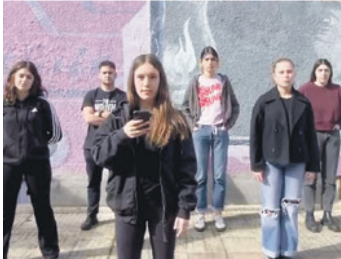
Berrizko Hiltegixe gaztetxeko kideek bideo bat grabatu dute egoera salatzeko.

Durungaldean bertan beste gune autogestionatu batzuetara ere sartu direla salatu dute, bide batez, eta Berrizkoa ez dela "kasu isolatu bat" izan. Berrizko gazte-