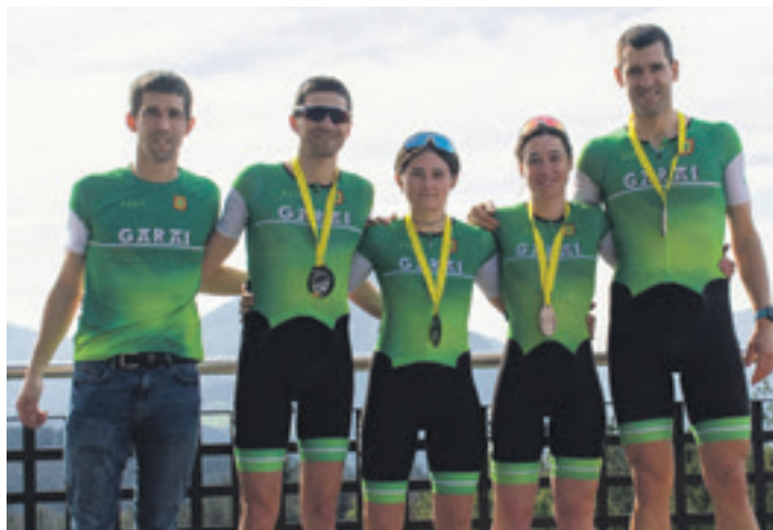
Garai Triatloi Taldeko kideak, dominekin.