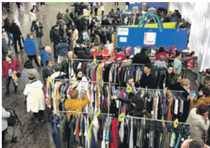
Dendak Bai Fest jaiadiaren iazko edizioa.