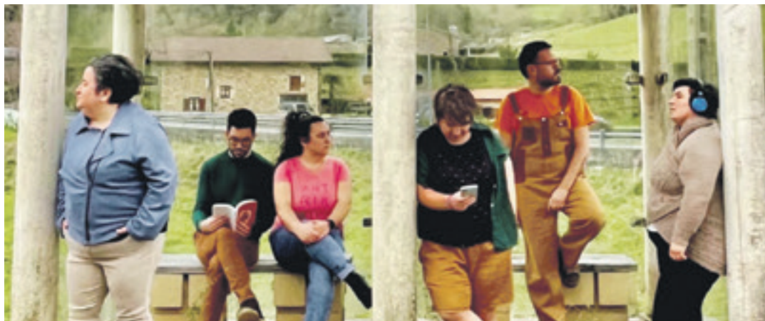
Karrika antzerki taldeko kideak.