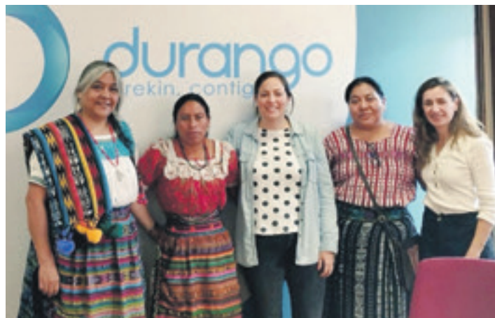
Guatemalako bisitariak Durangoko udal ordezkariekin.