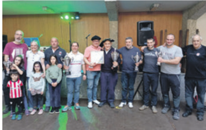
Irabazleen familia argazkia.