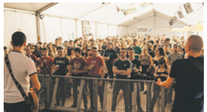
Fitoskins talde elorriarrak punk eta oi! doinuak eraman zituen oholtzara.