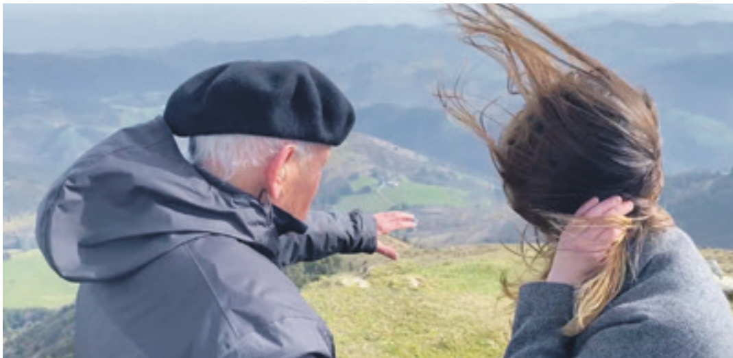
Oizko tontorretik Mallabia aldera begira, hegazkina jausi zen lekura.

'Alhambra de Granada' hegazkinarena Euskal Herrian gertatu den mota horretako istripurik larriena izan da. 141 bidaiari eta 7 tripulatzailerik hil ziren ezbehar hartan