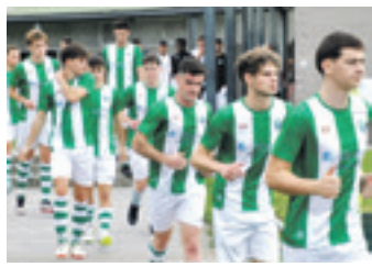
Derbia Astolan jokatuko dute. ABADIÑOKE

Durungaldeko beste taldeei dagokienez, Elorriok jaitsiera postuen jarraitzen du. Iurretako ere beheko aldean dabil eta borroka horretan aurkari zuzena den Sondika hartuko du etxean.