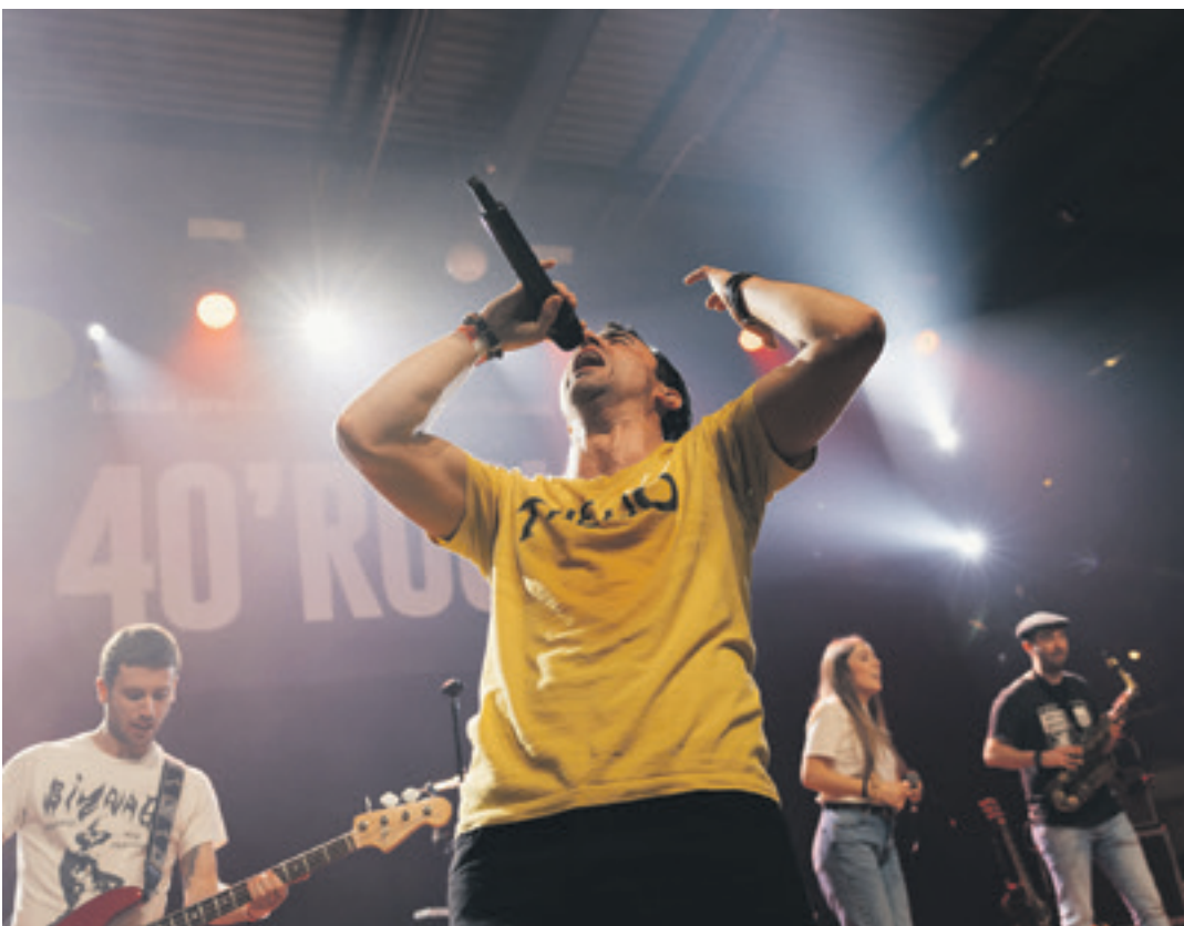
Añube taldearen hitzak areto osoan zehar entzun ziren.