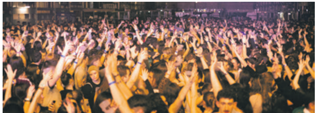
Dupla talde arabarrak zoratu beharrean ipini zituen festazaleak, ordu txikitan.