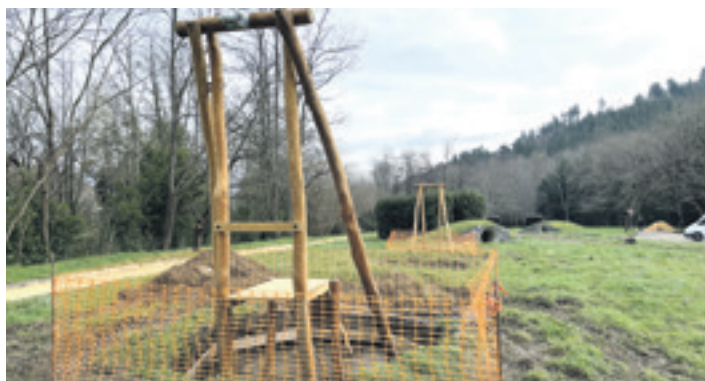
Santo Tomas parkeko tirolina berria.

Izurtzako Udalak hainbat hobekuntza egin du Santo Tomas parkean. Besteak beste, umeentzako tirolina bat ipini dute, herri batzar batean irtendako proposamenari kasu eginez. Bermeosolo enpresak egin ditu lanak eta aste bi iraun dute