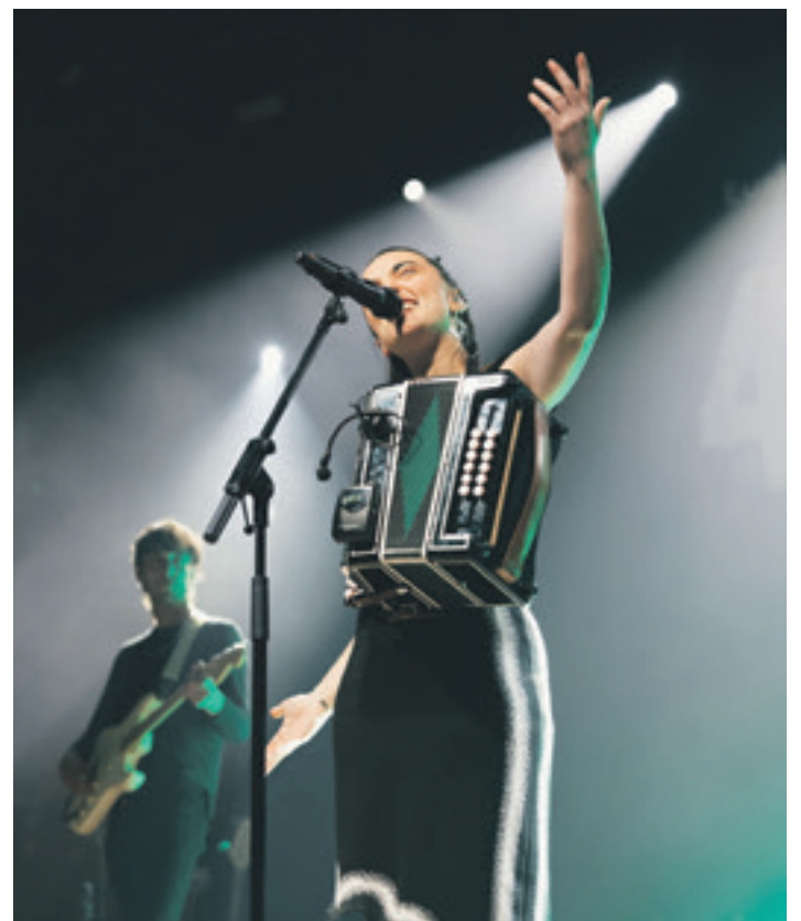
Süneek bere proposamen musikala aurkeztu zuen taula gainean.