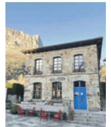
Amillena izango da antzezlana.

Gaurko ekintza Amillenako kideek antolaturiko Plazerkekeriak zikloaren barrukoa da. Ekimenaren bitartez, emakume eta identitate disidentedun sortzaileei euren sorkuntza aurkezteko agertokia eskaintzen diete Ami-