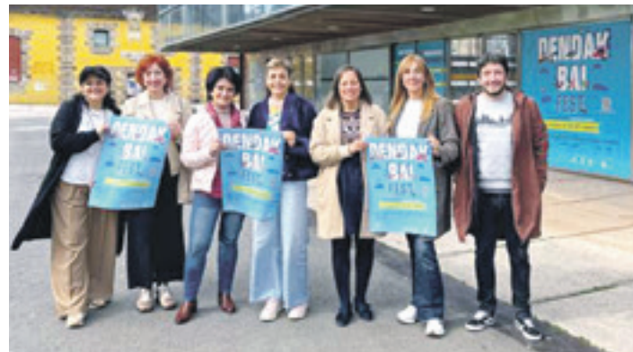
Dendak Bai elkarteko kideak.

Udalak berretsi egin du euskaragazko konpromisoa, eta arlo horretara bideratutako aurrekontua ipini du horren adibide lez. Izan ere, 2021etik 2025era Udala Euskaltegiari eta euskara arlori bideratutako inbertsio osoa % 13 igo da. 2021ean 699.773 euro bideratu zituen Udala Euskaltegiari, eta 327.485 euro euskara arlori. Aurtengoa, Euskaltegiak 800.404 euroko zuzkidura izango du, eta hizkuntza sustatzeko sailak 364.727 eurokoa.