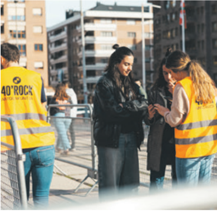
Boluntario ugari aritu zen lanean jaialdian.