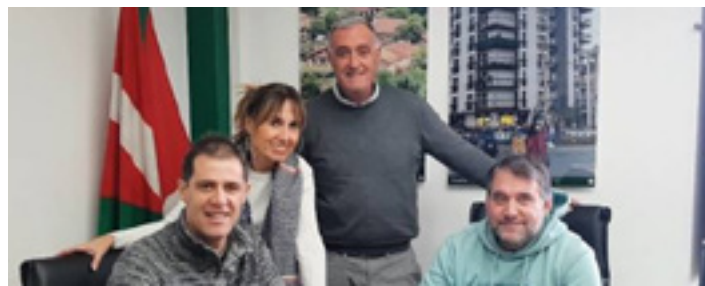
Abadiñoko EAJko kideak.