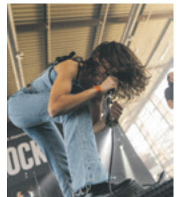
Chuleria Joder taldea egurrean.