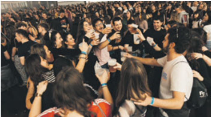
Batek baino gehiagok parranda egiteko baliatu zuen jaialdia.