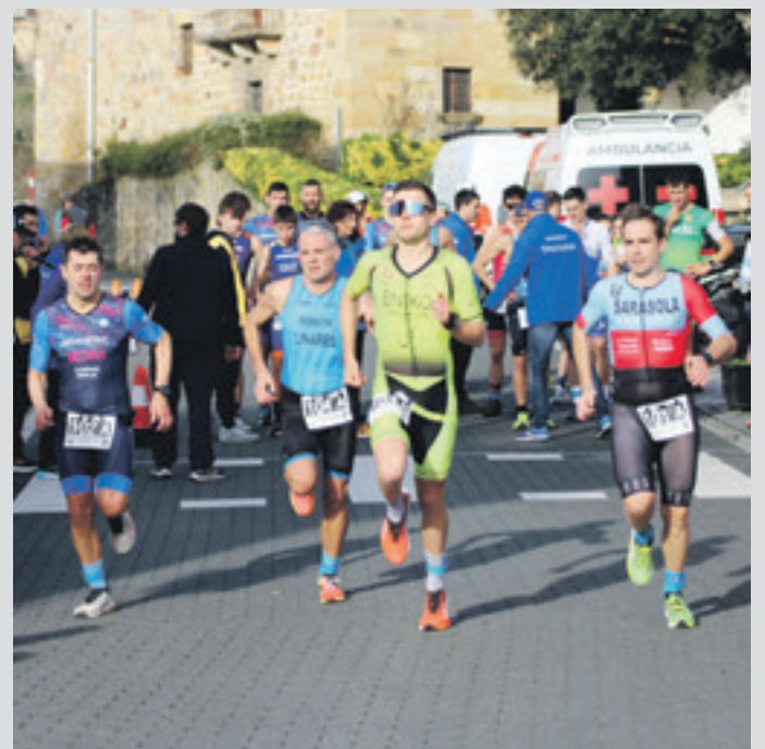
Iazko aldiko parte hartzaileak korrika.

Izan ere, Garaikoa mota honetako proba bakarra da Euskal Herrian. Duatloiko erdigunea plaza ingurua izango da eta lehenengo lasterkariak 10:00etan irtengo dira. Federatuentzat ez ezik, federatu bakoentzat ere badago proba bat: opena. Lasterketa biak kontuan hartuta, 19 taldek parte hartuko dute nesketan, mutiletan eta mistoan. Aurten, kadete mailako lasterketa berreskuratu dute, eta eurretari zazpi talde lehiatuko dira. Garaiko ibilbidea iazko bera da. Korrika hilerrirainoko joan-etorria egingo dute. Bizikletan Goiuriantza irtengo dira eta hara ailegatu orduko, Iurretako lurretan, buelta eman eta Garaiko plazara itzuliko dira (8 kilometro guztira). Azkenik, korrikako ibilbideari buelta bat eman beharko diote.