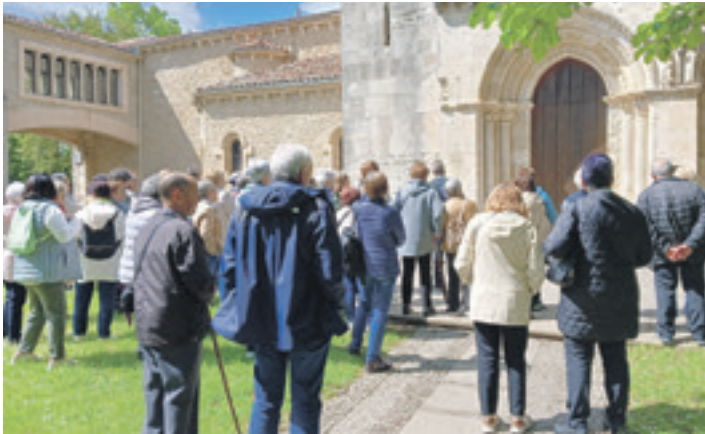
Durangaldeko adinekoen bidaia kultural bat. DURANGOKO UDALA

Interesdunek otsailaren 21era arteko epea dute bidaiari izena emateko. Bakoitzaren prezioa 1.520 eurokoa da