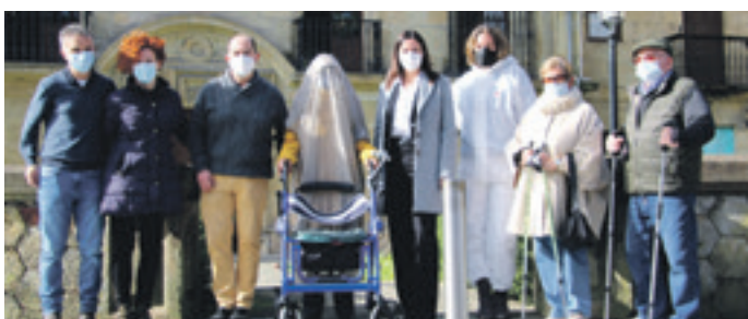
Astelheheneko bisita gidatua.

bermatu zuten: museoa itxita egon zen bisitan zehar, eta wifi sarea zein telefono mugikorrek amatatuta. Horrez gainera, beharrezko aireztapena bermatu eta substantzia kaltegarriak saihestuta garbitu zituzten instalazioak. Egitasmo horrek Durango Udalaren eta SFC-SQM Euskadi-AESEC Elkartearen arteko lankidetzari eskerrak ikusi du argia.