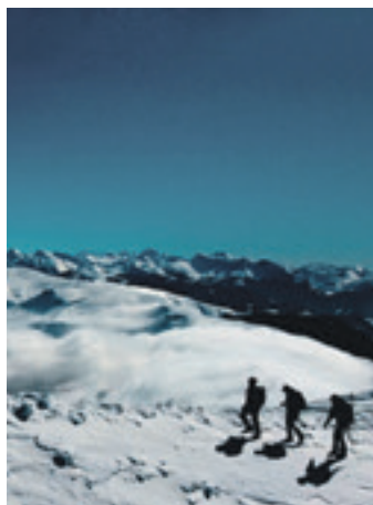
'Zazpi' filma. MENDI FILM

2025eko Mendi Tour zirkuituak Otxandion egingo du lehenengo geraldia Durangaldean. Otsailaren 22an Mainondoko gimnasioa doazen herritarrek iazko Bilboko Mendi Film Jaialdiko filmik onenak ikusteko aukera izango dute. Hiru film emango dituzte: Jamie , Zazpi eta Andrea, an unpaved route ; hain zuzen ere, iazko jaialdiko film laburrik onena, euskarazko filmik onena, eta kirol eta abentura filmik onena, hurrenez hurren. Emaldia 19:00etan hasiko da.