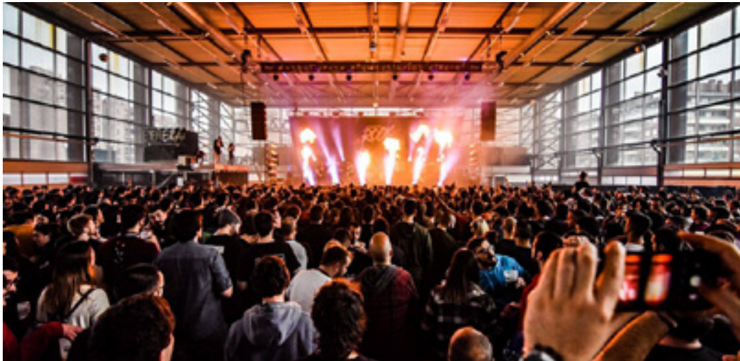
40 Minutu Rock jaialdiaren izako edizioa. 40 MINUTU ROCK