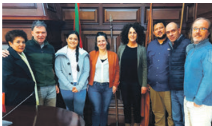
El Salvadorko eta Durangaldeko ordezkariak.

Euskal Fondoa Lankidetzarako Tokiko Erakundearen Elkarteak ekarri du ordezkariak Euskal Herrira