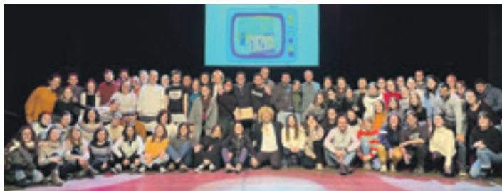
Hirukoa galako familia argazkia.