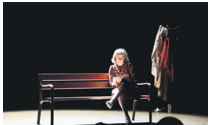
'Vida' antzezlanaren irudia.