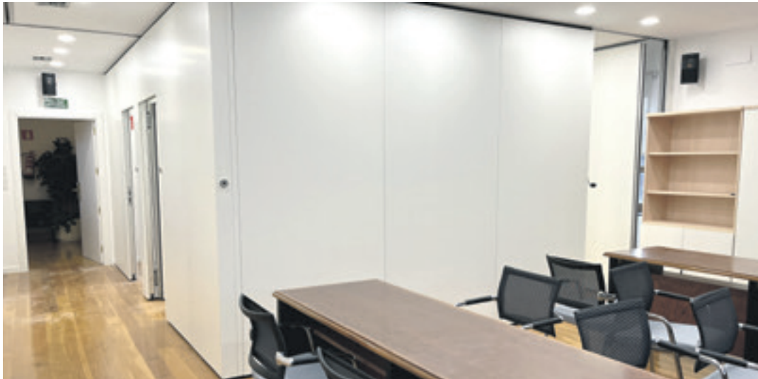
Udalbatza-aretoa panel denak ipinita daudela. Modu honetara, hiru gune daude.

Atxondoko Udalak udalbatza-aretoa berriztu du. Aurrerantzean, panel mugikorrek erabilia, hiru gela sortu ahal izango dira bertan. Gune berriztuak ETB1eko 'Irabazi arte' telesailaren aurrestreinaldia hartuko du, gaur, 20:00etan