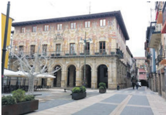
Durangoko euskara teknikari postuaren etorkizuna zalantzan dago.

EH Bilduk euskara teknikariaren postuaren garrantzia nabar-