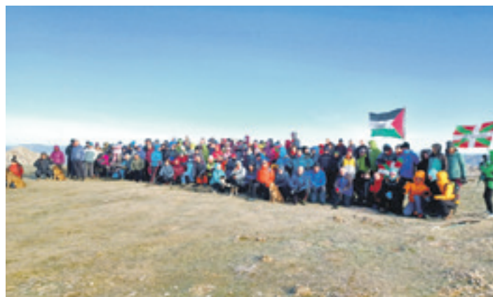
Alpinoko kideak Urteberri egunean, Urkiolagirren. ALPINO

ko, lehenengo euskalduna izan da Balentziagaren oroimenezko lasterketan, afizionatu mailako lasterketarik prestigiotsuenetarikoa. Horrez gainera, Nafarroako Itzulia bigarren tokian amaitu zuen.