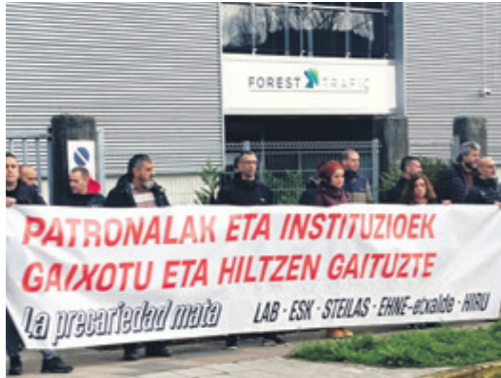
Eguaztenean egin zuten elkarretaratzea.

LAB sindikatuak "ikerketazorrotza" eskatu du gertakariak argitzeko, eta "kasutik eratorri daitezkeen erantzukizunak argitzeko". Horrez gainera, 2015ean ere enpresa berean beste langile bat hil zela gogoratu du; kasu hartan, pieza baten kolpearen eraginez hil zen langilea.