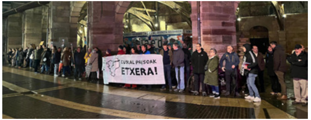
Durangoko Etxeratik eta Ezker Abertzaleak urtarrilaren 3an egin zuten barikuetako azken elkarretaratzea.

Durangoko Udalak aktak bideo bidez jasotzeko sistema, mikrofono automatikoak, kanal anitzeko aldibereko itzulpen sistema eta multimedia pantaila ipini ditu osoko bilkuren aretoan. Hobekuntzok Bizkaiko Foru Aldundiaren laguntzagaz egin dituzte.