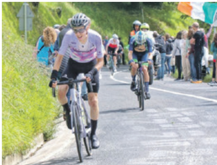
Trigo, iazko lasterketa batean.

Bere aldetik, Vigo Rías Baixas taldea pozik dago fitxaketagaz. "Fitxaketa garrantzitsua da.