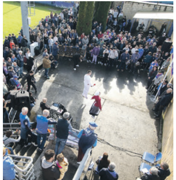
Dantzarien saioa, mendeurreneko banderaren aurrean. SDA