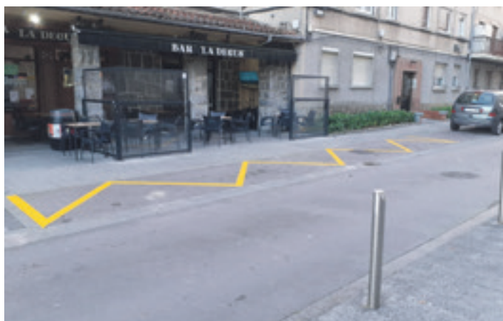
Kamioientzako eta furgonetentzako geralekuak ipini dituzte. DURANGOKO UDALA

Banaketa-ibilgailuek espaloiak modu desegokian erabiltzea saihestu gura du Durangoko Udalak