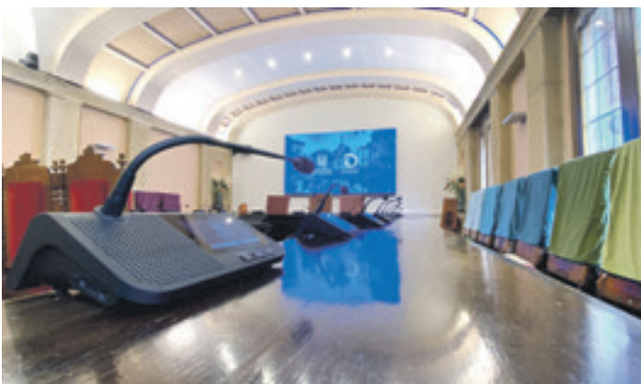
Durangoko Udaleko osoko bilkuren aretoa. DURANGOKO UDALA

Udalak hamar urteko kontratua egingo du enpresagaz; guztira, 7.745.000 euroko kopurua-gaz. Lehiaketa publikora aurkeztu gura duten enpresek otsailaren 11ra arteko epea izango dute proposamenak aurkezteko. Erabaki honeguz, Durangoko Udalak "herritarren eta bisitarien segurtasuna eta ongizatea" hobetuko direla azaldu du. Era berean, proiektuak "herritarren eskari historiko bati" erantzuten diola gaineratu du.