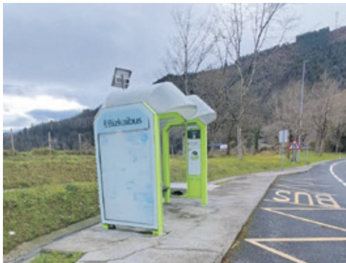
Goitondoko autobus geltokia.

2025eko inbertsioei dagokienez, honako hauek dira nagusiak: alde batetik, Goitondoko autobus geltokia berriztea eta hobetzea; lan honek 110.000 euroko diru partida izango du. Bestetik, LHIK-ko aparkalekuaren irisgarritasuna hobetzea (30.000 euro), frontoiko gimnasioko klimatizazioa hobetuko duen itxitura egitea (46.000 euro), eta udal lurretan dauden eguzki plaken energia kudeatzeko etxola bat instalatzea (30.000 euro), besteak beste. Era berean, aurrekontuan hiri garbiketarako eta hondakinen kudeaketarako partidak handitu dituztela ere azaldu zuten Mallabiko Udaletik,