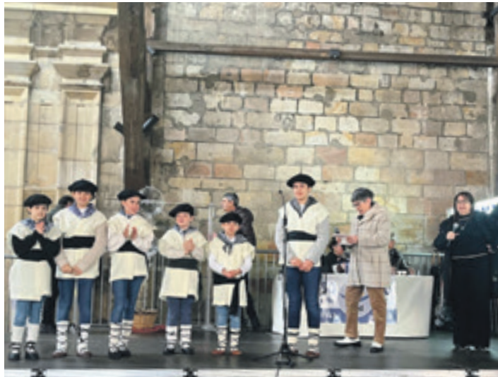
Sarien zozketa urtarrilaren 6an egin zuten.

Urtero legez, elkarteko kideek urtarrilaren 6an egin zuten sarien zozketa. Sari nagusia, Renault Clio Techno TCE90 autoa, 47.616 zenbakiarentzat izan da. Zozkatu dituzten gainerako artean, bidaiak, Apple gailuak,