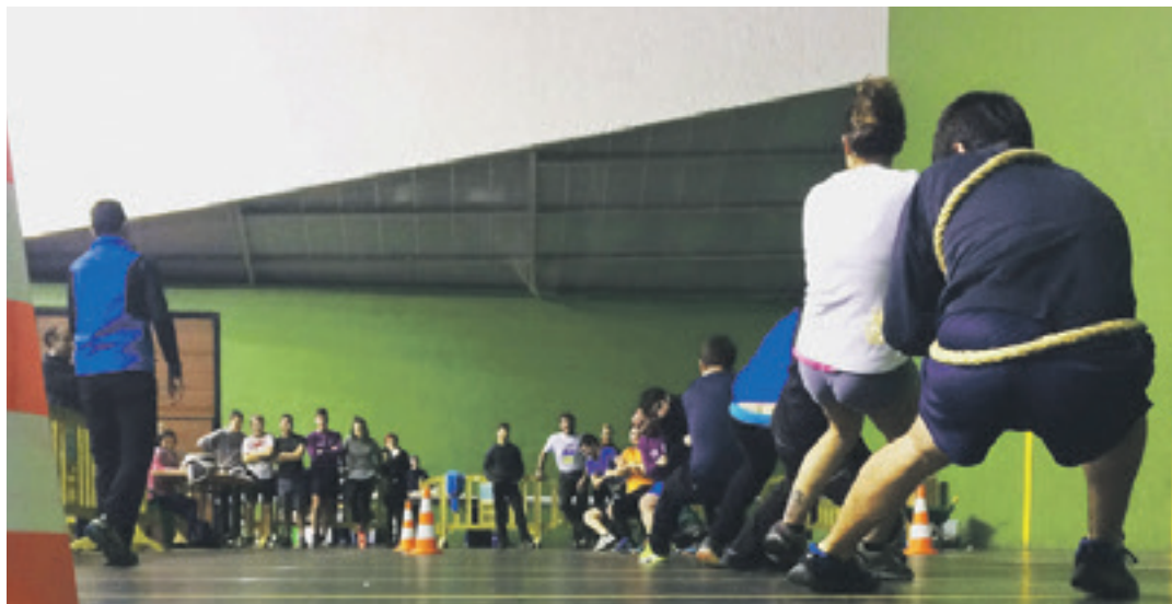
Nekazaritza-olinpiadak. BERRIZKO UDALA