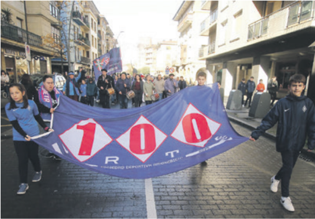
Amorebietako zaleak kalejiran, Urritxera bidean, urteurreneko banderagaz . SDA