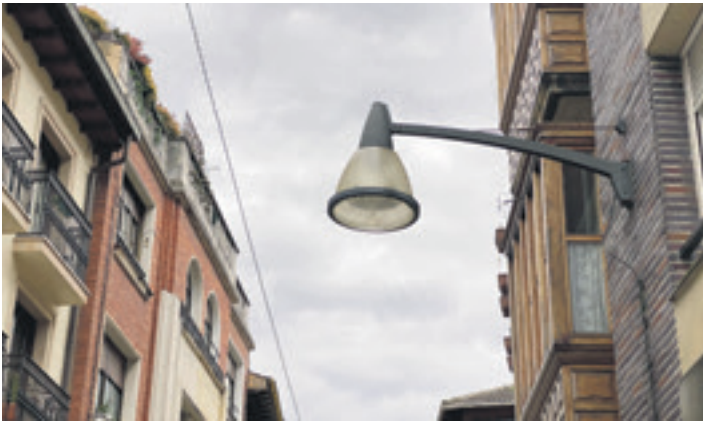
Argi-foku bat Durangoko kaleetan. DURANGOKO UDALA