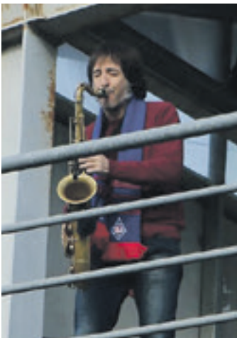
Jou Gonzalezen saioa. SDA