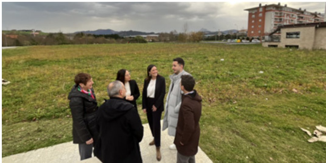
Durango Udaleko eta Eusko Jaurlaritzako ordezkariak, atzo, Kirolene eraikiko den orubean.

KIROL-HEZKUNTZA Kiroleneren eraikin berria Arripauseta auzuneko etxebizitza berrien eta Open gimnasioa zenaren arteko orubean egingo dute. Hurrengo pausoa lurak Jaurlaritzari lagatzeko hitzarmena sinatzea da. Lanak 2027an hasita dute helburu