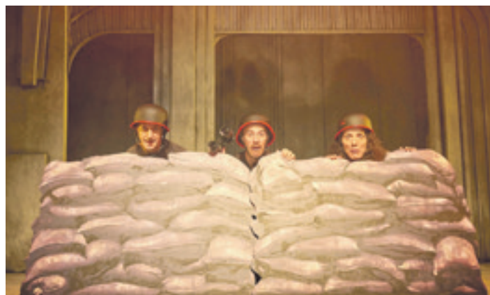
'War baby'. YLLANA

Gaur, barikua, Bihotzek kontzertua emango du Nekktar taldeagaz batera, Durangoko Rugby tabernan; 22:30ean hasiko da. Gerora, Igorren, Gasteizen eta Abadiñon ere emango ditu kontzertuak