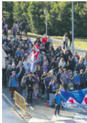
Kalejira jendetsua izan zen. SDA