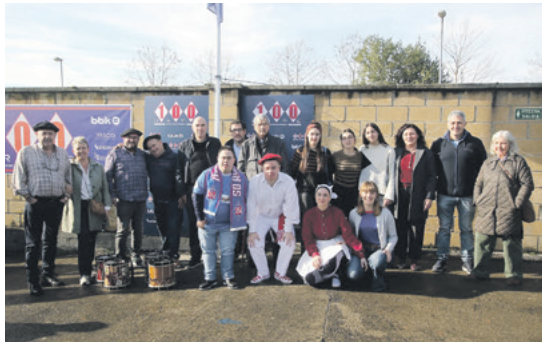
Urtarrilaren 4ko ospakizun eguneko protagonisten familia argazkia. SDA