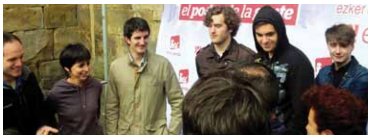
Ezker Anitza-IU-Iratzari-EKI "benetako enplegu politikak" eskatu zituen.