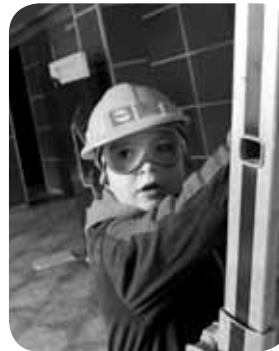
> Zorijonak Jon! Ondo pasau urtegune, eta etxeko danon partez mosu handi bat!