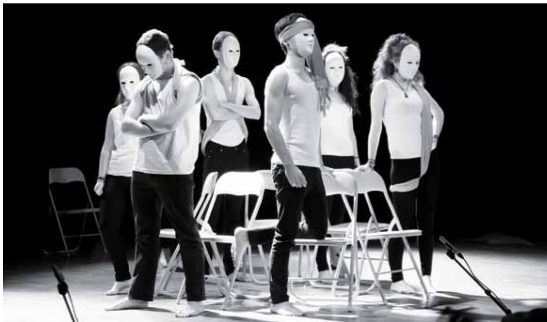
Abadiñoako 23 gaztek dihardute '7 aulki' obran aktore lanetan.

Bigarren Hezkuntzako eta batxilergoko Zelaietako eta Abadiñoako beste auzo batzuetako 26 ikasle elkartu dira proiektuan: 12 eta 17 urte arteko gazte abadiñarrak. Antzezlan moldatu