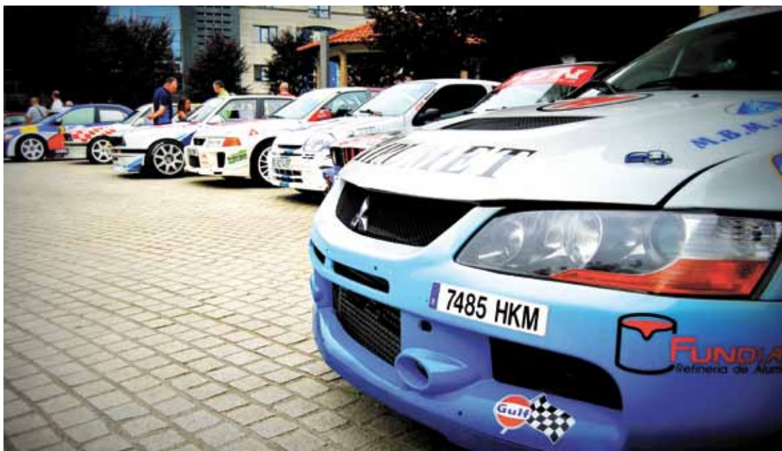
Zornotzako probak 65 bat parte-hartzaile izango ditu. Borja Basterrechea.

Horren lekuko da asteen jokoan den eta asteburu honetan jokatuko den San Trokaz Txapelketa.