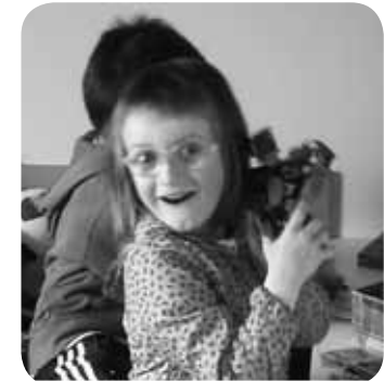
> Araitzek maiatzien 18zen 5 urte eingo dauz. Zorionak etxeko printzesa! Ondo pasau zure urtegunien eta zaren modokue izeten jarraitu.