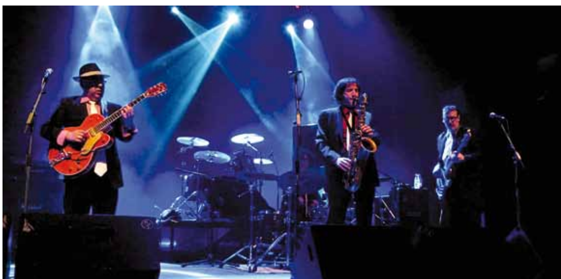
Duela hamar urte sortu zen Botxo Boogies laukotea, Bilbon.

Iaz Haizetara jaialdiko jam session saioak koordinatzen aritu nintzen, eta aurtentzen ere bertan egongo naiz. Iaz bezala, formatu txikiko jazz kontzertuak izango dira Haizetara jaialdian datozen musikariek: libre aritzen dira musikariak saio horietan, eta oso giro polita sortzen da.