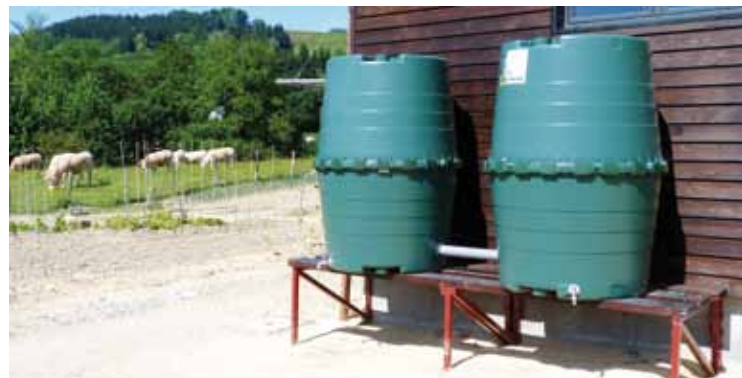
Biltegi bakoitzak 1.300 litro hartu ditzake.

ortu ludikoa Iurretan. Durangaldean aitzindariak izan direla azaldu dute, eta ondoko herri askotatik (Berriz, Markina eta Derio, adibidez) etorri direla Iurretako azpiegiturek zelan funtzionatzen duten ikustera.