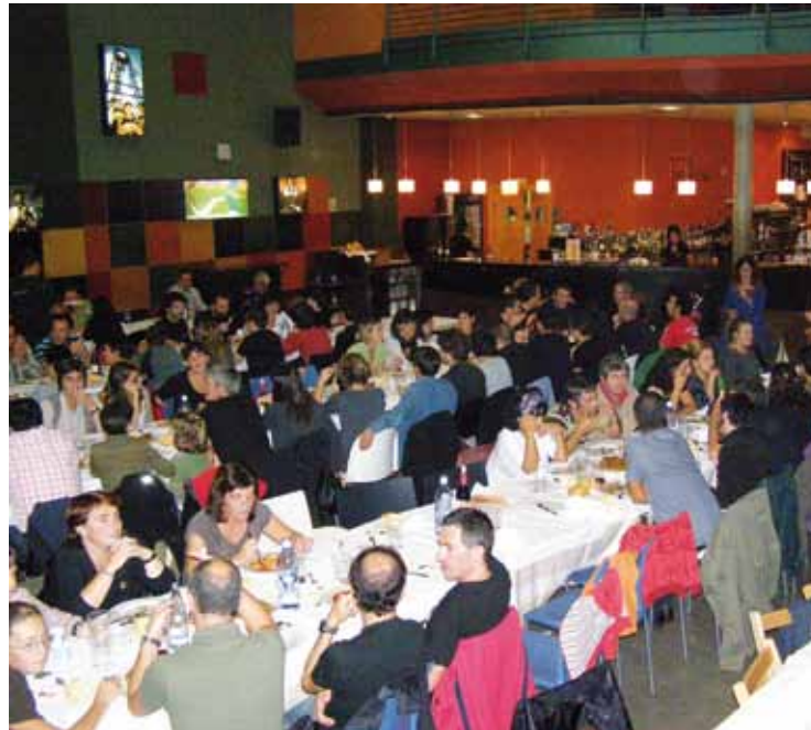
Berbarok 20 urte bete zitueneko ospakizuna.

Euskararen normalizazioan pausoak eman badira, herrigintzan ibili diren gainerako elkarrekin eta pertsonengatik ere bada, Berriozabalen arabera. “Ezinbesteko ikusten dugu beste elkarrekin batzuekin beharrez jarraitzea”. Baina, kontrara, erakundeek ekarpen falta igarri