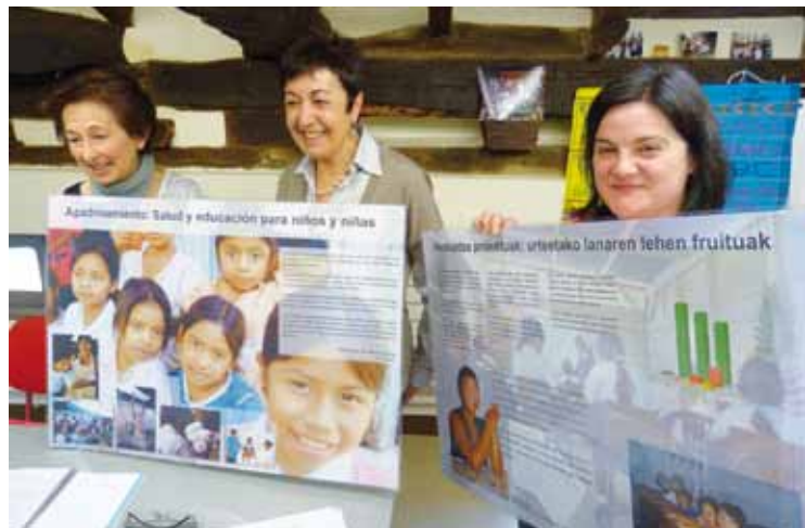
Bateginezeko kideak prentsaurrekoan.

lehenengo umeetako bat. Durangaldeko emakume bat bere amabixia bihurtu zen Bateginezen kanpainak bultzatuta, eta 1995ean eskolan hasteko aukera