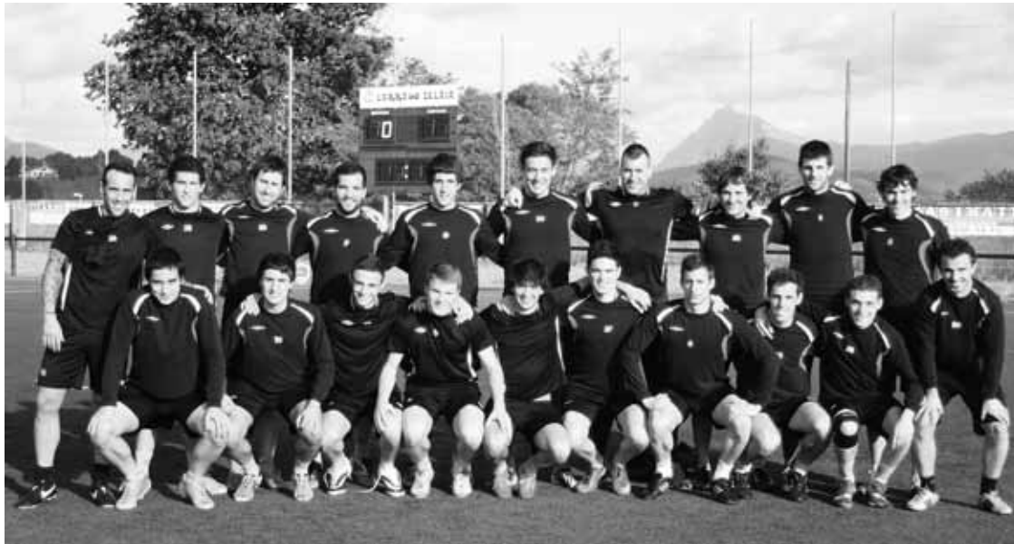
Iurretako futbol taldeko jokalariek Larrakozelaian, eguaztenez egindako entrenamenduan. Kepa Aginako.

Partidu biren faltan hiru puntura du igoera zuzena; promozio postua baliatzeko Hirugarren Mailako talde euskaldunetako batek igo egin beharko luke