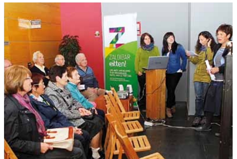
Egindako bideoen lagin bat erakutsi zuten ekitaldian.

Euskal Herriko ahozko ondarea eta herri hizkerak biltzea eta hedatzea du helburu Ahotsak ekimenak, eta, dagoeneko, Euskal Herriko hainbat txokotan egindako elkarrizketekin osaturiko datu-base horren parte dira 80 urtetik gorako hamahiru zaldibartarren testigantzak ere.