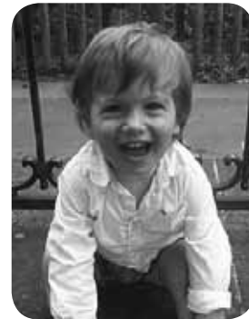
> Zorionak maittia zure familia guztiaren partez; batez ere, Amaian partez, kuttun. Musu potolo bat.