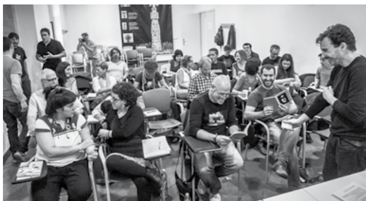
27 lagunek hartu dute parte Iturri kultur etxeko ikastaroan.

Hiru zatiko ikastaroa izan da I. ElorriPhoto ekimena. Argazkigintzan ikuspuntuak, espazioak eta argiak daukaten garritiaz jardun ziren, besteak beste.