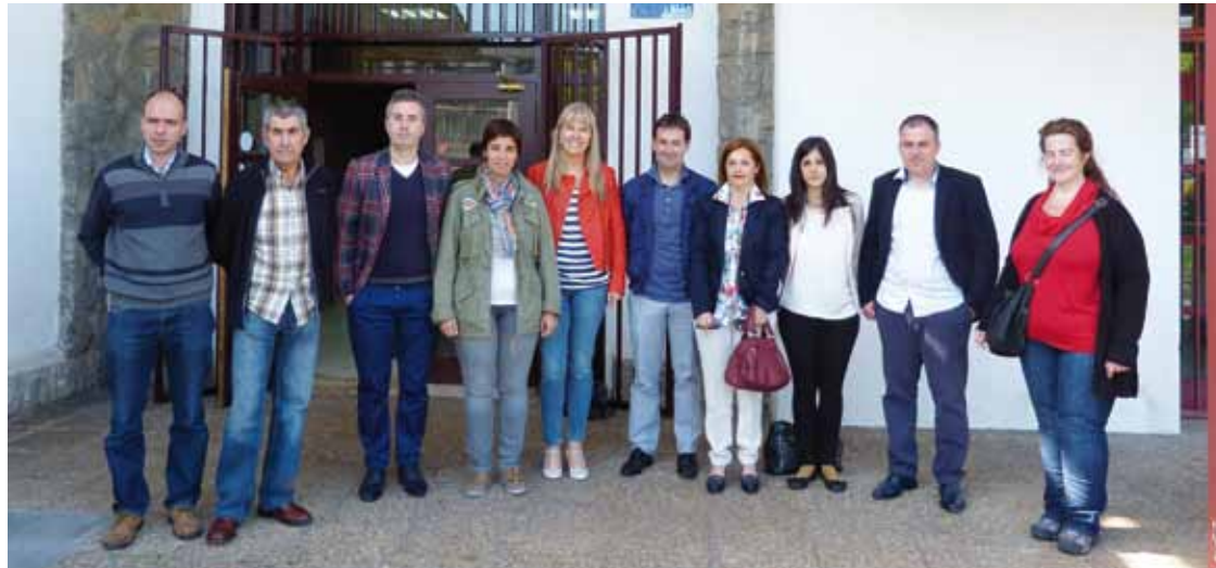
Proiektuaren aurkezpeneko deitutako prentsaurrekoan Durangaldeko hainbat udal ordezkariak parte hartu zuten.

Gazteen aukera sozio-profesionalen kalitatea hobetzea du helburu proiektuak