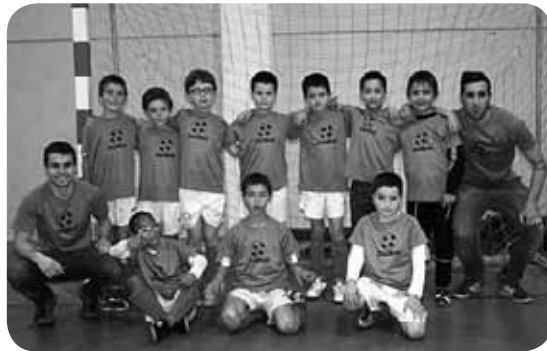
> Zorionak Zaldibarko 3. mailako mutilei eta euren entrenatzaileei! Futbito txapelketan umetxoan mailan txapelak izan dira, partidu guztiak irabazi dituzte. Zorionak zuen gurasoen partez!