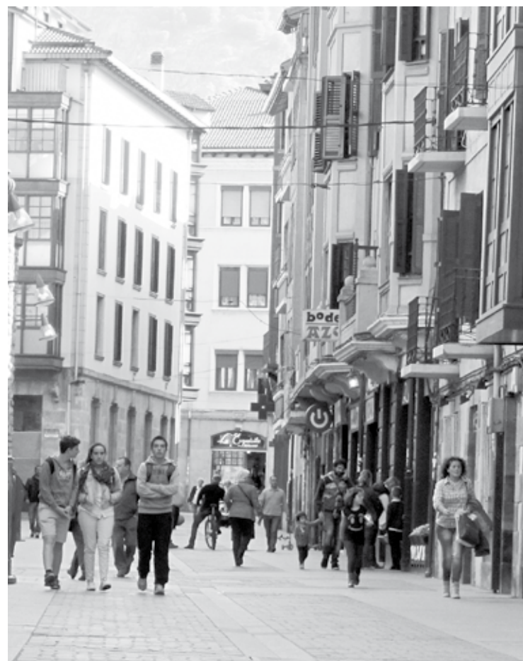
Eskolak euskaldundu izanak eragin handia du ezagutzaren igoeran.

Mapa soziolinguistikoaren arabera, euskararen etxeko erabilera bajatu egin da azken urteetan. 1991n etxeen %29,6an nagusiki euskaraz berba egiten zen; 2011n %22,6an. Gaztelaniaz egiten da nagusiki hamarretik sei etxetan, eta beste hizkuntzaren bat egiten dute etxeen %2,2an.