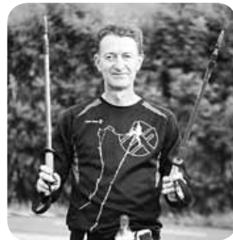
> Zorionak Aitatzu! Danak uste dogu munduko aitarik onena dekogule, baia gure kasuen egie da! Gu garena gara, zu zu zarelako.