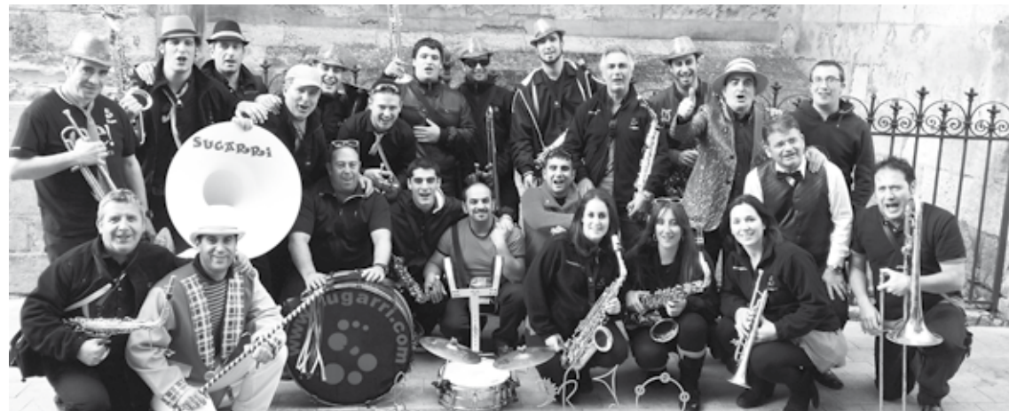
Duela hiru hamarkada sortu zuten Sugarri fanfarrea Durangon.