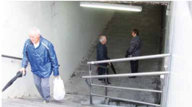
Udaltzainak arduratuko dira bideozaintza sistemaz.

EAJren eta PSE-EEren aldeko botoekin onartu dute 2014ko udal aurrekontua