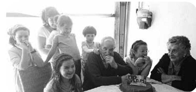
> Aitite Pedritok eguztenean 96 urte bete dauz! Zorionak eta mosu handi bat Erdellako familia guztiaren partez!