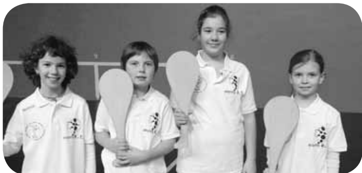
> Zapatu honetan Elorrixoko gomazko palako neskek eskolarteko finala jokatu dute Balmasedan. Primerako denboraldia egin eta gero, orain daukate aukera txapela eskuratzeko. Aupa laukote, zuek ahal duzue!