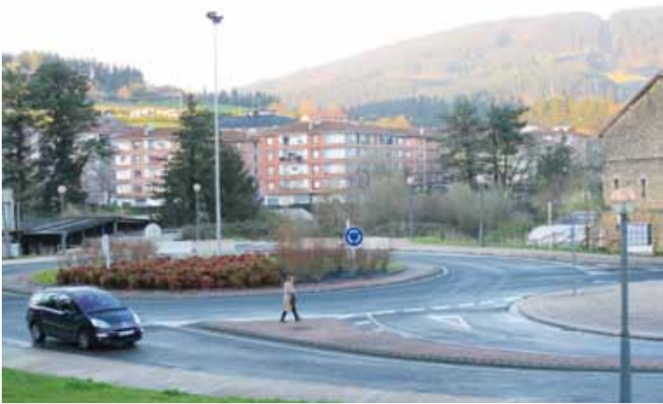
Ibarra auzoa eta gasolindegia lotuko ditu zubi berriak.