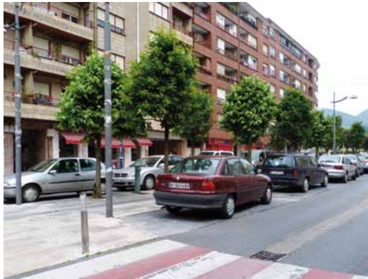
Askondo autoentzat ixtea planteatu dute, laburbide moduan erabiltzen delako.

Azterketaren arabera, herri barruko trafiko asko aparkale-