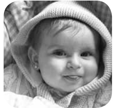
> Gaur urtetxo bat egingo du gure etxeko izarrak. Zorionak Izarri eta gurasoei.