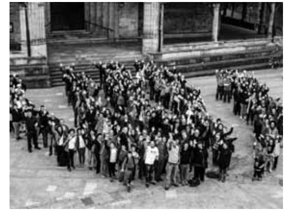
Elorrion, plazan, irudia osatuta.