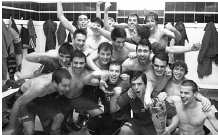
Amorebieta B-ko jokalariek aldageletan, pozez gainezka igoera lortu ondoren.

Gainontzeko maila dagoenez, Iurretakoko talde nagusia Hirugarren Mailara igotzeko borrokan sartuta dabil liga amaitzeko hiru partiduren faltan. Elorrio, Berriz eta Abadiño, aldiz, ez jaisteko borrokan dabilza zein bere mailan.