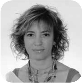
> Zorionak zure urtebetetzean aita, ama eta Iamen partez.

✉ zorionak@anboto.org eguziatzeneko 14:00ak arteko epea