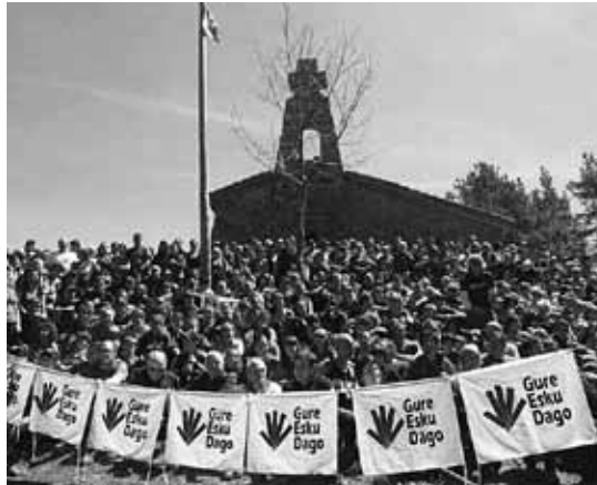
Zornotzarrak Bizkargi mendian, domekan.