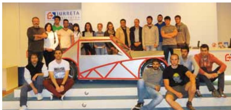
Martitzenean egin zuten autoaren aurkezpena prentsaren aurrean.

Rotterdameko proban, zirkuituari ahalik eta buelta gehien eman behar diote, ahalik eta energia gutxien kontsumituta. Urkiola izena ipini diote autoari ikasleek. Lehenengo mailakoak dira eta ziklo bat baino gehiagotako ikasleek elkarlanean osatu dute proiektua, denbora eta ilusio asko jarrita.