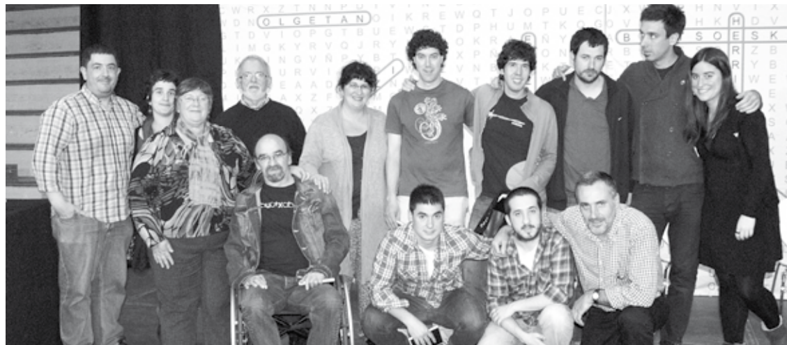
2012ko Durangaldeko Bertsolari Txapelketako finalaren osteko irudia.

Gaur gauean, Zornotzan eta, domekan, Izurtzan izango dira kanporaketak