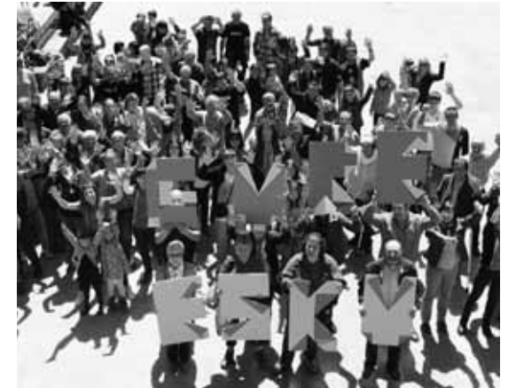
Otxandion, eskuak altxatuta dauzkatela.