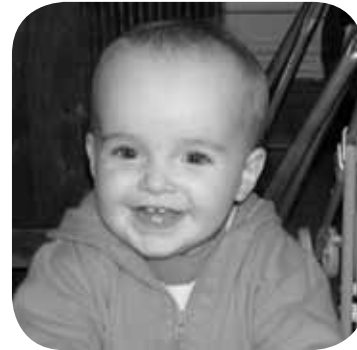
> Gure Lurtxok eguztenean urtebete egin zuen. Zorionak laztana etxeko guztion partez. Mosu potolo bat.