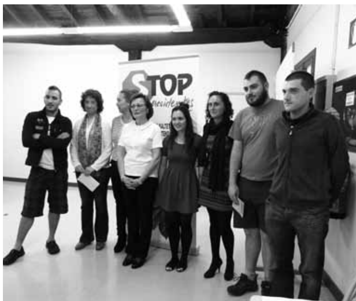
Kanpaina bultzatu duten ordezkariak eta herritarrak, aurkezpenean.