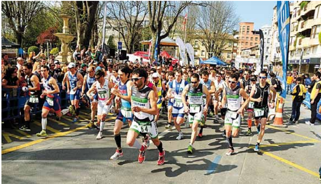
Iazko lehen aldiak 500 korrikalarik baino gehiagok parte hartu zuten. MugarraTT.

Iazko lehen aldiak izandako harrera onaren ondoren, herri krosaren bigarren aldia antolatatu du aurten Mugarra Triatloi Taldeak domekarako