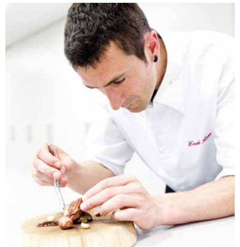
Aziemendi izena jarri dio Atxak Phuketen (Thailandia) zabaldu berri duen jatetxeari.

Suaren aurrean munduko maitasun handienarekin kozinatzen dut beti gure bezeroentzat. Guretzat garrantzitsuena gure bezeroak dira, beraiek disfrutatzea eta pozik egotea.