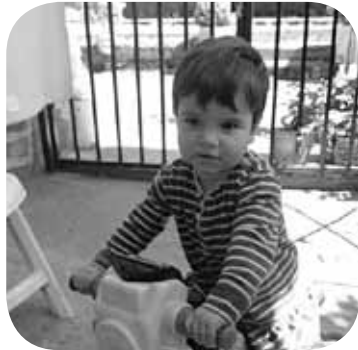
> Gure sorgintxoak larunbatean 2 urte egingo ditu, ondo pasa eta mosu potolo bat etxeko guztien partez!