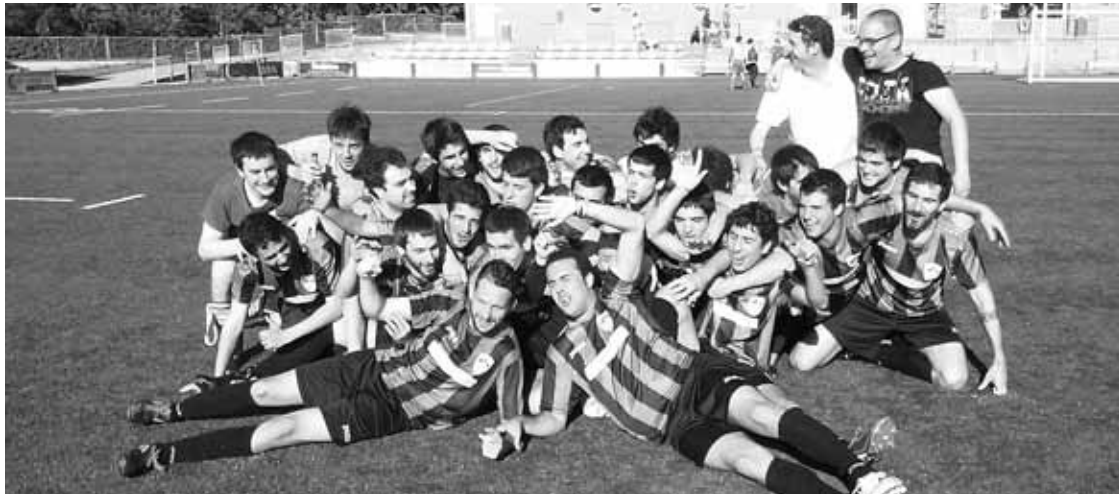
Ezkurdi futbol taldeko kideak igoera ospatzen, domekako partidua amaitu ostean.

Durangoko Ezkurdik Lehenengo Erregionalean jokatu du hurrengo denboraldian; Amorebieta B, berriz, Bigarren Erregionalerako igotzea lortu du.