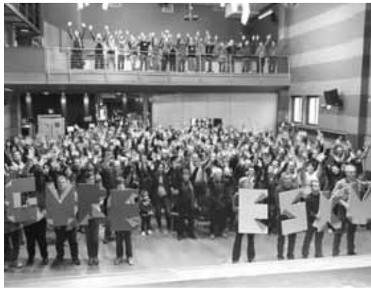
Durango, Plateruenean egin zuten aurkezpena.

Zaldibarren, bestalde, gaur aurkeztuko dute dinamika, 19:30ean, udaletxe parean.