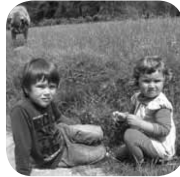
> Zorionak eta muxutxo bine bixontzat, Oromiñotik eta Abadiñotik! Gora Abadiñoko Poxpolinek!