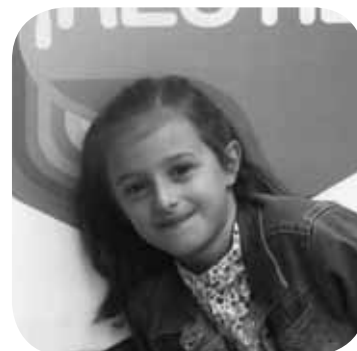
> Zorionak zure guraso eta aitita-amamen partez!