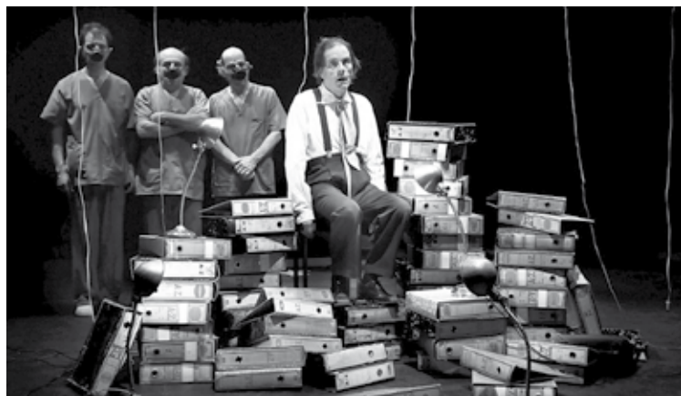
Hogeita hamasei urte daramatza La Zarandak lanean.

Memoria ez digute domestikatu, gure (h)istoria ez dute erraustuko. Iraganak dakar oraina, hauxe da geroaren bezpera: duela 77 urte bonbaz txikitu zizkiguten etxeak, gaur ez dute zulo zirrikitu bat ere irekiko gure memorian. Bide izkinak hilotzez beterik ditugu oraindik.