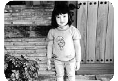
> Goizederrek apirilaren 3an 6 urte bete zituen. Zorionak eta besarkada potolo-potolo bat gure Zengotiko printzesia, etxeko danon partez.