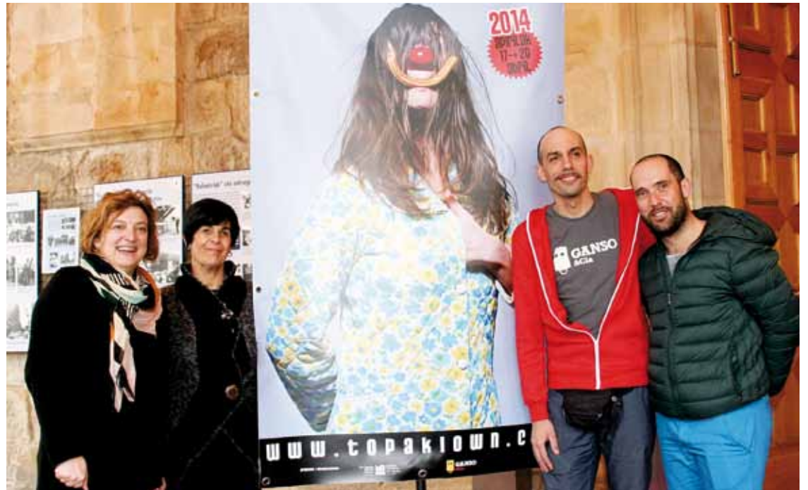
laz arrakasta handia izan zuen ekimena egonkortzea da bigarren edizioarako ezarritako helburua.