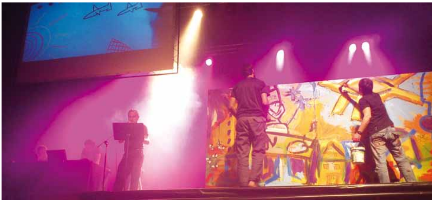
Sorkuntza prozesuak erakutsiko dituzte sortzaileek Zilar Astean. Irudian, '1937 gaur' lanaren emanaldia, 2012ko aste tematikoan, Plateruenean.

Askotariko arte adierazpideak izango dira Durangoko aste tematikoko protagonistak: antzerkia, arte plastikoak, argazkigintza, literatura eta musika, esaterako; 2010eko lehenengo ediziotik egin den bezala, herriak herriari eskainiak.