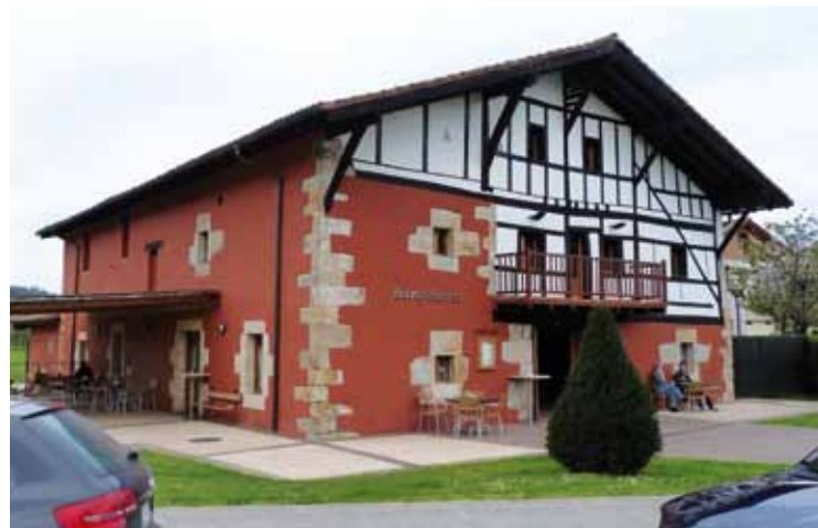
Jauregibarriako baserriaren irudia, Zornotzako sarreran.

Interpretazio zentroak kostu ekonomikoa eragiten zion udalari, eta, gainera, eskaini beharreko dena eskainita zuela uste