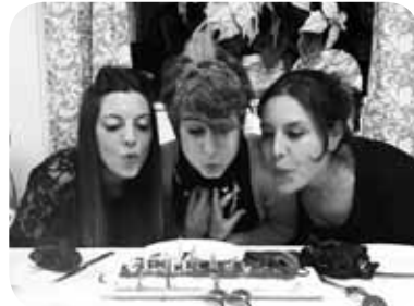
> 3 gaztetxo hauek urteak bete dituzte apirilaren 1ean, 2an ta 3an. Belarri tirakada kuadrilakoan partez!