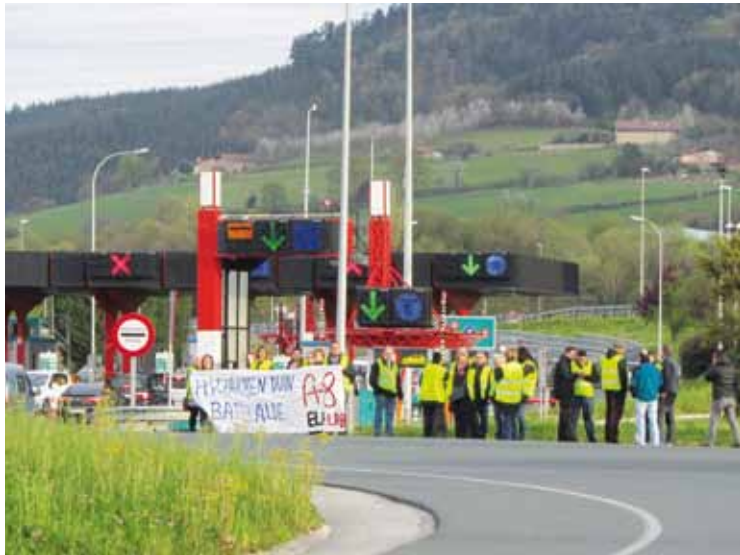
Langileak protestan lurretako ordainlekuan, astelehenean.

Gaurko ere lanuzteak deitu dituzte A8-ko langileek