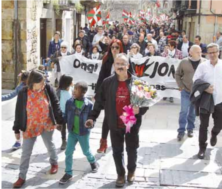
Irazola, joan zen domekan egin zioten harreraren.

Iheslarien kolektiboak egindako iragarpenaren ostean, hainbat iheslari agertu dira euren herrietan