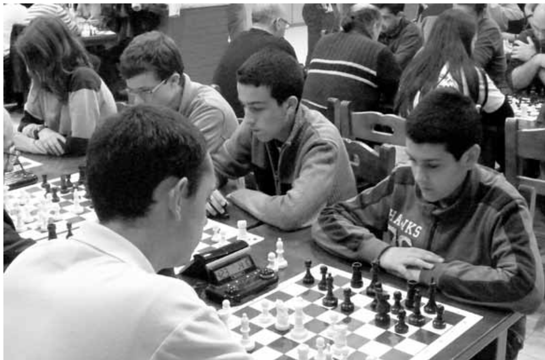
Durangoko Larrasoloeta taldeko gazteak. Larrasoloeta.

Abadiñoko talde bik eta Larrasoloetako batek mailaz igotzea lortu dute; Elorrioko Zaldi Baltza B eta Zornotzako talde bi, aldiz, jaitsi egin dira