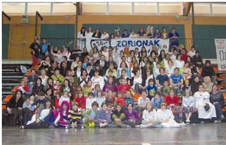
Intxortako 20. urtemugan ateratako familia argazkia.

dira, plazan; 13:30ean poteoa egingo dute; eta 14:30ean argazkia aterako dute bazkalaurrean. 19:00etan erromeriari ekingo diote, eta musikagaz amaituko dute eguna. Hurrengo asteetan ere ekitaldiekin jarraituko dute.