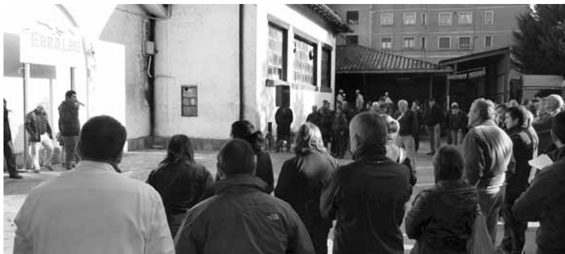
Mailegua hiltegia egiteko lurrak erosteko eta proiektua diseinatzeko eskatu zuten udalak; bakoitzak zati bat bueltatu behar du.

Erraldeko gastuak zirela-eta, udalak 334.000 euro bueltatu behar zizkien bankuei