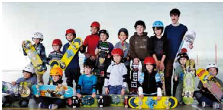
Skatelari gazteak Kurutziaga ikastolan egindako topaketan.

6 eta 8 urte arteko gaztakoak batu ziren jardunaldian