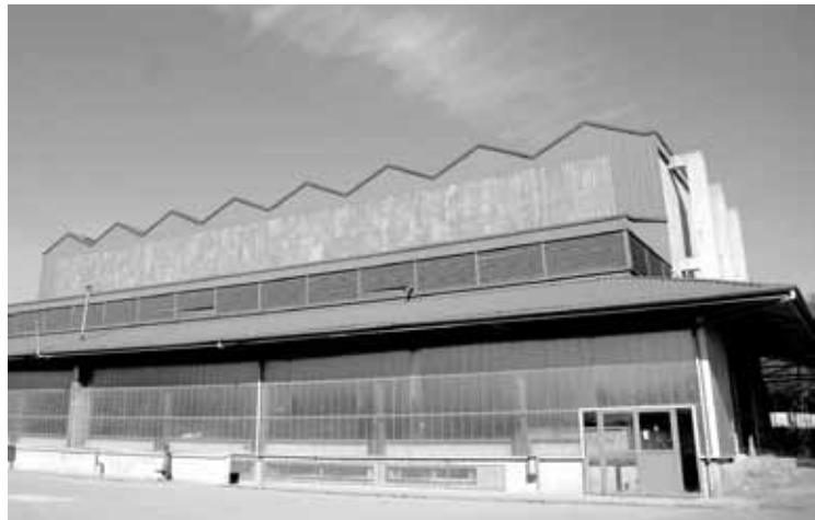
Eskolaren ondoan dago pilotaleku publikoa.

Udal arduradunen esanetan txakur kaken arazoa aspaldikoa da, eta herri osoko gune berdeetan gertatzen da. Iaz Otxandioko txakurren jabe guztiei gutun bat bidali zitzaizen betebeharrak gogoratzeko, eta hainbat kanpaina ere bultzatu izan dira, baina ez dute esperotako emaitzarik jaso.