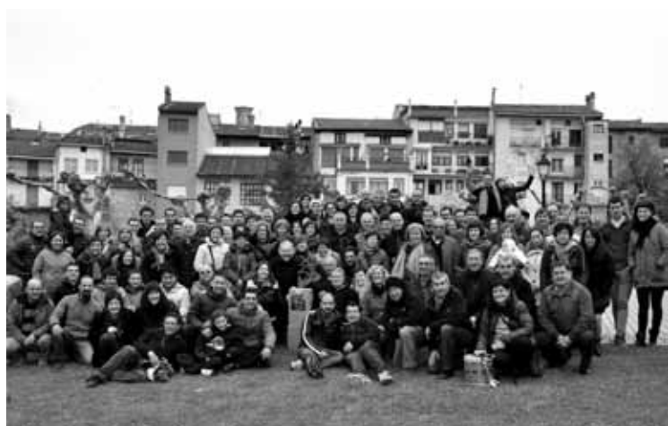
Lantziegoko eta Garaiko herritarrek familia argazkian.

Lantziegora joan ziren senidetza ospatzera