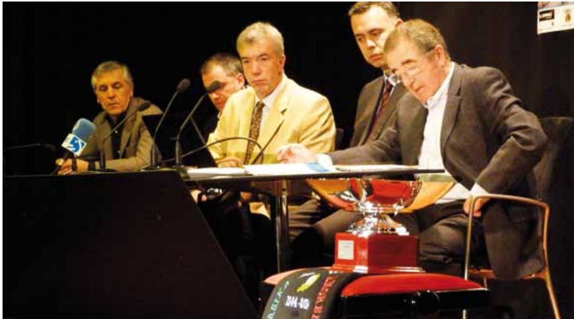
Babesleak, udal orkezkariak eta antolatzaileak, atzo, Zelaieta zentroko auditoriumean egindako aurkezpenean.

Apirilaren 13an da lasterketa; obren ondorioz aurten ez dute Autzagane igoko; Movistar taldea eta Alejandro Valverde dira irabazteko hautagai nagusiak