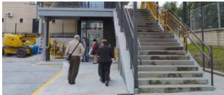
Goian, herritarrak arrapala eskatzen; behean, tren geltokiko azpiegiturak.

denetako ordezkari, bizilagun eta udal teknikarien arteko batzarra deitzeko prestutasuna erakutsi zuen. Aurretik zegoen arrapala ez zela asko erabiltzen