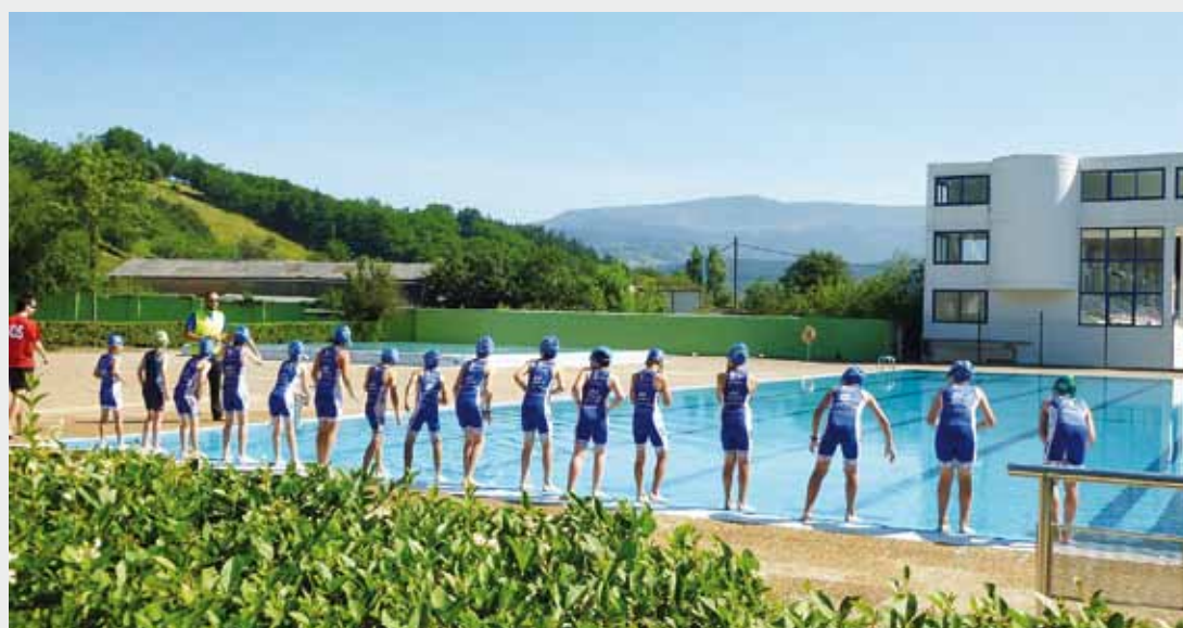
Eskolaz kanpoko jarduera lez garatzen dute triatloia umeek eta gazteek.

Gaur egun 70-80 ikasle inguru daukate Mugarrako Triatloi Eskolan