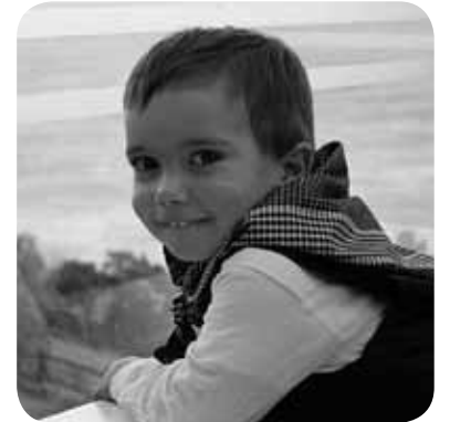
> Apirilaren 6an Iparrek 3 urte beteko ditu. Zorionak etxeko guztion partez! Izugarri maite zaittugu txikitxu!