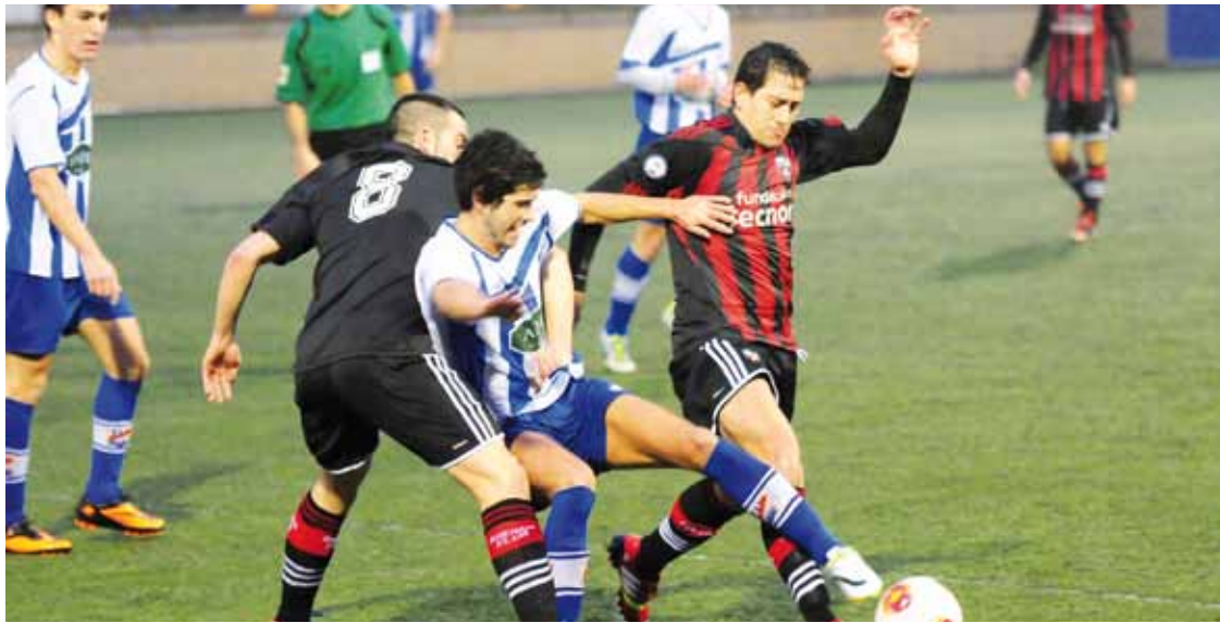
Zapatuan, Beasain hartuko du etxean Durangoko Kulturalak. Kepa Aginako.

Lehen itzuli onaren ondoren, bolada txarrean dabil Kulturala; jaitsiera postuak urrun daude, baina garaipen batek konfiantza eta lasaitasuna ekarriko lizkioke