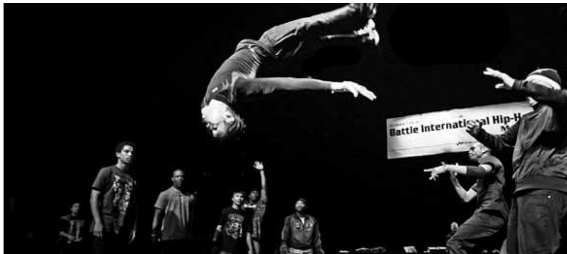
Besteak beste, Frantziako Inesteam taldea ariko da martxoaren 29an, Bilbao Arenako jaialdian.

Breakdance ikastaroa egin dute Zornotzan, Bilboko jaialdi horren bueltan