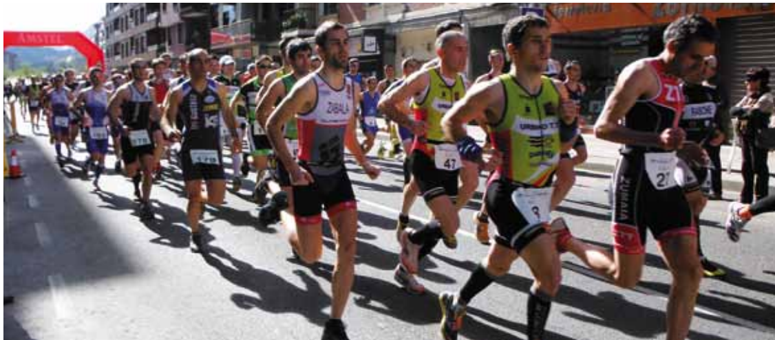
Zornotzako duatloian 250 bat parte-hartzaile batzea itxaroten dute. Extrem Zornotza.

Domekan Zornotzako duatloia lehiatuko dute; Autzaganen tunela egiteko obretan dabilenez, bizikletako tartea egokitu egin behar izan dute, eta Muniketatik birritan igaroko dira, aurten, parte-hartzaileak