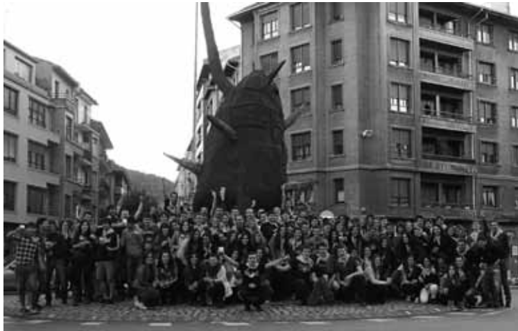
Iaz antolatu zuten lehenengoz Gazte Eguna, Zornotzan.

Iazko lehen aldiak jasotako harrera onaren ostean, biharko berriro antolatu dute Gazte Eguna