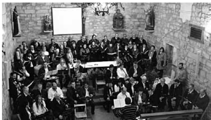
30 bat txistulari batuko dira domekan, Garain.

Domekarako sortutako koruak parte hartuko du