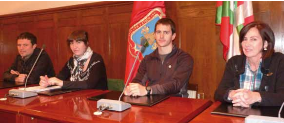
Bilduko zinegotziak, udaletxean emandako prentsaurrekoan.