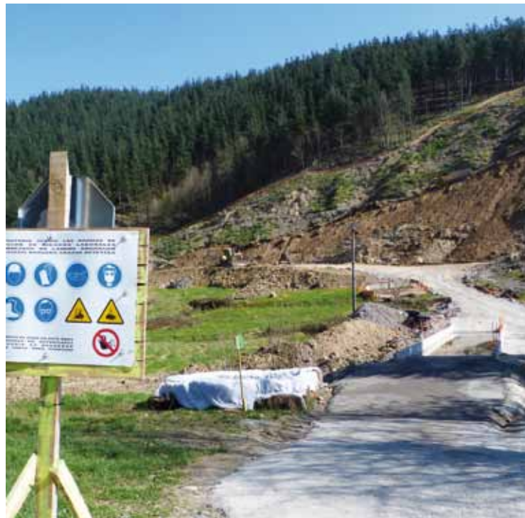
2012ko udazkenean hasi zituzten errepide berriko lanak.

Era berean, lanen ondorioz Hirumet ingurutik Katalinako bihurtunera arteko kale-argiak argi barik daude azken aste bitan. Herriko argiteriaren mantentze-lanak udalaren ardura dira, eta zer gertatzen zen azter-