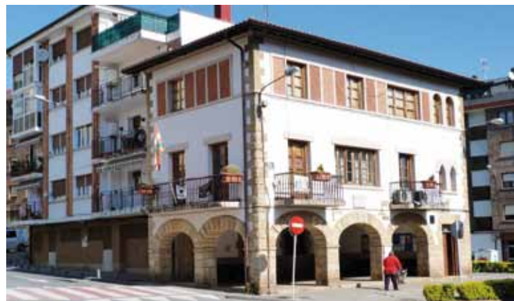
Udalak zor duen zenbatekoa, eta udalari zor diotena jakinarazi zituzten.

gobernu taldeak. 2013ko likidazioak egin ostean, gastu orokorretarako udalari geratu zaion soberakina 4.400 eurokoa dela