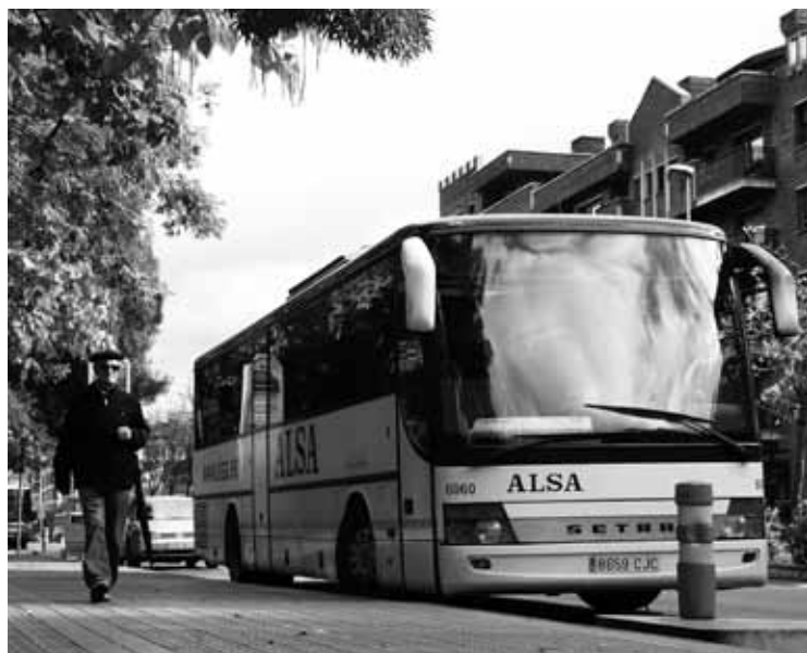
Madalengan gelditzen da Durango-Gasteiz lineako autobusa.

Durango-Gasteiz linearen alegazioak batzordean erabakiko dituzte, eta ez ibilbideko herriekin batera