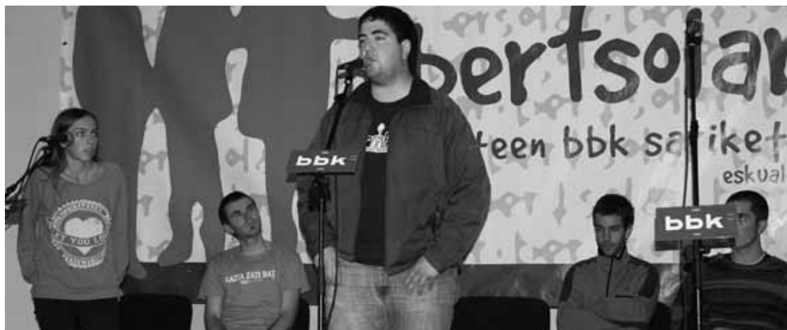
Eguaztenean, Durangoko institutuan jokatu zuten Bizkaiko Bertsolari Gazteen BBK Sariketaren finalaurrekoa.

Eguazteneko Durangoko saioa irabazita, beraz, Lea-Artibaik izango da martxoaren 28ko Bilboko Kafe Antzokiko finalean ariko den taldeetako bat. Datoren martitzenean, martxoaren 25ean jokatuko duten bigarren finalaurrekoko irabazlea, Arratia edo Busturialdea, lehiatuko da Lea-Artibaigaz finalean. Finaletik kanpo geratu da azken urteetan sariketa irabazi izan duen Durangaldea.